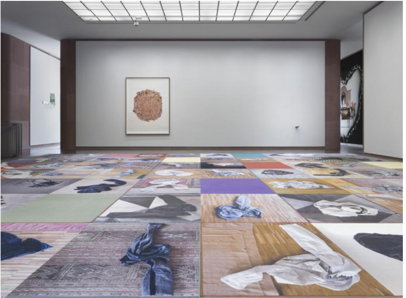
Monica Bonvicini, Lover's Material Installation view at Kunsthalle Bielefeld, Bielefeld, 2021

Sebbene la riflessione sul ruolo dell'architettura e i condizionamenti culturali relativi a essa siano da sempre temi fondamentali del lavoro di Bonvicini, nella mostra alla Kunsthalle Bielefeld l'artista fa riferimento all'architetto Johnson per concentrarsi sul concetto di relazione oggettivante, traslandolo dal rapporto privato tra due individui ad altri possibili rapporti di dipendenza, ad esempio, economici, sociali, politici. Si chiede altresì come può essere definita la relazione dell'artista stesso con lo spazio espositivo, con le sue opere d'arte, con i suoi visitatori. Per farlo, lavora direttamente sul luogo architettonico, mettendolo in discussione: