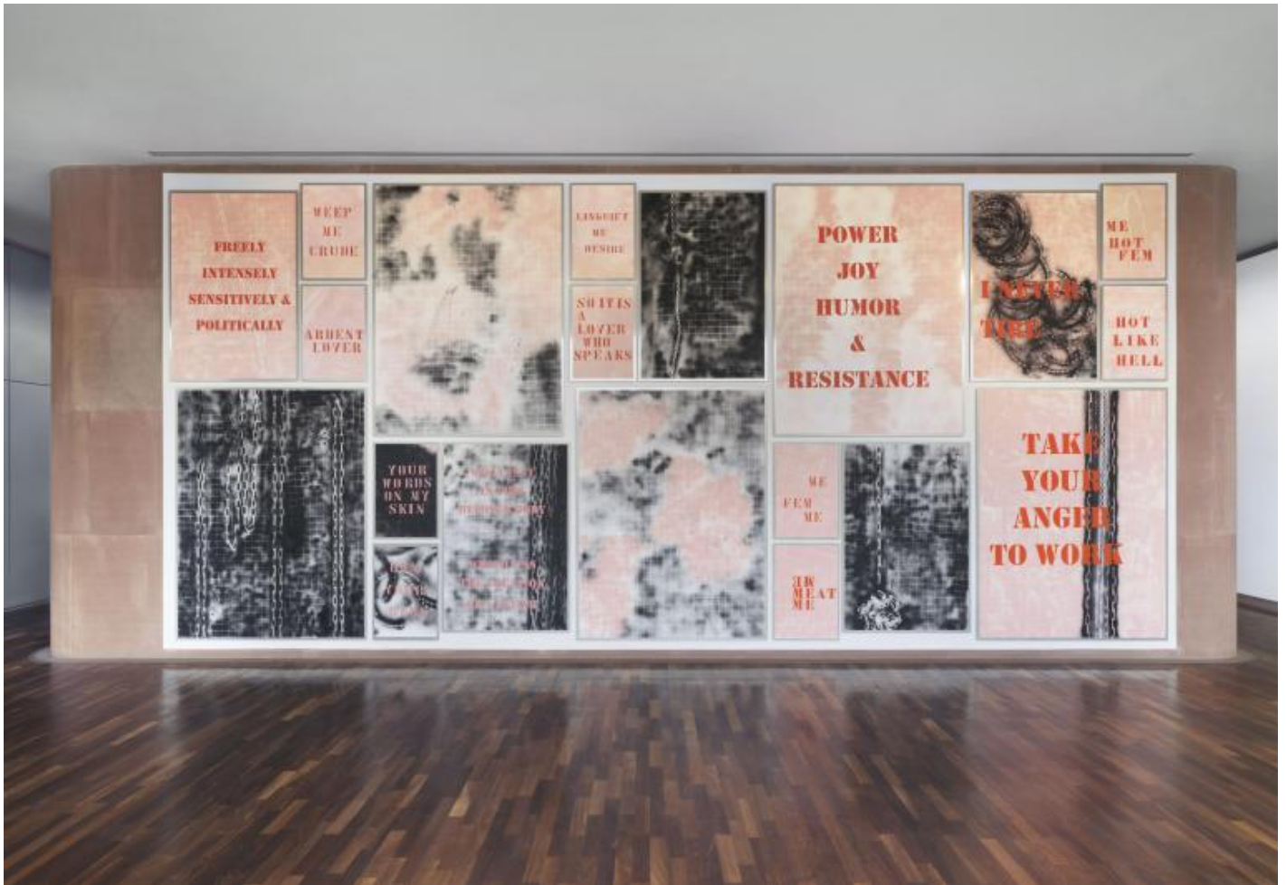
Monica Bonvicini, Lover's Material Installation view at Kunsthalle Bielefeld, Bielefeld, 2021 Photo: Jens Ziehe; © Monica Bonvicini and VG Bild-Kunst

contraddittorio del loro lavoro, molto diverso anche dal loro stile di vita degli anni Sessanta e Settanta”.