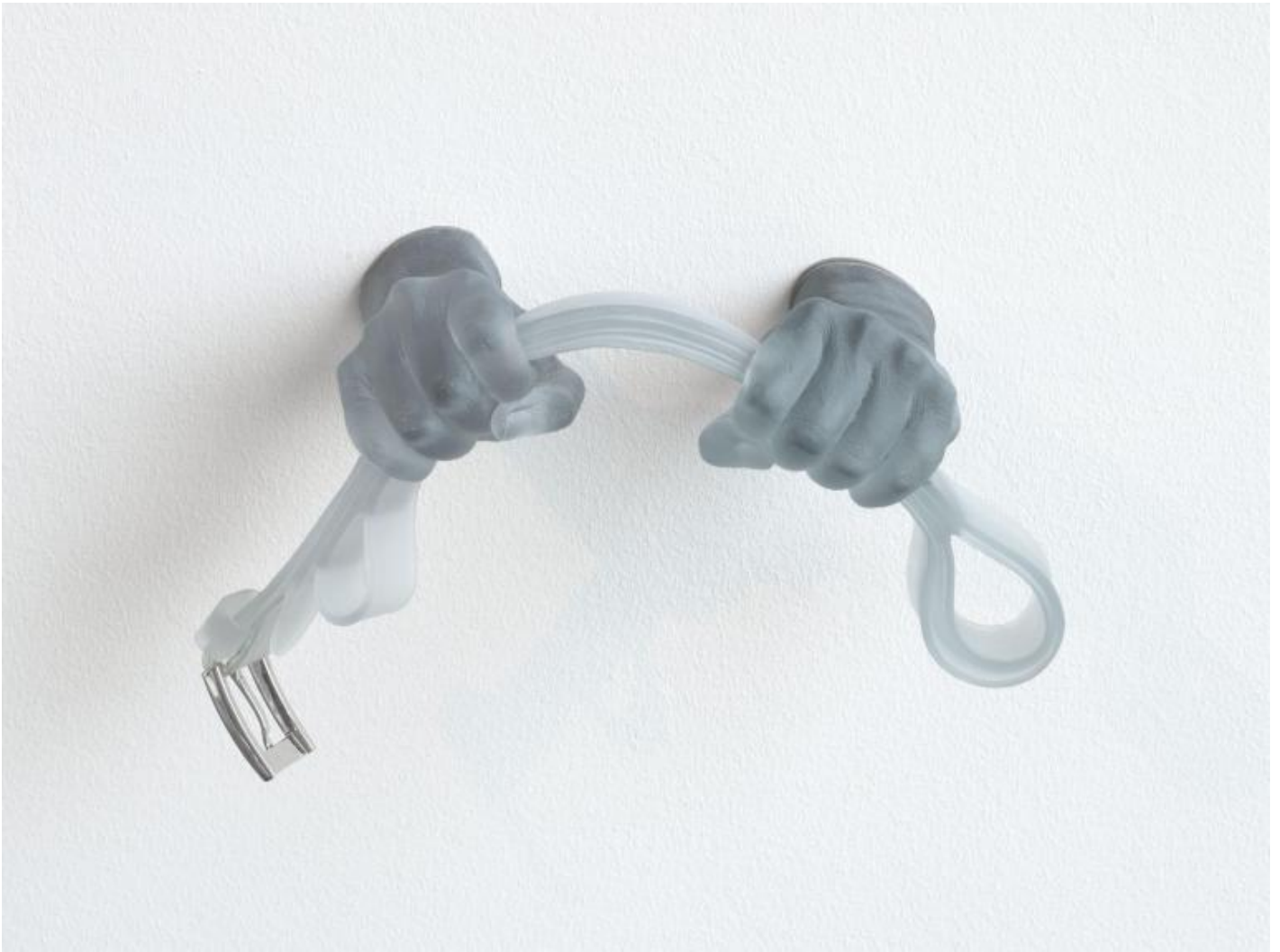
Monica Bonvicini, Lover's Material Installation view at Kunsthalle Bielefeld, Bielefeld, 2021 Photo: Jens Ziehe; © Monica Bonvicini and VG Bild-Kunst

Ricordare She Lies e altre opere precedenti di Bonvicini, significa sottolineare la grande coerenza nella sua ricerca. Dalla sua prima mostra personale al California Institute of the Arts nel 1991 fino all'attuale mostra a Bielefeld, infatti, Bonvicini ha indagato il rapporto tra architettura, spazio pubblico e privato, coercizione e libertà, potere e controllo, nonché relazioni di genere, includendo numerosi riferimenti storici, politici, culturali, artistici e instaurando una relazione critica con i luoghi espositivi, i materiali utilizzati e con lo spettatore capace di mettere in discussione il significato stesso del fare arte, l'ambiguità del suo linguaggio.