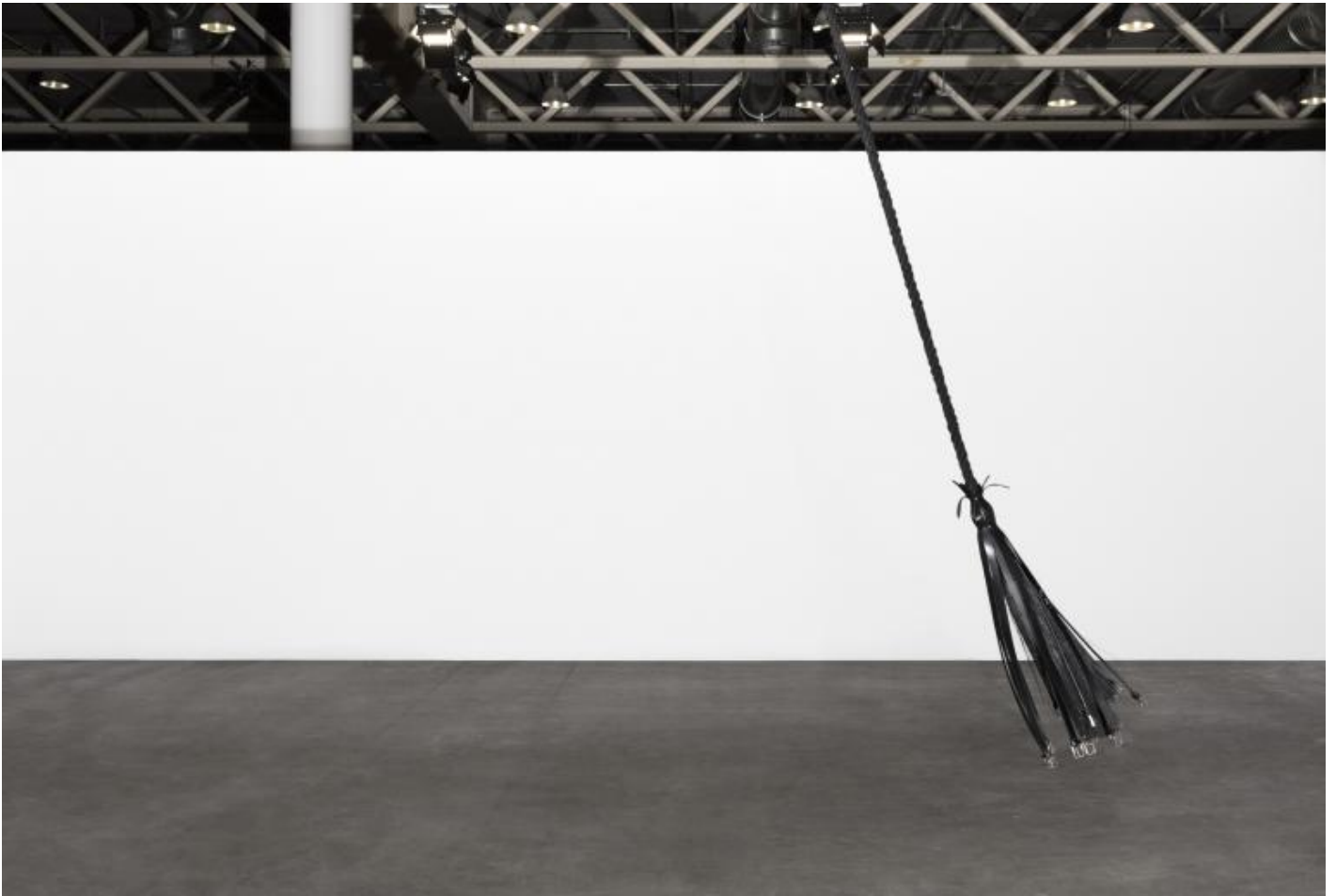
Monica Bonvicini, Breathing, 2017 Steel structure, compressed air cylinder, compressor, rope, synthetic fiber, leather belts dimensions variable

In realtà, sebbene includa sovente l'idea di decostruzione e distruzione, il suo lavoro non è nemmeno definibile aggressivo, come a volte è stato erroneamente descritto: