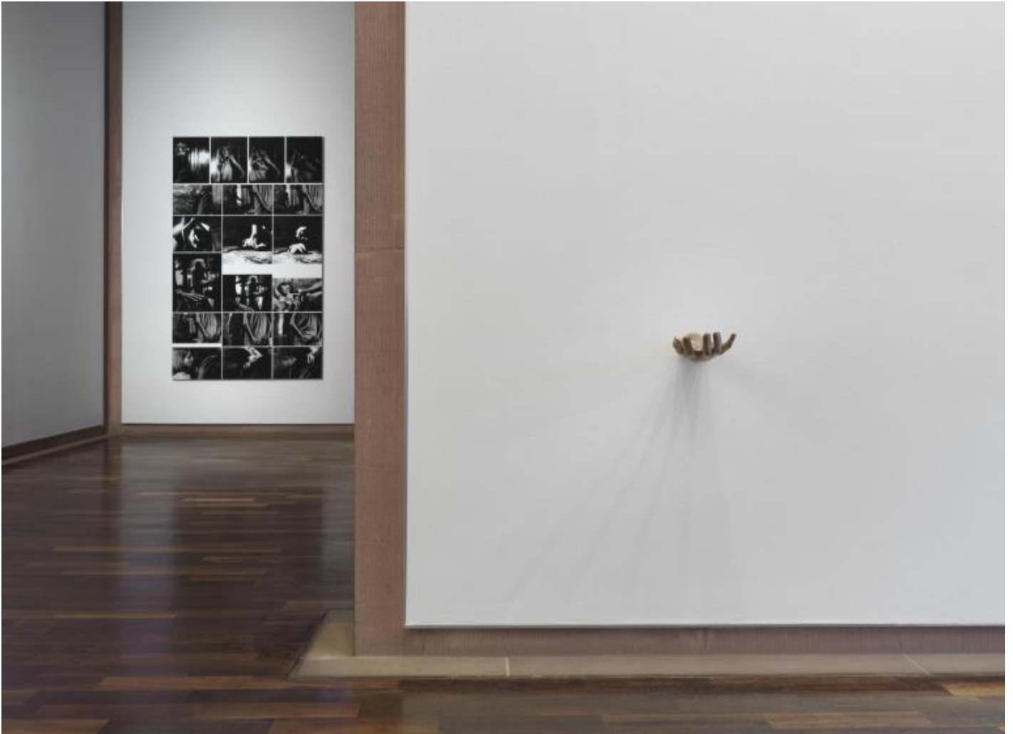
Monica Bonvicini, Lover's Material Installation view at Kunsthalle Bielefeld, Bielefeld, 2021

culturale sia da una volontaria scelta di riappropriazione di ciò che ci precede per avere la possibilità di mutarlo, di ricrearlo dopo averlo distrutto, di riattualizzarlo.