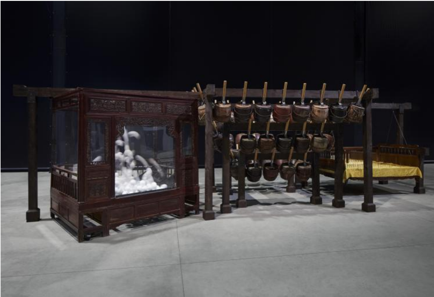
Chen Zhen Nightly Imprecations, 1999 Installation view, Pirelli HangarBicocca, Milan, 2020 Private collection, Courtesy Blondeau & Cie, Geneva © Chen Zhen by ADAGP, Paris Courtesy Pirelli HangarBicocca, Milan Photo: Agostino Osio.

L'opera di entrambi muove il pensiero, emoziona, perturba, induce a chiedersi chi siamo nel mondo. E lo fa proponendo una modalità che, ancora una volta, ha a che vedere con lo spazio e con il tempo: ambedue gli artisti stratificano, incrostano, sovrappongono, macerano, giustappongono sostanze stridenti (il vetro e il ferro, il cemento e la carta). Il riciclaggio cui sottopongono materiali e oggetti dismessi è un preciso gesto politico: muta la storia delle cose e le converte in Storia, ovvero in un fatto dolorosamente collettivo.