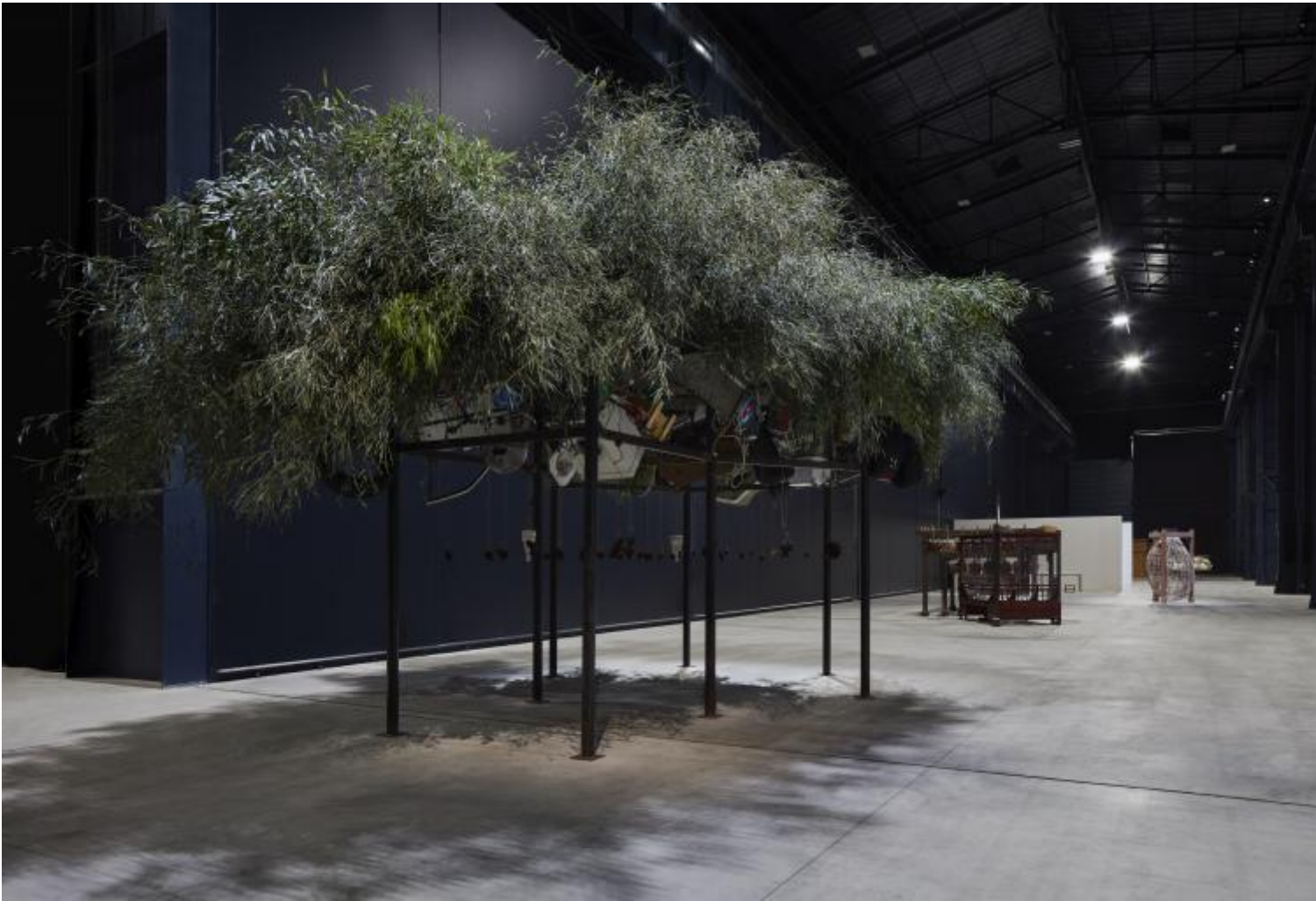
Chen Zhen Fu Dao / Fu Dao, Upside-down Buddha / Arrival At Good Fortune, 1997 Installation view, Pirelli HangarBicocca, Milan, 2020 © Chen Zhen by ADAGP, Paris

Chen Zhen mi pare racconti questo, e mi pare che raccontare la ferita del mondo, attraverso gli occhi di un rapporto mutato con esso – dato dalla sua storia singolare –, sia, infine, l'unico modo di cantarlo, il mondo. Ecco perché dico gratitudine. Una forma del rilanciare: dopo di me, come prima di me, in questo mutare di forme e scenari di guerra e rinascite. Divago, ma io credo che questa sia la ragione per cui le scuole dovrebbero frequentare gli spazi dell'arte. Quei soldatini di plastica, la miriade di macchinine giocattolo che ricoprono il rottame di automobile ( Perseverance of Regeneration , 1999): soltanto nella prossimità incendiata si avverte il proliferare di insetti sulla pelle. Insetti del consumo, della distruzione. Se non sento che camminano proprio su di me, come avverto la ferita? Sono stata poco davanti ai bambù con i Buddha rovesciati e le televisioni e i circuiti elettronici e la bicicletta appesi ( Fu Dao / Fu Dao, Upside-down Buddha / Arrival at Good Fortune , 1997). Mi sono raccontata che sono alta e non potevo camminarci sotto, ma la verità è che in quel rovesciato c'era qualcosa, per me, nel mio corpo fisico, di faticoso: sotto-sopra.