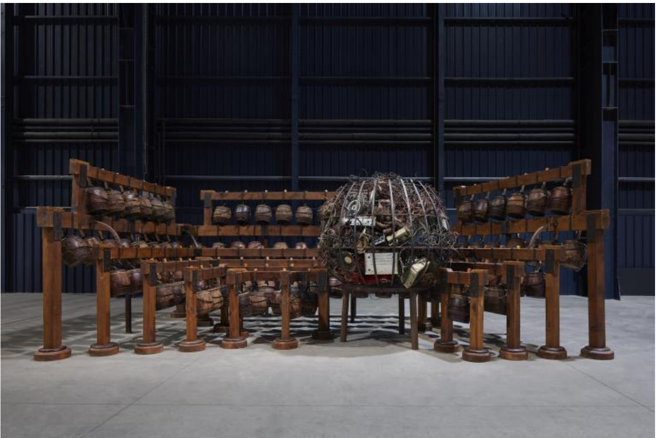
Chen Zhen Daily Incantations, 1996 Installation view, Pirelli HangarBicocca, Milan, 2020 Private collection, Courtesy de Sarthe Gallery, Hong Kong © Chen Zhen by ADAGP, Paris Courtesy Pirelli HangarBicocca, Milan Photo: Agostino Osio.

Corrente, accidentalità, contatto, resistenza. Cose, oggetti, pensieri, le nostre vite fluiscono, non ristagnano, vengono misteriosamente a contatto e quell'accidentalità può produrre uno scontro oppure un'osmosi, una ferita o una stasi transitoria, una piccola pace. Tu parli dell'acqua, del ritmo implacabile con cui Chen Zhen la costringe ad annegare i referti di una quotidianità in via di estinzione, e ti domandi se sia acqua che sommerge o salva. E se non facesse né l'una né l'altra cosa, ma creasse semplicemente un ambiente acustico che scardina le coordinate spaziali – sotto e sopra, dentro e fuori – e disallinea passato e presente? Sì, quel grande cubo di cemento colmo di letti disattivati e del suono stillante dell'acqua (come non pensare ai film più liquidi di Andrej Tarkovskij?) si è convertito in pura, numinosa atmosfera. Mi sono messa ad ascoltarla e assorbirla. Gli occhi mi erano meno utili della pelle o del naso. Si trattava di respirare e ricordare, forse rivivere.