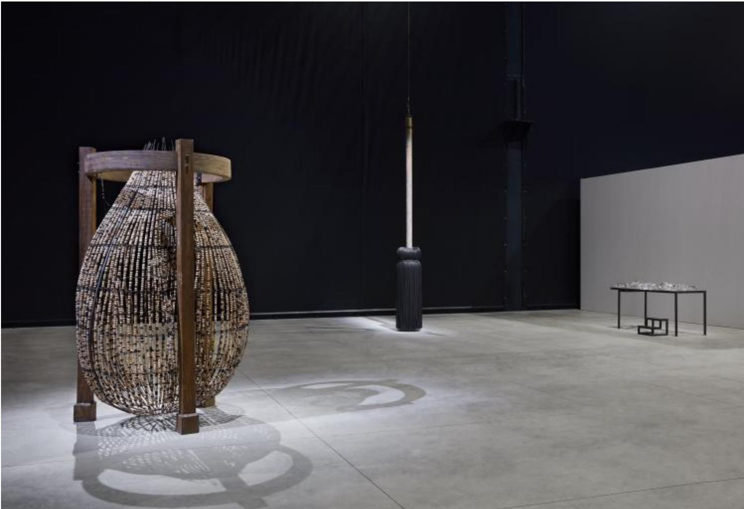
Chen Zhen Veduta della mostra, "Short-circuits", Pirelli HangarBicocca, Milano, 2020 © Chen Zhen by ADAGP, Parigi Courtesy Pirelli HangarBicocca, Milano Foto: Agostino Osio.

davvero una vittoria ultima sulla legge di necessità.