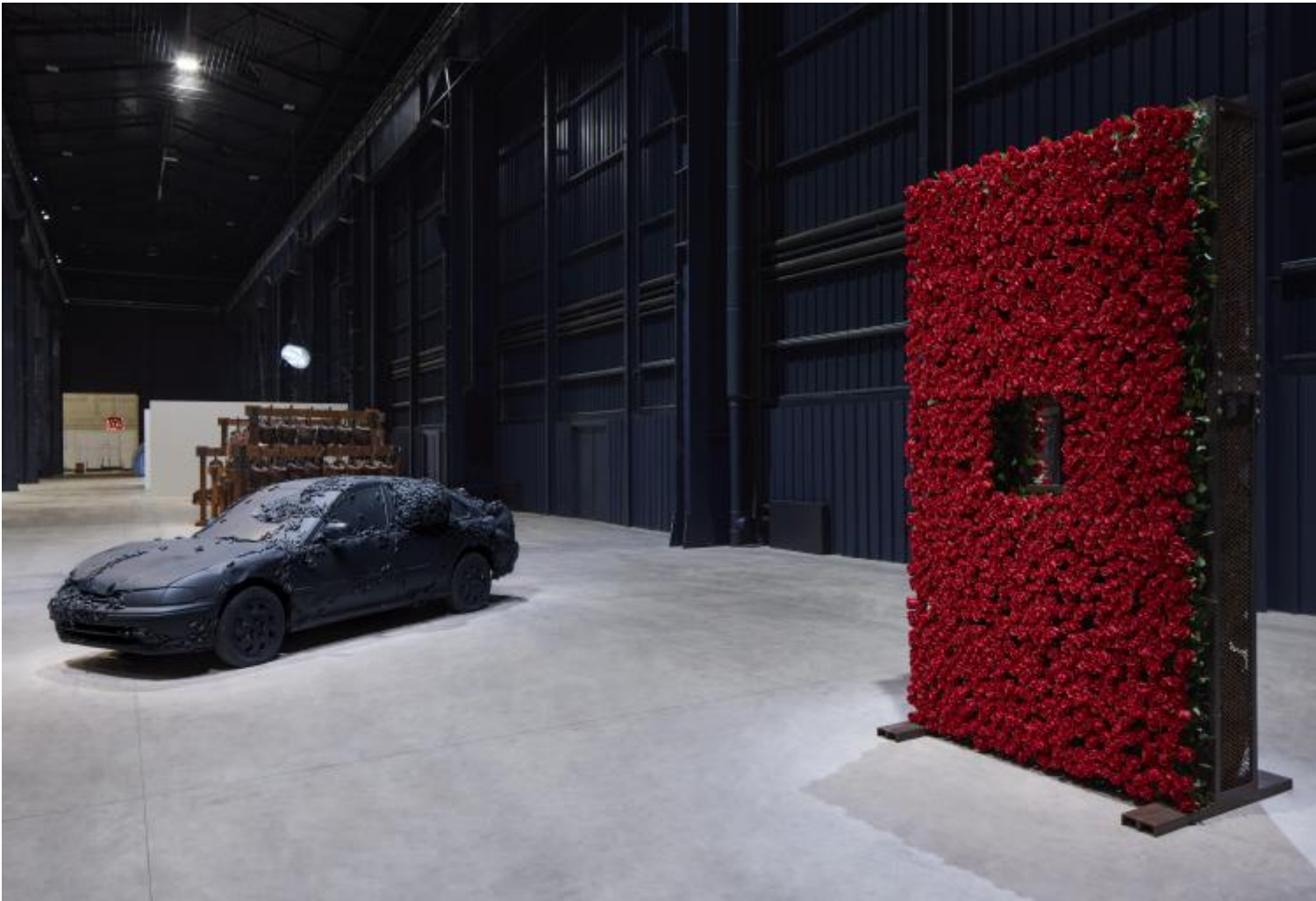
Chen Zhen Veduta della mostra, "Short-circuits", Pirelli HangarBicocca, Milano, 2020 © Chen Zhen by ADAGP, Parigi