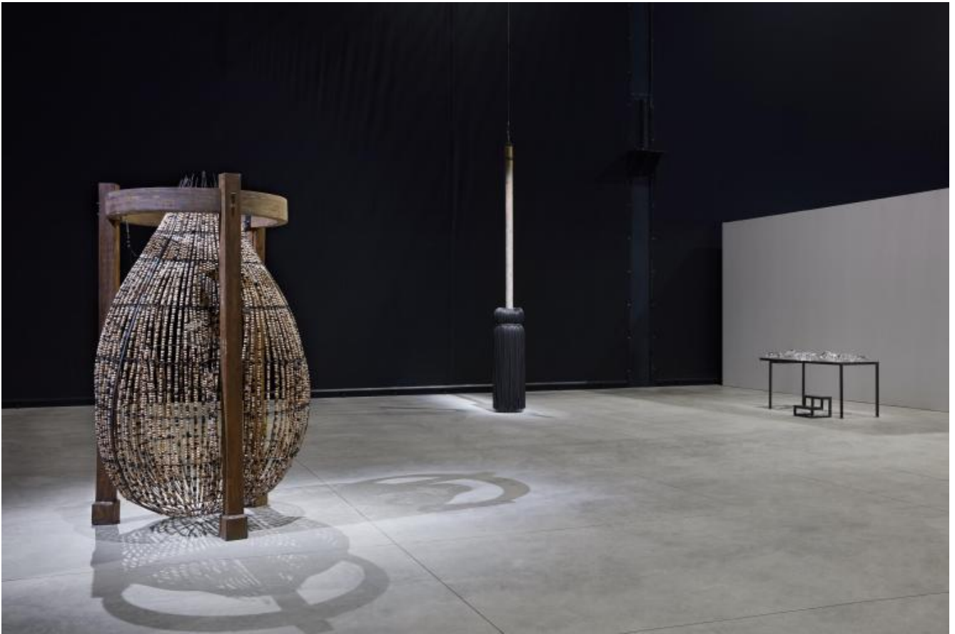
Chen Zhen Veduta della mostra, "Short-circuits", Pirelli HangarBicocca, Milano, 2020 © Chen Zhen by ADAGP, Parigi

M.N. - Abbracciare il proprio corpo, sì, farsi sé e altro da sé, mettere in scacco il principio solipsistico dell'uno scompaginando la gabbia del due.