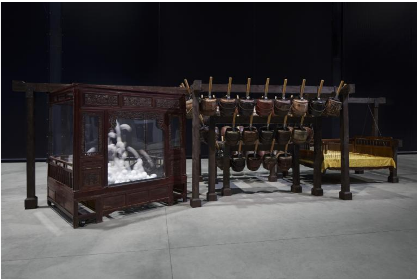
Chen Zhen Nightly Imprecations, 1999 Installation view, Pirelli HangarBicocca, Milan, 2020 Private collection, Courtesy Blondeau & Cie, Geneva © Chen Zhen by ADAGP, Paris Courtesy Pirelli HangarBicocca, Milan Photo: Agostino Osio.

Varcando il nero sipario che dall'esposizione di Chen Zhen immette nell'immenso rettangolo - ahimè oggi eccessivamente safe - occupato dall'opera di Kiefer, ho provato un senso di familiarità. E il noto rassicura. Eppure tra l'"arte/medicina" di Chen Zhen e gli scomposti bunker verticali di Kiefer c'è un'evidente continuità, una sorta di sorellanza.