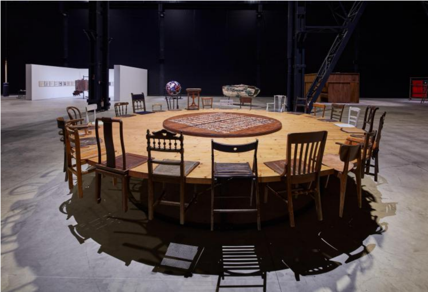
Chen Zhen Exhibition view, "Short-circuits", Pirelli HangarBicocca, Milan, 2020 © Chen Zhen by ADAGP, Paris Courtesy Pirelli HangarBicocca, Milan Photo: Agostino Osio.

quotidiano, materiali di scarto. Ne nascono opere aderenti all'esistente, quasi una sua replica, che tuttavia non descrivono, anzi sembrano contestare il visibile.