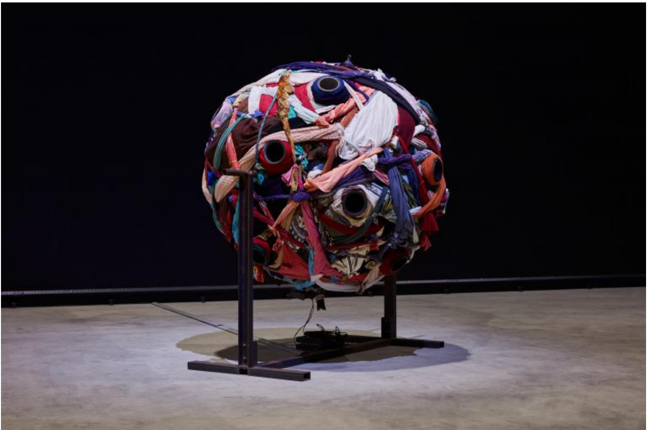
Chen Zhen The Voice of Migrators, 1995 Installation view, Pirelli HangarBicocca, Milan, 2020 PINAULT COLLECTION © Chen Zhen by ADAGP, Paris

The voice of migrators , l'acustica, variopinta sfera di cenci ideata da Chen Zhen nel 1995, o il suo Six Roots Enfance / Garçon - Childhood / Boy del 2000, una barca di legno capovolta brulicante di soldatini di plastica allo sbando come formiche davanti al fuoco, non sono forse, in miniatura, un'inconsapevole replica degli scenari di guerra evocati da Kiefer e dell'imperturbata resilienza della natura? I ripari crollano, le imbarcazioni affondano, gli indumenti si trasformano in stracci, il corpo muore, eppure nulla finisce e l'impensato si fa strada nelle tenebre.