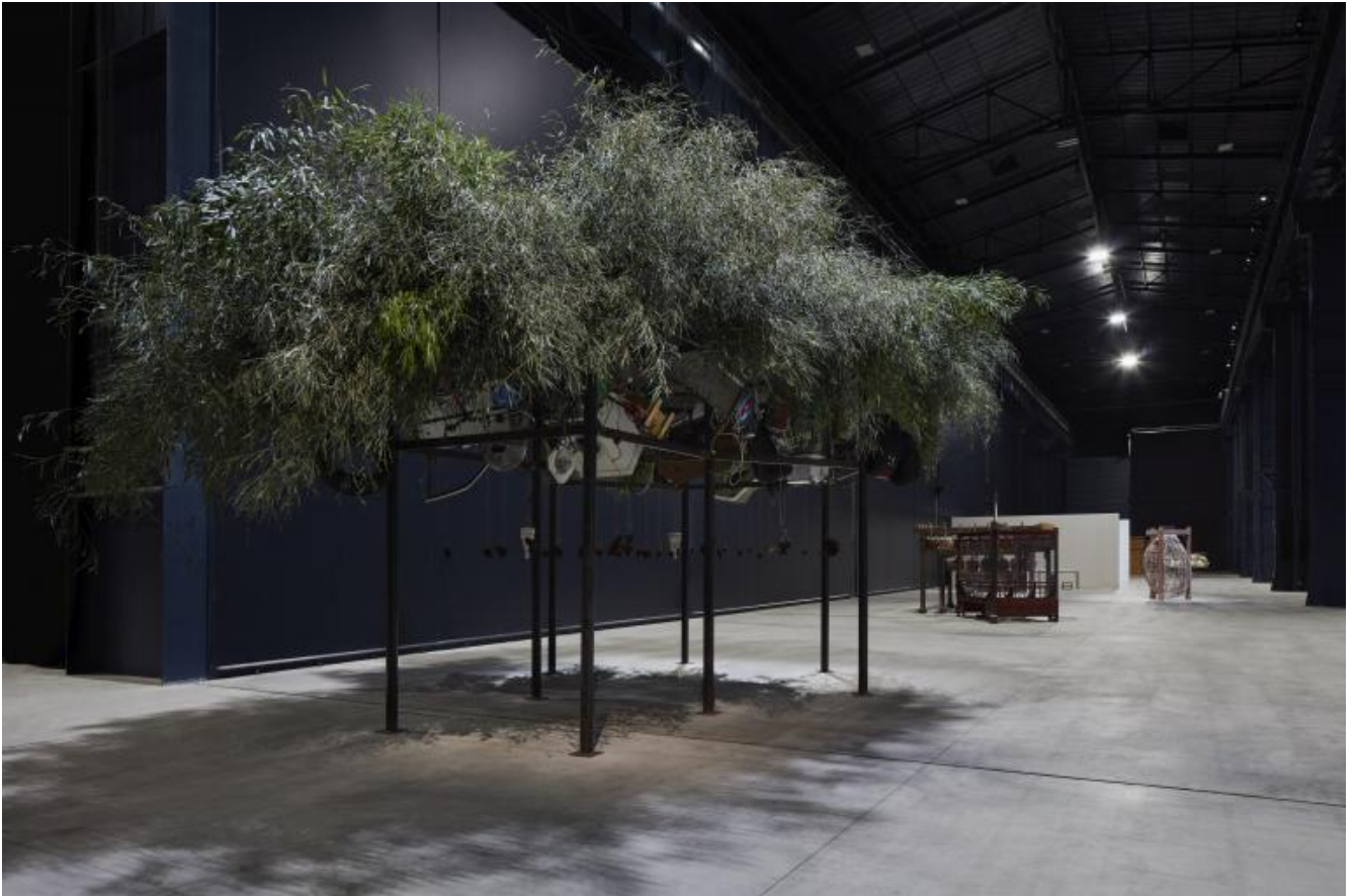
Chen Zhen Fu Dao / Fu Dao, Upside-down Buddha / Arrival At Good Fortune, 1997 Installation view, Pirelli HangarBicocca, Milan, 2020 © Chen Zhen by ADAGP, Paris

che è anche sempre nuova possibilità di dialogo. Non c'è altra via che la ferita del mondo, il taglio.