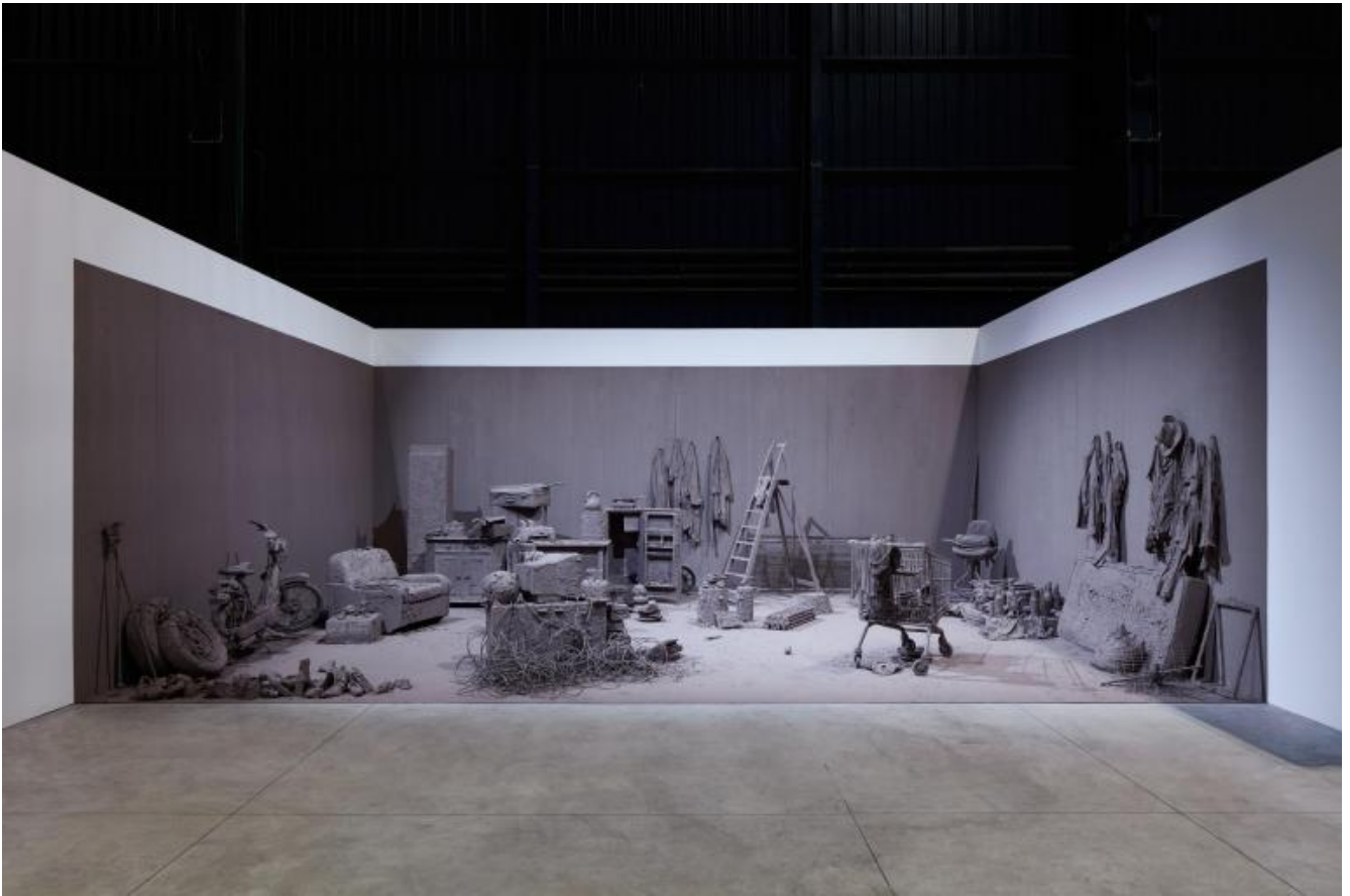
Chen Zhen Purification Room, 2000 Installation view, Pirelli HangarBicocca, Milan, 2020 © Chen Zhen by ADAGP, Paris

A.S. - In questo che dici, credo, trovo la ragione dell'attualità di questa mostra. La Purification Room , cui mi rimandi, mi pare principio di risignificazione e di trasformazione. Mi sono sentita immobile come gli oggetti, ricoperta di argilla come gli oggetti, forse anche monocroma come gli oggetti, eppure totalmente dislocata. Tutto è solido, congelato, per sempre, e, nello stesso tempo, non è lì davanti a te e, soprattutto, non è così semplice pensare che sei tu lì, davanti a quella scena. Mi ha fatto quasi male leggere, in quella paralisi di silenzio, l'anno: 2000. L'anno della morte, l'ultima opera. Quasi un testamento a suggerire, che cosa? Forse il sogno, il cerchio, il Tutto? Vedi, ci casco sempre: perdo i riferimenti e domando un nuovo orientamento. Quello che ho sentito, invece, mi pare di poterlo raccontare nella forma del: io, ora, dove sarò stata? Dove sarà stato questo io inedito già da sempre qui. Così credo di aver guardato anche le viscere di cristallo sul tavolo-lettino, tavolo di dissezione ( Crystal Landscape of an Inner Body (Serpent) , 2000). Sottili, fragili, si potrebbero rompere - il cuore, l'intestino - ma, insieme, trasparenti e riflettenti. Elementi minimi, parti del tutto insufficienti,