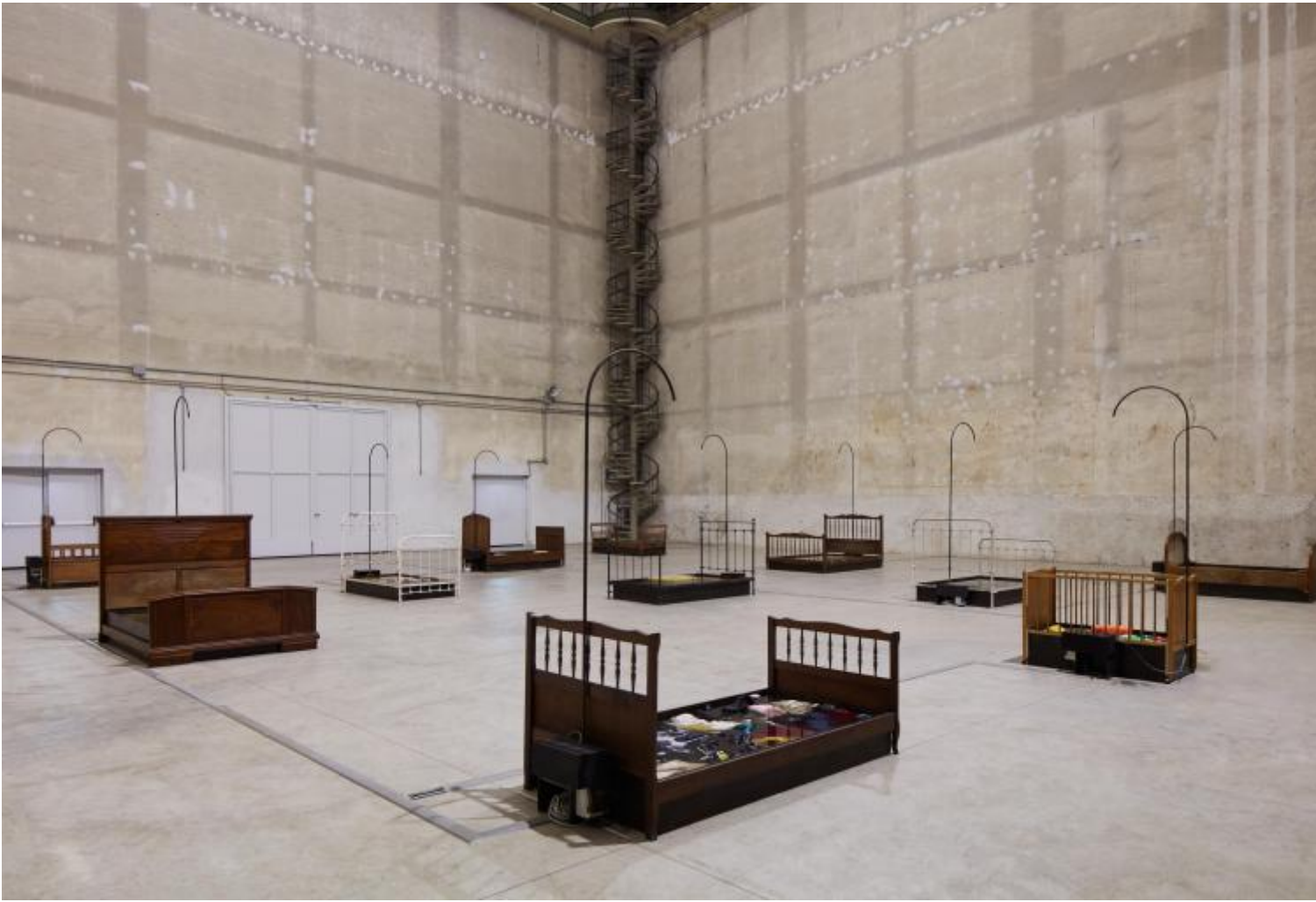
Chen Zhen Jardin-Lavoir, 2000 Veduta dell'installazione, Pirelli HangarBicocca, Milano, 2020 © Chen Zhen by ADAGP, Parigi

M.N. – Era quello che desideravo, cara Anna: un'interlocuzione, un attraversare insieme a occhi ben aperti lo spazio dell'Hangar Bicocca popolato dalle opere (vogliamo chiamarla autobiografia artistica?) di Chen Zhen, un creatore che si è misurato per oltre vent'anni della sua brevissima vita (1955, Shanghai – 2000, Parigi) con l'annuncio della propria morte.