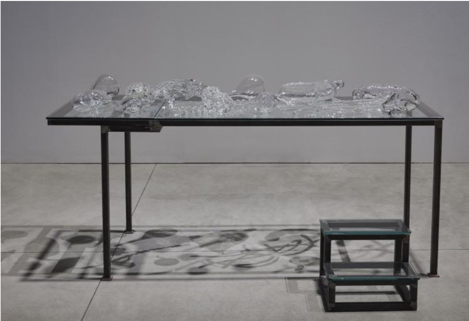
Chen Zhen Crystal Landscape of Inner Body (Serpent), 2000 Installation view, Pirelli HangarBicocca, Milan, 2020 © Chen Zhen by ADAGP, Paris, Courtesy Pirelli HangarBicocca, Milan, and GALLERIA CONTINUA Photo: Agostino Osio.

M.N. – “Quello che mi interessa è la trasformazione, non il monumento. Non costruisco rovine, ma sento che le rovine sono momenti in cui le cose si mostrano. Una rovina non è una catastrofe. È il momento in cui le cose possono ricominciare.” A dirlo è Anselm Kiefer, l’artista che ha ideato I sette palazzi celesti sotto i quali ti piace sostare. Oggi, per uno di quei casi nient’affatto casuali che si danno nell’arte, le sue vacillanti torri postatomiche occupano lo spazio che va attraversato per uscire dalla mostra di Chen Zhen. Bisogna passare da lì per tornare alla luce e all’aperto. Trasformate in luogo di transito, segnalano la resistenza impassibile della materia, la sua muta beanza.