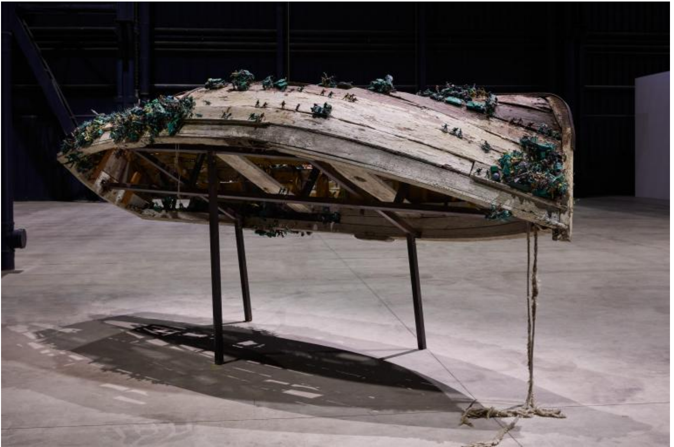
Chen Zhen Six Roots Enfance / Garçon - Childhood / Boy, 2000 Installation view, Pirelli HangarBicocca, Milan, 2020 © Chen Zhen by ADAGP, Paris

A.S. - La prima volta che ho visto Kiefer ero a Tel Aviv. Era il 2011, Breaking of the Vessels , l'inaugurazione del Museum of Art. Ascoltarti mi ha fatto sovrapporre due scene, a dieci anni di distanza, e lo ha fatto perché credo che sia stato allora - io ho poca memoria, quindi chissà se questo ricordo è davvero nato lì - che ho incontrato la parola "gratitudine". Allora non credo che si fosse delineata così, nella mia testa, ma come una percezione molto confusa e molto embrionale del rapporto sacrale con la materia, l'incontro con il mondo, con la carne, con la terra sotto la suola delle scarpe. In quel momento studiavo Perec e leggevo W o il ricordo di infanzia , dove le lettere dell'alfabeto ebraico si fanno biscotto. Quello che dici: il vetro, la colla, i semi, le lamiere, le piccole storie e "l'histoire avec sa grande Hache", l'ascia che aveva portato via la madre allo scrittore francese. Con "gratitudine", oggi, in questa nuova scena, credo di intendere il rapporto con l'ulteriore. Si passa necessariamente dai crolli, dagli stracci, dal suono continuo e confuso delle voci dei dispersi in mare. Ma anche dalla tradizione - gli oggetti del suo "mondo di prima", come lo hai chiamato -, dall'eredità, dallo sradicamento