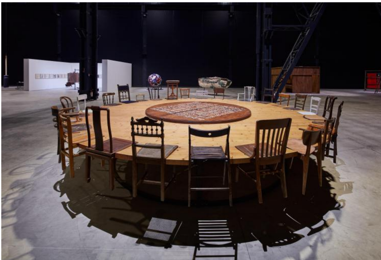
Chen Zhen Exhibition view, "Short-circuits", Pirelli HangarBicocca, Milan, 2020 © Chen Zhen by ADAGP, Paris Courtesy Pirelli HangarBicocca, Milan Photo: Agostino Osio.

quotidiano, materiali di scarto. Ne nascono opere aderenti all'esistente, quasi una sua replica, che tuttavia non descrivono, anzi sembrano contestare il visibile.