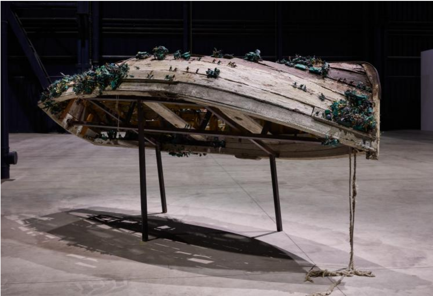
Chen Zhen Six Roots Enfance / Garçon - Childhood / Boy, 2000 Installation view, Pirelli HangarBicocca, Milan, 2020 © Chen Zhen by ADAGP, Paris

A.S. – La prima volta che ho visto Kiefer ero a Tel Aviv. Era il 2011, Breaking of the Vessels , l'inaugurazione del Museum of Art. Ascoltarti mi ha fatto sovrapporre due scene, a dieci anni di distanza, e lo ha fatto perché credo che sia stato allora – io ho poca memoria, quindi chissà se questo ricordo è davvero nato lì – che ho incontrato la parola “gratitudine”. Allora non credo che si fosse delineata così, nella mia testa, ma come una percezione molto confusa e molto embrionale del rapporto sacrale con la materia, l'incontro con il mondo, con la carne, con la terra sotto la suola delle scarpe. In quel momento studiavo Perec e leggevo Wo il ricordo di infanzia , dove le lettere dell'alfabeto ebraico si fanno biscotto. Quello che dici: il vetro, la colla, i semi, le lamiere, le piccole storie e “l'histoire avec sa grande Hache”, l'ascia che aveva portato via la madre allo scrittore francese. Con “gratitudine”, oggi, in questa nuova scena, credo di intendere il rapporto con l'ulteriore. Si passa necessariamente dai crolli, dagli stracci, dal suono continuo e confuso delle voci dei dispersi in mare. Ma anche dalla tradizione – gli oggetti del suo “mondo di prima”, come lo hai chiamato –, dall'eredità, dallo sradicamento che è anche sempre nuova possibilità di dialogo. Non c'è altra via che la ferita del mondo, il taglio.