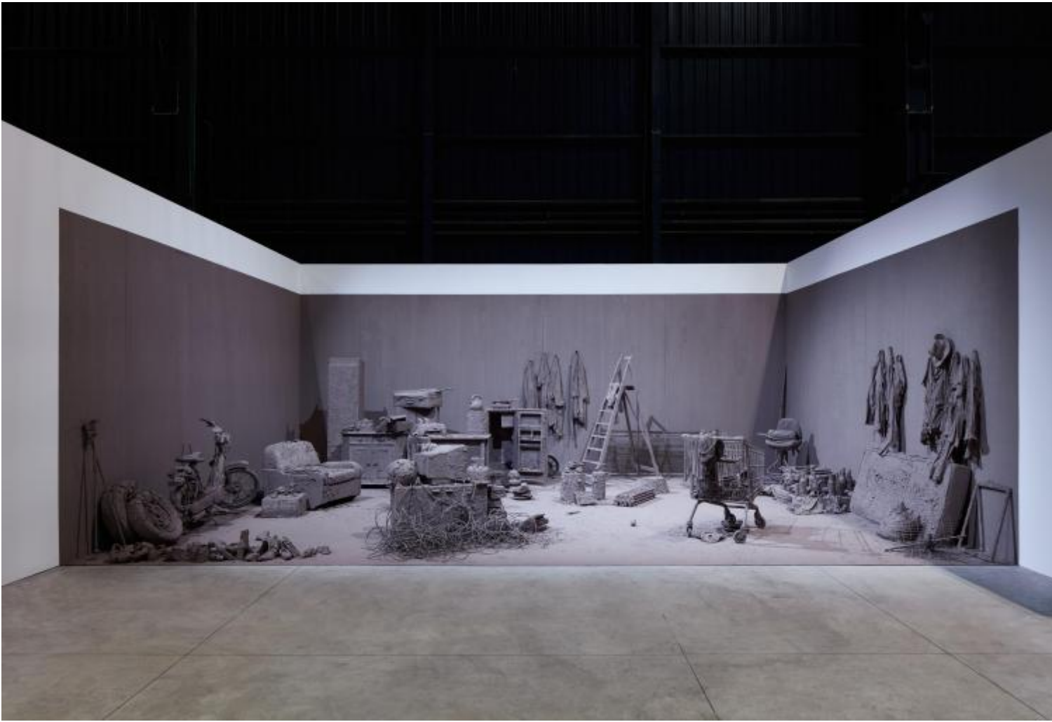
Chen Zhen Purification Room, 2000 Installation view, Pirelli HangarBicocca, Milan, 2020 © Chen Zhen by ADAGP, Paris