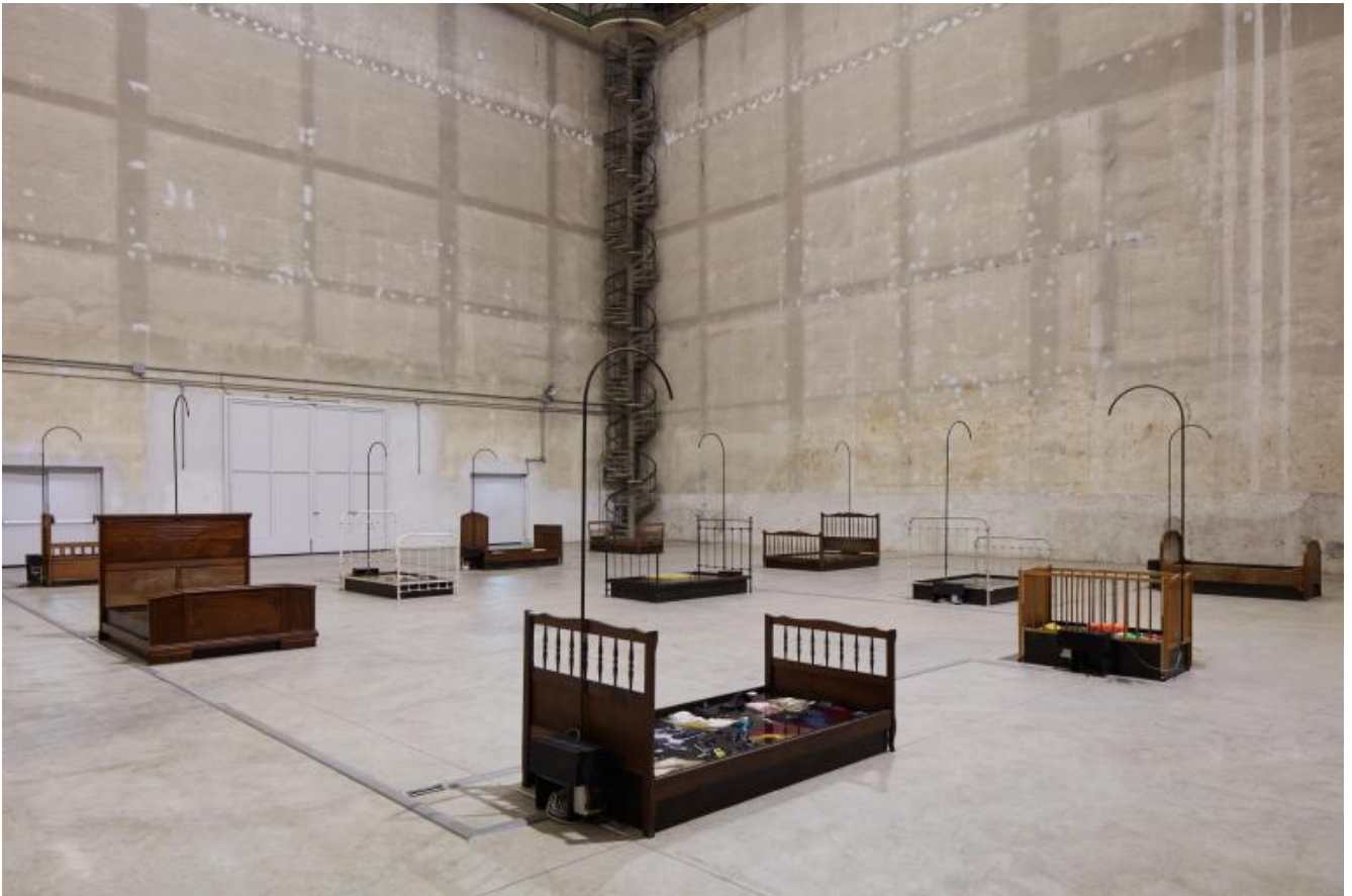
Chen Zhen Jardin-Lavoir, 2000 Veduta dell'installazione, Pirelli HangarBicocca, Milano, 2020 © Chen Zhen by ADAGP, Parigi Courtesy Pirelli HangarBicocca, Milano, e GALLERIA CONTINUA Foto: Agostino Osio.

M.N. - Era quello che desideravo, cara Anna: un'interlocuzione, un attraversare insieme a occhi ben aperti lo spazio dell'Hangar Bicocca popolato dalle opere (vogliamo chiamarla autobiografia artistica?) di Chen Zhen, un creatore che si è misurato per oltre vent'anni della sua brevissima vita (1955, Shanghai - 2000, Parigi) con l'annuncio della propria morte.