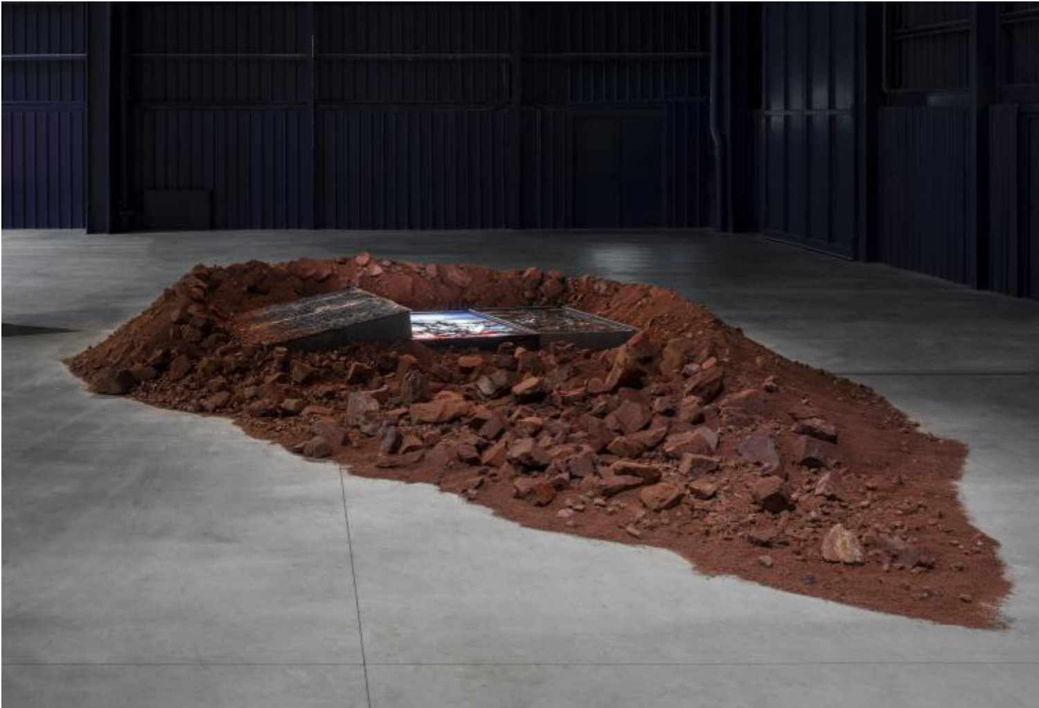
Chen Zhen Eruption Future, 1992 Installation view, Pirelli HangarBicocca, Milan, 2020 Private collection, Paris © Chen Zhen by ADAGP, Paris

Lo sfondamento della trincea binaria – nell’esperienza artistica e esistenziale di Chen Zhen, tra Cina e Parigi, c’è del resto lo spartiacque/ponte del Tibet – immette non solo in una terzietà spaziale, ma in una dimensione temporale inedita, che non può essere indagata se non soggettivamente, affidandosi a catene associative che nascono dalla memoria epigenetica e dal sogno, da quella zona dell’esperienza personale che precede l’acquisizione della parola e coincide con il sapere assoluto del corpo. Che sia per questo che tra i “materiali” usati con più evidente piacere plastico da Chen Zhen ci sono la musica, il suono, i rumori e il silenzio, l’altissimo silenzio congelato nella sua Purification Room del 2000?