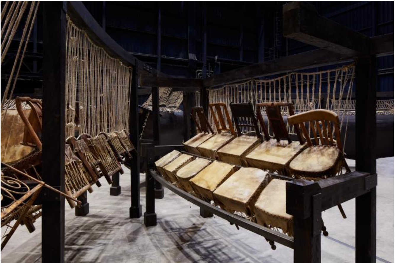
Chen Zhen Jue Chang, Dancing Body - Drumming Mind (The Last Song), 2000 (detail) Installation view, Pirelli HangarBicocca, Milan, 2020 PINAULT COLLECTION © Chen Zhen by ADAGP, Paris

La parola che mi viene in mente è “aggressione”, ma credo che dipenda dal fatto che ho letto di recente un’intervista a Susan Sontag in cui sottolinea che la parola aggressione ha, nel tempo, acquisito un senso peggiorativo. Sontag trova questo ipocrita, poiché, dice, vivere è un’aggressione: muoversi nel mondo è occupare uno spazio, calpestare, modificare equilibri. Qualcosa mi ha detto di un’invasione – le macchinine coprono l’automobile, il rumore dei calcoli la preghiera – ma, insieme, mi pare davvero, come dice Sontag, che prendere la parola “aggressione” nella sua sola connotazione negativa sarebbe semplificare troppo. Non si tratta, così mi è parso, di denunciare un dominio, ma di mostrare il confine labile, lo spazio possibile. Mi sono chiesta, per esempio, prima di leggere, se quell’acqua incessante goccia a goccia a colmare le vasche e ricoprire gli oggetti della nostra vita quotidiana – libri, giocattoli, piatti, vestiti – fosse acqua che corrode o acqua che purifica.