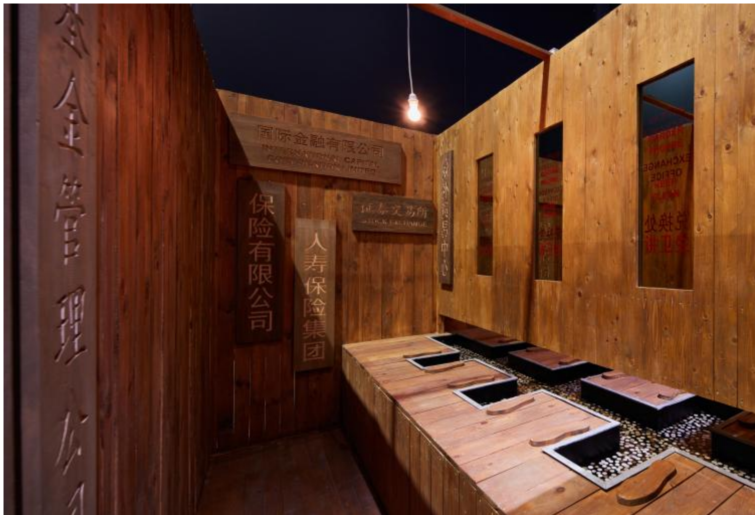
Chen Zhen Le Bureau de change, 1996-2004 Installation view, Pirelli HangarBicocca, Milan, 2020