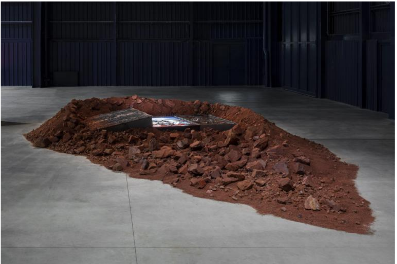
Chen Zhen Eruption Future, 1992 Installation view, Pirelli HangarBicocca, Milan, 2020 Private collection, Paris © Chen Zhen by ADAGP, Paris

Lo sfondamento della trincea binaria - nell'esperienza artistica e esistenziale di Chen Zhen, tra Cina e Parigi, c'è del resto lo spartiacque/ponte del Tibet - immette non solo in una terzietà spaziale, ma in una dimensione temporale inedita, che non può essere indagata se non soggettivamente, affidandosi a catene associative che nascono dalla memoria epigenetica e dal sogno, da quella zona dell'esperienza personale che precede l'acquisizione della parola e coincide con il sapere assoluto del corpo. Che sia per questo che tra i "materiali" usati con più evidente piacere plastico da Chen Zhen ci sono la musica, il suono, i rumori e il silenzio, l'altissimo silenzio congelato nella sua Purification Room del 2000?