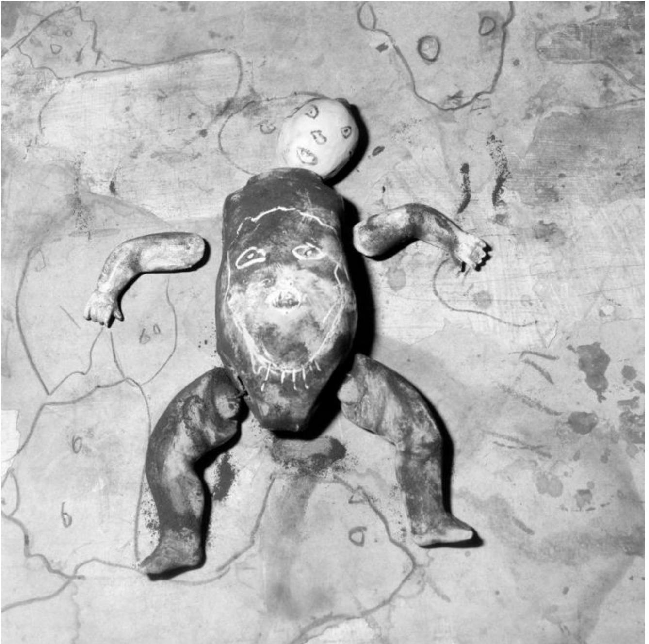
Roger Ballen, Disjointed, 2006.

Con la sua fotografia Ballen ci trasporta in un mondo nel quale vacilla ogni certezza. Lo stile è inconfondibile tanto da indurre l'autore a coniare una sorta di marchio identitario: "Ballenesque", che è anche il titolo di una monografia pubblicata da Thames and Hudson nel 2016. Il caos della vita umana viene espresso attraverso la presenza inquietante di esseri umani disorientati e frammentati, di animali che sembrano provenire da un'altra dimensione, di oggetti completamente privi della loro funzione originaria. Guardando la fotografia Driesie and Casie, Twins, Western Transvaal (1993) è impossibile non