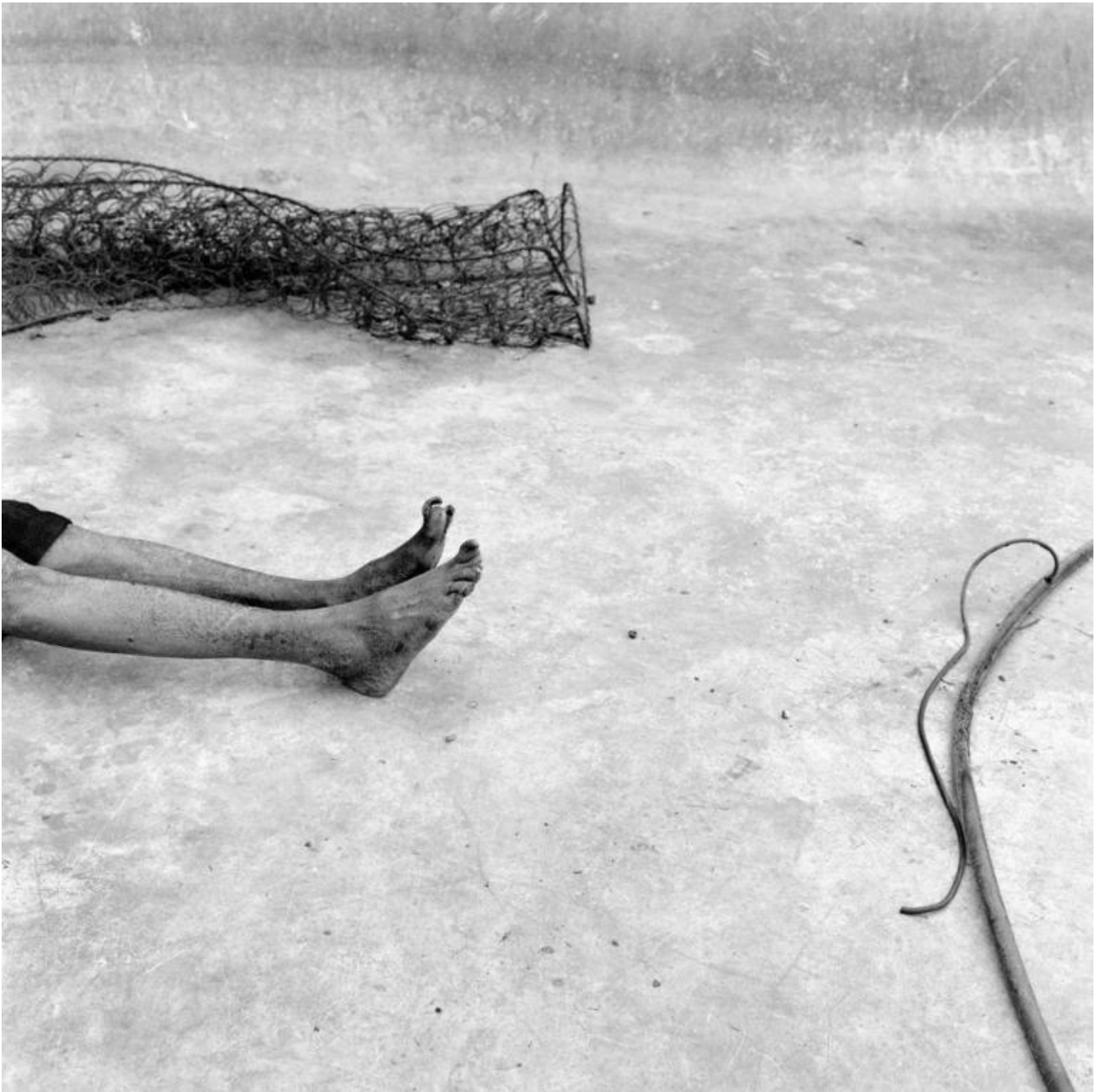
Roger Ballen, Toenail, 2001.

Le poesie di Gabriele Tinti sono il doppio testuale delle immagini. Ne ripercorrono le ossessioni, le duplicano, ne ampliano certi dettagli come nel caso di Toenail , affiancata all'immagine in cui Ballen ritrae le gambe magrissime di un uomo sdraiato a terra: