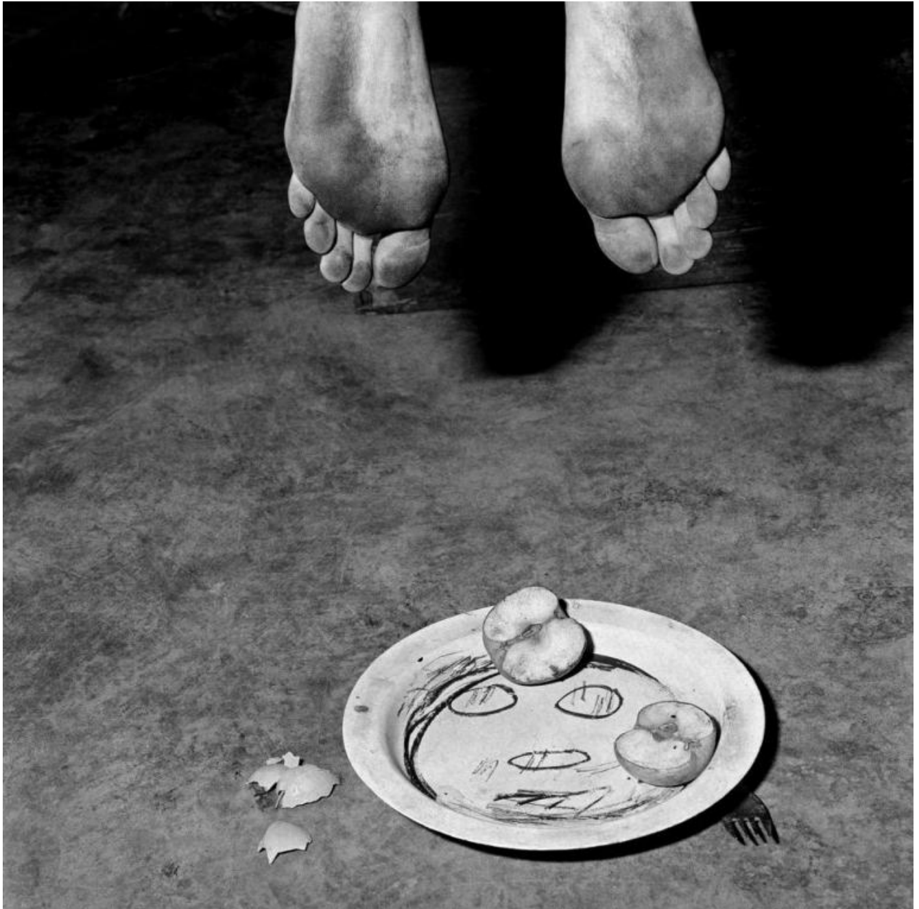
Roger Ballen, Fragments, 2005.

Soltanto una parte resta da fotografare”.