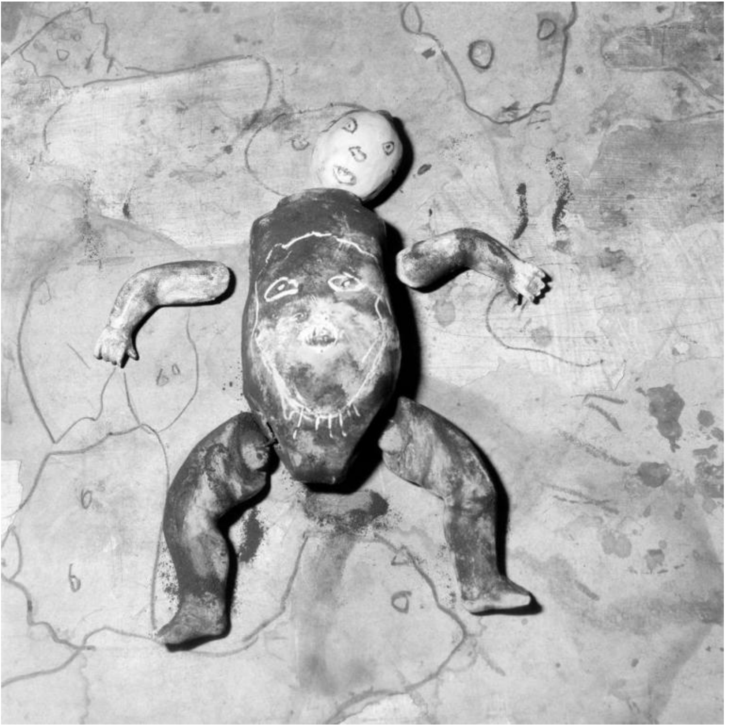
Roger Ballen, Disjointed, 2006.