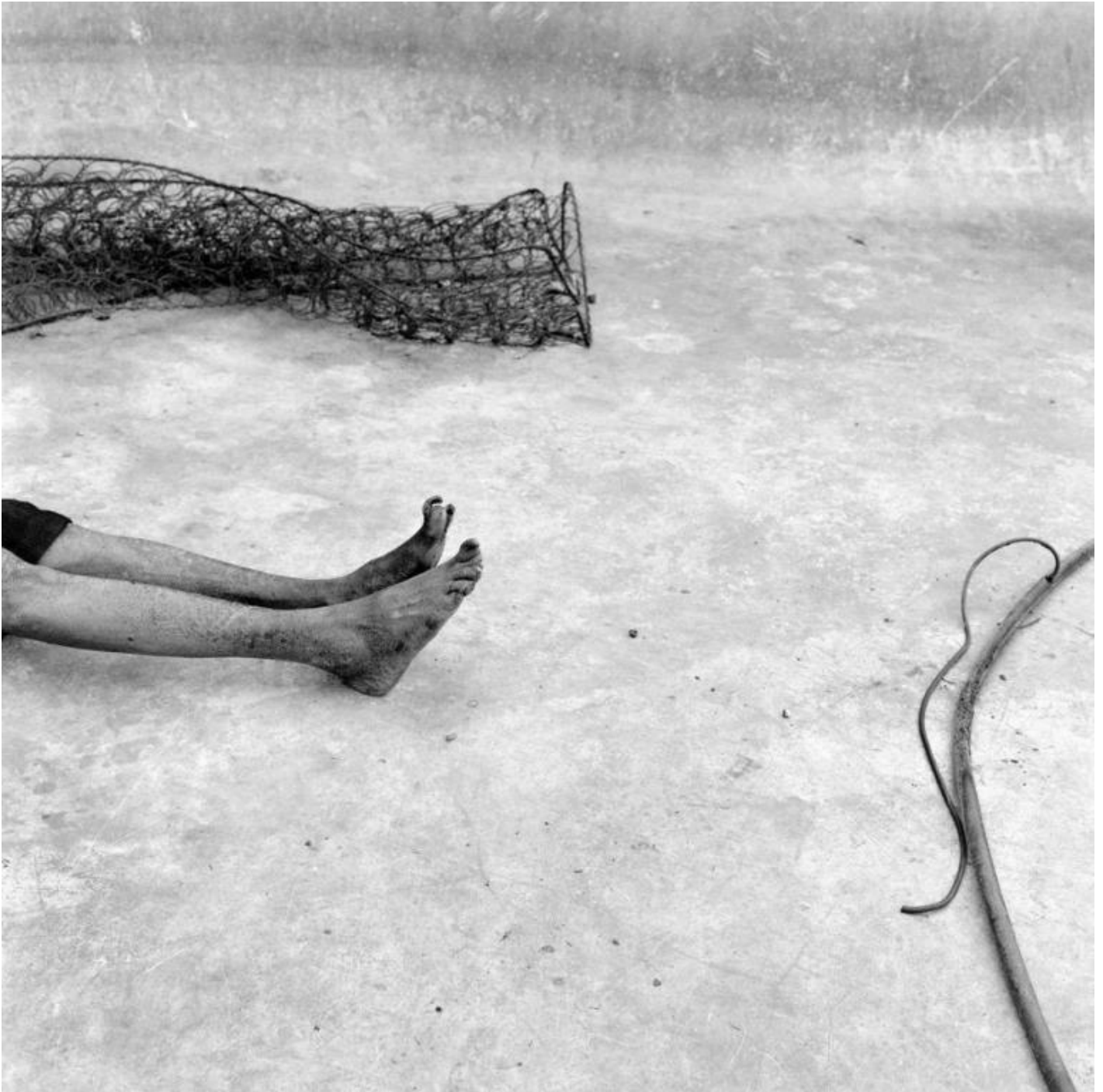
Roger Ballen, Toenail, 2001.

È proprio il termine freak ad aver fatto da cassa da risonanza al successo di Ballen, quando nel 2012 esce I Fink U Freeky un brano del gruppo hip hop sudafricano Die Antwoord . Il video della canzone ha come direttore della fotografia lo stesso Ballen, e porta l'autore ad avere un seguito globale da parte di un pubblico giovane e vicino alla scena techno e zef (termine dispregiativo per indicare la classe operaia bianca sudafricana, diffuso tra gli anni Sessanta e Settanta del secolo scorso). Maschere, manichini, bambole, topi, cavi elettrici e disegni stilizzati, che contraddistinguono le fotografie di Ballen, sono sparsi negli ambienti fatiscenti dove viene girato il video.