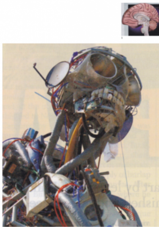
1. BLOCCO, CERVELLO, INCONTROLLABILE, PIATTAFORMA, SISTEMA (Psico sistema); 2. BIOTECNOLOGICO, FLASH-FORWARD, MOSTRO, TRANSFORMER.

Illuminante, a questo proposito il confronto con i «grandi quadri bianchi con tante piccole cose che bisogna guardare da vicino» (come Duchamp descriveva i dipinti di Baruchello): «Come dinanzi a un'opera di Baruchello il lettore avverte la necessità di avvicinarsi e poi allontanarsi per vedere prima il dettaglio e poi la totalità in cui è compreso», scrive Subrizi, «nella Psicoenciclopedia l'andamento in avanti e indietro all'interno del testo (con la lettura) e tra le immagini (nelle tavole), saltando anche tra le pagine, senza continuità, produce nel lettore la sensazione di una ricerca interminabile, che quando arriva a qualcosa subito dopo se ne distacca». E ancora «per ricongiungere i frammenti di cui sono fatte le tavole e le voci non serve o non basta un colpo d'occhio che le rimetta tutte insieme; è necessario un esercizio dello sguardo che sappia cogliere il particolare lasciandolo tale. È necessario, inoltre, che lo sguardo diventi affettivo , per poter condividere quelle storie, per sentire e vedere e, mentre si osserva, capire che qualcosa del nostro sapere sta cambiando».