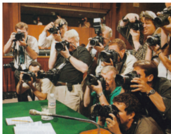
1. CINEASTA, CINEPRESA, FERMARE, NOTIZIE, SPETTACOLO 4. ARTE, ERMENEUTICA, FIARA, FINE, PSICOENCICLOPEDIA.

Ciò significa che per entrare nel gioco profondo della Psicoenciclopedia «visione d'insieme e visione ravvicinata sono entrambe necessarie» e devono prendere «la forma di una circolarità infinita tra voci, sottovoci, rinvii, immagini». Ma attenzione! Questa circolarità infinita non è una confusione mistica in cui tutte le vacche sono nere, è la «confusione benefica che sollecita l'immaginazione»; quella confusione a cui si riferisce la citazione lapidaria di Paul Valéry che – guarda caso – Baruchello mette nella voce ?