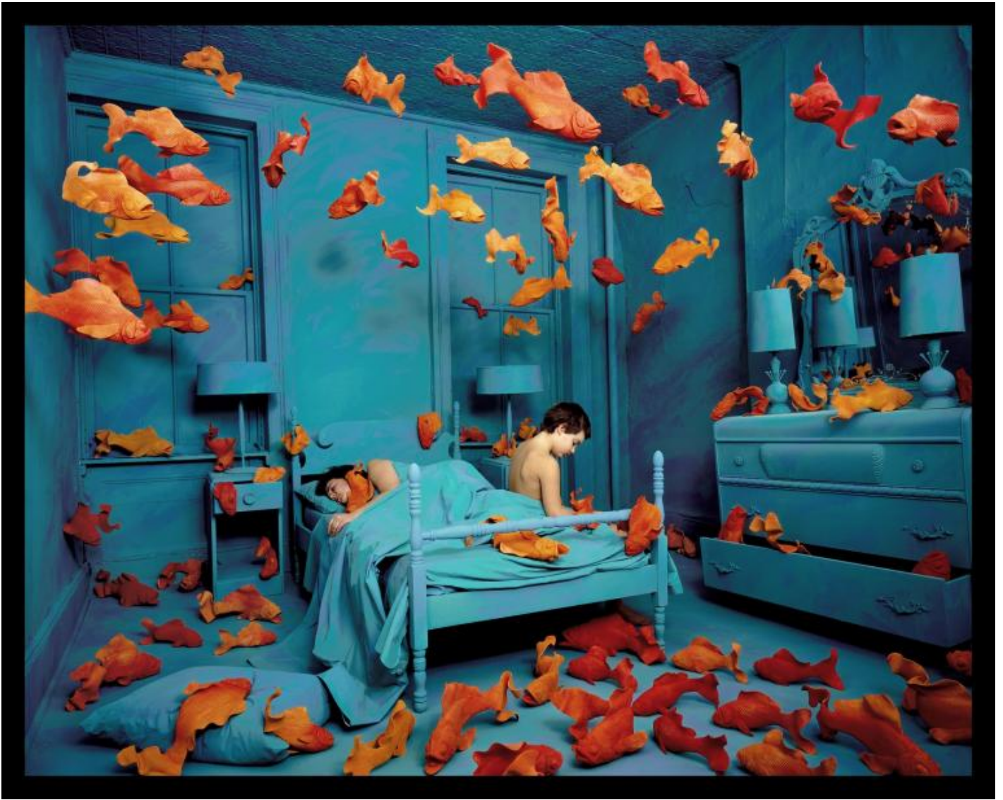
SANDY SKOGLUND, Revenge of the Goldfish 1981 archival color photograph cm 88.9 x 69.2 ca.

La mostra propone un percorso cronologicamente e geograficamente variegato, che affianca le figure storiche, ormai quasi mitiche, di questo genere fotografico ad esponenti delle ultime generazioni di artisti che si sono confrontati con queste modalità poetiche.