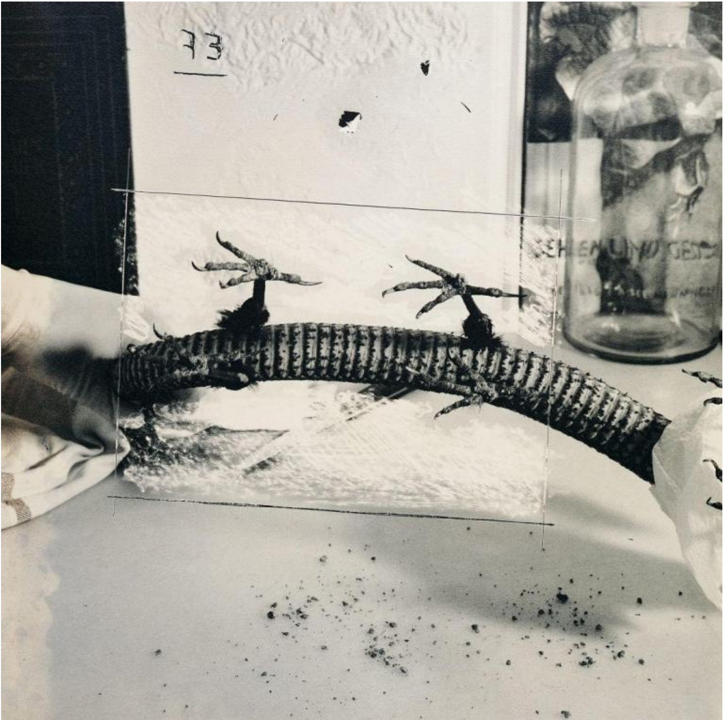
Joan Fontcuberta Solenoglypha Polipodida 1985 from the Fauna series.

Questi e gli altri artisti esposti in mostra (tra cui figurano, tra gli altri, Hiroshi Sugimoto, David LaChapelle, Andres Serrano e Tracey Moffatt) ci consegnano, attraverso le loro opere, una chiave di lettura alternativa dell'immagine fotografica, che non esclude bensì allarga e problematizza quella tradizionale, scuotendo certezze radicate e sconfinando in territori inesplorati.