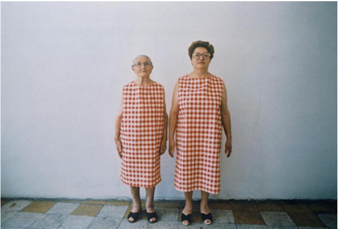
Marcello Maloberti, La vertigine della signora Emilia, 1992.

In questo periodo forse non c'è cosa più bella di vivere questo duro silenzio e farsi vuoto, farsi un nulla di un battito sgraziato di una farfalla ferita al davanzale di una delle solite finestre, e che la vita torni più di prima.