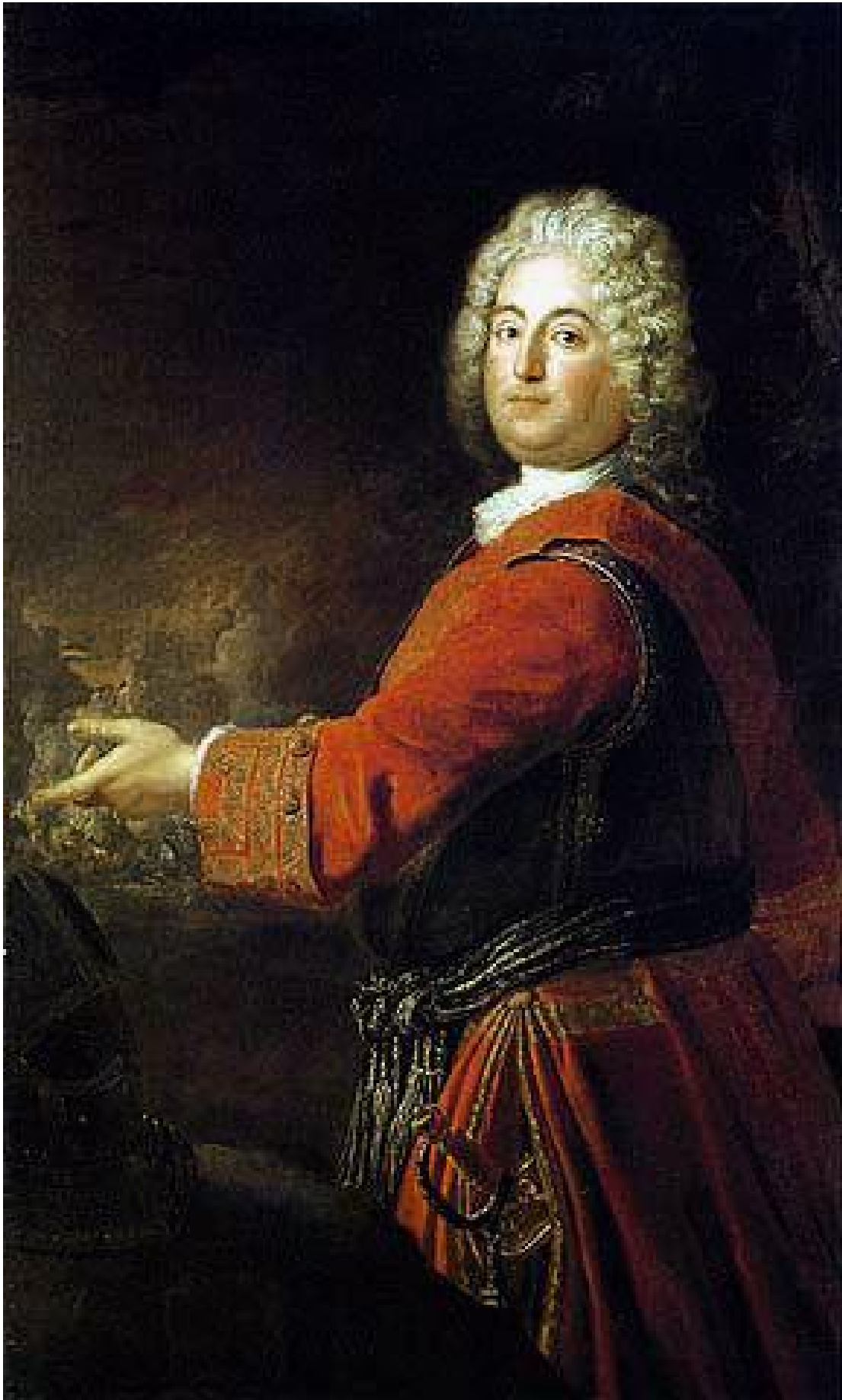
Christian Ludwig, Margravio del Brandeburgo (1677 - 1734).