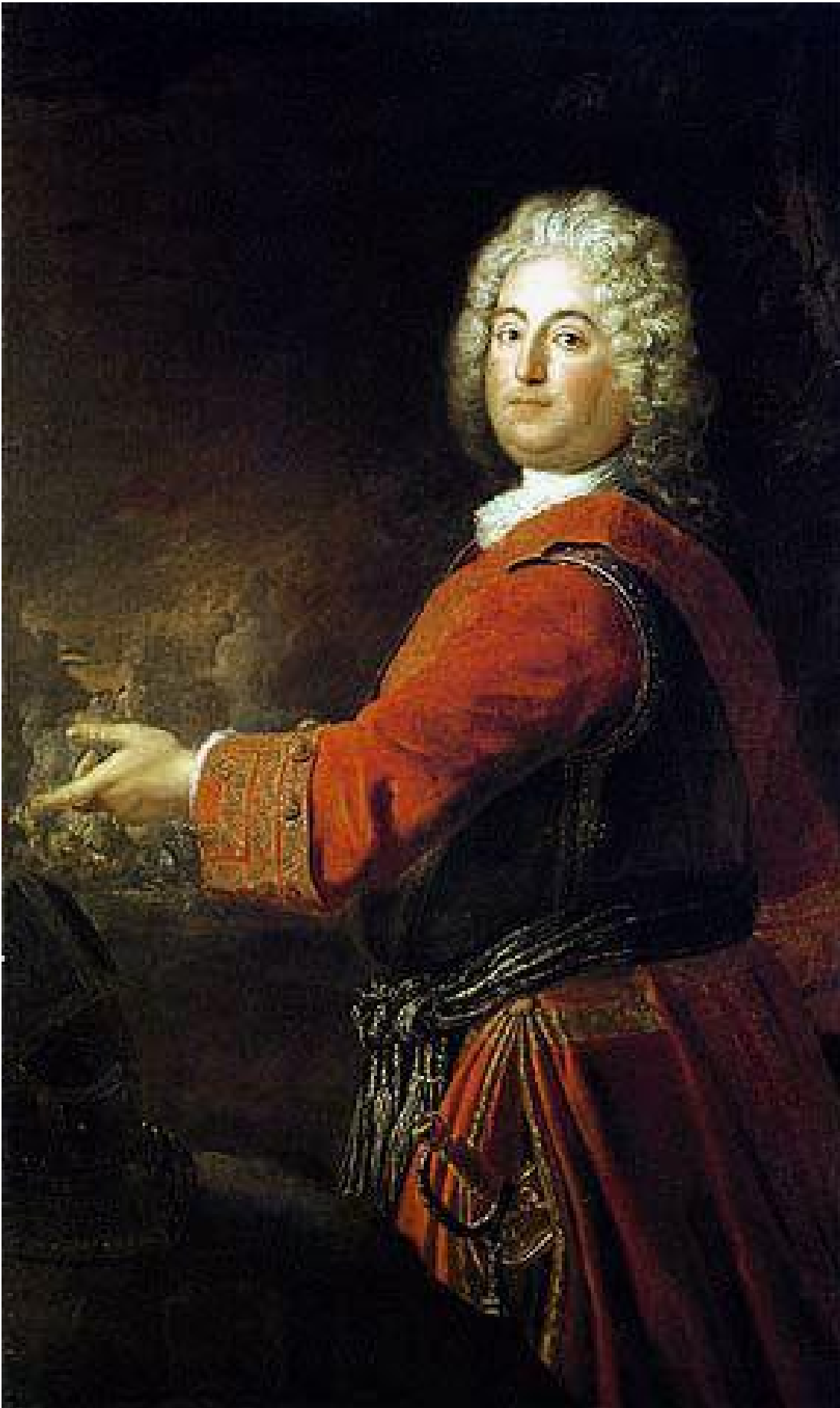
Christian Ludwig, Margravio del Brandeburgo (1677 - 1734).