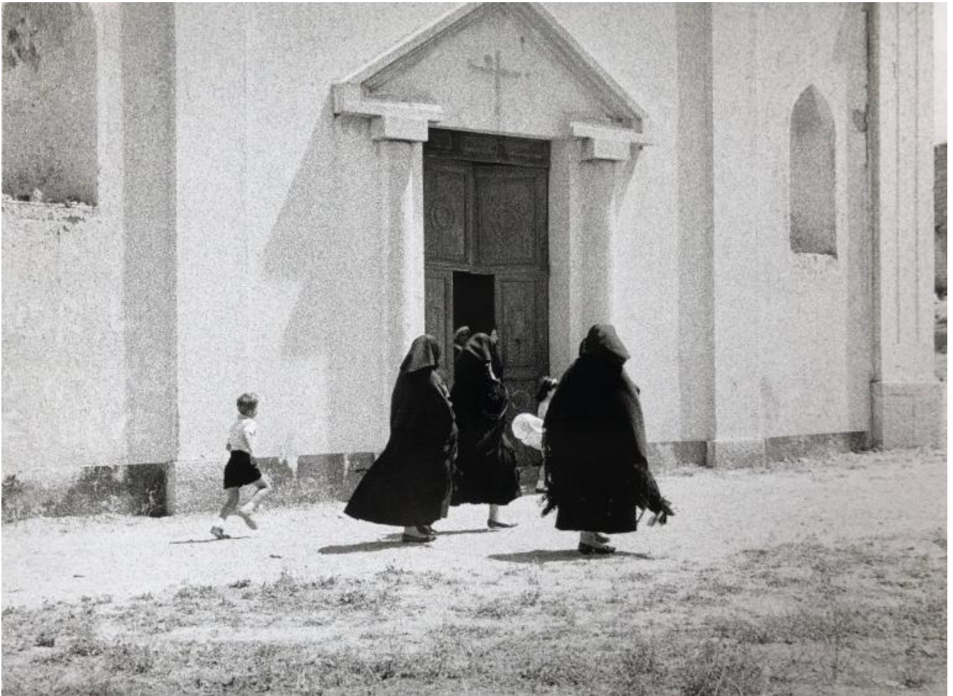
Lisetta Carmi, Orgosolo, uscita dalla chiesa , 1964.

Benvenuti, vi avevamo visti da lontano e vi seguivamo. Niente paura, i maiali sono accorsi al sentire lo schiocco della portiera, che è il segnale del mangiare.