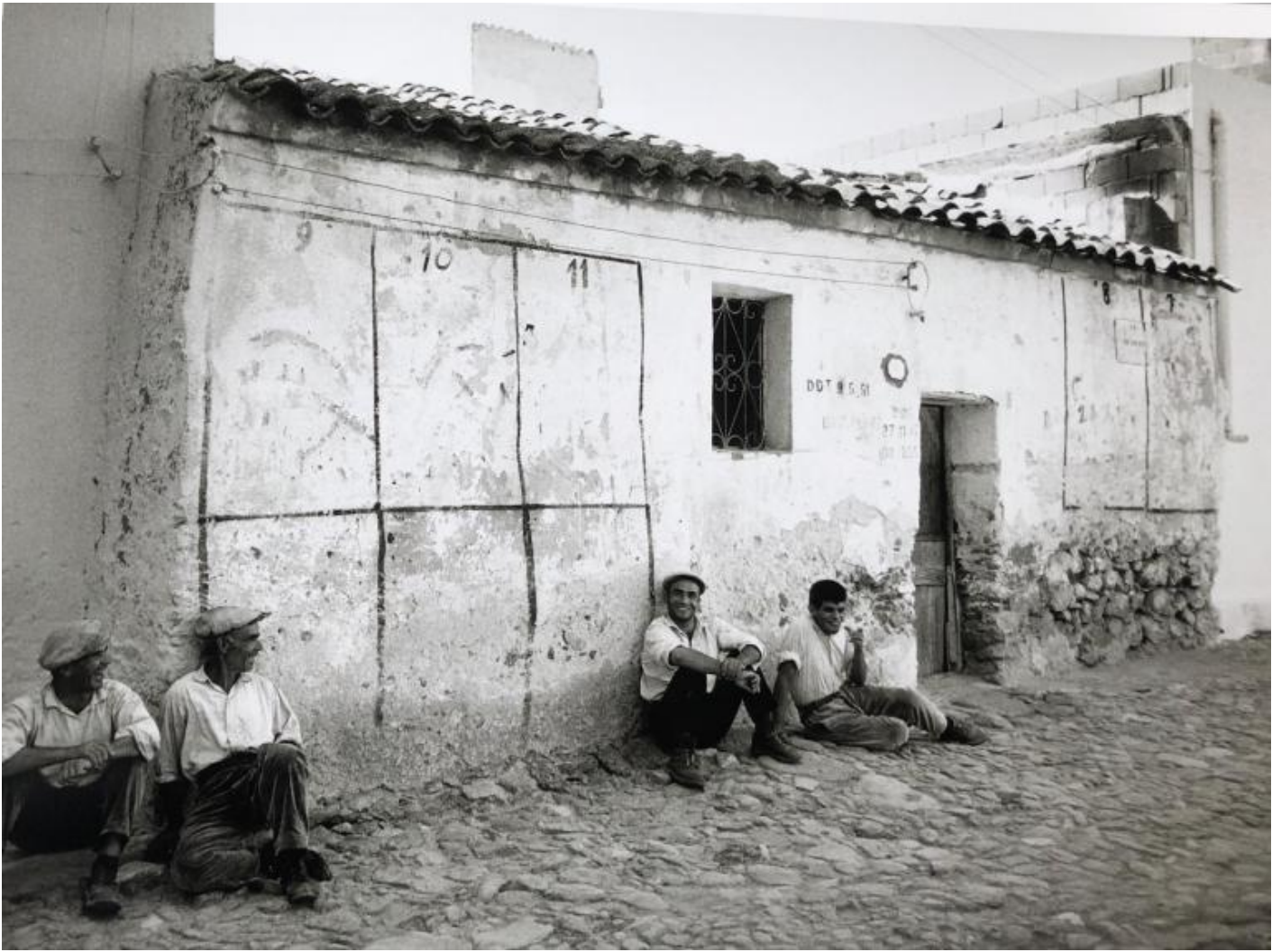
Lisetta Carmi, Irgoli in Baronia, Onifai, 1964.

Comunque sia l'amministratore e compagno dice: Il Partito ci raccomanda di tenere qui il ragazzo in assoluto incognito.