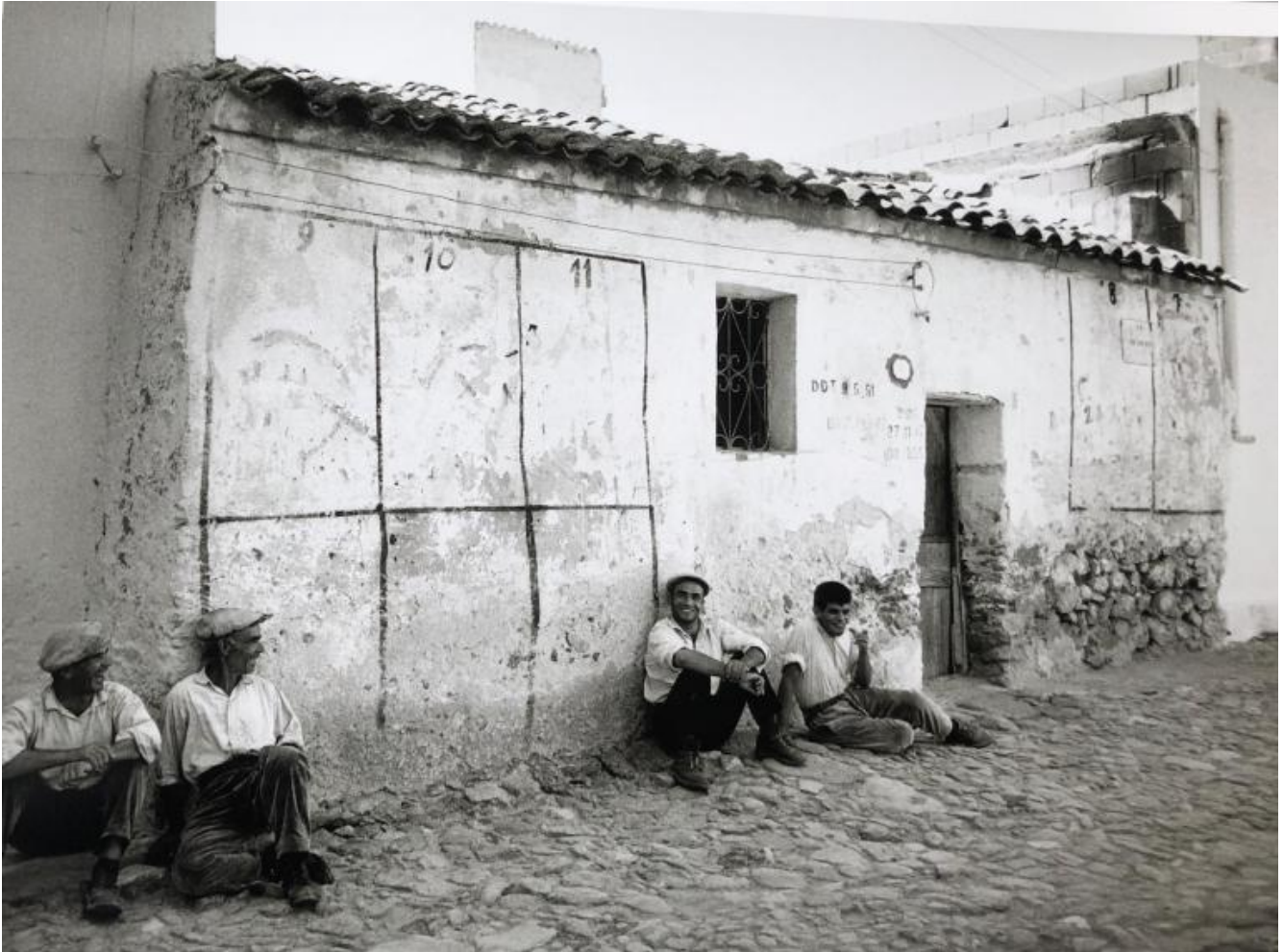
Lisetta Carmi, Irgoli in Baronia, Onifai, 1964.