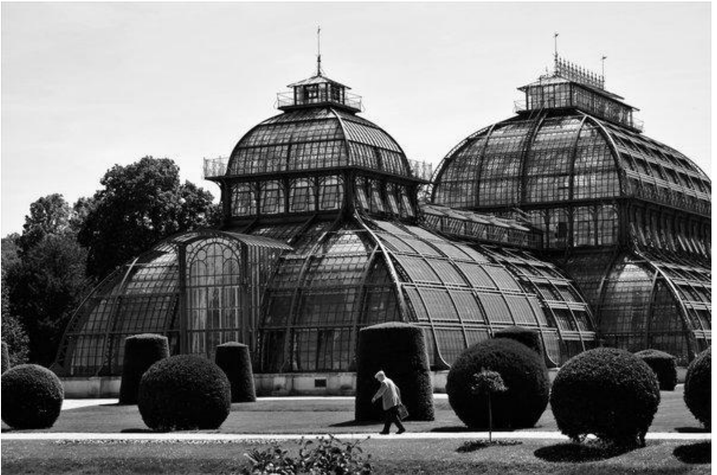
Palmenhaus, Schönbrunn.

Sebbene sia uno dei quartieri più vasti di Vienna, in pochi giorni potevamo dire di averlo in tasca, esplorato in lungo e in largo – e pareva che nessuna targa commemorativa o palazzina in Jugendstil, anche la più timida e nascosta, ci fosse sfuggita. Era necessario – ma forse lo era più per me, che per le bambine e mia moglie – escogitare un nuovo itinerario, con un obiettivo preciso, un punto verso cui tendere corpo e mente, una meta, dunque, che trascendesse la mera urgenza di movimento e aria aperta.