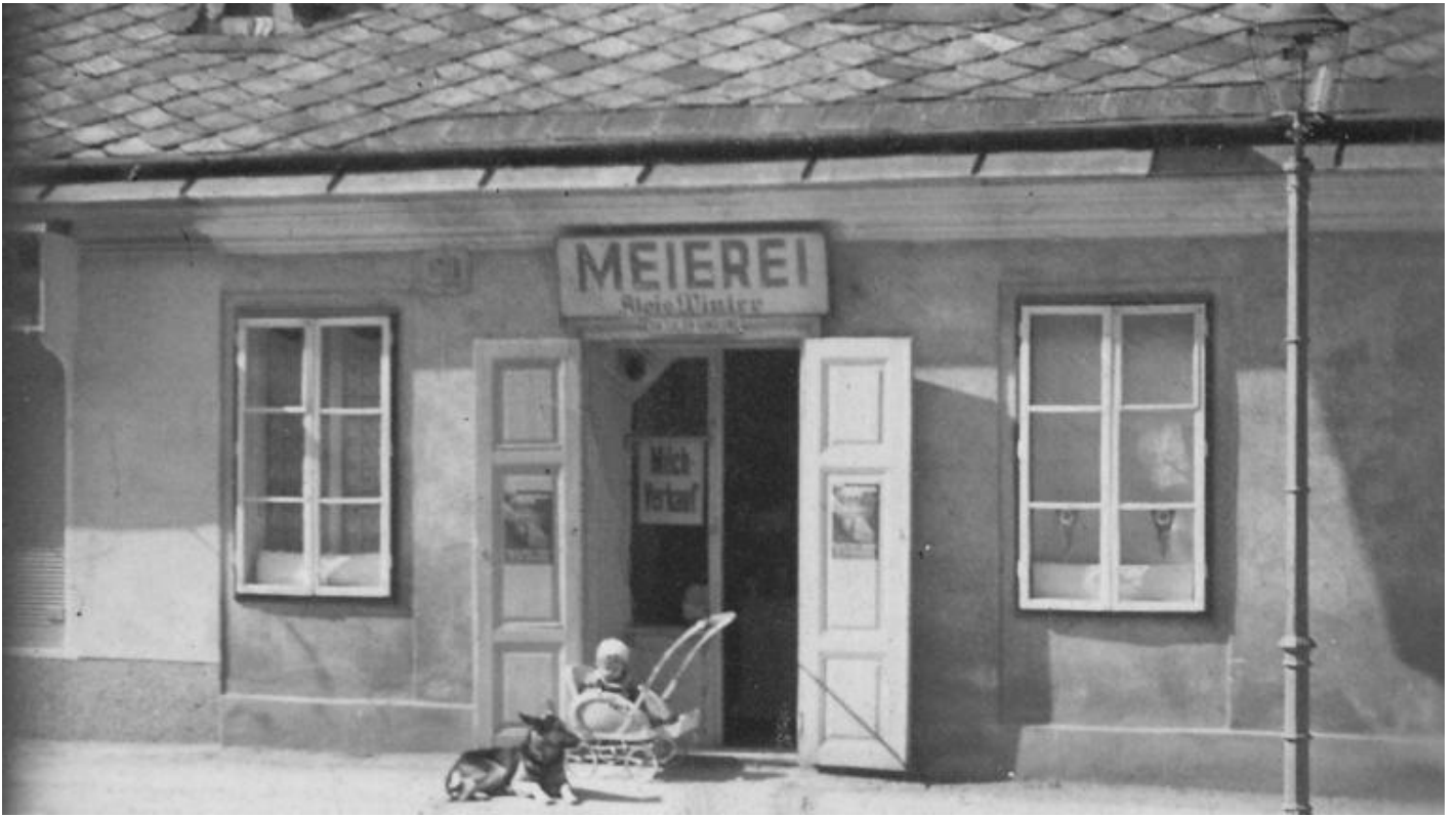
Meierei (latteria) Alois Winter, Auhofstraße 191, 1130 Wien.

Le mie prime ricerche erano andate a vuoto perché credevo che i proprietari del negozio si chiamassero Fontana e di conseguenza cercavo una latteria abbinata, in qualche modo, a quel nome. Mi ero domandato, in effetti, da dove venisse quel cognome così italiano, ma in Austria, si sa, i nomi di famiglia slavi, ungheresi e, seppur meno frequentemente, italiani – specie quelli di origine lombarda o del Triveneto – appartengono alla normalità.