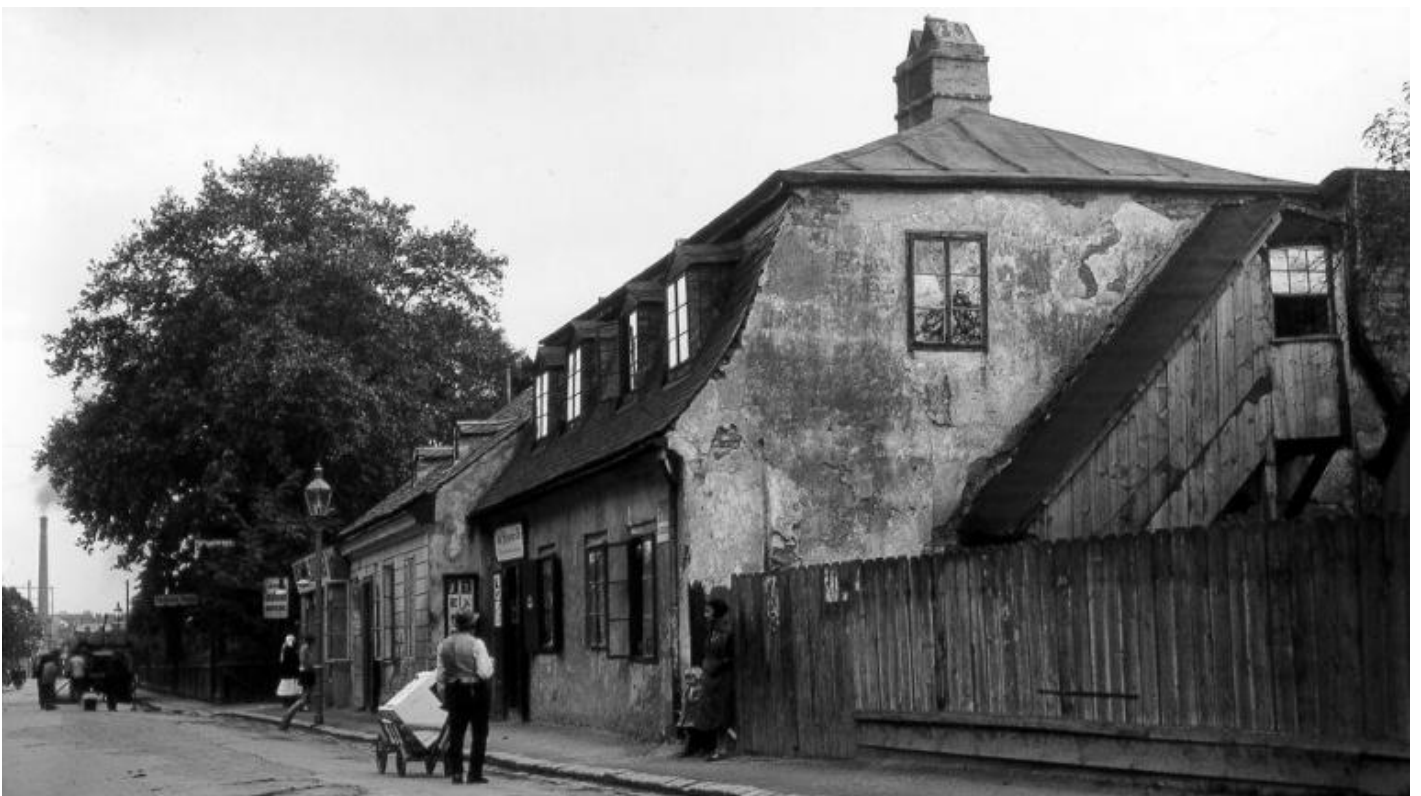
Auhofstraße 191-193, 1130 Wien. © Famiglia Matauschek

«Nella Auhofstrasse, a cinque minuti da casa mia, scendendo la collina, c'era una latteria [Molkerei] che vendeva yogurt, pane e burro, cibi che potevo consumare tranquillamente all'unico tavolino del negozio, seduto sull'unica sedia. Era là che facevo colazione prima di andare in laboratorio. E quando restavo a casa ci tornavo anche più tardi, durante la giornata. In quegli anni vivevo volentieri di pane e burro e yogurt, perché risparmiavo il più possibile per comprarmi dei libri.»