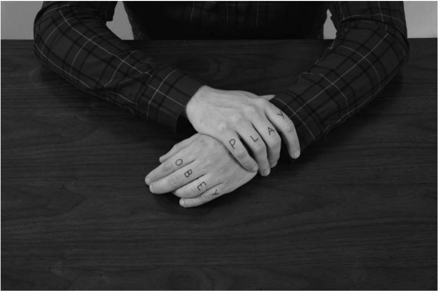
Agnès Geoffray, Les impassibles, 2018 photograph, 20x30 cm

Qual è la storia di Les Impassibles (2018)? Che linguaggio appartiene alle mani che hai fotografato?