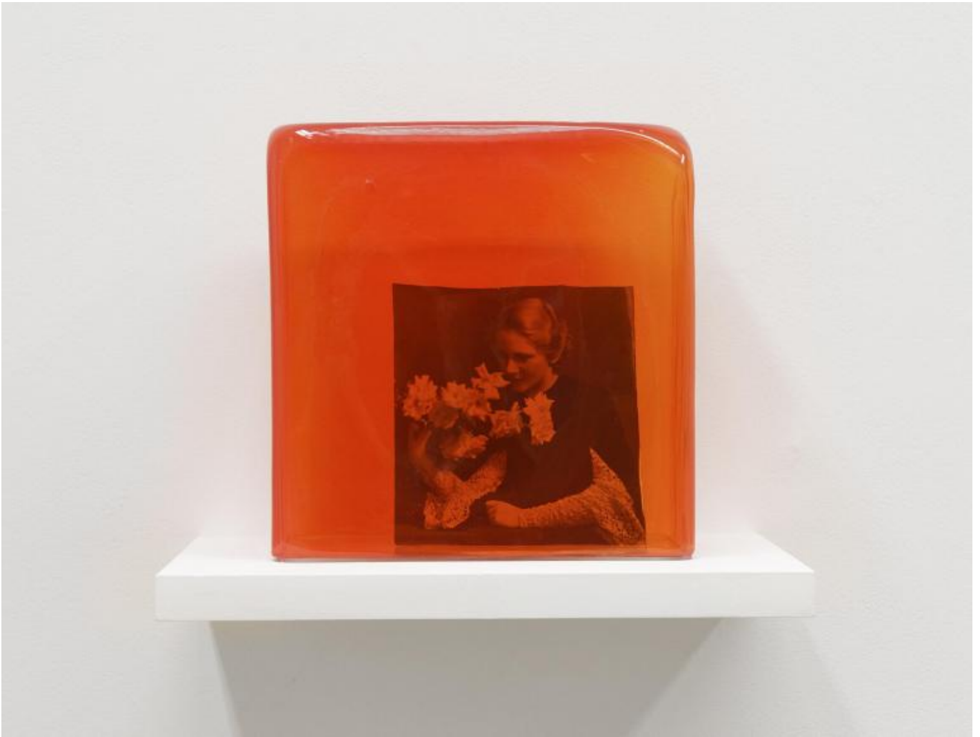
Agnès Geoffray, Les Captives, 2020 vintage photograph, blown glass

Le associazioni narrative nel tuo lavoro sono cariche di suspense e danno un taglio drammatico alla tua opera. Se pensiamo per esempio a Flying Man (2015), che cos'è l'emozione nella rilettura del materiale d'archivio?