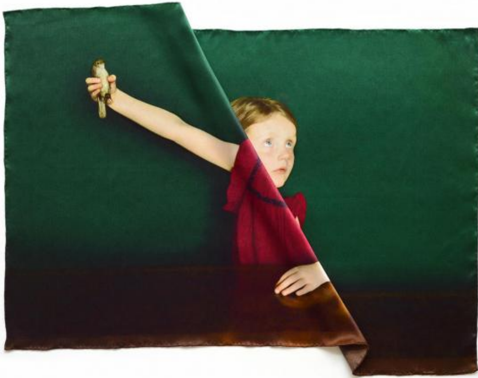
Agnès Geoffray, PLIURES, 2019 digital print on silk, 45x63 cm, Fonds de dotation Centre Pompidou "Accélération", Neuflize OBC © Agnès Geoffray

Negli ultimi anni il modo in cui presenti le tue fotografie è sempre più installativo. Pensiamo al rigore di Contraintes (2019) o alla bellezza delle pieghe nella seta in Pliures (2019). Come è avvenuto questo cambiamento? Ci sono confini della fotografia che sono venuti meno per te e il tuo lavoro?