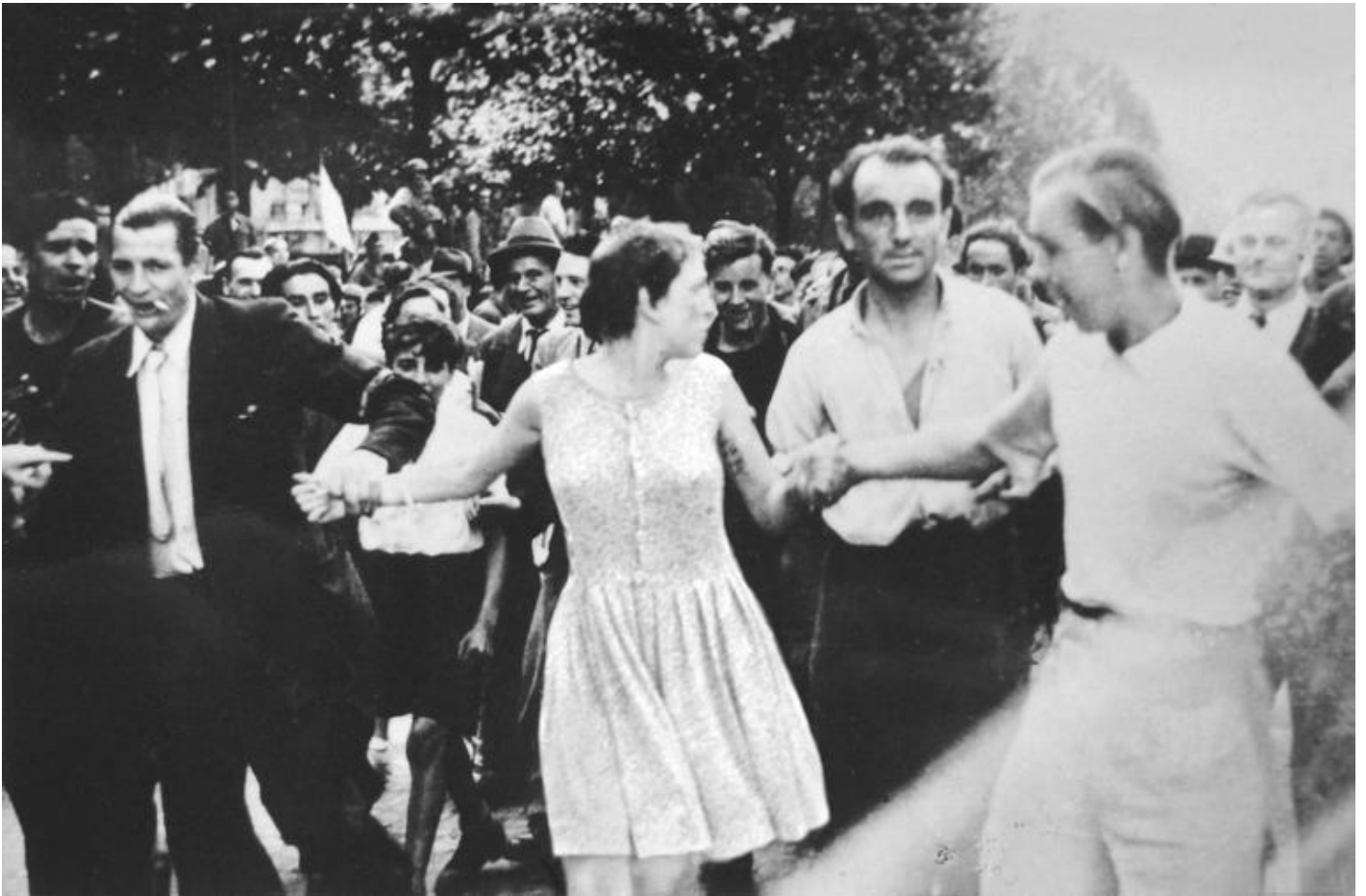
Agnès Geoffray, Libération, 2011 dyptich, photographs, 22x34 cm © Agnès Geoffray.

Nel 2017 avevamo visto a Fotografia Europea la tua serie Incidental Gestures. Libération, in particolare, aveva colpito la nostra attenzione: in questa opera una donna trascinata da una folla di uomini è presentata in un dittico composto dalla medesima immagine con l'unica differenza che in una fotografia la donna è nuda, mentre nell'altra indossa un vestito corto estivo. In Sans titre (2012), una donna incurva la schiena richiamando alla mente Arch of Hysteria (1993) di Louise Bourgeois. E in Laura Nelson (2011) una donna nera impiccata a un albero viene presentata come se volasse, come i fantasmi degli antenati in Song of Salomon (1977) di Toni Morrison. Il femminismo ha influenzato la tua pratica?