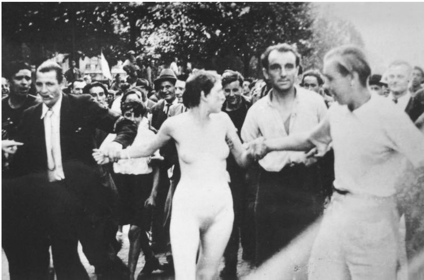
Agnès Geoffray, Libération, 2011 dyptich, photographs, 22x34 cm

interessano, attraverso la loro instabilità e il loro significato fugace. Le immagini circolano malgrado loro stesse. Mi piace ripensare la circolazione delle immagini, tra i loro diversi status: come immagini, soggetti, immagini oggetto e immagini mentali.