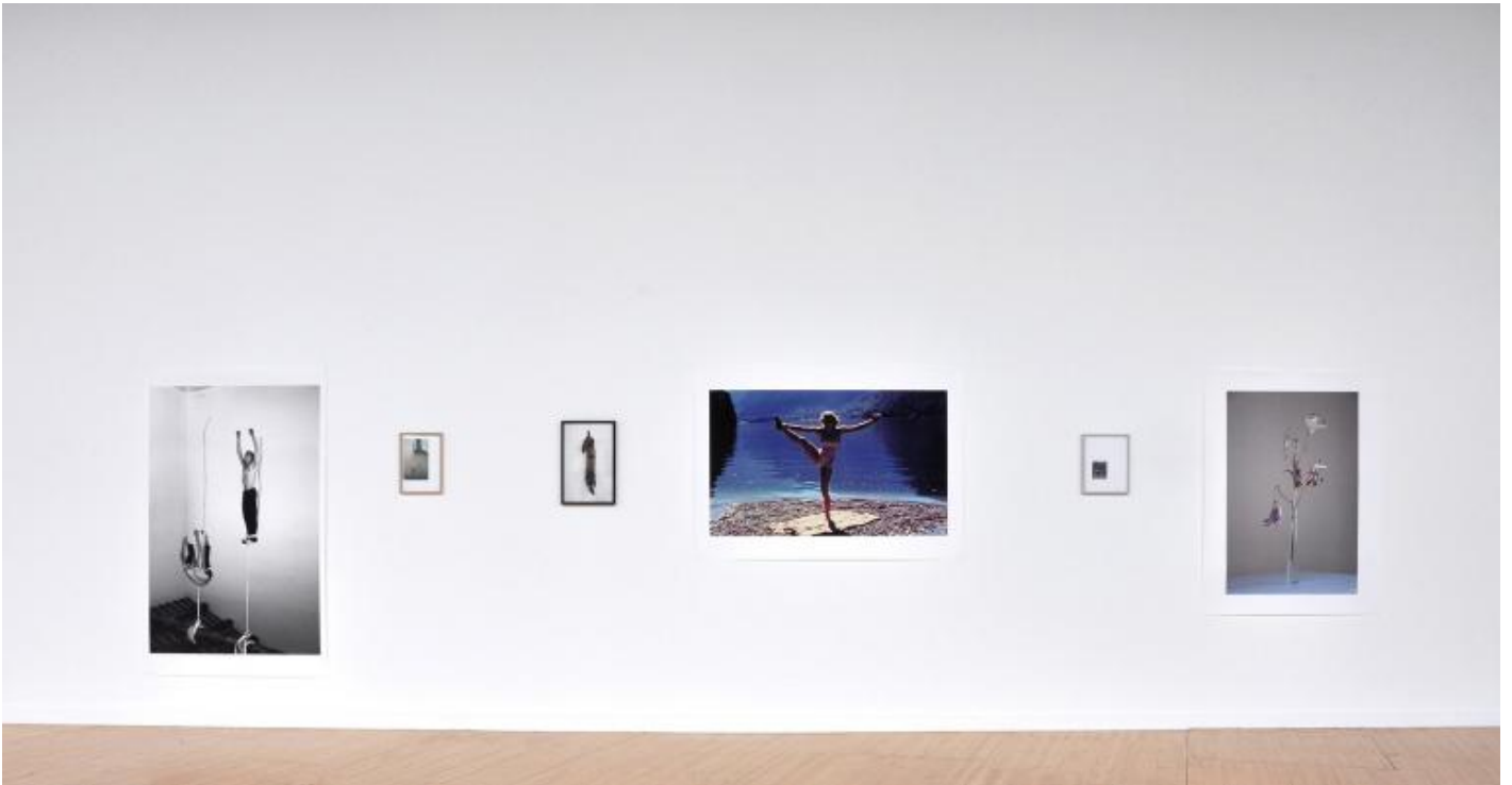
Agnès Geoffray, Les suspendus, 2010 Installation view, Frac Alsace, Sélestat, F. © Agnès Geoffray.

Agnès Geoffray: Night è una delle prime serie fotografiche attraverso le quali mi interrogavo sulle paure arcaiche, che fossero ispirate da racconti, fatti di cronaca, fatti storici o paure più intime, quasi inconse. Gli scatti sono stati realizzati nella totale oscurità, con un dispositivo a infrarossi. Un alone circonda i soggetti e immerge i contorni nell'oscurità, come una strana apparizione, e con l'effetto degli occhi luminescenti. Sembra che gli esseri siano illuminati dall'interno. La stranezza di queste immagini è risultata così forte, così pervasiva, che ho fatto una serie di fotografie, da scene molto semplici, quasi ordinarie, ma che, attraverso questo filtro, hanno preso una dimensione eminentemente drammatica. Le fotografie sono piccole, sembrano imperfette, un po' sfocate, come immagini persistenti, immagini mentali. Quando ho creato la serie, non avevo un particolare riferimento contemporaneo. Sono venuta a conoscenza della serie Nacht di Thomas Ruff solo molto più tardi. All'epoca ero per lo più imbevuta di fotografie di spiriti, con quegli aloni di luce e figure spettrali che avvolgono i soggetti fotografati.