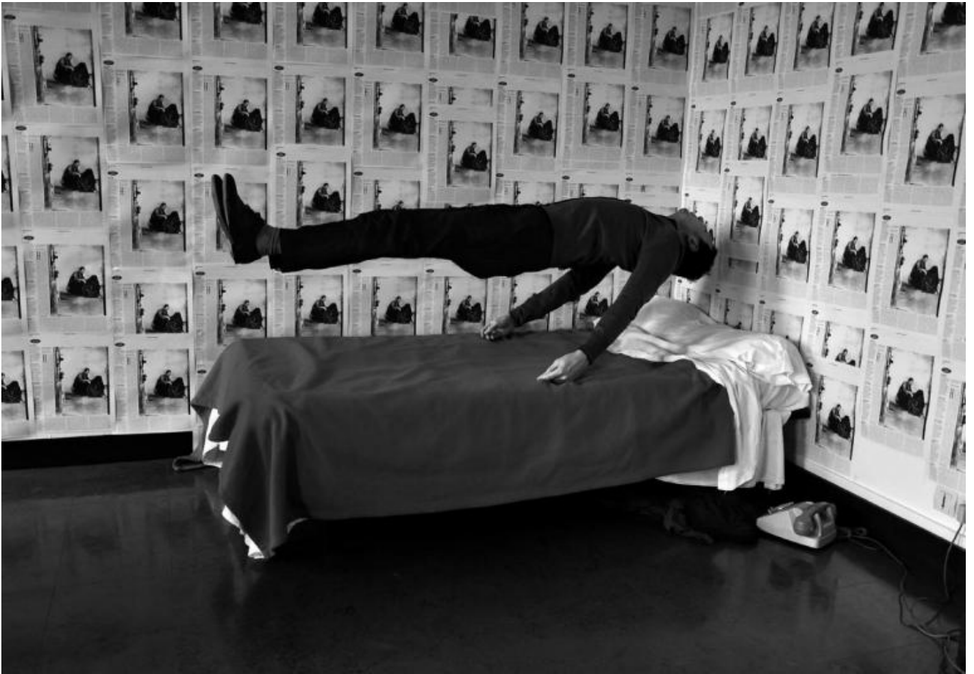
Agnès Geoffray, Métamorphoses II, 2015 photograph, 50x70 cm © Agnès Geoffray.

In Métamorphoses (2015) ritornano elementi costanti della tua ricerca: il gesto, la sospensione, l'assenza. Ma gli scatti da te realizzati si distinguono rispetto ad altre serie per la presenza di immagini nelle immagini. Quali assenze sono evocate? Perché hai scelto proprio questo titolo?