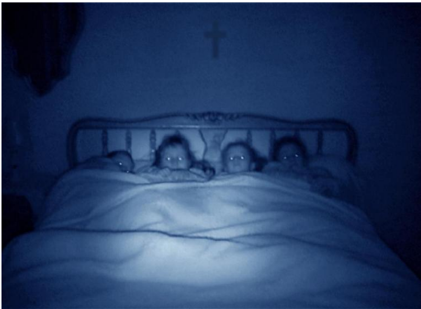
Agnès Geoffray, Night III, 2005 photograph, 22x30 cm

Agnès Geoffray (1973) è un'artista francese che lavora principalmente con la fotografia. La sua ricerca è in equilibrio tra realtà e finzione, e spesso origina da notizie angoscianti poco conosciute o trascurate. Le immagini di Geoffray spesso lasciano emergere un 'doppio' visivo, in cui il perturbante si insinua tra forze distruttive addomesticate e quasi addormentate sulla scena. In un certo senso sono le associazioni visive innumerevoli in chi guarda a completare questi lavori, presentando una intensità drammatica nel materiale, modellato in scena come pedine. Questa intensità è una corrente caotica che attraversa il confine sottile tra immaginazione e finzione; genera una variabile sinistra che, inafferrabile, produce un coinvolgente impatto visivo.