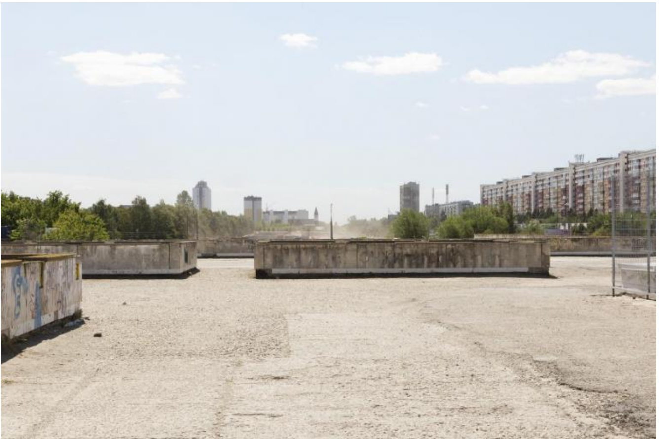
Foto Giovanna Silva da Togliatti. La fabbrica della Fiat © Humboldt Books 2020.

Quel giorno i dirigenti sovietici in un impeto retorico si erano rivolti ai posteri per celebrare un momento importante nella causa del comunismo, che coincideva con l'uscita la prima automobile dalla catena di montaggio. Nel momento in cui l'ingegnere blocca il filmato, all'autore viene fatto di pensare una frase ad effetto che dia il senso "di questa avventura tragicomica che è stata la storia del mondo nell'ultimo secolo", ma non gli riesce. La frase che pronuncia è più rasoterra - "Incredibile come sono andate le cose" -, eppure assolutamente perfetta. La seconda parte del volume, stampata su carta patinata, comprende 63 magnifiche fotografie di Giovanna Silva.