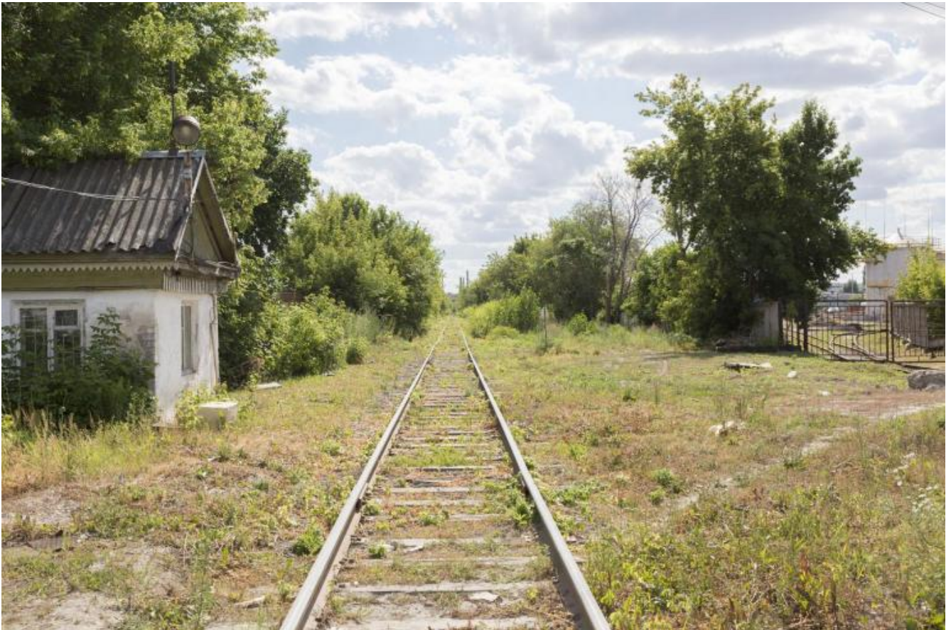
da Togliatti. La fabbrica della Fiat.