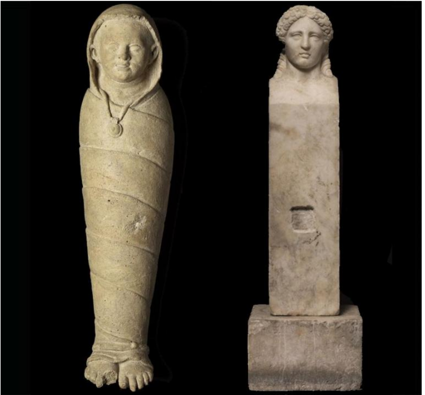
Ex-voto a forma di bambino in fasce, da Vulci (deposito votivo della Porta Nord), II sec. a.C. / Erma romana con testa di Apollo Ariadne, II secolo d.C. Collezione privata.

L'edicola, ora in corso di restauro, è una tipologia architettonica che conserva la memoria dell'erma, del cippo e della pietra di confine infissa verticalmente nel suolo, posta lungo le strade, agli incroci e ai confini. Il parallelismo tra il bambino conficcato verticalmente nella neve e l'erma conficcata verticalmente nel suolo per segnare un luogo in cui è accaduto o si è manifestato qualcosa di memorabile, colpisce perché questa è l'essenza della scultura prima che diventasse "lingua morta" (Arturo Martini).