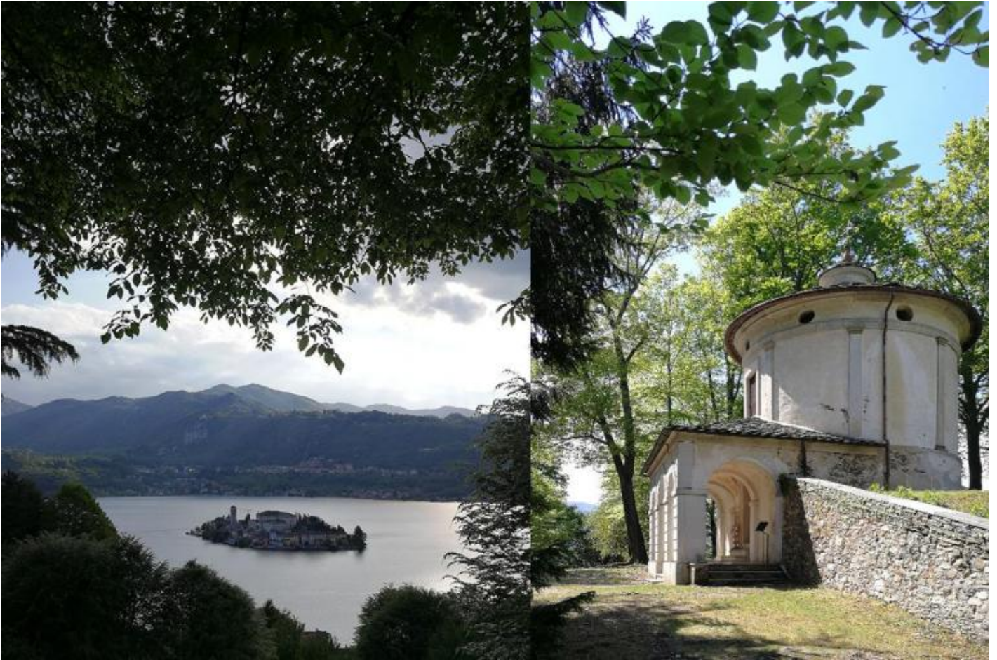
Isola di San Giulio vista dal Sacro Monte di Orta / Veduta di una delle venti cappelle del Sacro Monte, che illustrano con opere scenoplastiche gli episodi della vita di San Francesco a (1591-1795).

La visita all'edicola segnalata da questo Foglio 01 dell'Atlante dei luoghi con storie dimenticate merita una sosta a Gozzano. Il paese ha un bellissimo lido. L'acqua del lago è limpida e i pesci più piccoli nuotano a riva. Da Gozzano, in pochi minuti, si raggiunge il Sacro Monte di Orta dal quale si gode una vista impareggiabile del lago con l'isola di San Giulio al centro.