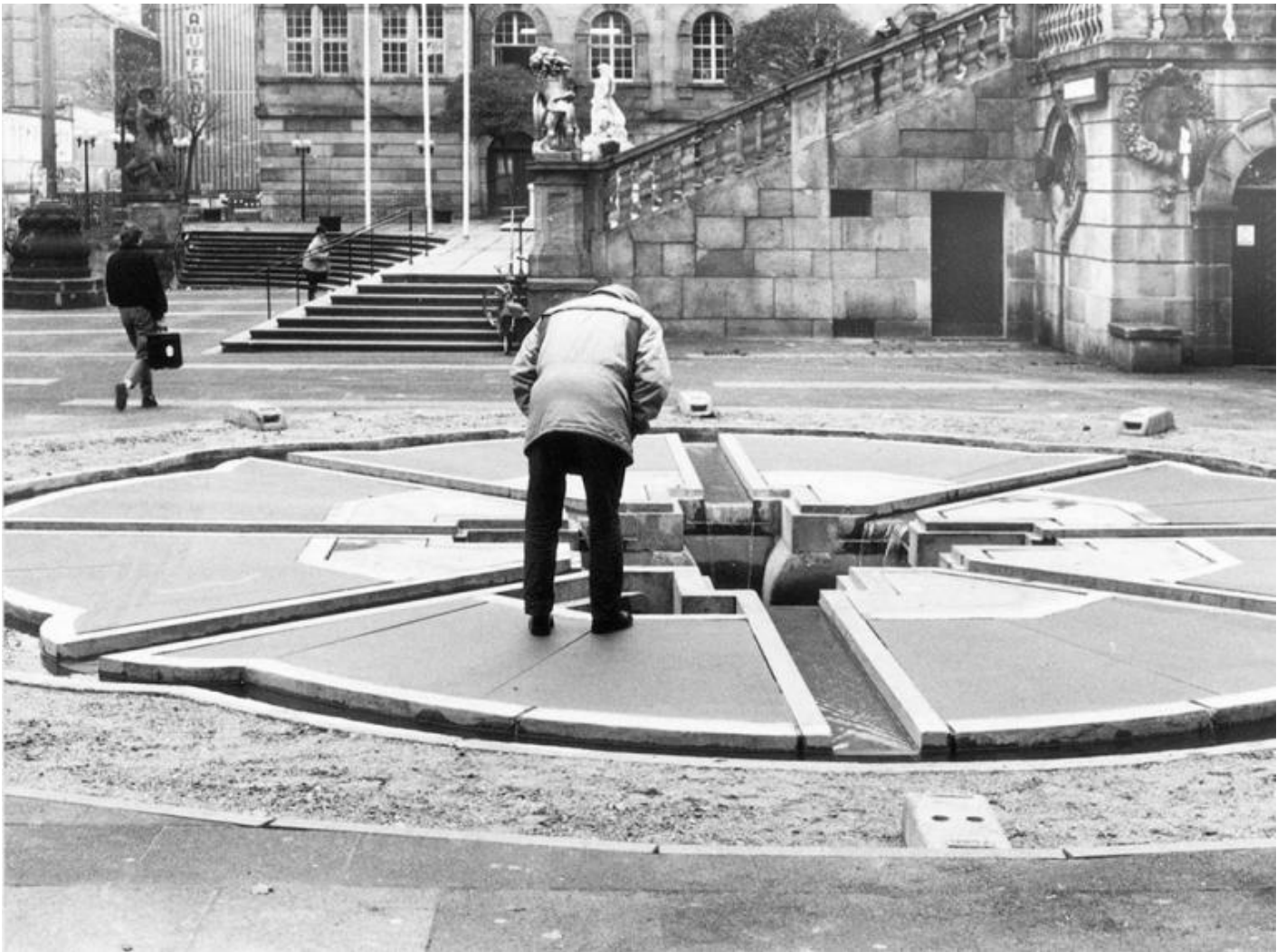
Horst Hoheisel, Memoriale Aschrott Brunnen, 1986/87. Kassel.

convenzionale, riconducibile grosso modo all'idea che il monumento sia un'espressione della retorica visiva in forme iperboliche e celebrative, come erano le Twin Towers per il capitalismo neoliberista, per esempio.