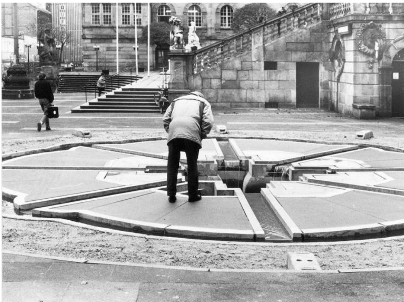
Horst Hoheisel, Memoriale Aschrott Brunnen, 1986/87. Kassel.

convenzionale, riconducibile grosso modo all'idea che il monumento sia un'espressione della retorica visiva in forme iperboliche e celebrative, come erano le Twin Towers per il capitalismo neoliberista, per esempio.