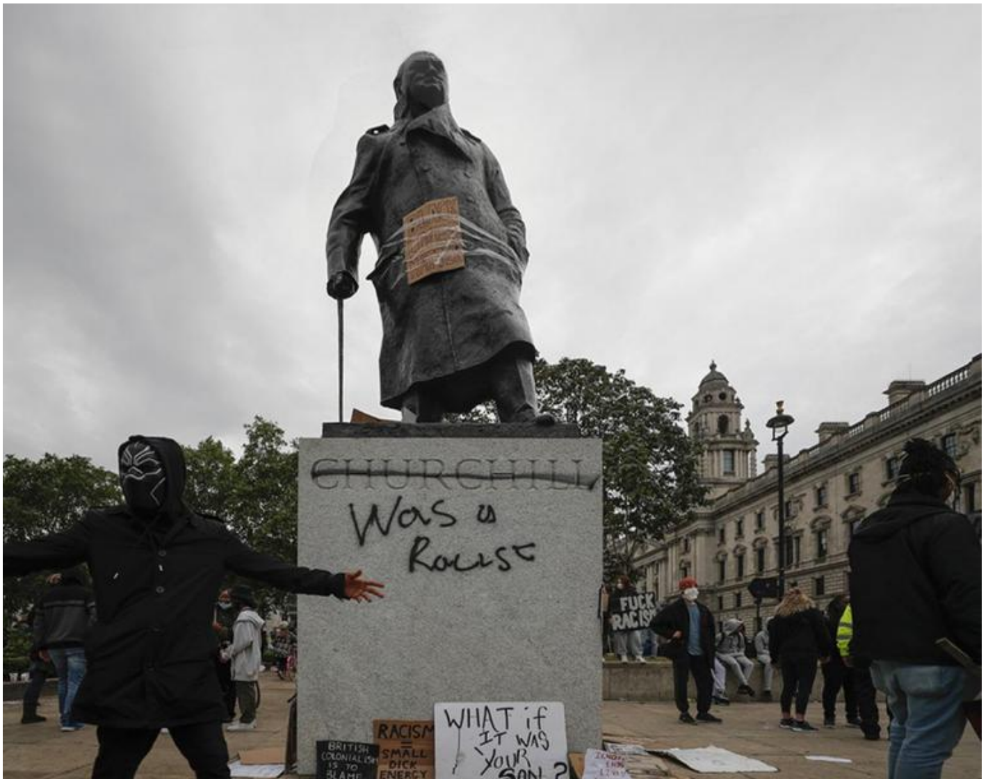
Statua di Winston Churchill eretta davanti al Parlamento di Londra sfregiata durante le manifestazioni britanniche del movimento Black Lives Matter.

Un'altra forma di contro-monumentalità è quella delle recenti aggressioni alle sculture abbattute o imbrattate con colori e scritte dagli attivisti del movimento Black Lives Matter. Se nel 1936 Robert Musil affermava: “non c'è niente in questo mondo invisibile come un monumento” ora il monumento è tornato ad essere visibile. Se siamo nell'età della frattura e della discontinuità che autorizza l'anacronismo storico, come dimostrano le recenti proiezioni del presente sul passato, possiamo rovesciare i termini e interpretare il presente attraverso il trattato ottocentesco di Cicognara, per esplorare un lato ancora in ombra del monumento: il suo rapporto con le parole dette e scritte, che peraltro commentano anche le statue indesiderate fornendo narrazioni alternative. Ci si riappropria dello spazio pubblico (e della memoria storica riferita al luogo) attraverso una narrazione.