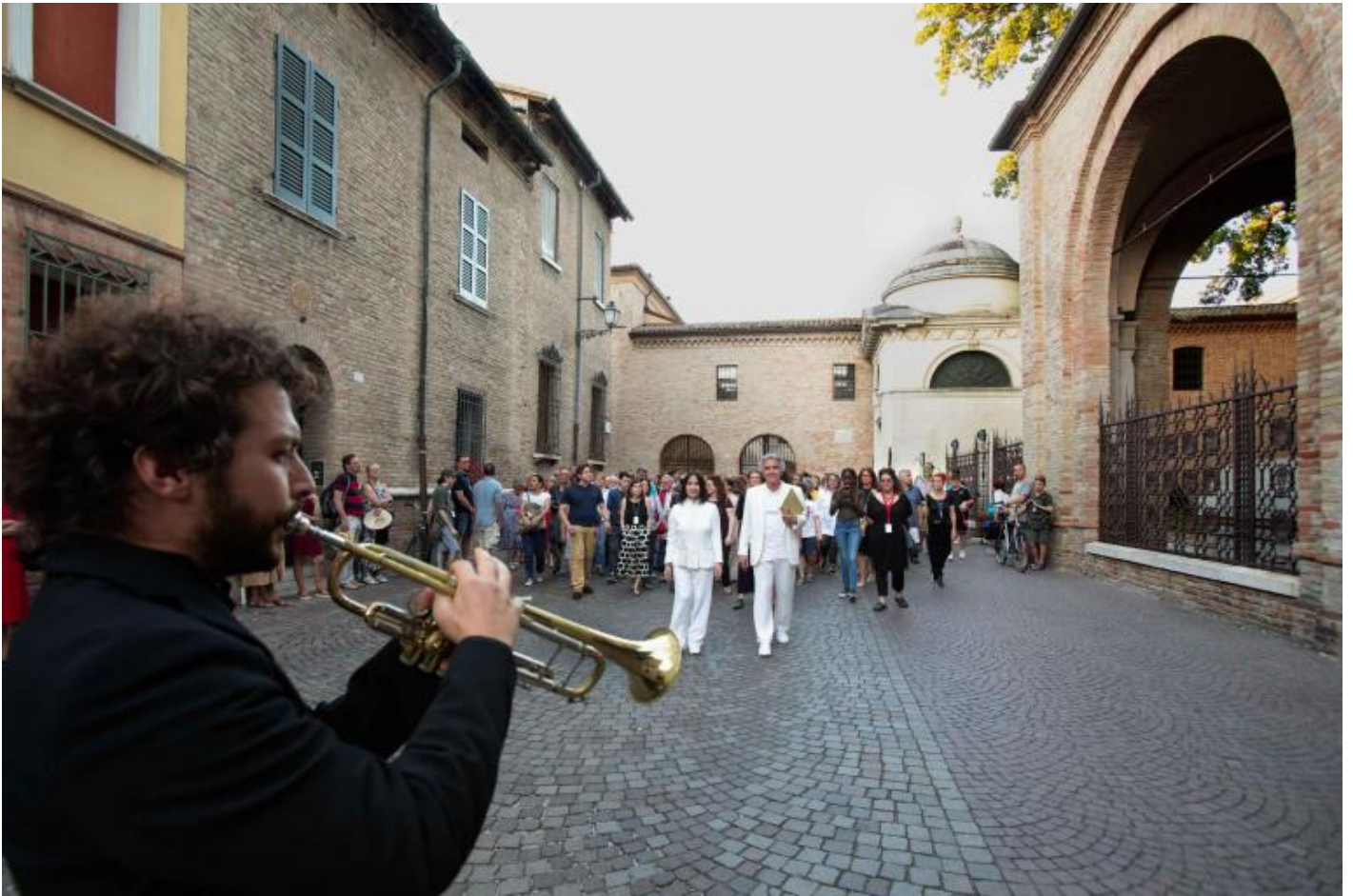
Purgatorio, Teatro delle Albe, passaggio davanti al Quadrarco di Braccioforte, 2019, © Silvia Lelli.