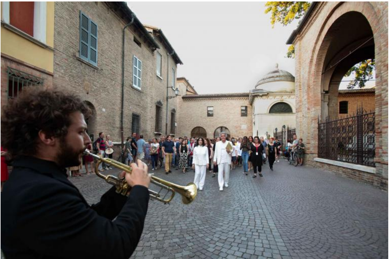
Purgatorio, Teatro delle Albe, passaggio davanti al Quadrarco di Braccioforte, 2019

E così per tre secoli a quella tomba si andò in pellegrinaggio, pensando di onorare i resti mortali del “sommo poeta”. Guicciardini, Ariosto, Tasso, Alfieri, Foscolo, Leopardi, Byron, Oscar Wilde e altri ancora, con toni più o meno commossi. Nel frattempo, di generazione in generazione, i ladri continuavano a trasmettersi il segreto. Il vecchio abate del convento rivela al suo successore il luogo dove è nascosta la cassa con le ossa, e gli consegna la responsabilità di quella custodia clandestina. Dante, quei ladri , se lo sentivano fratello: il ritratto del santo di Assisi, nell’ XI canto del Paradiso , è tra le pagine più abbacinanti della Commedia