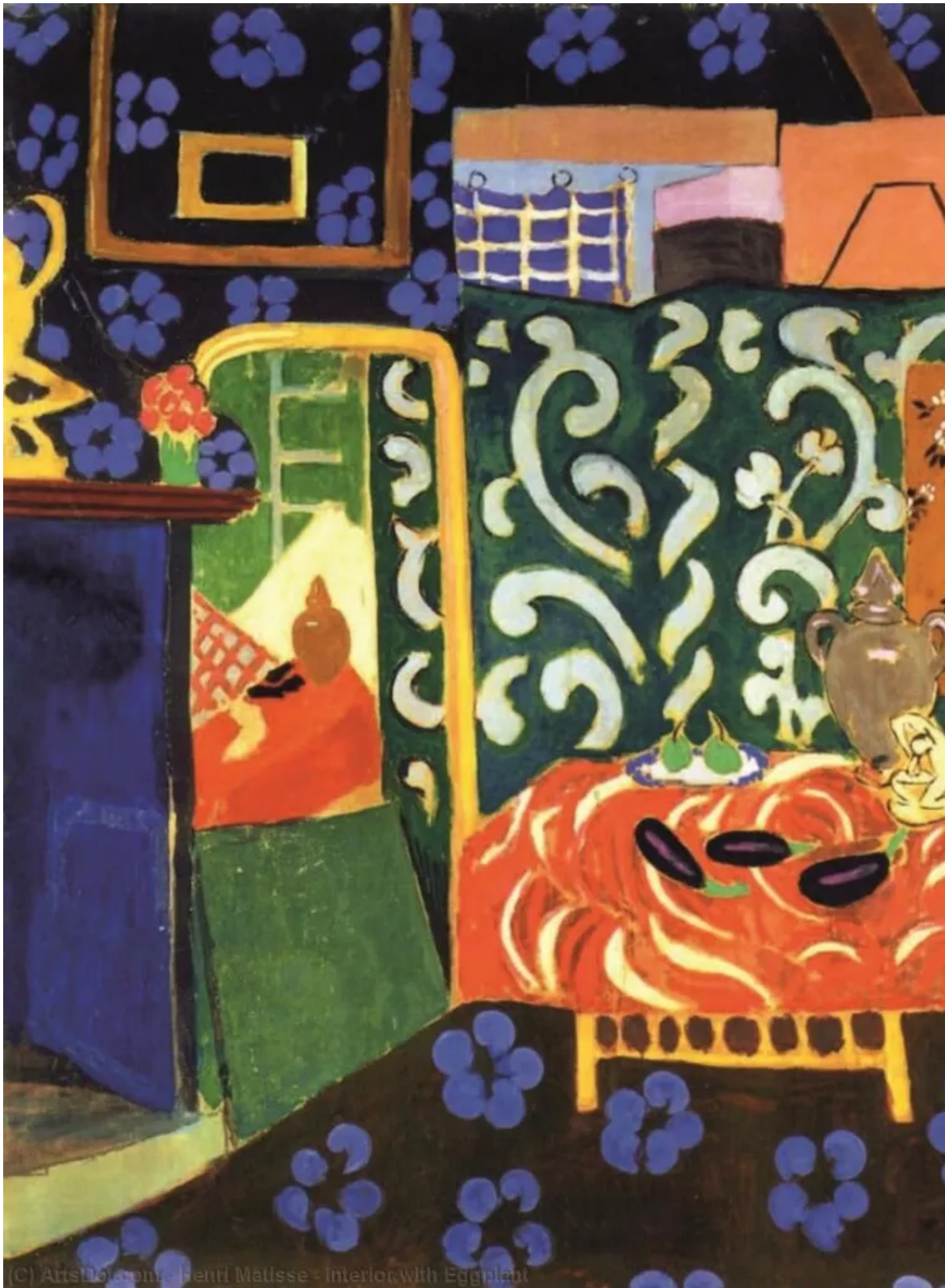
Henri Matisse - Interior with Eggplant