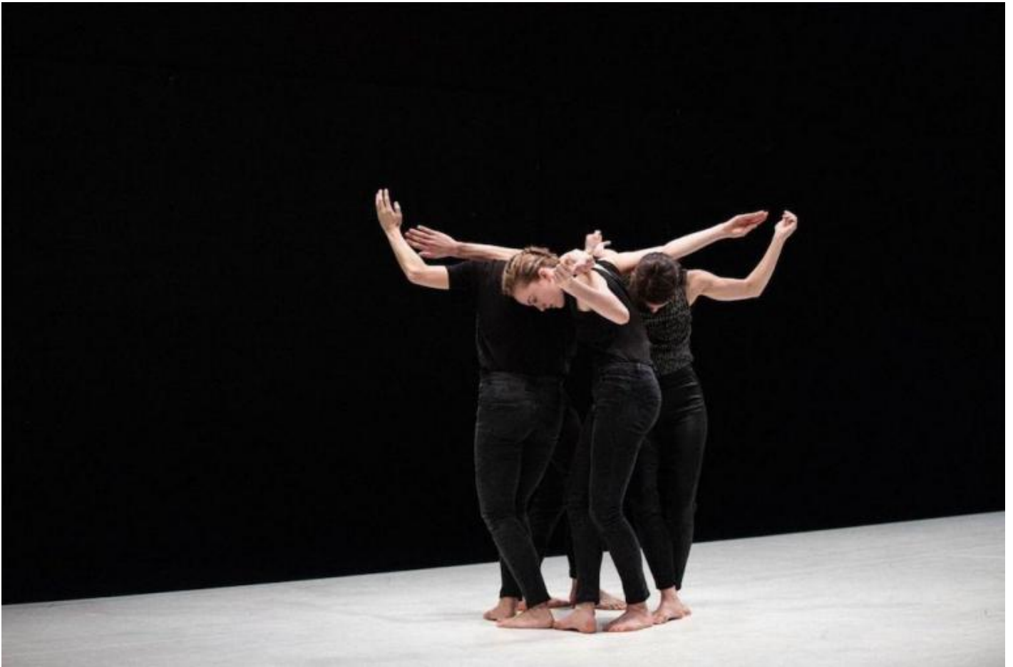
La Ronde / Quatuor, di Yasmine Hugonnet.