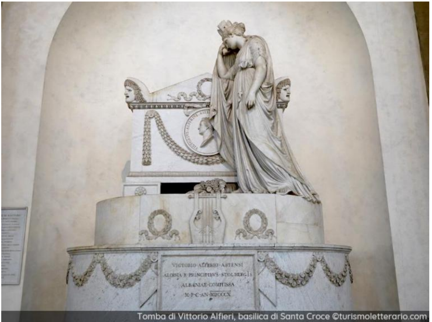
Tomba di Vittorio Alfieri, basilica di Santa Croce

Sarà la prima di una lunga serie di statue che, specie dopo l'unificazione, avrebbero popolato le piazze delle città della penisola, modificandone la toponomastica. Nel frattempo, a proposito di tombe, quella di Ravenna diventava tappa irrinunciabile del viaggio in Italia, assecondando la fascinazione romantica per i sepolcri: dopo Alfieri, vi faranno tappa, tra gli altri, Byron, Shelley, Chateaubriand, de Musset, James. Alla vigilia dell'unificazione, dunque, Dante era già «l'Italiano più italiano che sia stato mai», come scriveva Cesare Balbo, primo presidente del consiglio del Regno di Sardegna, nel 1853.