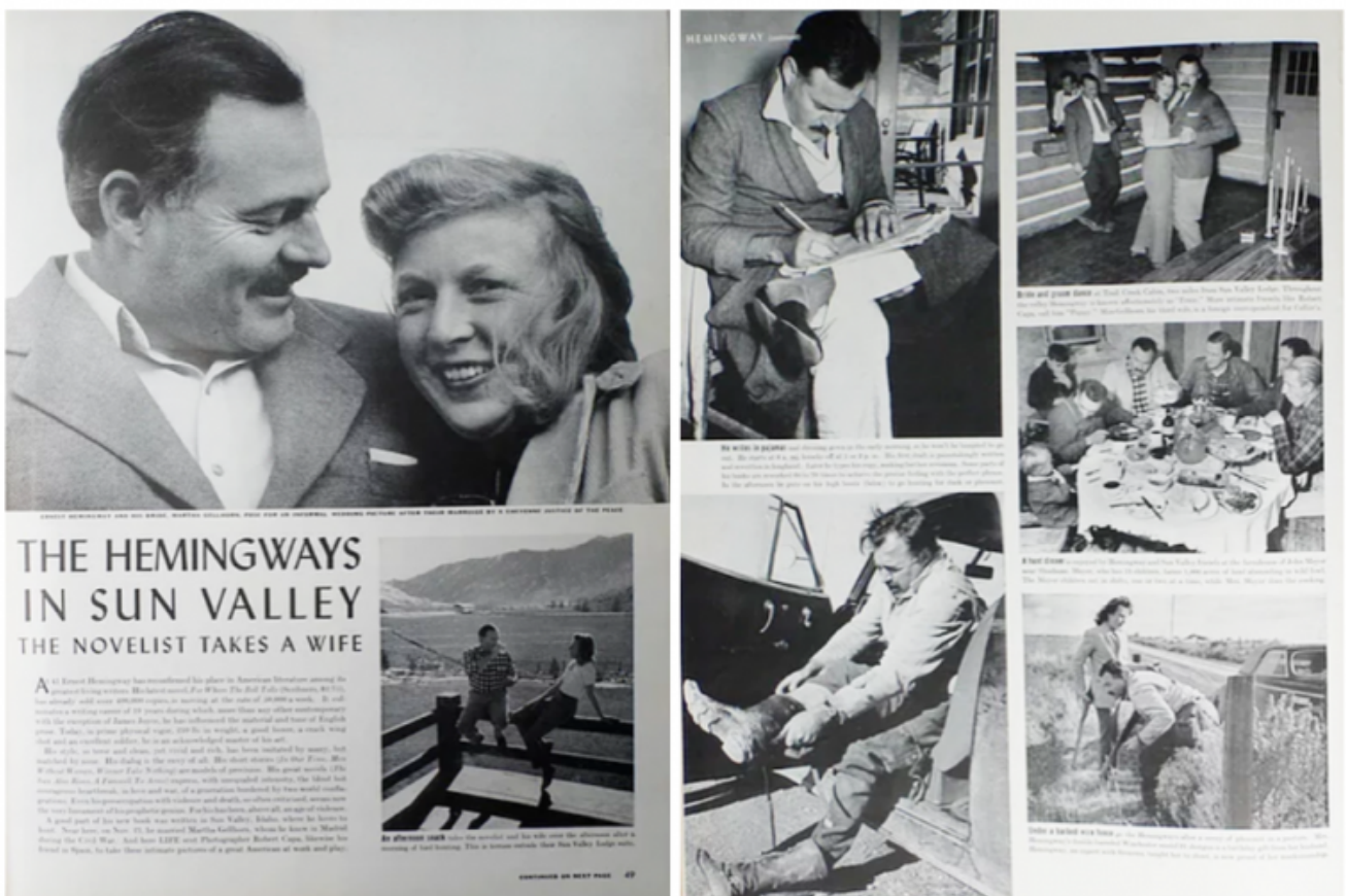
Reportage di Robert Capa pubblicato sul settimanale Life . Gennaio 1941.

La trasposizione cinematografica avrebbe fatto infuriare lo scrittore al punto di essere stato vicino a rompere l'amicizia con Cooper per aver accettato i compromessi della sceneggiatura (comunque i due rimasero sempre vicini e il ventennale sodalizio tra lo scrittore e l'attore è stato raccontato nel film documentario The True Gen , del 2013). Il pubblico fu però di diversa opinione, e il film ebbe un successo strepitoso, con gli uomini che si commuovevano davanti all'eroismo di Cooper (il senatore John McCain disse che il personaggio di Jordan era stato il suo idolo giovanile), e fra le signore divenne di gran moda il taglio di capelli "alla Bergman". La pellicola ricevette anche ben nove nomination all'Oscar (1944), vincendone solo una per Katina Paxinou come migliore attrice non protagonista, mentre quello stesso anno l'Oscar come miglior film lo vinse Casablanca , pellicola in cui, anche lì, aveva recitato Ingrid Bergman.