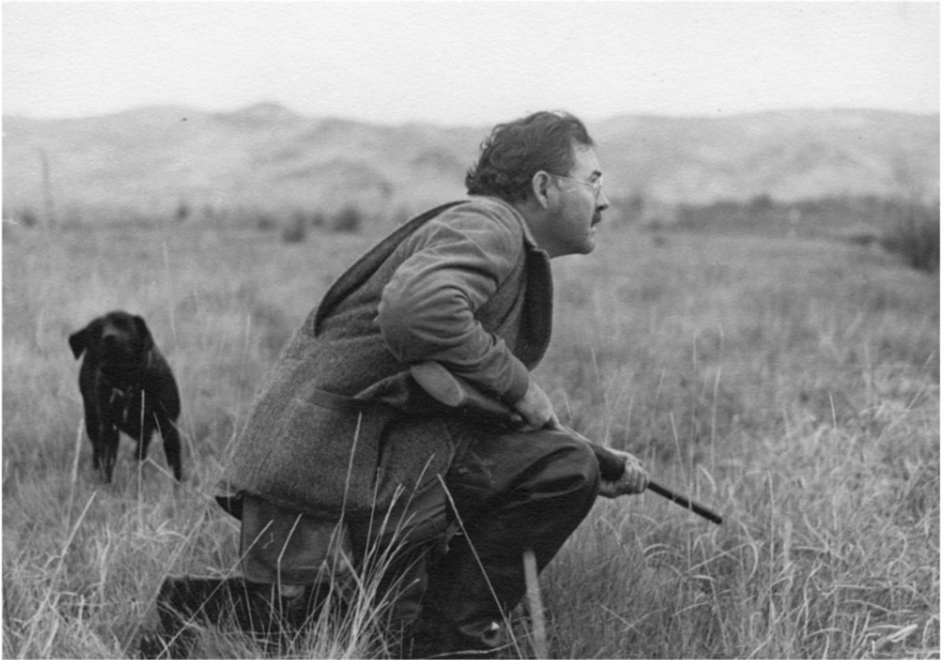
Ernest Hemingway a caccia di anatre a Ketchum, Idaho. Ottobre 1941.