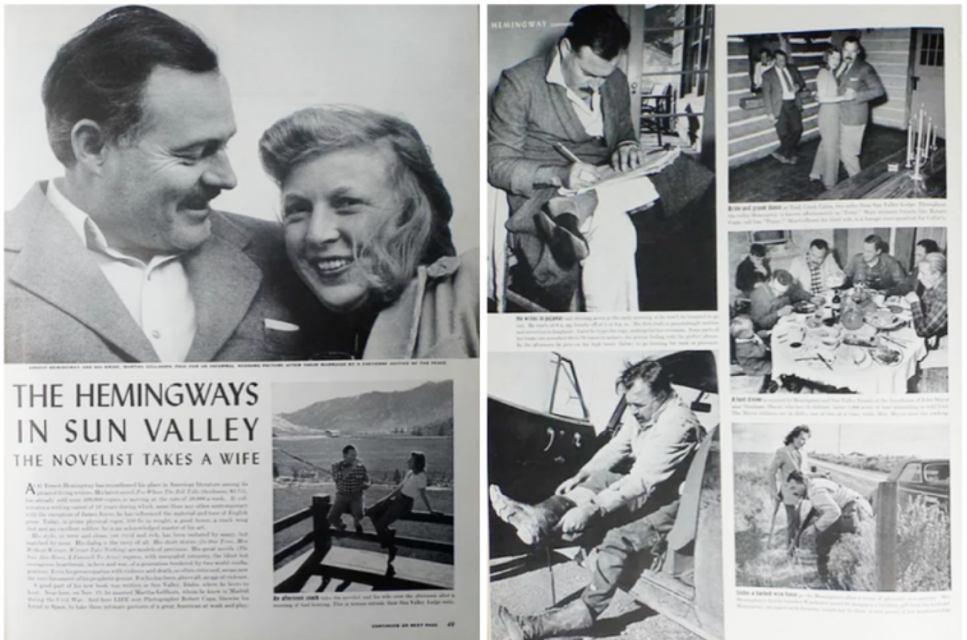
Reportage di Robert Capa pubblicato sul settimanale Life . Gennaio 1941.

una per Katina Paxinou come migliore attrice non protagonista, mentre quello stesso anno l'Oscar come miglior film lo vinse Casablanca , pellicola in cui, anche lì, aveva recitato Ingrid Bergman.