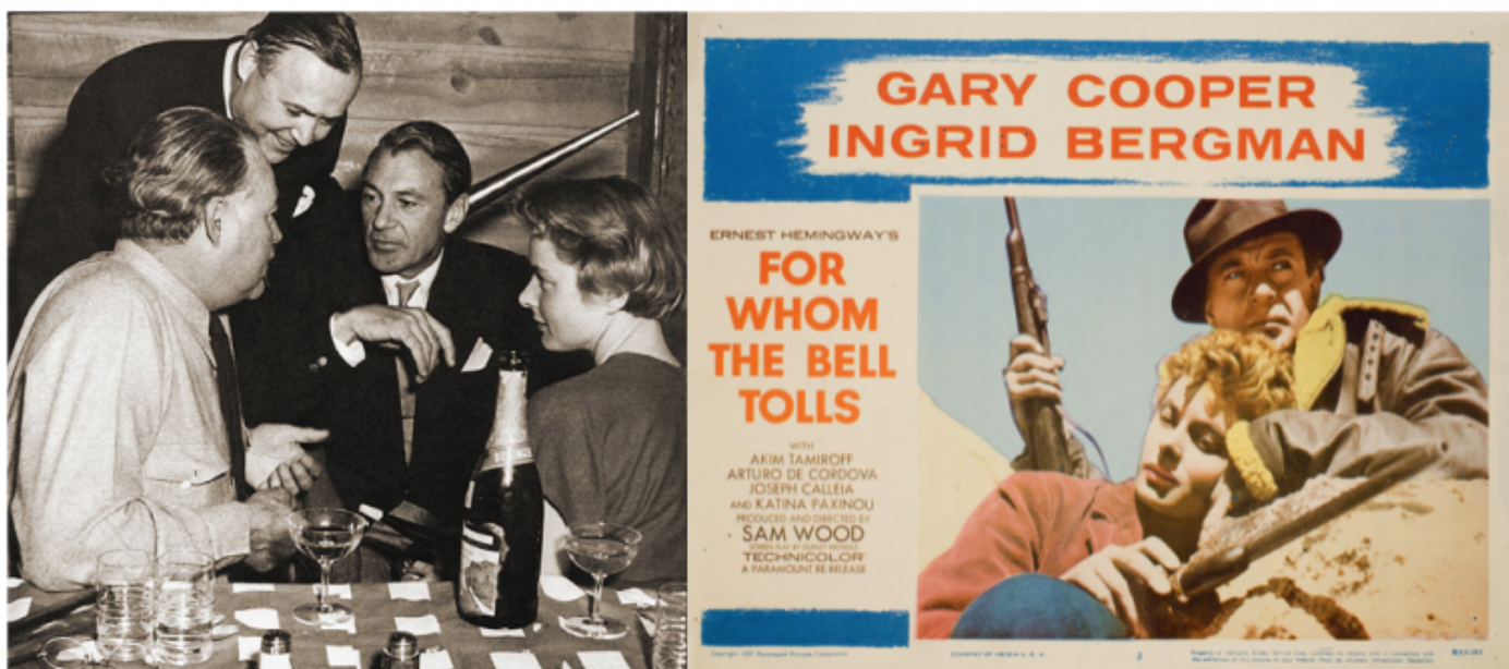
Ernest Hemingway a cena a Ketchum con Gary Cooper e Ingrid Bergman reduci dal successo di pubblico del film Per chi suona la campana , candidato a ben nove premi Oscar.