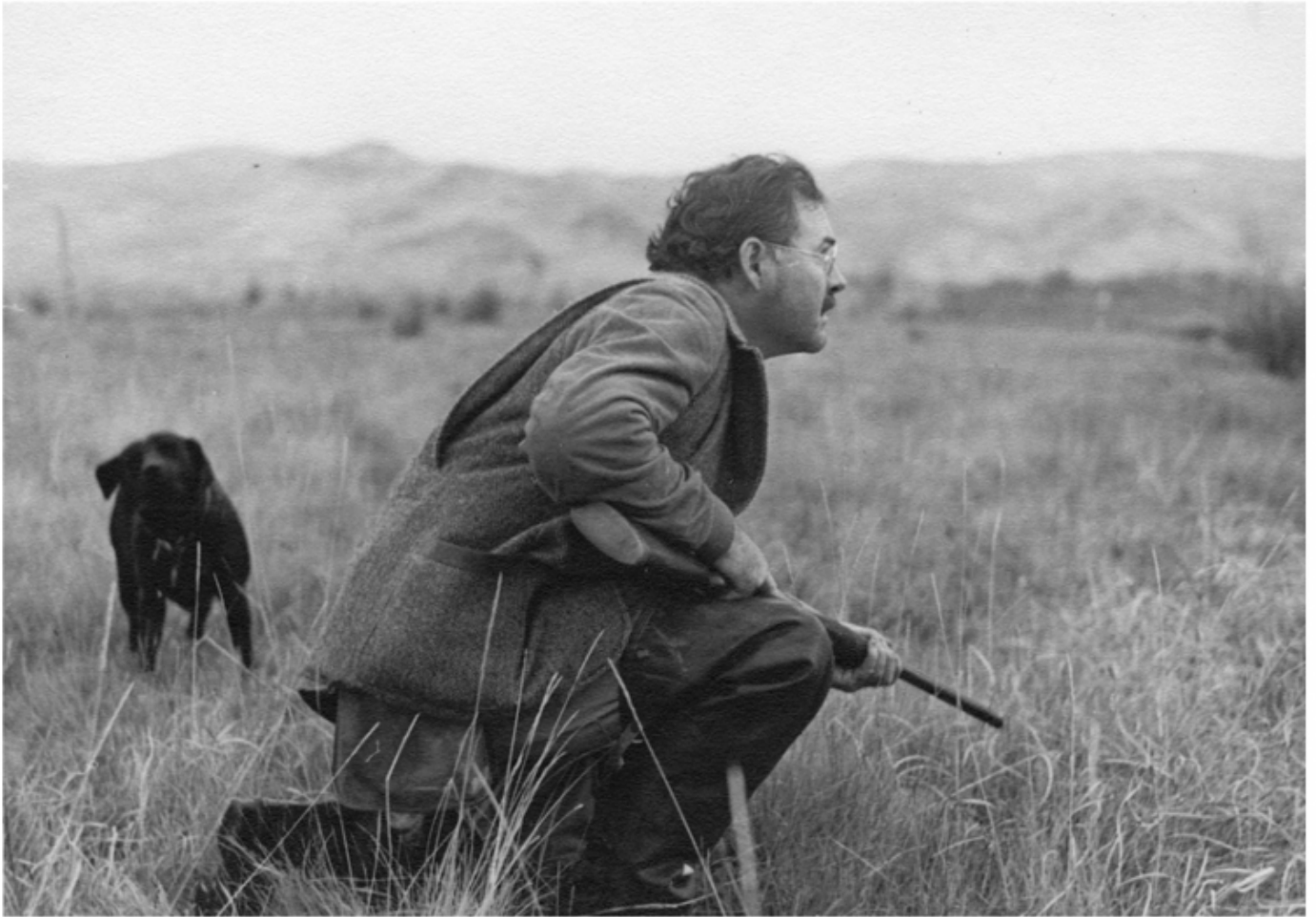
Ernest Hemingway a caccia di anatre a Ketchum, Idaho. Ottobre 1941.