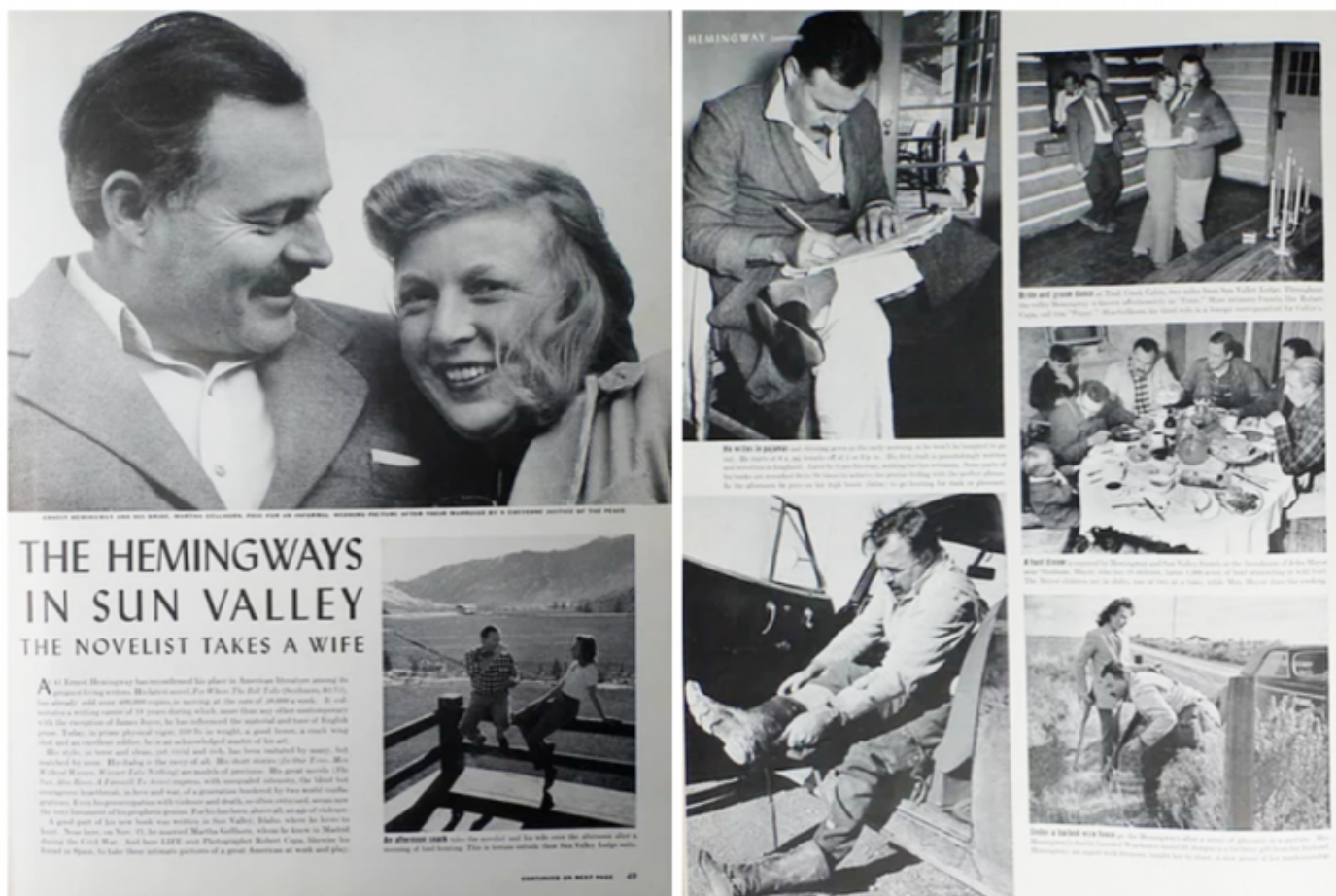
Reportage di Robert Capa pubblicato sul settimanale Life . Gennaio 1941.

una per Katina Paxinou come migliore attrice non protagonista, mentre quello stesso anno l'Oscar come miglior film lo vinse Casablanca , pellicola in cui, anche lì, aveva recitato Ingrid Bergman.