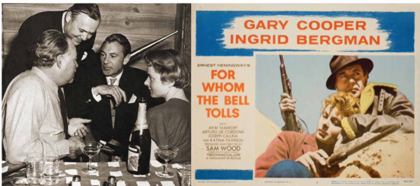
Ernest Hemingway a cena a Ketchum con Gary Cooper e Ingrid Bergman reduci dal successo di pubblico del film Per chi suona la campana , candidato a ben nove premi Oscar.