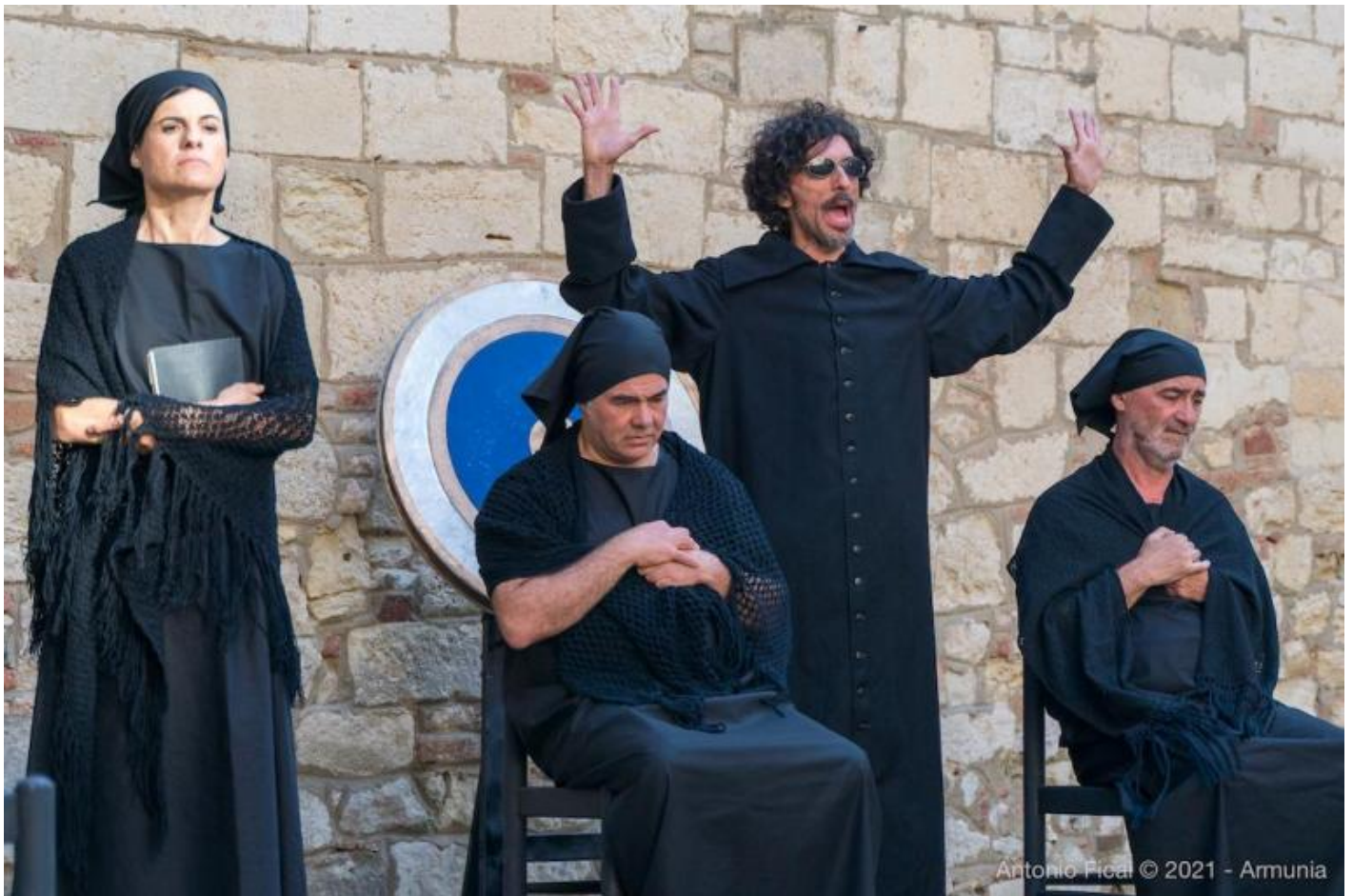
I sette contro Tebe secondo i Sacchi di Sabbia.