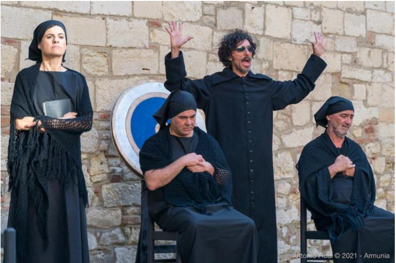
I sette contro Tebe secondo i Sacchi di Sabbia.

I sette contro Tebe di Eschilo sono riletti dai Sacchi di Sabbia con la regia di Massimiliano Civica nella corte del castello di Rosignano, che fu fattoria del vescovo; un castello addomesticato, con muri antichi, una chiesa, appartamenti, il sacrista alla finestra. La tragedia è lutto, ma le donne del coro, due lamentatrici, in realtà uomini in travesti, non ne possono più di piangere, piangere. Un nuovo conflitto entra in scena: tra pura tragedia e forma commedia, congeniale con studiate sgangheratezze all'umorismo della compagnia pisana. Il tragico viene smontato e poi irrompe, congelando la risata, che torna a sradicare il lutto, in un contrasto tra le popolane prefiche lamentatrici, la corifea e l'autore in persona, allampanato, abbigliato con una vecchia zimarra. Il soggetto diviene una godibile riflessione su come raccontare una storia, in conflitto e mescolanza tra linguaggio elevato e inflessioni dialettali campane, con leggerezza e perfino 'goliardia', nel senso di smottamento dalla classicità paludata, dalla curialità tragica. La guerra e i suoi orrori diventano conflitto tra pupazzetti di pezza, con scudi che sembrano bersagli, fino alla reciproca uccisione dei due fratelli figli di Edipo, Eteocle e Polinice, archetipi dell'odio insito nell'abbraccio e dell'abbraccio nell'odio.