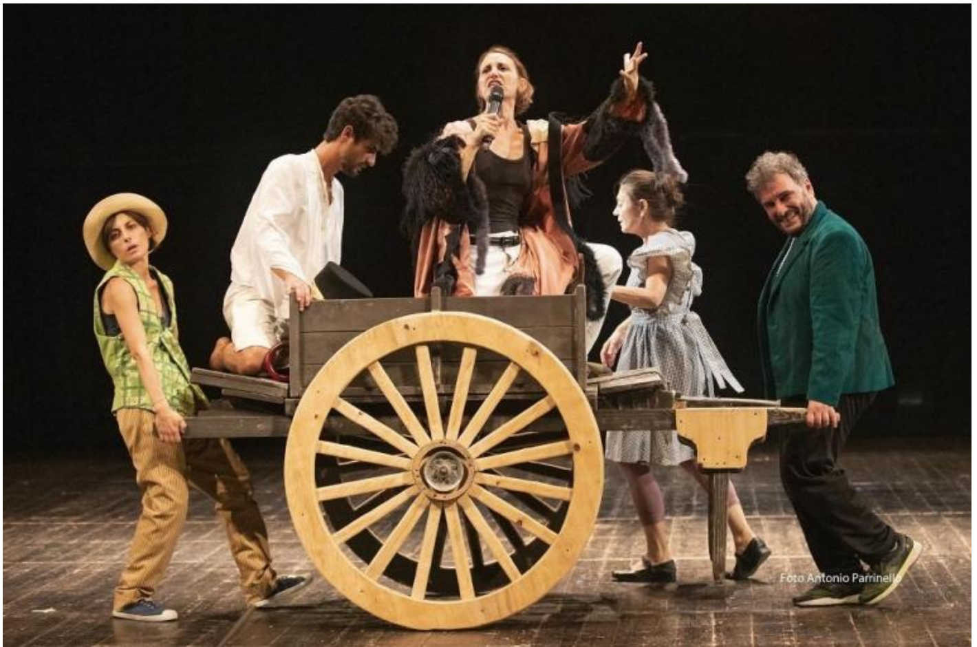
Pinocchio da Scaldati, regia di Livia Gionfreda.

Qualcosa di simile vediamo la sera in un cortile del centro settecentesco, in uno spettacolo costruito su un testo inedito di Franco Scaldati, un suo Pinocchio in palermitano stretto. Nel pomeriggio alcune conversazioni hanno fatto il punto su questo poeta che lasciò, morendo nel 2013, più di 60 opere tra testi e copioni, scritture anomale in cui spesso a una parola, magari ripetuta più volte, è dedicata un'intera pagina. Scaldati amava il frammento, i suoi erano i testi mai conclusi, come la saga di Totò e Vicè, barboni e anime magiche provenienti da qualche aldilà. Scaldati era demiurgo di una lingua in cui il dialetto esplorava le proprie radici più arcaiche diventando raschio, sprofondamento negli abissi dei suoni, del sistema sanguigno e delle ossa, ricerca dell'origine, violenza e volo, sospensione, pneuma pulsante di corporeità, desiderio, mancanze.