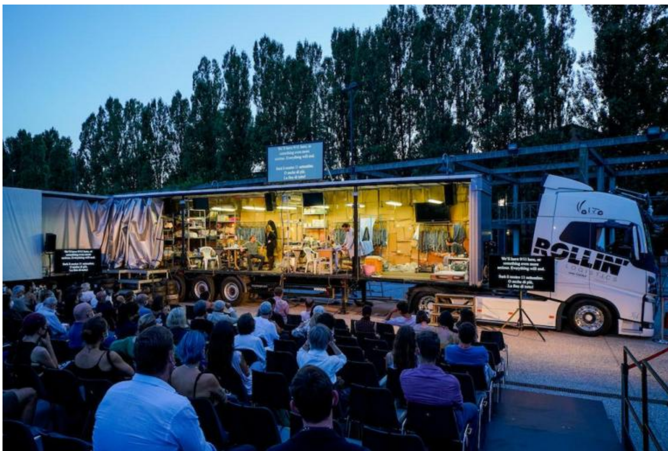
Hard To Be a God di Kornél Mundruczó.

tra realtà naturalistica e incerta impressione su lastra fotografica, impressione di realtà. La risposta attesa arriva nei titoli di coda, ma già la conoscevamo dall'inizio: Un teatro è un teatro è un teatro è un teatro .