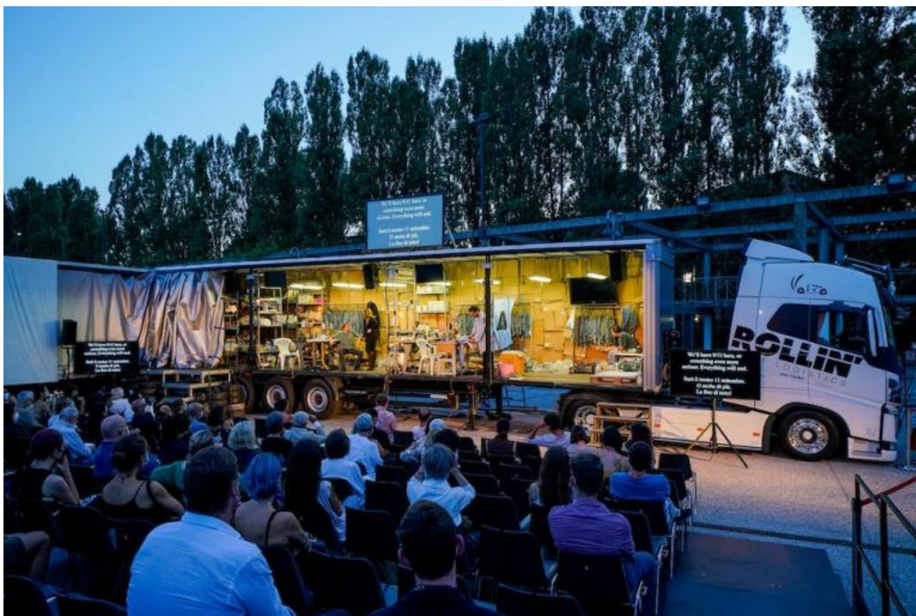
Hard To Be a God di Kornél Mundruczó.

tra realtà naturalistica e incerta impressione su lastra fotografica, impressione di realtà. La risposta attesa arriva nei titoli di coda, ma già la conoscevamo dall'inizio: Un teatro è un teatro è un teatro è un teatro.