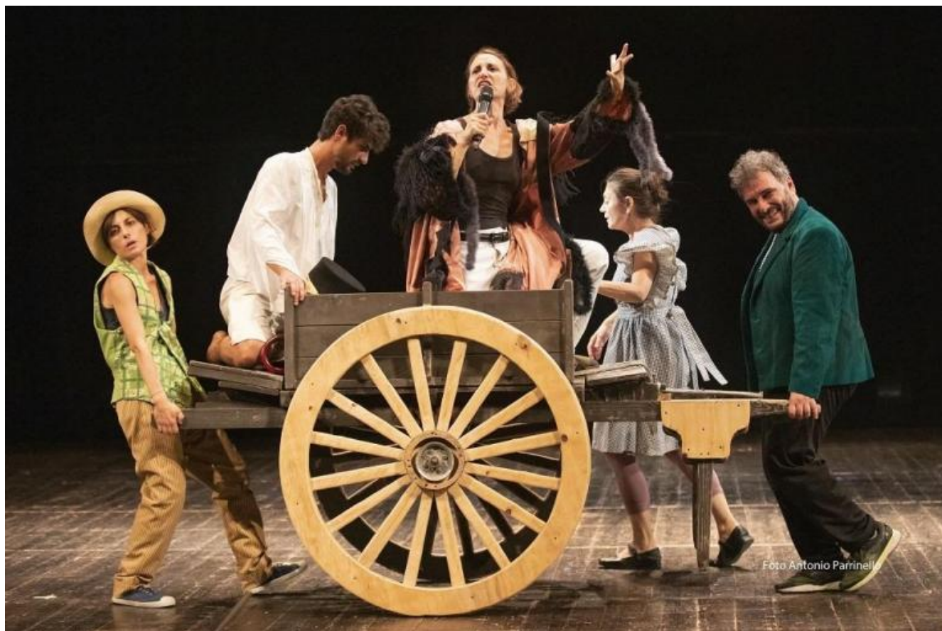
Pinocchio da Scaldati, regia di Livia Gionfrida.

Così è questo Pinocchio , ricomposto e riscritto con acuta e colorata delicatezza dalla regista Livia Gionfrida, una carriera in continente, molto lavoro in carcere, un recente ritorno nella sua Sicilia. Ancora i colori e la cenere. La storia di Pinocchio inizia con un'invocazione al poeta, Scaldati, di cui si sente l'assenza in un mondo di "munnizza". Diventa una recita della compagnia di Mangiafoco, che arriva su un carretto come quella della Contessa dei Giganti della montagna . Anche qui si tratta di un viaggio fantastico, fantasmatico, di fantasmi ritornanti, di voci già sentite, che gridano lo slogamento dei corpi. Geppetto è un povero pazzo, la follia forma la realtà secondo le proprie deformazioni e mancanze. Vorticano il desiderio di paternità, la fuga, i precetti morali, il desiderio di vivere, grilli, fate mature e molto magiche, galline che vengono dal regno dei morti, infinite seduzioni. Certe scene drammatiche sono raccontate come avverrebbe in un crocicchio di rione, come chiacchiere rese enfatiche, gridate e epiche, come pettegolezzi ad alta voce pieni di spavento o indignazione. Pulsano la magia, le botte, il sussurro, la fame e perfino il cannibalismo che tutti pratichiamo, 'mangiando' i figli, digerendo i padri e le madri, introiettando gli altri per essere altri in un colorato Paese dei Balocchi fatto di abiti teatrali. Infinite sono le morti,