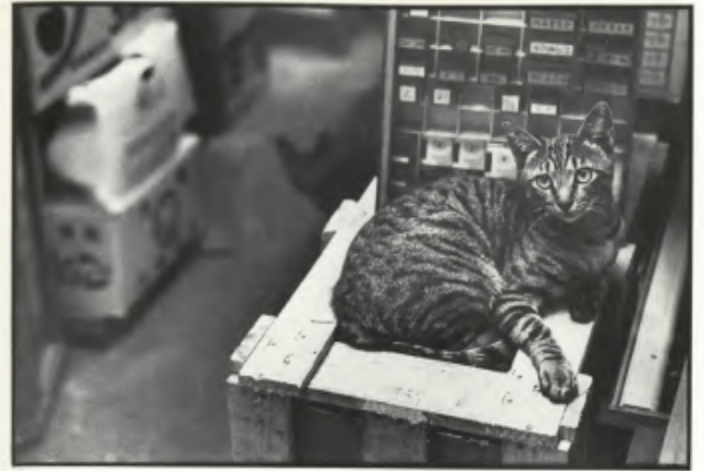
“Le Dépays”, 1982.

Gatti, asceti e – aggiungiamo noi – l’autore del film cui il piccolo bar di Shinjuku deve il nome. Proprio come Whisky, anche Marker è un abile conoscitore delle compressioni spazio-temporali. Non è un caso se quando la Cinémathèque française ha voluto celebrare la sua opera nel 2018, per il titolo della mostra fu deciso «Marker, les 7 vies d’un cinéaste»: sette vite come i gatti, come l’amico Whisky del pianterreno. La mostra è stata l’occasione di riscoprire il percorso di Marker nella sua complessità e multiformità: dai film alle guide di viaggio, dai collage alle escursioni digitali su Second Life. In Italia, l’universo markeriano si è trasmesso attraverso i festival, le retrospettive di Fuori Orario e qualche studio universitario (si pensi in particolare al libro di Ivelise Perniola Chris Marker o Del film-saggio ). A questo puzzle dai mille pezzi mancano ancora tante tessere: molti film non sono mai stati distribuiti, né tradotti in italiano. Per festeggiare i cent’anni dalla nascita del cineasta dalle sette vite, invitiamo qui a scoprire una piccola selezione di questi pezzi mancanti, con lo sguardo rivolto alla costellazione del gatto e alla nebulosa della civetta.