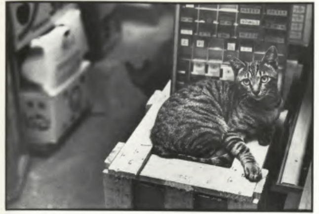
“Le Dépays”, 1982.

Gatti, asceti e – aggiungiamo noi – l’autore del film cui il piccolo bar di Shinjuku deve il nome. Proprio come Whisky, anche Marker è un abile conoscitore delle compressioni spazio-temporali. Non è un caso se quando la Cinémathèque française ha voluto celebrare la sua opera nel 2018, per il titolo della mostra fu deciso «Marker, les 7 vies d’un cinéaste»: sette vite come i gatti, come l’amico Whisky del pianterreno. La mostra è stata l’occasione di riscoprire il percorso di Marker nella sua complessità e multiformità: dai film alle guide di viaggio, dai collage alle escursioni digitali su Second Life. In Italia, l’universo markeriano si è trasmesso attraverso i festival, le retrospettive di Fuori Orario e qualche studio universitario (si pensi in particolare al libro di Ivelise Perniola Chris Marker o Del film-saggio ). A questo puzzle dai mille pezzi mancano ancora tante tessere: molti film non sono mai stati distribuiti, né tradotti in italiano. Per festeggiare i cent’anni dalla nascita del cineasta dalle sette vite, invitiamo qui a scoprire una piccola selezione di questi pezzi mancanti, con lo sguardo rivolto alla costellazione del gatto e alla nebulosa della civetta.