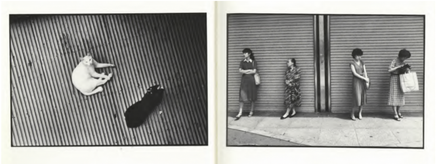
“Le Dépais”, 1982.

A forza di frequentarli, si finisce con l’imparare a guardare come loro. I gatti attraversano l’opera di Marker come compagni di viaggio in grado di suggerirgli verso dove volgere lo sguardo. Nel campo contro-campo tra felino e umano, lo sguardo dell’uno aumenta quello dell’altro, così come già ammesso da Baudelaire ne I fiori del male : «Quando i miei occhi, attratti / come da calamita, dolci si volgono / a quel gatto che amo / e guardo poi in me stesso».