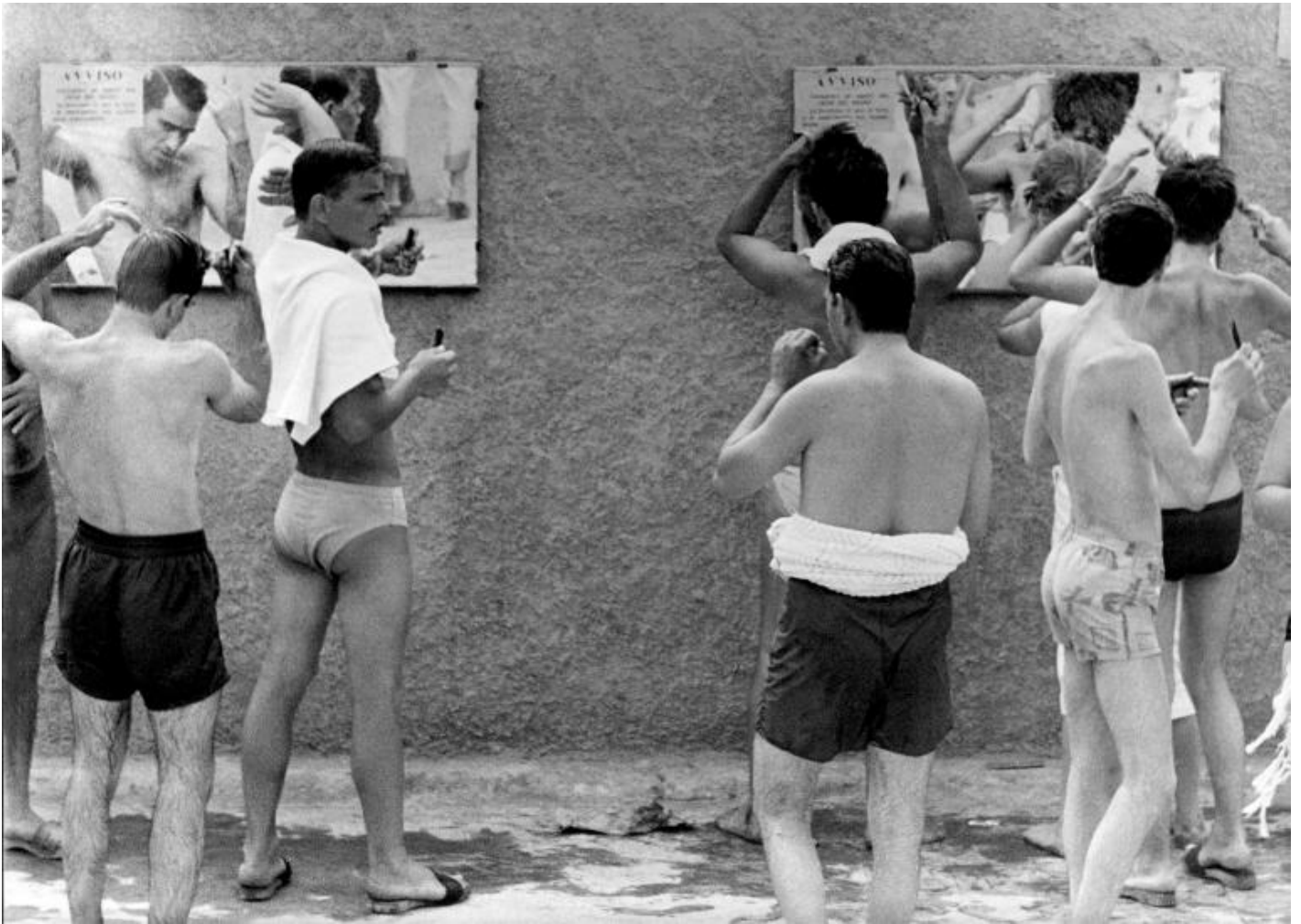
Bagnanti al Lido di Coroglio (Pozzuoli), 1959 © Archivio Fotografico Paolo Di Paolo.

L'Italia è riemmersa dalle macerie e il Boom occupa le cronache come nuova epopea nazionale, capace di riscattare il Paese dalle frustrazioni del fascismo e del primo dopoguerra. Gli italiani sostituiscono la bici con la Vespa, in attesa di salire sulla Seicento. I beni primari sembrano ormai alla portata di tutti, e questo stato di apparente benessere stimola bisogni più "alti": andare al cinema, a ballare, in trattoria, fuori porta, viaggiare, fare le vacanze. Quest'ultima possibilità sta per diventare il vero fenomeno di massa che caratterizzerà il decennio a seguire. E la spiaggia ne è il simbolo.