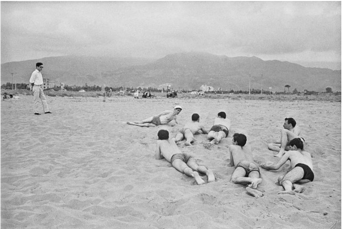
Pier Paolo Pasolini sulla spiaggia del Cinquale (Versilia), 1959

Laddove Di Paolo si sofferma con delicatezza sulla soglia, Pasolini irrompe con una scrittura “corsara” e velenosa. Alla descrizione lirica dei luoghi, alle sue sensazioni, alle emozioni, sin dalla prima puntata, si affianca la denuncia del degrado morale, prima che fisico, che descriverà negli scritti successivi: “Qui c'è la spiaggia del Cinquale. Un mare di memorie, alimentate soprattutto dal mio amico poeta Bertolucci, che viene a villeggiare qui, coi più squisiti dei letterati. Qui ci fu D'Annunzio. Qui tra il '20 e il '30 Huxley scrisse Foglie secche , e Thomas Mann – che faceva fare il bagno nudi ai figlioletti scandalizzando gli italiani – scrisse, indignato, Mario e il Mago . Da queste parti veniva anche Rilke (...). Ora cammino per la spiaggia del Cinquale, fra tutte queste memorie contro quel po' po' di sfondo dei monti della Versilia; e sapete che vedo? Una banda di giovinastri emiliani distesi a pancia in giù a guardare una tedesca, tutti un po' grassi e spennacchiati, con uno che fa l'epilettico per buffoneria”.