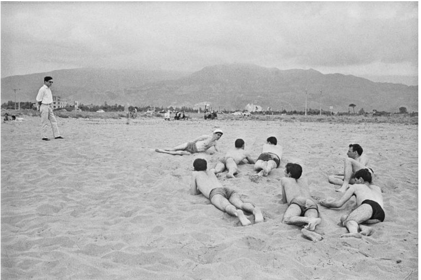
Pier Paolo Pasolini sulla spiaggia del Cinquale (Versilia), 1959

Laddove Di Paolo si sofferma con delicatezza sulla soglia, Pasolini irrompe con una scrittura “corsara” e velenosa. Alla descrizione lirica dei luoghi, alle sue sensazioni, alle emozioni, sin dalla prima puntata, si affianca la denuncia del degrado morale, prima che fisico, che descriverà negli scritti successivi: “Qui c'è la spiaggia del Cinquale. Un mare di memorie, alimentate soprattutto dal mio amico poeta Bertolucci, che viene a villeggiare qui, coi più squisiti dei letterati. Qui ci fu D'Annunzio. Qui tra il '20 e il '30 Huxley scrisse Foglie secche , e Thomas Mann – che faceva fare il bagno nudi ai figlioletti scandalizzando gli italiani – scrisse, indignato, Mario e il Mago . Da queste parti veniva anche Rilke (...). Ora cammino per la spiaggia del Cinquale, fra tutte queste memorie contro quel po' po' di sfondo dei monti della Versilia; e sapete che vedo? Una banda di giovinastri emiliani distesi a pancia in giù a guardare una tedesca, tutti un po' grassi e spennacchiati, con uno che fa l'epilettico per buffoneria”.