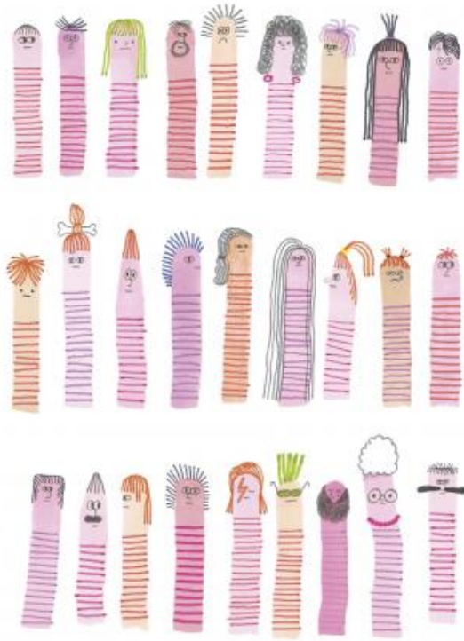
i tagli di capelli e altre piccole cose insignificanti.

Un ideale club di estimatori dei lombrichi non sarebbe certo molto numeroso, ma potrebbe contare tra i suoi soci alcuni nomi illustri. Charles Darwin dedicò ai vermi di terra il suo ultimo trattato, L'azione dei vermi nella formazione del terriccio vegetale (1881; ne ha parlato Marco Belpoliti qui ): a forza di osservarli nei vasi pieni di terra di cui si era circondato, rimase affascinato dal loro comportamento. E si convinse che tutto il terreno dell'intera Inghilterra doveva essere passato più e più volte attraverso i canali intestinali dei vermi. In tempi più recenti troviamo l'inglese Emma Sherlock, che merita di essere citata non solo per il nome suggestivo ma anche in quanto presidente della Earthworm Society of Britain (possiamo vederla vantare le qualità dei vermi in questo servizio della Bbc ).