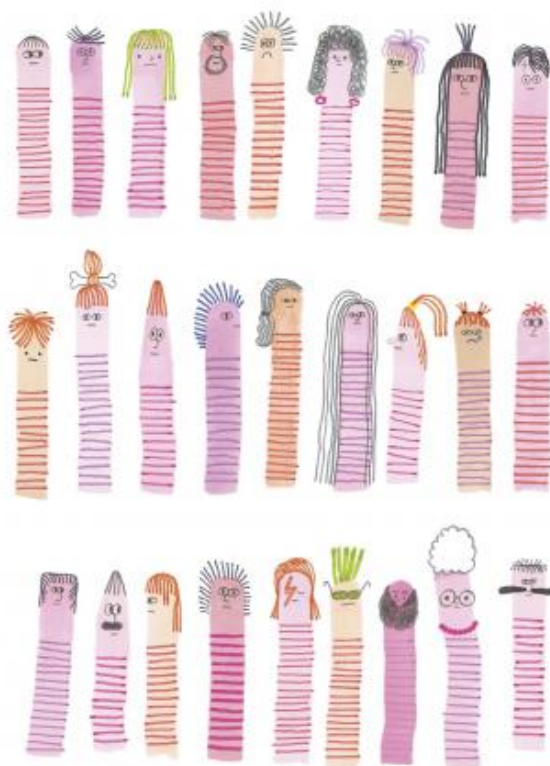
i tagli di capelli e altre piccole cose insignificanti.