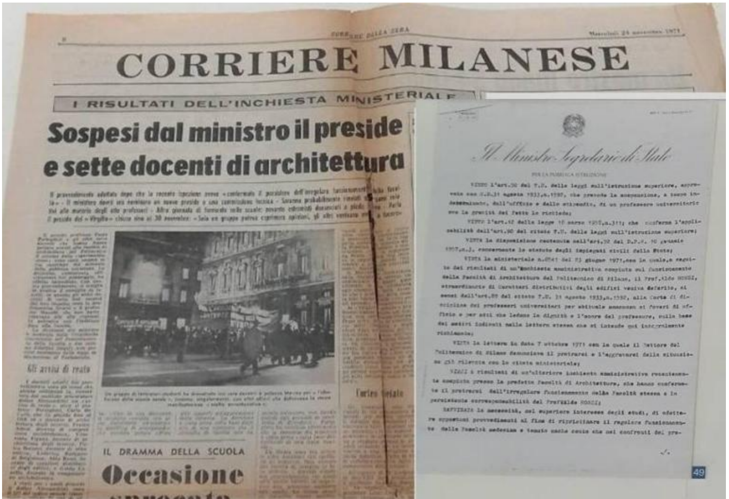
La pagina milanese di Il Corriere della sera del 24 novembre 1971 in cui si dà notizia della iniqua sospensione dei docenti di Architettura, tra cui Aldo Rossi, e dell'allora preside Paolo Portoghesi. Lettera del ministero che comunica ad Aldo Rossi la sua avvenuta sospensione dall'attività di insegnamento al Politecnico di Milano, datata 23 giugno 1971. Entrambi i documenti sono esposti nella mostra romana.

A proposito di questa infame 'cacciata', Aldo Rossi ha così laconicamente annotato nei suoi Quaderni Azzurri (il cui titolo è forse un omaggio alle Note Azzurre di Carlo Pisani Dossi, zibaldone di osservazioni e commenti di varia natura, come queste sue note raccolgono invece pensieri che ruotano soprattutto attorno all'architettura e alla città? È bello pensarlo.):