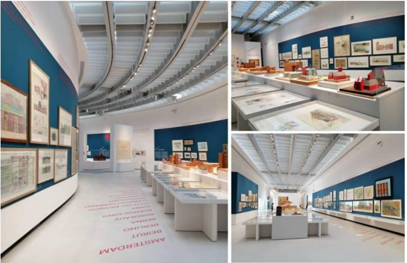
Alcune vedute della mostra in corso al MAXXI Aldo Rossi. L'architetto e le città.

Aldo Rossi. L'architetto e le città è il titolo della mostra, curata da Alberto Ferlenga con il coordinamento di Carla Zhara Buda e realizzata in collaborazione con la Fondazione Aldo Rossi e con l'apporto di Fausto e Vera Rossi e di Chiara Spangaro, visitabile fino al 17 ottobre 2021 al Museo MAXXI di Roma. Tra documenti, carteggi, modelli, schizzi, disegni e fotografie, i pezzi esposti sono più di 800, prevalentemente provenienti dalla Fondazione Aldo Rossi conservata presso il MAXXI stesso.