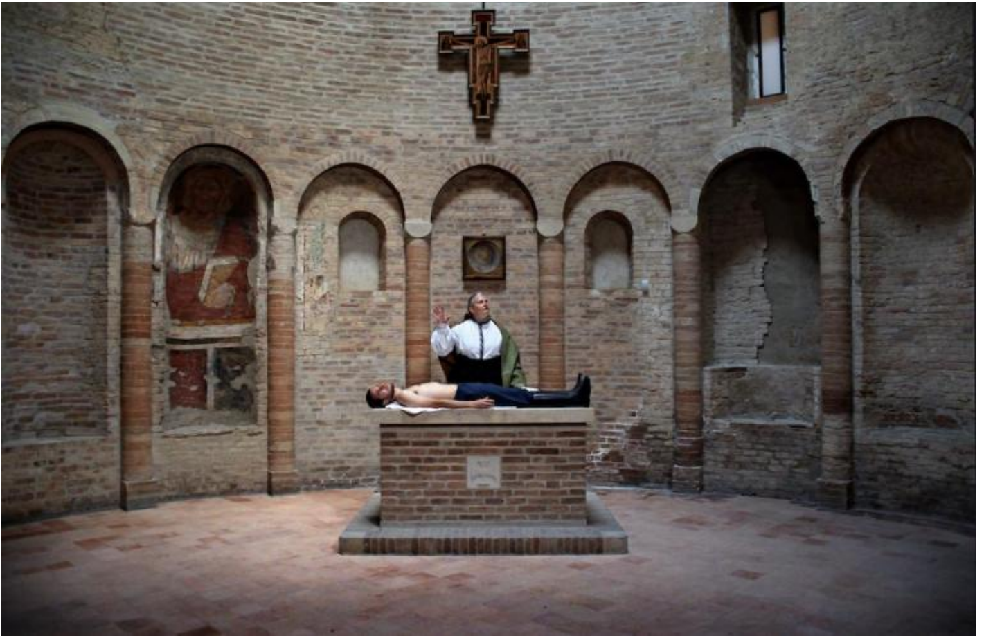
Il volto.

Dostoevskij è stiracchiato nel senso che ne vengono utilizzati brani per ricostruire un proprio viaggio di pensiero, un po' ideologico se vogliamo, che ci parla della sofferenza inflitta all'uomo dall'uomo e della necessità di una redenzione attraverso il fare disarmato dell'Idiota controfigura del Cristo e attraverso l'ingenuità ridente della bambina (mancano, per intenderci, i lati più oscuri del rapporto tra Rogòžin e il principe Myškin).