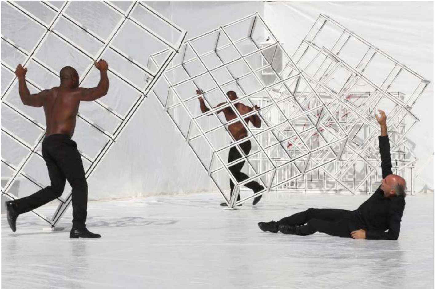
Naturae, ph. Stefano Vaja.

La scena presto si riempie di figuranti, ognuno come un'apparizione fantastica, svincolata da ogni realismo, in un vorticare seducente e stordente: personaggi in antichi abiti sacerdotali, ciechi che indicano il cielo, uomini lanterne, soavi danzatrici rinchiusi nei geometrici parallelepipedi come in piccole celle di vita, scale rosse, uomini libro, corpi in bianco ridipinti nel colore del sangue. È tutto un sogno e un desiderio, cullato dai suoni ripetuti di una musica che in certi momenti occhieggia a cellule tardoromantiche, un pulsare immaginifico che finisce con specchi rivolti agli spettatori, perché, riflettendosi, si guardino a fondo. Ricerca di una meta altrove , indefinita, o, sottilmente, in quel bianco assoluto che come il nero di Emma Dante può alludere alla morte, coscienza che bisogna lasciarsi galoppare e che fissarsi in una meta è impossibile? Con un ultimo possente attore nero che, dopo quasi un'ora di meraviglie, fa girare una di quelle figure geometriche modulari vorticosamente, virtuosisticamente sulle spalle, specchiandosi nel regista che torna a gesticolare, come un iniziato o una persona che si muova in un sogno che non sappiamo dove porterà.