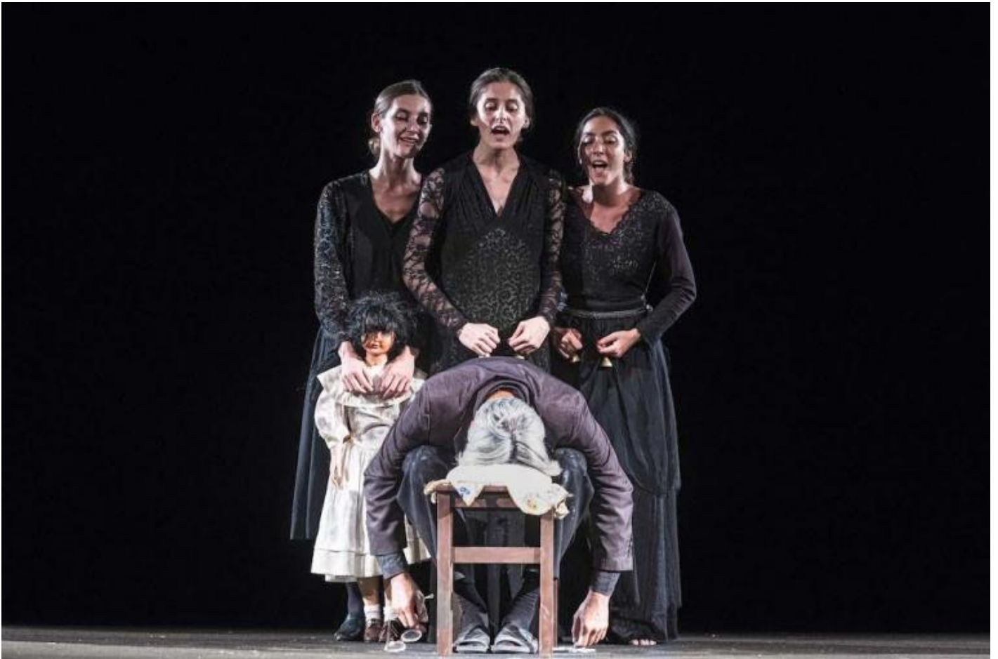
Pupo di zucchero, ph. Ivan Nocera.

Tre spazi molto diversi diventano nodali per la narrazione. In Pupo di zucchero di Emma Dante al centro della scena c'è un vecchio, alle prese con i propri ricordi, intento a preparare un tradizionale pupo di zucchero per la ricorrenza dei morti. E subito intorno a lui, che parla napoletano, con ispirazioni da storie del Cunto de li cunti di Giovan Battista Basile, quei morti, quelle morte, le sorelle, il padre sparito in mare, la madre marsigliese, il parente spagnolo e la sua violenta storia d'amore, zii e zie appaiono, come ricordi, come ossessioni, marcate dalla voglia di vivere e dall'incombere della parca che tutto taglia. Le musiche scatenano i corpi; il desiderio, l'amore che penetrano quella vite trapassate spesso si rovesciano nel loro opposto, in violenza, brama di possesso che mai è amore. Il buio si fa luce, passato che urge nella mente in assenza di vita presente.