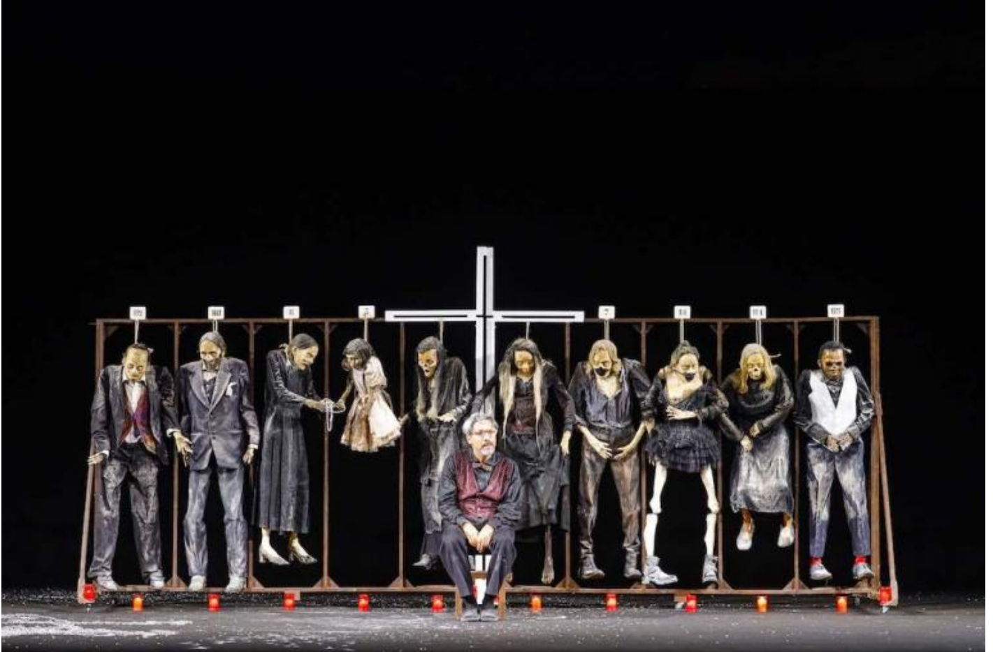
Pupo di zucchero, ph. Ivan Nocera.

tornano esibendo fantocci come proprie controfigure. A un primo sguardo appaiono come i componenti di una classe morta kantoriana, per rivelarsi presto scheletri rivestiti con abiti di tutti i giorni, manichini inquietanti di una vita che fu, come la sequenza di vescovi, monaci, preti, cittadini, adulti, bambini che riempiono la cripta della chiesa dei Cappuccini della Palermo della regista: una teoria di memento mori e di vite depositate che quando visiti quel sito prima guardi con curiosità, poi ammiri, che quindi ti tolgono l'aria e ti costringono a fuggire alla luce.