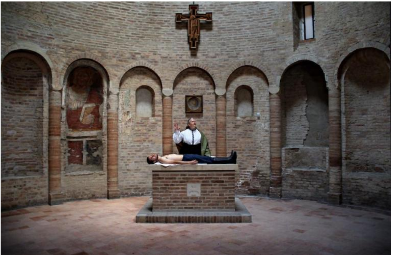
Il volto.

Archivio Zeta fa recitare i suoi figli, i figli dei registi, attori e ideatori Enrica Sangiovanni e Gianluca Guidotti. Un bell'adolescente, una ragazzina pronta a spiccare il volo della preadolescenza, una bambina ridente. Il primo interpreta varie parti di contorno, la seconda la vediamo nella scena sulla città come angelo (sterminatore?), la terza appare nel finale, come promessa di un riemergere bambino alla luce dell'umanità futura, che tutto deve ricostruire dopo tanto buio. Dostoevskij è un po' stiracchiato, pur con quel brano bellissimo sul Cristo di Holbein recitato nella concentrazione d'antico mattone rosso della cappella con incompleti, in parte corrotti, affreschi di apostoli.