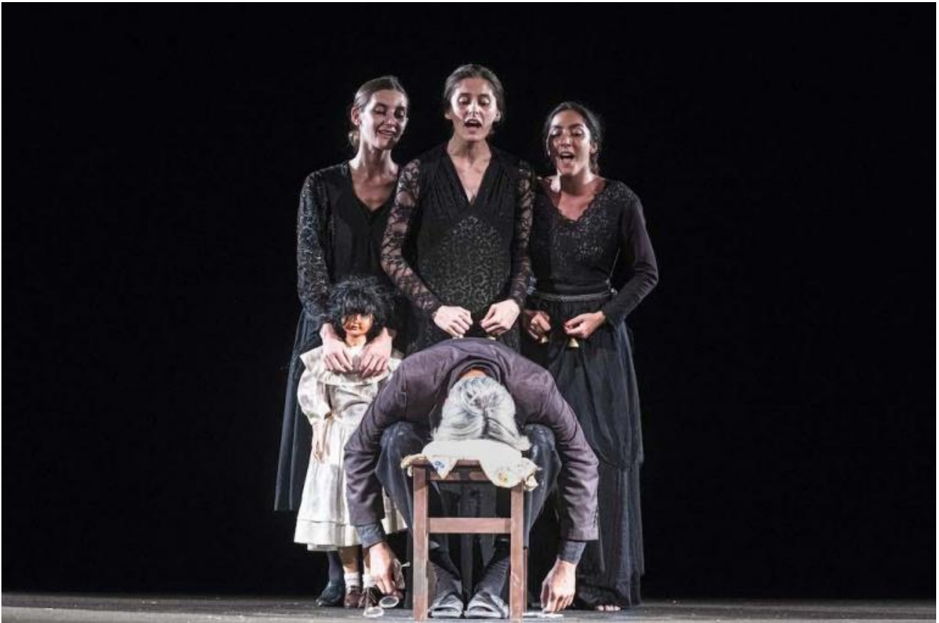
Pupo di zucchero

Tre spazi molto diversi diventano nodali per la narrazione. In Pupo di zucchero di Emma Dante al centro della scena c'è un vecchio, alle prese con i propri ricordi, intento a preparare un tradizionale pupo di zucchero per la ricorrenza dei morti. E subito intorno a lui, che parla napoletano, con ispirazioni da storie del Cunto de li cunti di Giovan Battista Basile, quei morti, quelle morte, le sorelle, il padre sparito in mare, la madre marsigliese, il parente spagnolo e la sua violenta storia d'amore, zii e zie appaiono, come ricordi, come ossessioni, marcate dalla voglia di vivere e dall'incombere della parca che tutto taglia. Le musiche scatenano i corpi; il desiderio, l'amore che penetrano quella vite trapassate spesso si rovesciano nel loro opposto, in violenza, brama di possesso che mai è amore. Il buio si fa luce, passato che urge nella mente in assenza di vita presente.