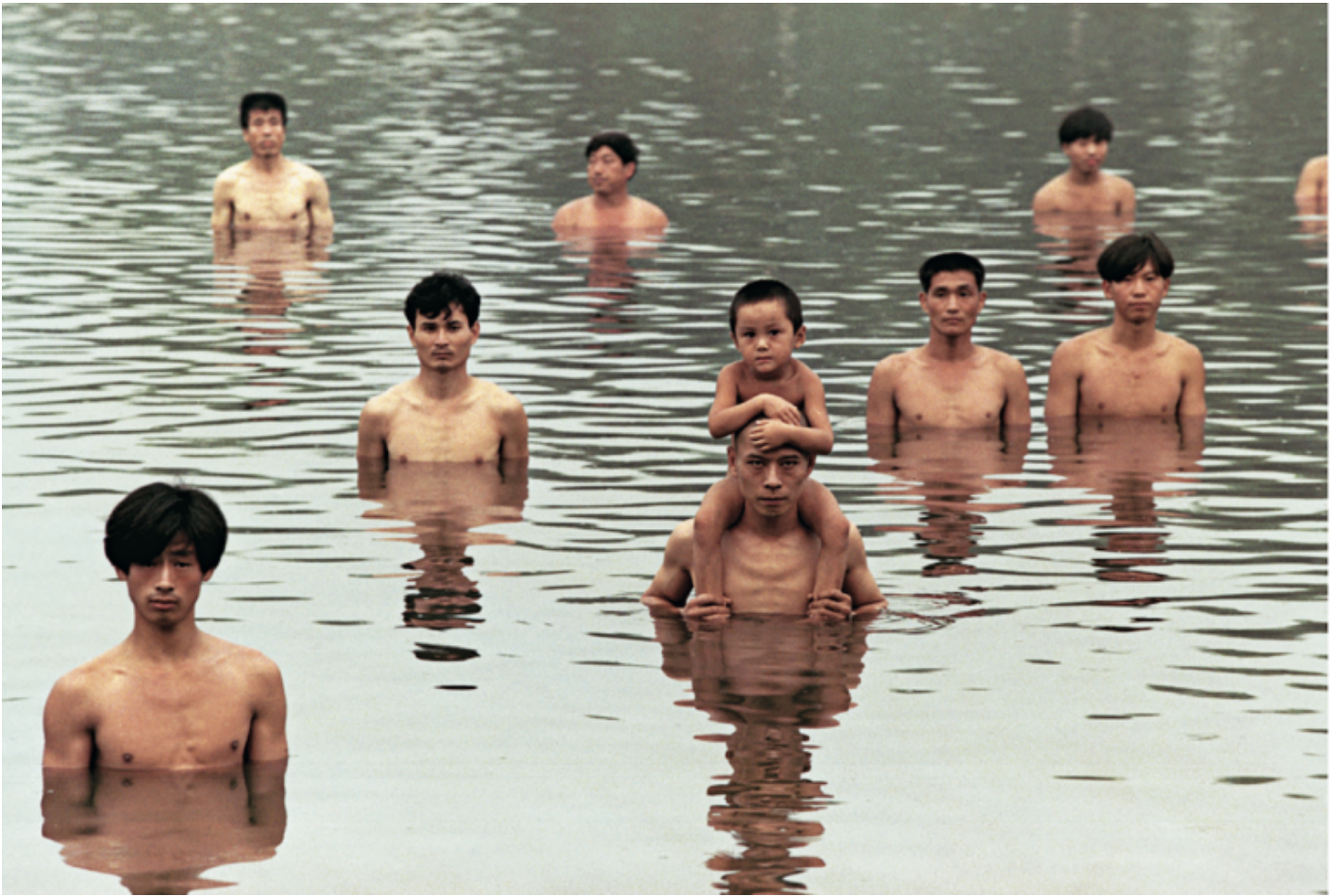
Zhang Huan, To Raise the Water Level in a Fishpond , 1997.

Il comune denominatore di questi artisti e di queste foto è la progettazione e messa in scena di un evento che verrà catturato dallo scatto fotografico. Il focus però non è tanto il concetto-progetto in sé, né l'evento irripetibile in presenza, com'era nell'arte citata, ma l'immagine costruita attraverso un'azione progettata. Un buon esempio è la foto di Zhang Huan (n. 1965): dall'acqua di uno stagno emergono dal petto in su dei giovani nudi, rigidi e immobili, con lo sguardo di sfida allo spettatore come se stessero facendo un'azione eroica di resistenza. In effetti è un gruppo di dissidenti cinesi che sta “alzando il livello della vasca dei pesci”, come recita il titolo della fotografia ( To Raise the Water Level in a Fishpond , 1997). Il titolo trasfigura concettualmente l'immagine, facendola risuonare di un significato ironicamente rivoluzionario. Un'opera più recente scelta da Cotton per questo capitolo è una foto della serie Experimental Relationship realizzata dalla cinese Pixy Lao (n. 1979), nella quale un giovane uomo nudo è disteso su un letto e legato come un involtino: un'immagine che rovescia ironicamente gli stereotipi erotici maschilisti ( Homemade Sushi , 2010).