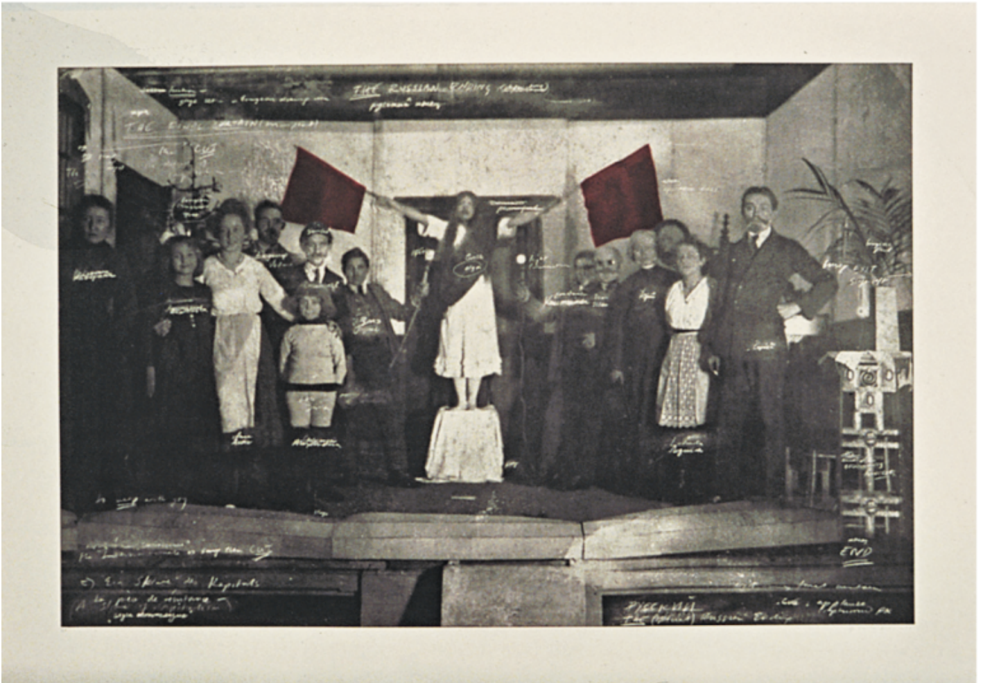
Tacita Dean, Ein Sklave des Kapitals , 2000.

ambiguità di quelle immagini e la loro natura ipotetica: non fatti, ma potenzialità sospese alle interpretazioni dei nostri sguardi di posterì ( Ein Sklave des Kapitals , 2000).