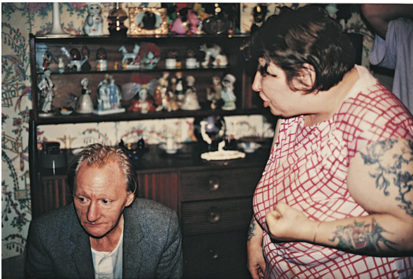
Richard Billingham, Untitled, 1994.

Il capitolo Vita intima – probabilmente tra i più sentiti dall'autrice, attenta alle tematiche femministe e di genere che trovano qui molta eco – presenta una pratica fotografica come «esercizio di patologia, un montaggio e una messa in sequenza di momenti privati apparentemente senza filtri che rivelano le origini e le manifestazioni delle vite emotive dei soggetti». Capostipite di questa pratica è la statunitense Nan Goldin (n. 1953), il cui lavoro documenta con grande intensità ed autenticità le proprie relazioni affettive e amicali. Cotton cita anche l'influenza delle foto di Araki Nobuyoshi (n. 1940), un diario senza censure delle proprie fantasie erotiche, e di quelle di Larry Clark (n. 1943), che negli anni sessanta e settanta ritraeva con grande complicità il nichilismo sex & drug & rock'n'roll dei giovani americani. Un esempio molto efficace, sia per l'espressività delle immagini, sia come paradigma di questa categoria, è la foto dell'inglese Richard Billingham (n. 1970), che aveva cominciato a scattare istantanee della sua famiglia alla Andy Capp – padre alcolizzato, madre obesa e irascibile – come bozzetti per i suoi quadri alla scuola d'arte ( Untitled , 1994). Nel giro di pochi anni le sue foto sono finite in un libro ( Ray's laugh ) e si sono guadagnate una mostra alla Royal Academy.