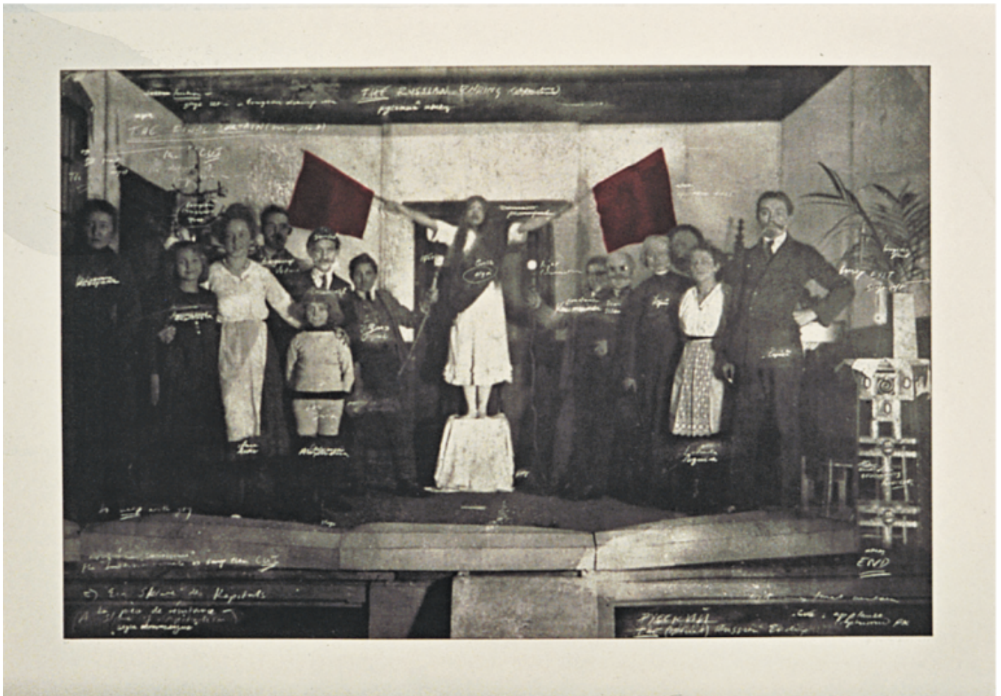
Tacita Dean, Ein Sklave des Kapitals , 2000.

ambiguità di quelle immagini e la loro natura ipotetica: non fatti, ma potenzialità sospese alle interpretazioni dei nostri sguardi di posterì ( Ein Sklave des Kapitals , 2000).