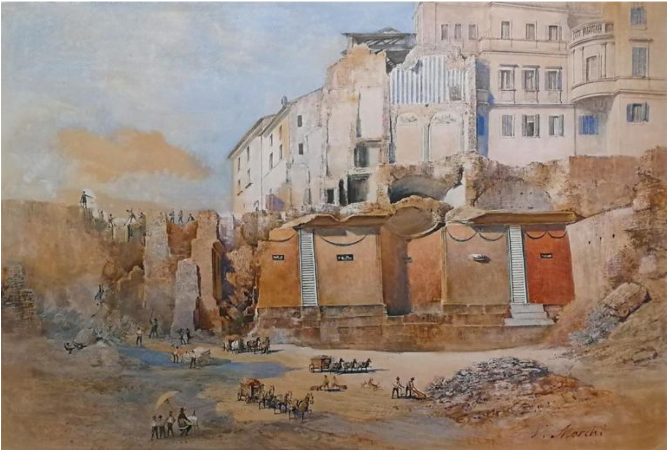
Vincenzo Marchi, Scavi archeologici, 1880-89. Roma, Museo di Roma, Gabinetto delle stampe, GS 2985.

La seconda sezione della mostra Vivere e abitare a Roma tra la fine dell'età repubblicana e l'età tardo-antica: le dimore di lusso e i contesti domestici ricostruisce l'ambiente nel quale sono stati rinvenuti i mosaici. Diversi acquarelli su carta documentano il momento dei ritrovamenti. Suggestivo quello dipinto da Vincenzo Marchi, che rappresenta il ninfeo scavato nella proprietà dei Claudii Claudiani.