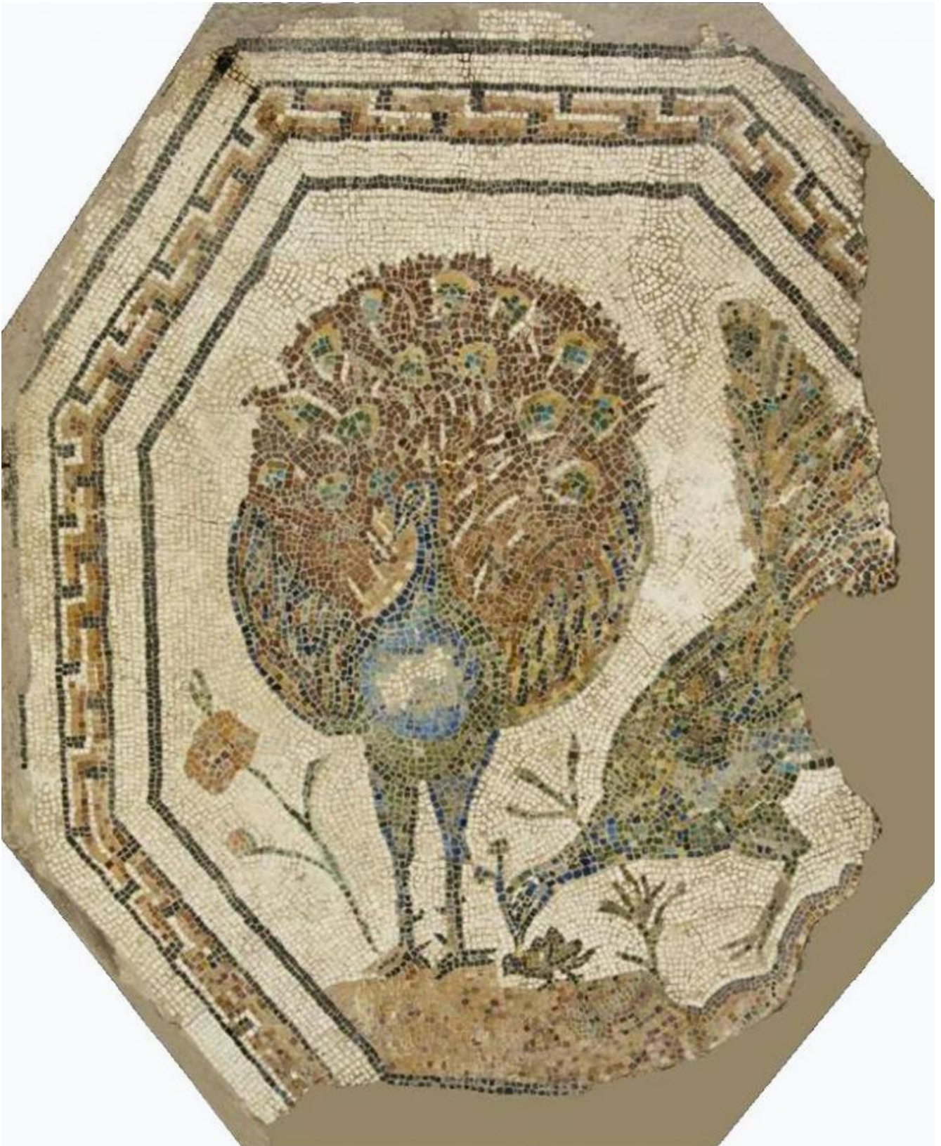
Mosaico policromo ottagonale con pavoni, proveniente da una tomba lungo la Via Appia. Il secolo d.C. Roma, Musei Capitolini, Antiquarium, VM 60.