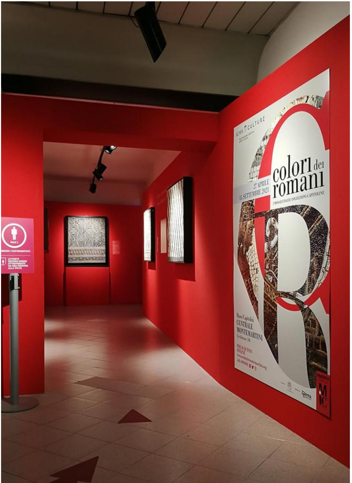
Colori dei Romani. I mosaici dalle Collezioni Capitoline, ingresso della mostra.