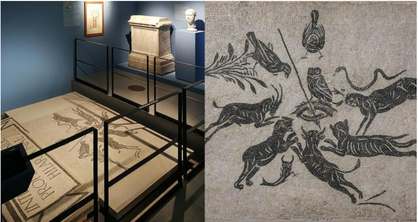
Veduta della sezione Gli spazi del sacro: la basilica Hilariana / Mosaico bianco nero con scena di malocchio. Metà del II sec. d.C. Roma, Musei Capitolini, Antiquarium, AC 4951.

Nella terza sezione Gli spazi del sacro: la basilica Hilariana , sede del collegio dei sacerdoti addetti al culto di Cibele e di Attis, è esposto un mosaico apotropaico raffigurante un occhio umano trafitto da una freccia, sul quale è appollaiata una civetta. Secondo gli studi condotti sul reperto, l'occhio trafitto da un dardo e circondato da una serie di animali sarebbe simbolo dell'invidia. Non è tuttavia chiaro se l'occhio abbia un rapporto anche con quello glaucopide di Atena, che vede nel buio (per questa ragione associata alla civetta) lanciando raggi visivi e luminosi rappresentati a guisa di dardi (Charles Mugler, Sur une polémique scientifique dans Aristophane , in Revue des Études Grecques , 1959). Albert Lejune, Euclide et Ptolome. Deux stades de l'optique geometrique grecque , Louvain, 1948, pp. 18-21 e 59). L'opacità di queste immagini costituisce la profondità stessa del simbolo, perché "il simbolo dà il suo senso in enigma " (Paul Ricoeur, Il simbolo dà a pensare , Morcelliana, Brescia, 2002, p. 19). Il mosaico trovato all'ingresso della basilica Hilariana è un emblema posto al centro di un modo di pensare per immagini con valore simbolico, che spesso ricorrono nei contesti religiosi e funerari.