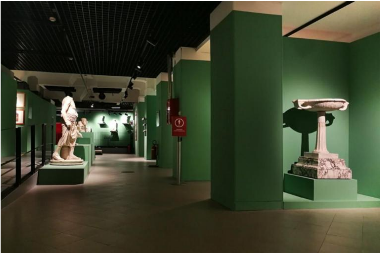
Veduta della seconda sezione della mostra: Vivere e abitare a Roma tra la fine dell'età repubblicana e l'età tardo-antica: le dimore di lusso e i contesti domestici.

Il “vivere alla greca”, che trionfa tra il II e il I secolo a.C., si accompagna alla ricerca del lusso sia nella sfera pubblica che in quella privata. Plinio stigmatizza il trionfo del lusso: “luxuriae gloria”, che consiste nel possedere ciò che può andare perduto in un attimo: “dalla terra abbiamo estratto gli oggetti di murra e di cristallo, resi pregiati dalla loro stessa fragilità [...] questo il vero trionfo del lusso; possedere ciò che potesse andar totalmente distrutto in un attimo” ( Storia Naturale , XXXIII, 5). Con un'acutezza degna di un sociologo ante-litteram, Plinio rileva nella ricchezza la causa della deplorabile deriva del sentire che lega la bellezza alla caducità, criticando gli stili di vita e i modi di abitare del suo tempo.