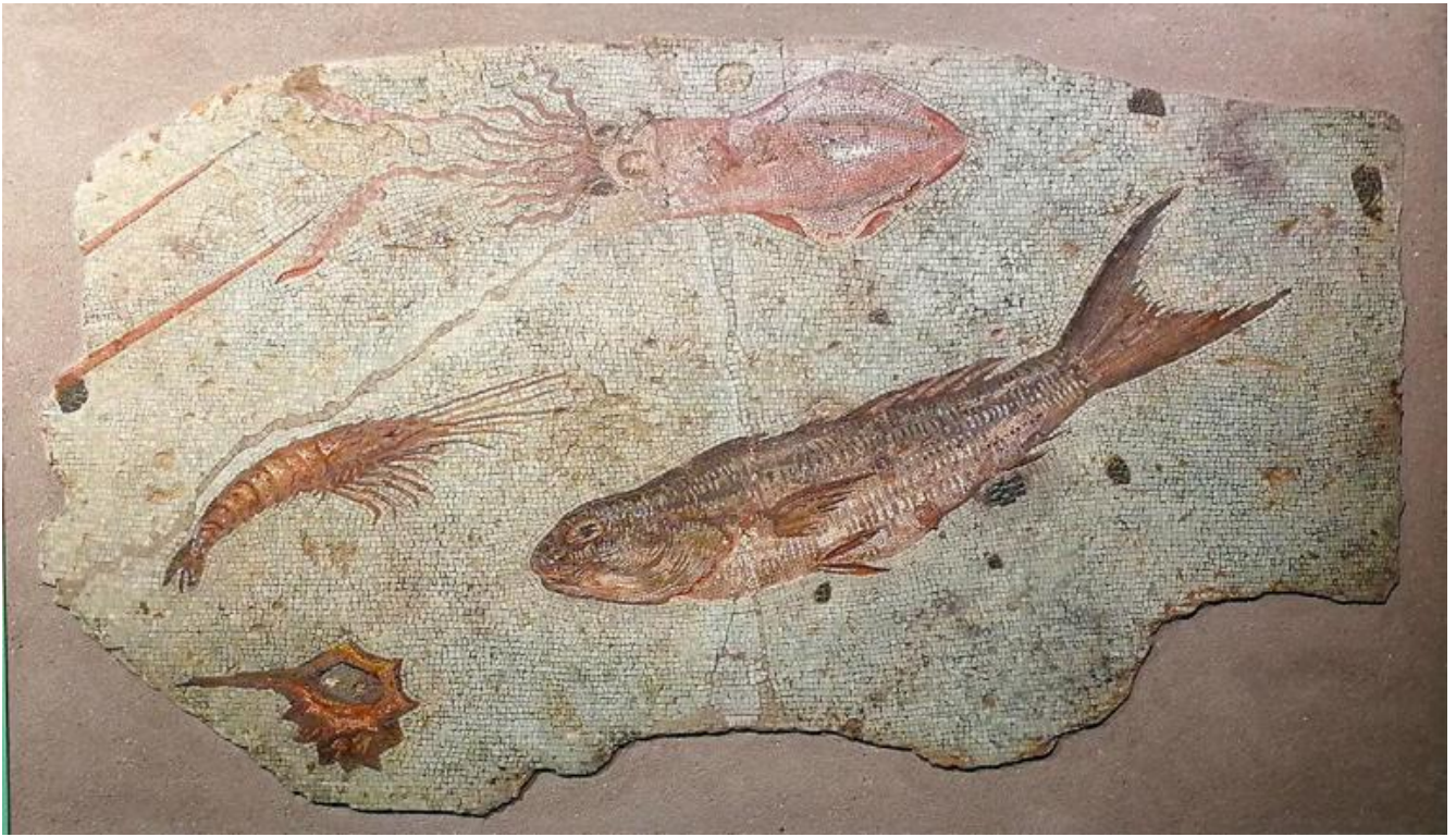
Mosaico policromo con fondale marino. Primo quarto del I secolo a.C. Roma, Musei Capitolini, Centrale Montemartini, AC 323559.

Incantevole il mosaico policromo con fondale marino, nel quale i pesci guizzano lanciando bagliori colorati (notare la tessere azzurre inserite tra l'occhio e la branchia del pesce). Gli effetti luministici e chiaroscurali resi con l'uso di tessere minute sembrano gettare un ponte sull'abisso che ci separa dalla mentalità delle maestranze greche e dei committenti, che tra il II e il I secolo a.C. inaugurarono a Roma la moda di "vivere alla greca", ma il lutto moderno per la perdita di qualcosa che abbiamo amato o ammirato, segnalato da Freud, marca la distanza che ci separa da questi antichi appassionati d'arte, che iniziarono a collezionare mosaici come già prima collezionavano statue e oggetti di lusso di fabbricazione greca.