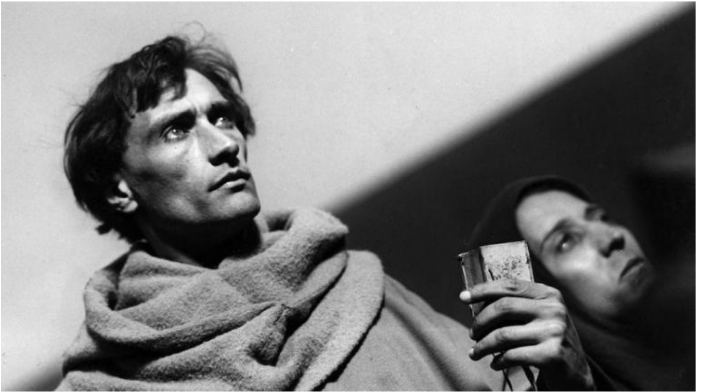
Una scena di Giovanna d'Arco.

Nuovo concetto di cultura, contro il progresso. Alchimia. “La cultura razionalista dell’Europa ha fallito, e io sono venuto nella terra messicana per cercare le basi di una cultura magica che possa ancora far sgorgare delle forze dal suolo indio” (conferenza Surrealismo e Rivoluzione ).