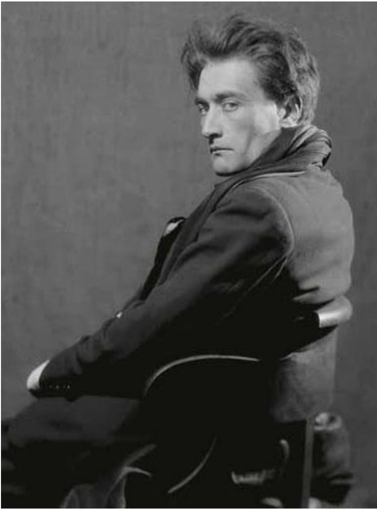
Ritratto di Man Ray.

Perché torniamo a parlare dell'illuminato, del rovinato dal peyote, del visionario che ci ha detto che l'arte non è questione editoriale, spettacolare, di rappresentazione, ma è qualcosa che deve essere ancora inventato, che deve coinvolgere, sconvolgere, mutare, diventare visione , rito , e trasformare in visione e rito gli stessi partecipanti? Qualcosa che deve far tremare e ricongiungere?