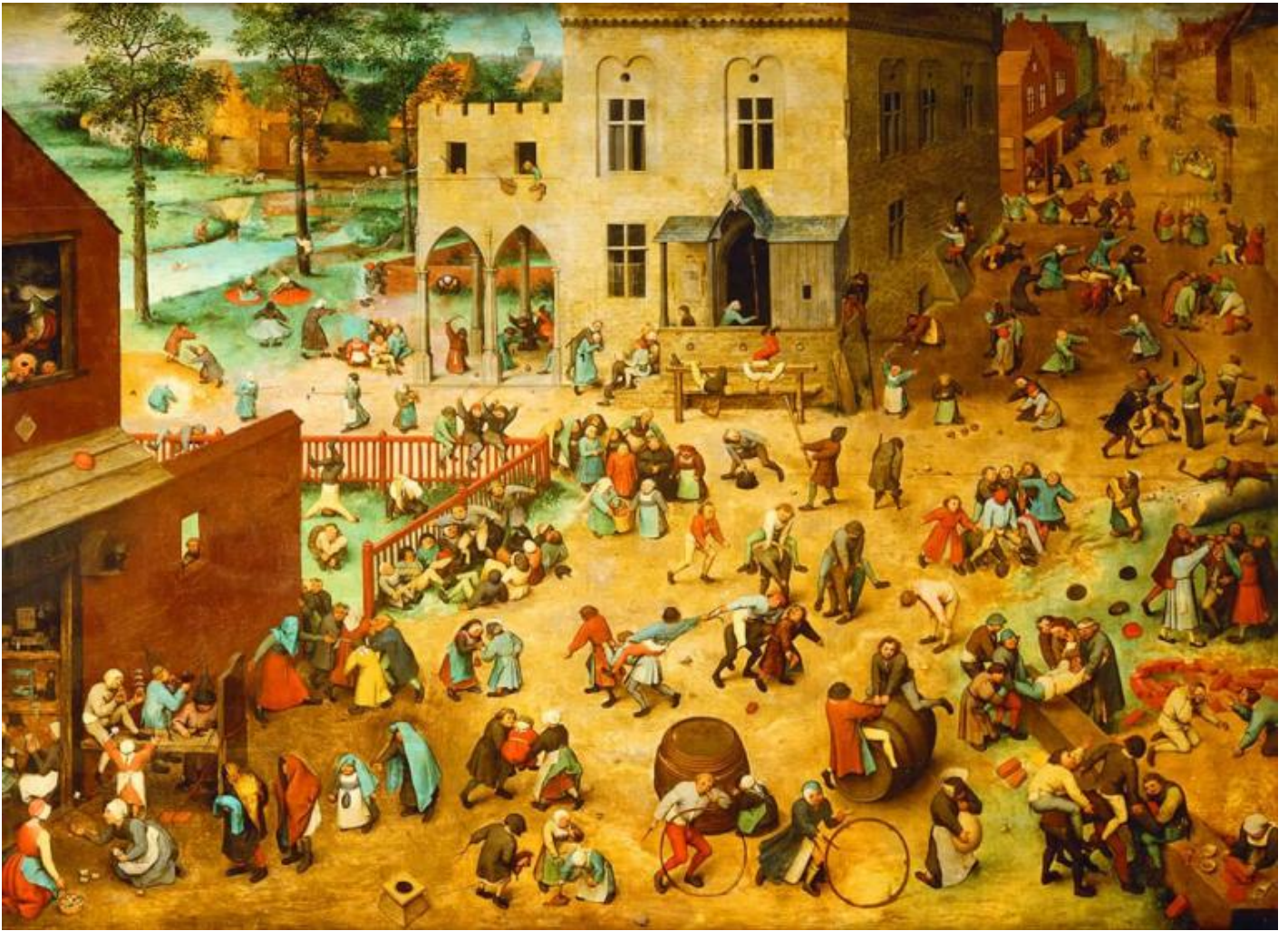
Pieter Bruegel, Giochi di bambini, 1560, Vienna, Kunsthistorisches Museum.

Tra le opere che ritraggono giocatori e giocatrici, le più incantevoli sono indubbiamente quelle che hanno queste ultime come protagoniste.