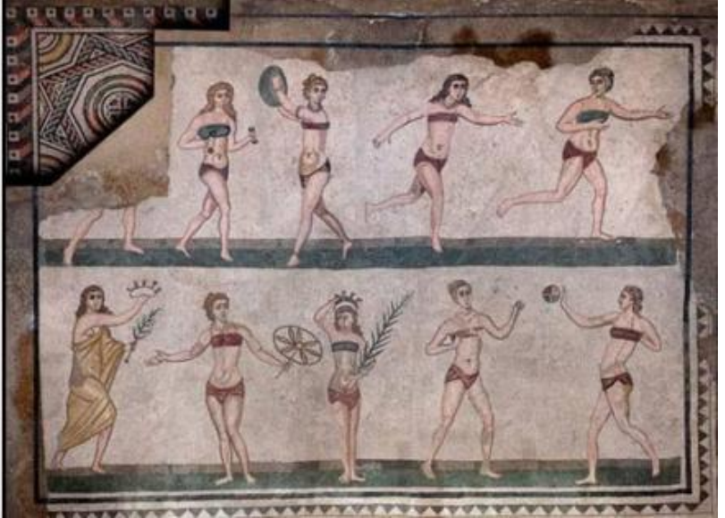
Giocatrici di astragali, terracotta, 340-330, a.C. proveniente da Capua, Londra, British Museum; Piazza Armerina, Villa del Casale, (stanza a S sul peristilio, 12), mosaico con ragazze in bikini intente a giocare, 350 d.c. ca.

D'età romana sono invece le famosissime fanciulle in bikini intente al gioco, ritratte sul mosaico pavimentale della Villa del Casale a Piazza Armerina in provincia di Enna. Questa era una lussuosa villa risalente all'incirca al 350 d.C., che si estendeva su una superficie di 3.500 metri quadrati. Riportata alla luce nel 1950, nel 1997 è stata dichiarata patrimonio dell'umanità dall'UNESCO.