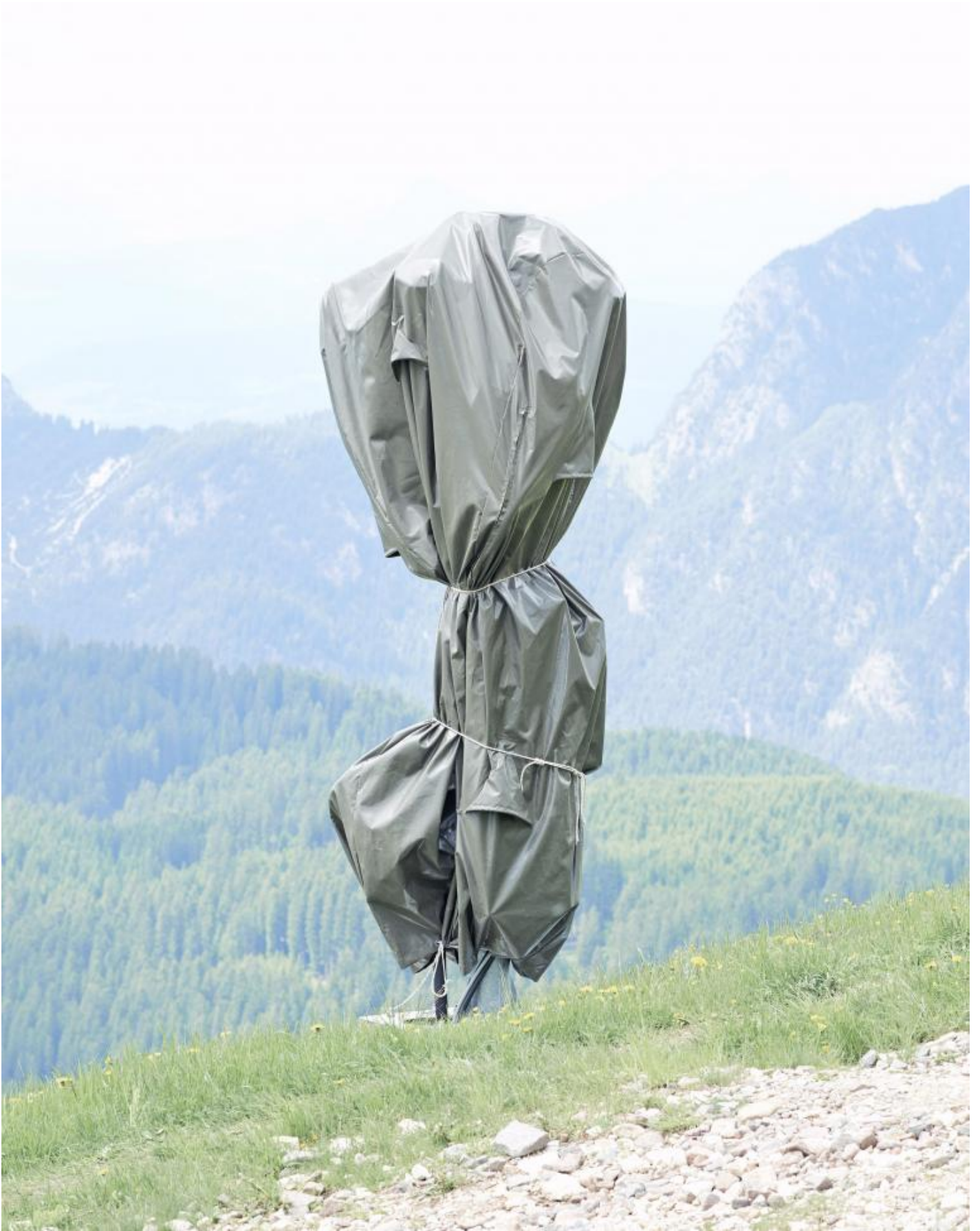
Walter Niedermayr, Ritratto/Portrait, 46/2014, 49,5x39 cm.