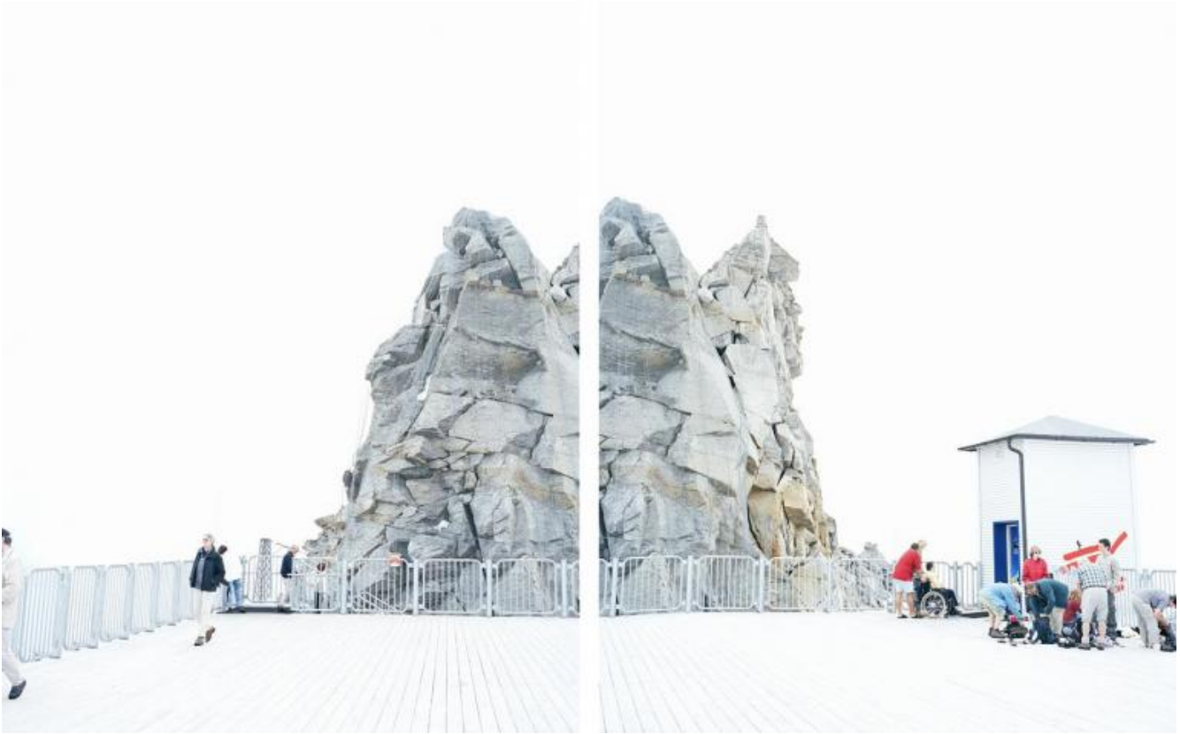
Walter Niedermayr, Hintertuxergletscher, 23/2004, Dittico, 131x211 cm.

Abbiamo così una scena ferma (le persone, anche se sono intente a compiere azioni in movimento, non sono mosse, dunque lo scatto è stato eseguito con tempi rapidi) che scopriamo essere divisa sì in due immagini, ma non perfettamente combacianti. Infatti, se a una buona distanza l'immagine sembra coerente tra la prima e la seconda fotografia, avvicinandosi e ponendo l'attenzione proprio là dove l'immagine si interrompe, ci si rende conto che l'inquadratura è stata spostata da uno scatto all'altro. Quello in cui si viene trasportati è una lampante narrazione di uno scenario immobile. Dividendo l'immagine in due o in tre si porta lo sguardo del visitatore a un ordine di lettura di qualcosa che nella realtà si guarderebbe "a colpo d'occhio", tutto insieme, creando mentalmente una visione uniforme. Non solo, l'operazione chirurgica prosegue facendo ricostruire alla nostra visione mentale il movimento che l'autore deve aver fatto per eseguire gli scatti, separati quindi anche temporalmente. E ancora, da questa prima immedesimazione, si raccoglieranno i dettagli, di solito quasi impercettibili, per ricostruire uno spazio esteso a 360 gradi.