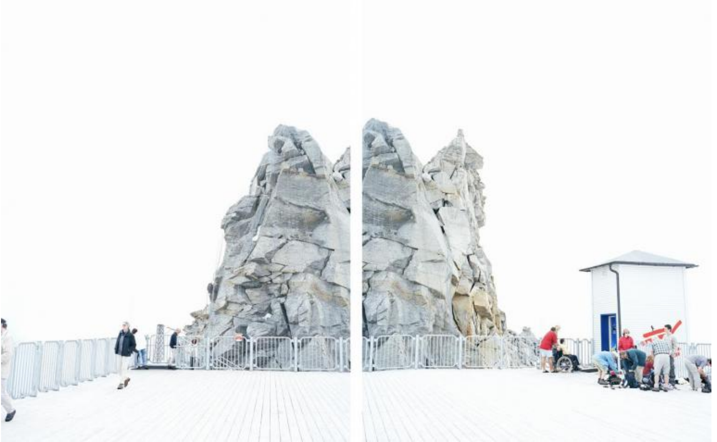
Walter Niedermayr, Hintertuxergletscher, 23/2004, Dittico, 131x211 cm.

Per capire meglio quello che succede guardando la maggior parte delle opere in mostra, prendiamo ad esempio un lavoro come “Hintertuxergletscher 23/2004”, dittico, 131x211 cm, posto verso la fine del percorso di visita: come abbiamo già detto, il soggetto, anche se si tratta di un dittico, è uno solo. Qui abbiamo quello che sembra un impianto di risalita per le attività sciistiche, una pavimentazione piastrellata molto chiara in prospettiva frontale e transennata sui tre lati visibili; a sinistra dell’immagine di sinistra quattro persone di cui una praticamente fuori dall’inquadratura (elemento che torna spesso in più lavori), mentre a destra dell’immagine di destra si vede un gruppetto di persone stanziate davanti a una casupola di servizio e una persona in sedia a rotelle con l’accompagnatore. Dietro, un grande e compatto complesso roccioso con delle corde da arrampicata scontornato e sovrastato da un cielo bianco latte.