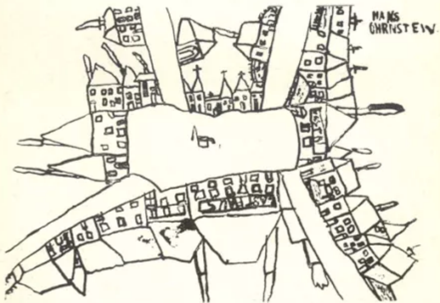
20. - Ragazzo di 10 anni.