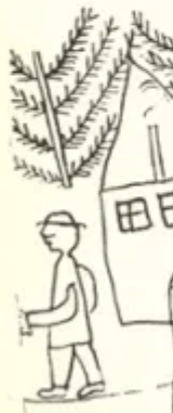
21. - Incisione