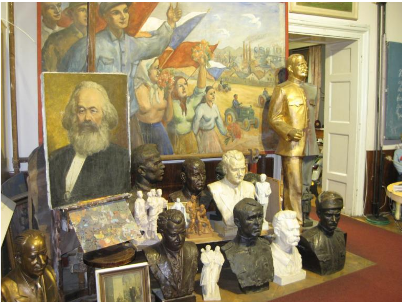
Un angolo del museo prima versione (giugno 2008).

Tanto per non lasciare dubbi sull'interpretazione da dare alla storia, fin dall'ingresso e dai primissimi passi. L'oleografico souvenir russo, già gioco per bimbi contadini nelle sue lontane origini, si trasformava in macchina da guerra che nel suo grembo capiente nascondeva non già tante piccole copie di sé stessa (la terra russa che si autofeconda e nasce e rinasce in continuazione), ma Paesi e genti cooptati con la forza e costretti con la violenza per aderire a un modello imposto dall'alto. Significativo che le indicazioni si limitassero all'inglese e non comprendessero il ceco. Come a sottolineare che si dava per scontato che i visitatori non fossero gente del posto a cui di quella collezione e di quelle memorie non poteva importare di meno. L'interno raccoglieva una considerevole serie di memorabilia, recuperati dallo stesso fondatore tra mercati delle pulci e reperti privati di singoli cittadini che quell'esperienza l'avevano vissuta in prima persona, affastellati più che esposti in una sequenza da trovarobato più che da museo.