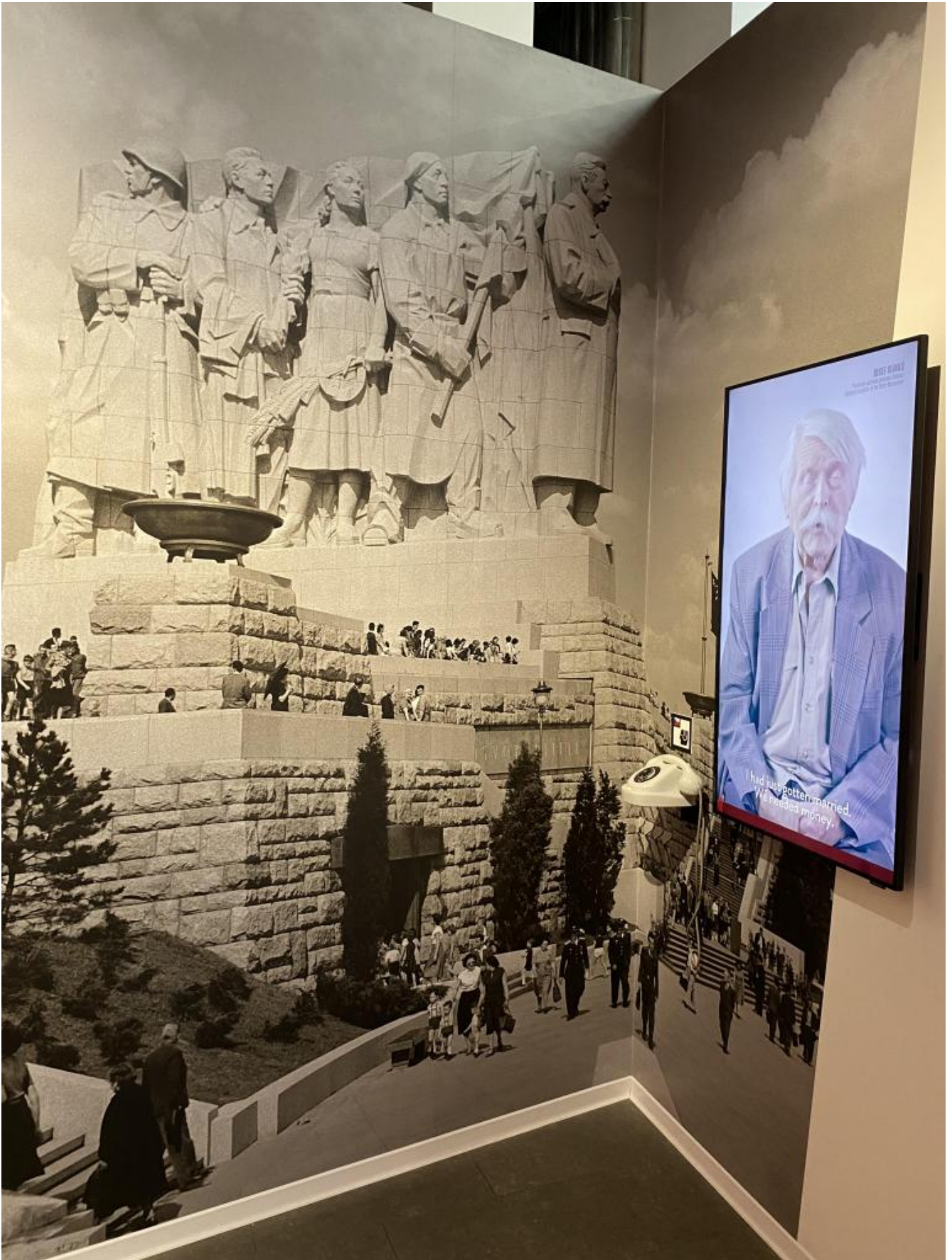
Il monumento a Stalin.