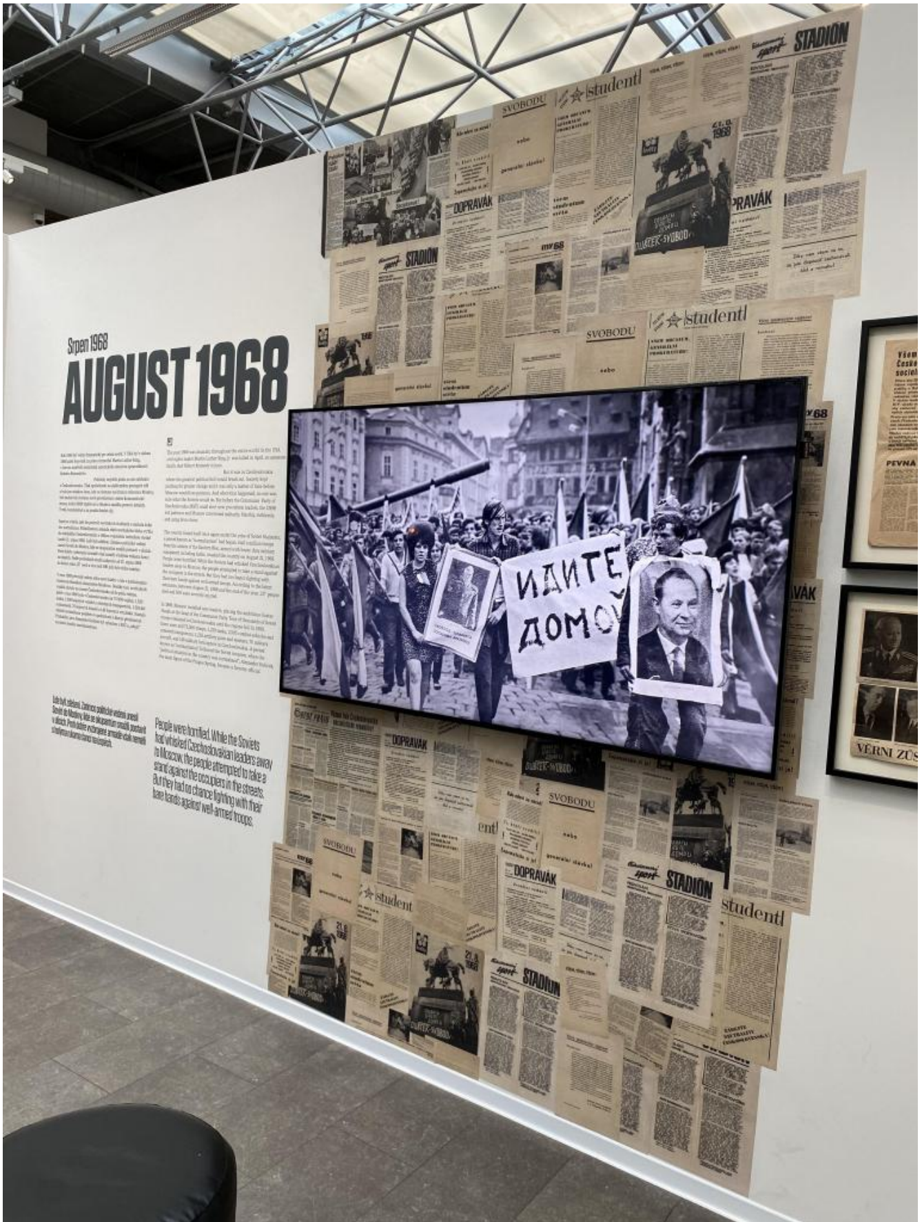
L'invasione sovietica di Praga. Sul cartello dei dimostranti, in cirillico, la scritta: idite domoj (andate a casa).