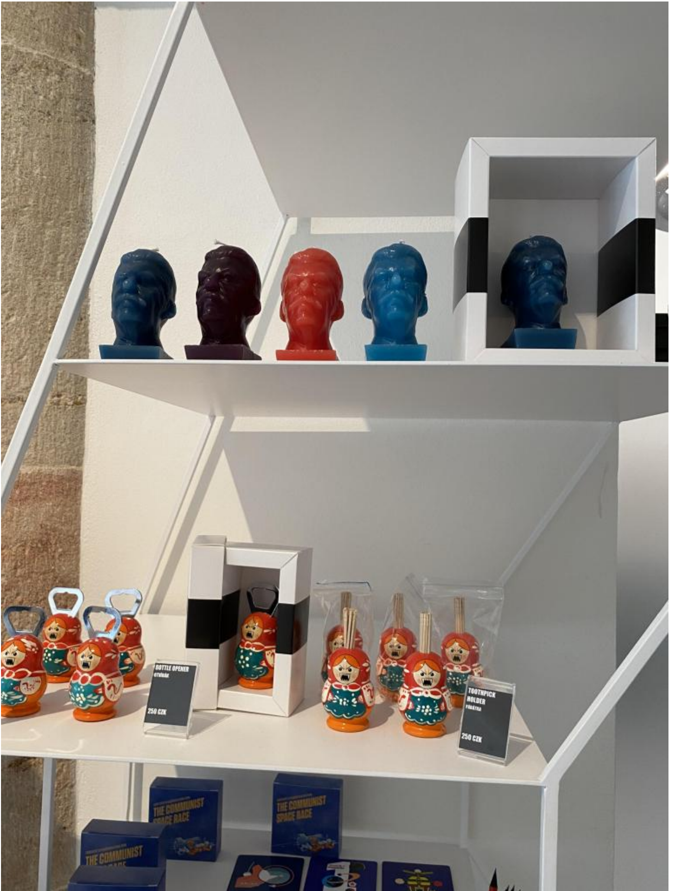
Souvenir al museo.