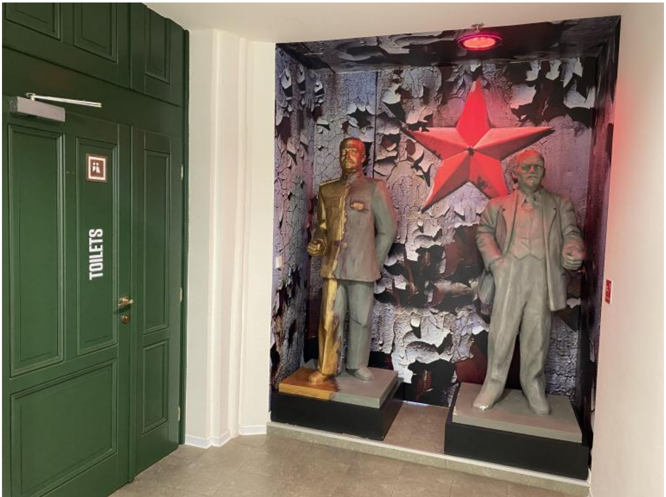
Le statue di Stalin e Lenin pronte per i selfie accanto alla toilette.

Curioso e significativo, unico tratto performativo pur nella sua discutibilità, è che due autentiche statue sopravvissute tra le tante, Lenin e Stalin, appaiati in una teca dalle pareti scrostate mentre danno le spalle a una stella rossa acciaccata (accessibili a chi desiderasse insinuarsi tra loro per un selfie), siano messe come in castigo proprio a fianco dell'ingresso alla toilette. Nulla di casuale in quell'installazione e ai visitatori il compito di sghignazzare, sorridere, sospirare o indignarsi. Difficile è transitare indifferenti.