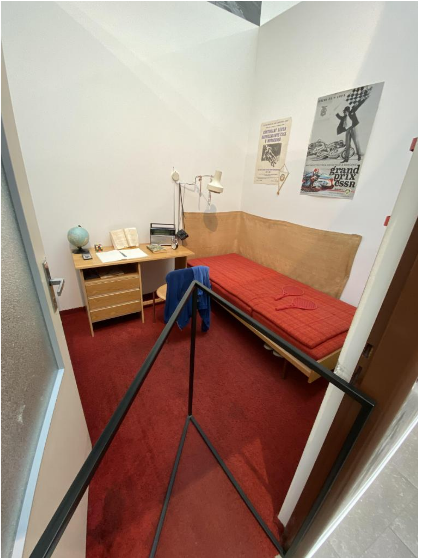
La stanza di uno studente nella ricostruzione del museo.