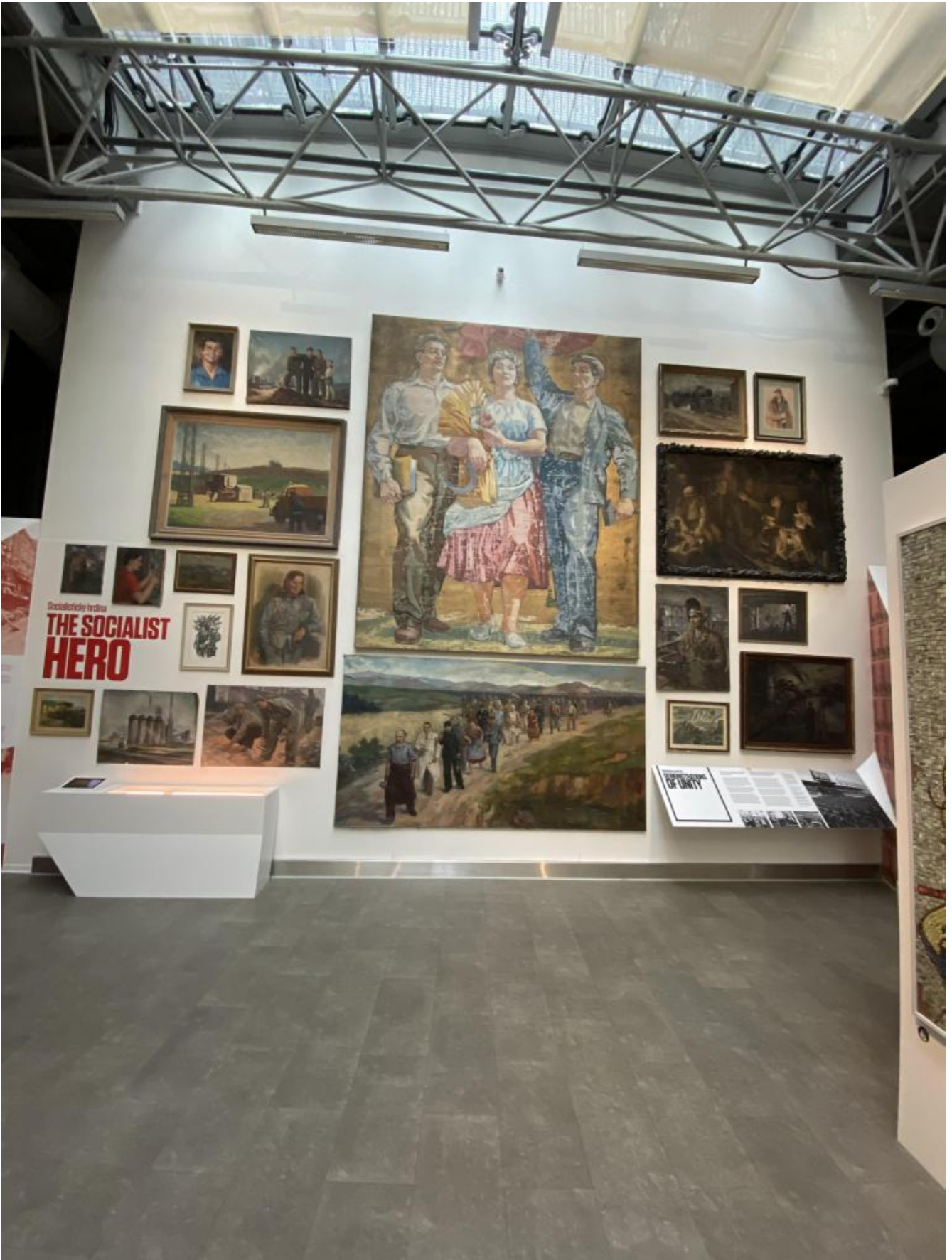
I pannelli dedicati all'eroe socialista.