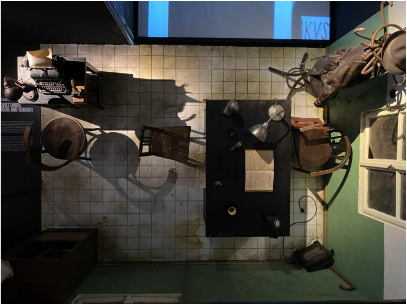
La stanza degli interrogatori.

I momenti a cui si attribuisce maggior responsabilità sono quelli legati all'influenza della politica staliniana, alle varie forme di contro-cultura per reagire a vessazioni e controlli e, ovviamente, all'invasione del 1968. Del gigantesco monumento a Stalin, una delle sculture più grandi d'Europa che troneggiò su Praga dall'alto di una collina dal 1955 (il leader era già morto e le denunce chruščëviane incombevano) per sette anni, si ricordano tratti essenziali ed eclatanti. Era un colosso di 22 m. di lunghezza e 16 di altezza, con Stalin che si ergeva solenne con lo sguardo fisso e vari rappresentanti del popolo cecoslovacco concentrati al suo seguito. Immancabilmente la lettura popolare dell'opera decostruì la retorica debordante e la scultura fu ribattezzata "in coda per la carne". La sua distruzione, avvenuta in seguito alla seconda ondata di destalinizzazione imposta da Chruščëv (primi anni Sessanta), imbarazzante nonostante tutto (qualche dato in più rispetto alla situazione politica interna e alle resistenze al nuovo corso sovietico sarebbe opportuno), non fu documentata; rigorose proibizioni la impedirono, ma le esplosioni che progressivamente