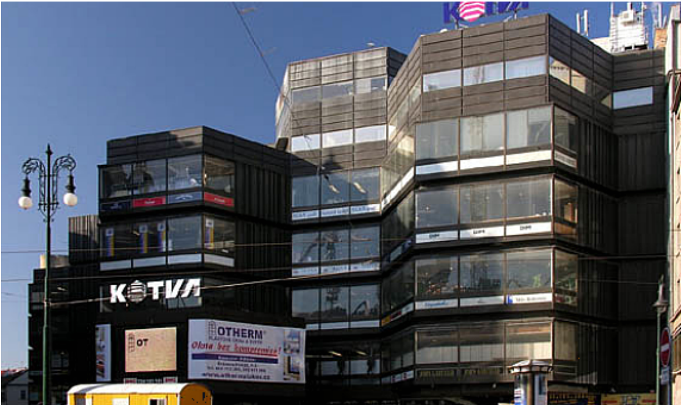
Il complesso dei grandi magazzini Kotva.

Nell'insieme un percorso misurato ma convenzionale, nell'installazione e nel concetto, con qualche scivolone di discutibile gusto, e nell'insieme piuttosto superficiale. All'uscita due possibilità architettoniche di integrazione del discorso, stilisticamente assai lontane tra loro, ma storicamente importanti per meglio comprendere i conflittuali trascorsi estetico-politici della città: da un lato, all'angolo con la via Králodvorská, la sagomata mole esagonale dei grandi magazzini Kotva (ancora), risalenti alla prima metà degli anni Settanta e, pur tra molte contestazioni, dichiarati monumento culturale dal 2019.