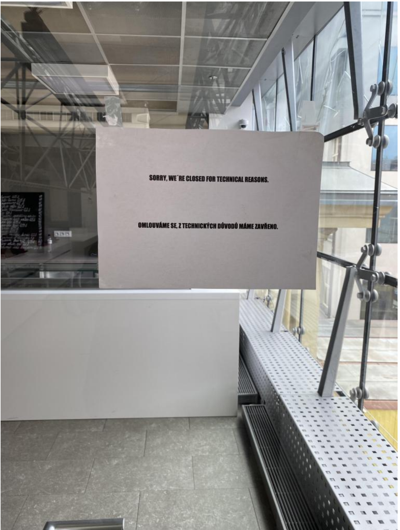
"Chiuso per cause tecniche".