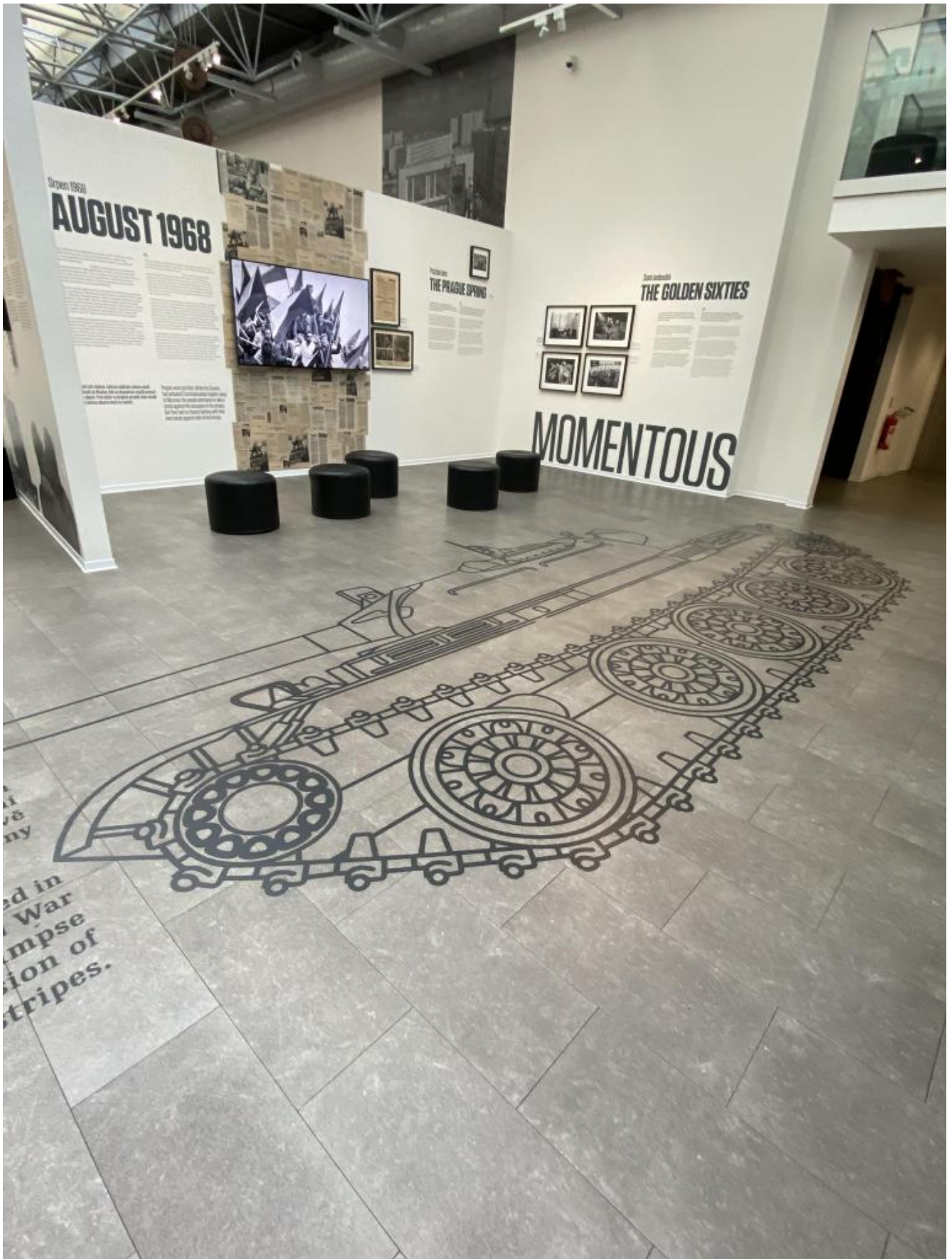
La sagoma del carro armato sovietico davanti ai pannelli degli anni Sessanta.