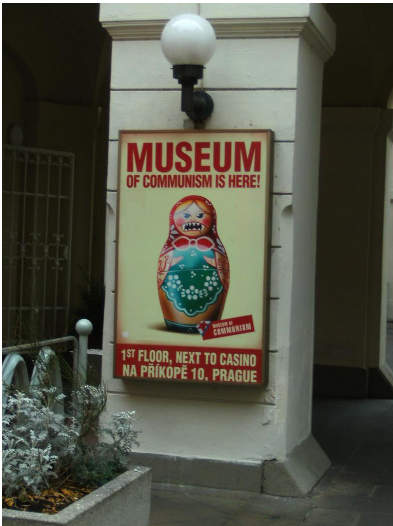
La primigenia insegna del Museo del comunismo di Praga (giugno 2008).