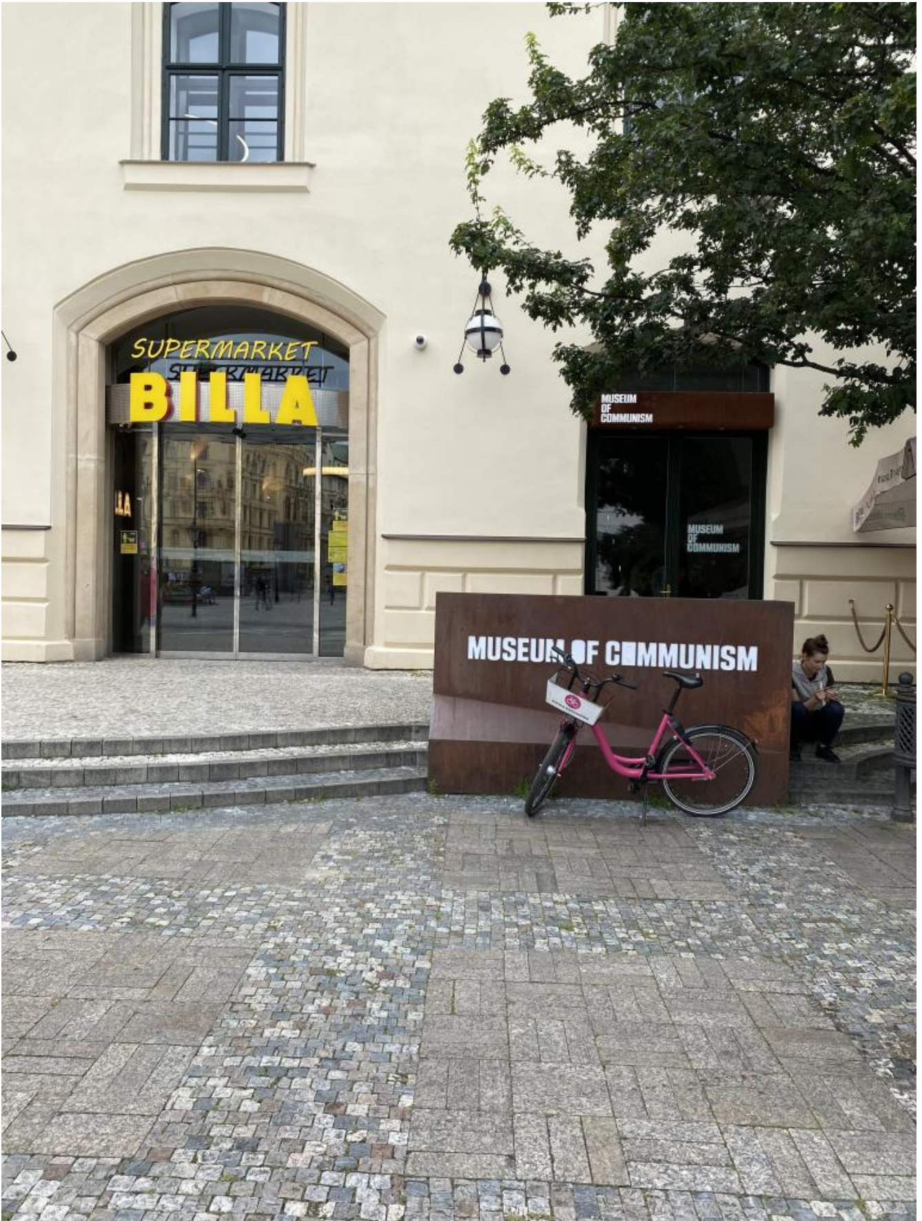
L'ingresso del Museo del comunismo.