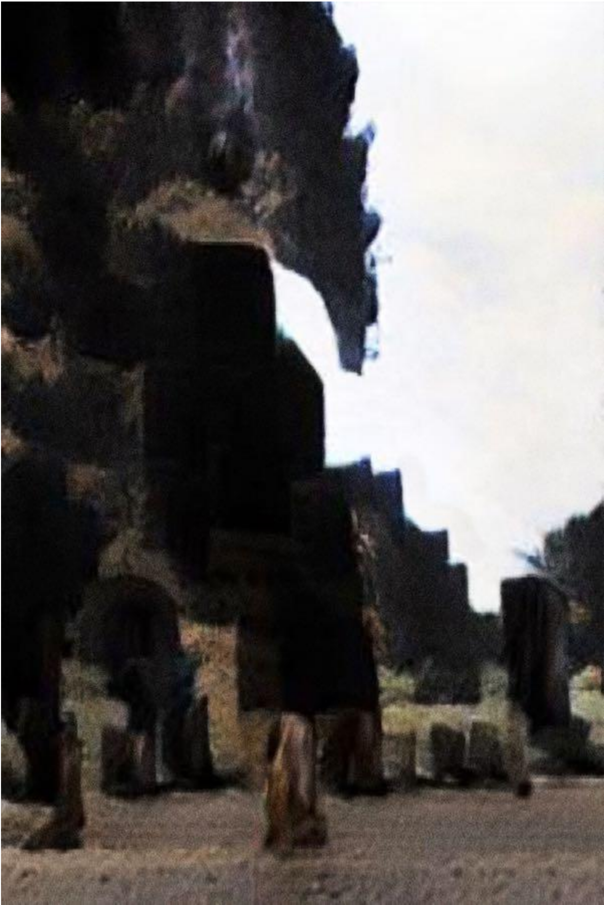
Silvia Bigi, urtumliches Bild, 2020.