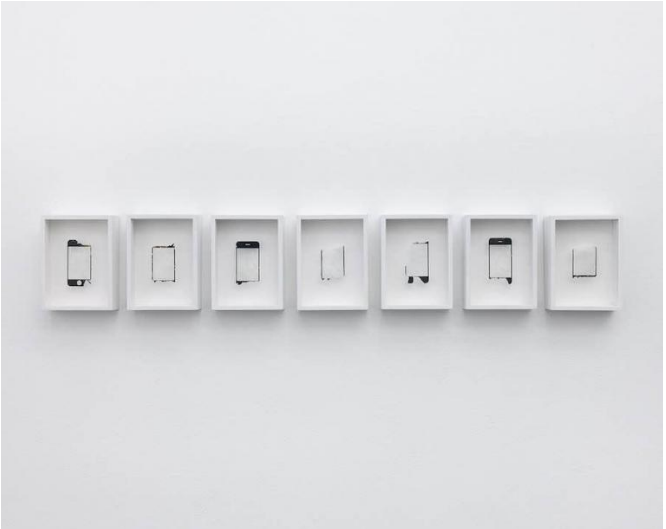
Simone Bergantini, The Night Watch, 2015.

e ripiegata successivamente a mano. I dettagli della figura femminile sono visibili solamente attraverso la riflessione di una lastra specchiante che fa da supporto alla immagine scultorea, distesa e legata.