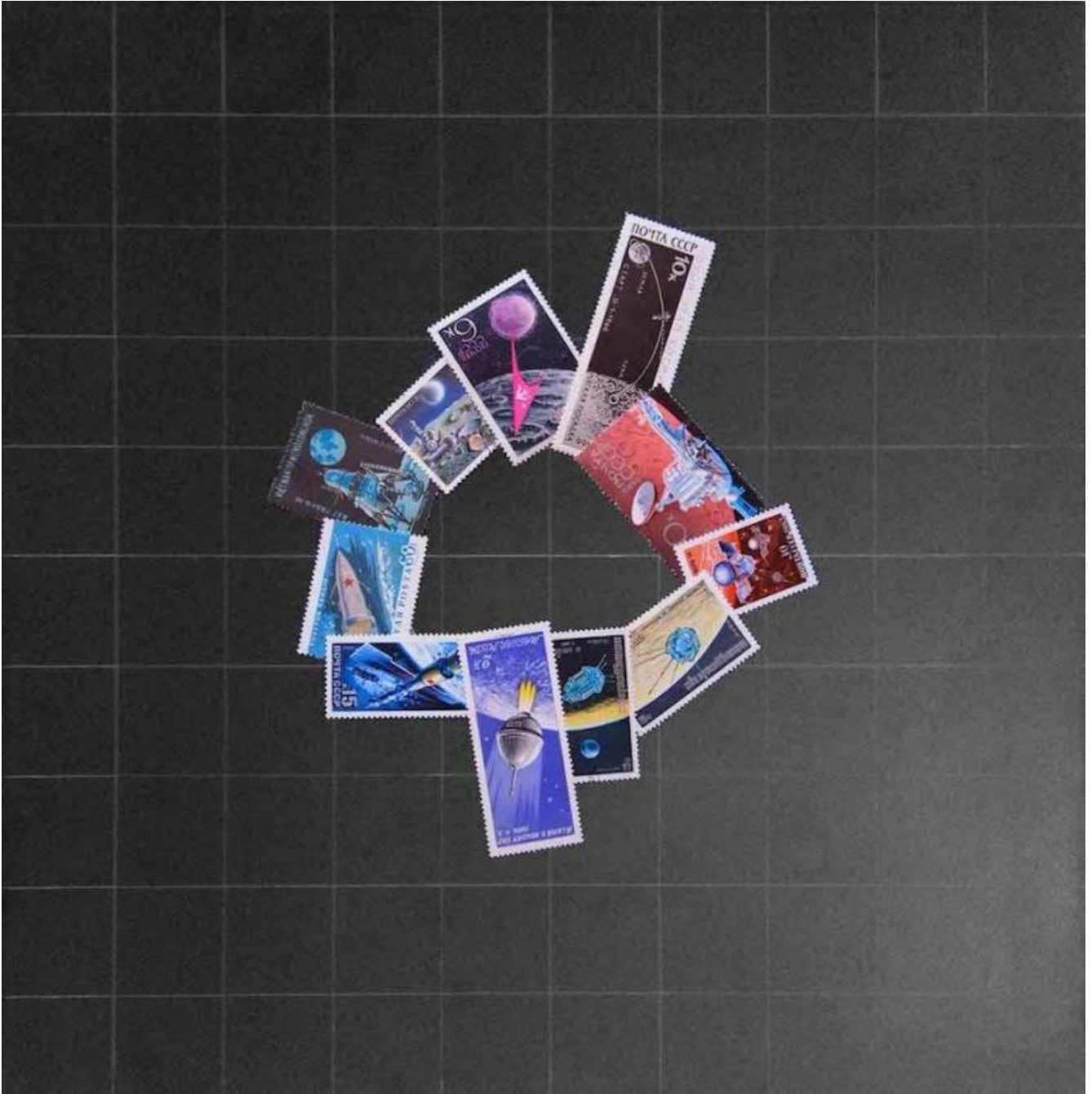
Ryts Monet, Air from another planet, 2015.

In particolare, la terza ricognizione di Metafotografia è un ulteriore tentativo collettivo di ripensare insieme i termini, i limiti e le logiche con cui produciamo o veicoliamo immagini e immagini fotografiche, tentando sconfinamenti o reinvenzioni attraverso diverse declinazioni.