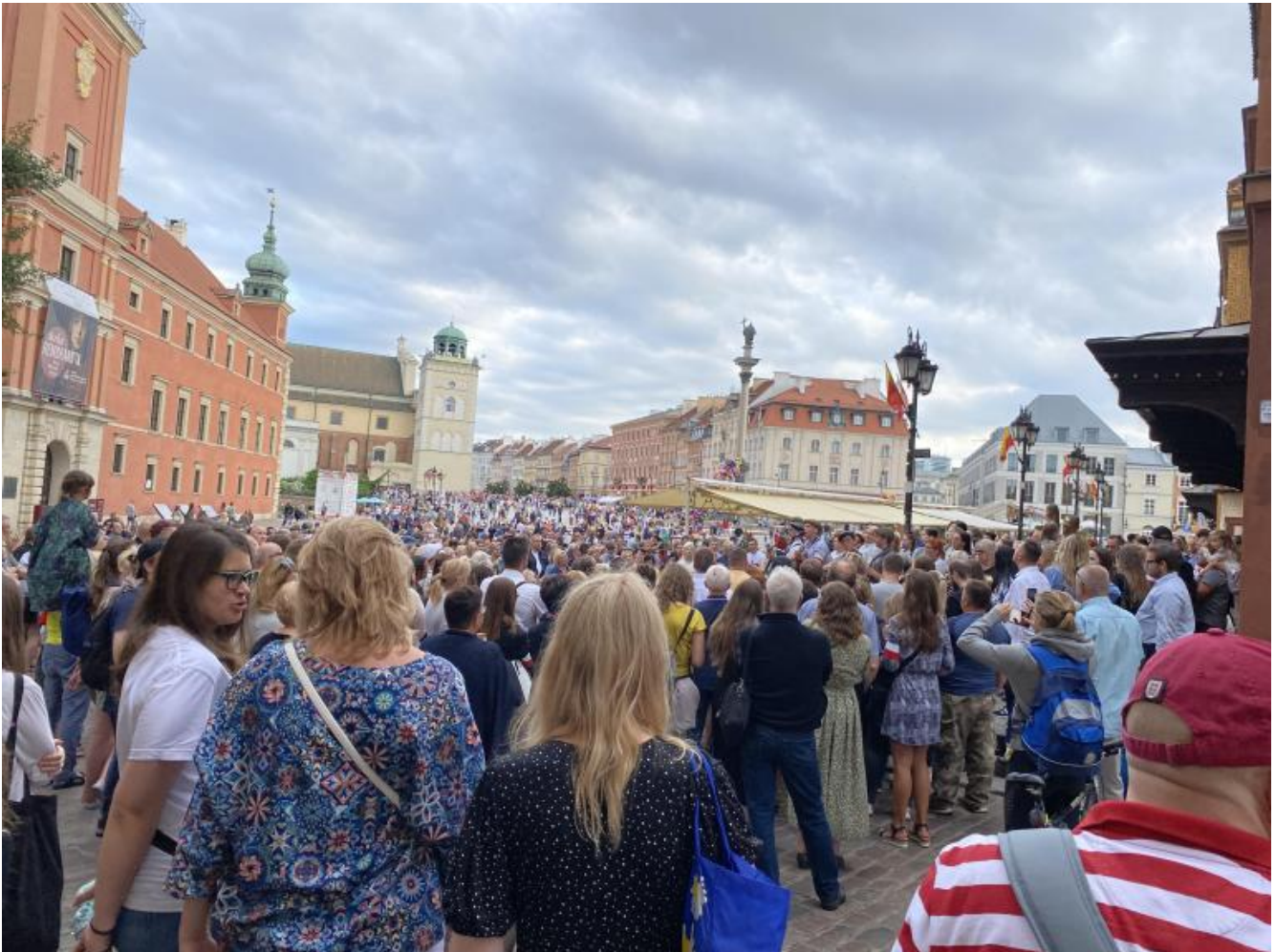
La festa in piazza del Castello.

Il giorno successivo, ancora suggestionato dalle immagini della solennità e dalla loro plurivalenza ideologica, mi diressi verso l'attuale sede del museo. Aveva esordito nel 1999, con residenza proprio all'interno del Palazzo della scienza e della cultura, promosso da figure significative del panorama culturale polacco tra cui Andrzej Wajda. Intorno al 2010, per iniziativa di Rafał e Marta Patla, una coppia di dinamici imprenditori, nacque un nuovo embrionale progetto. I Patla erano stati ideatori dell'agenzia Adventure Warsaw che propone tutt'ora, tra l'altro, un tour della città comunista realizzato a bordo di un mitico pulmino Nisa 522 (negli anni Settanta in dotazione sia alla polizia polacca che alle ambulanze). La prima sede provvisoria del futuro museo fu un cadente garage nel quartiere operaio e periferico Praga, in piena rinascita alternativa dopo una storia di degrado, malvivenza e povertà. Fu proprio in quel rione che l'Armata Rossa si era fermata nel 1944 senza oltrepassare la Vistola, abbandonando le forze nazionali in balia dei nazisti.