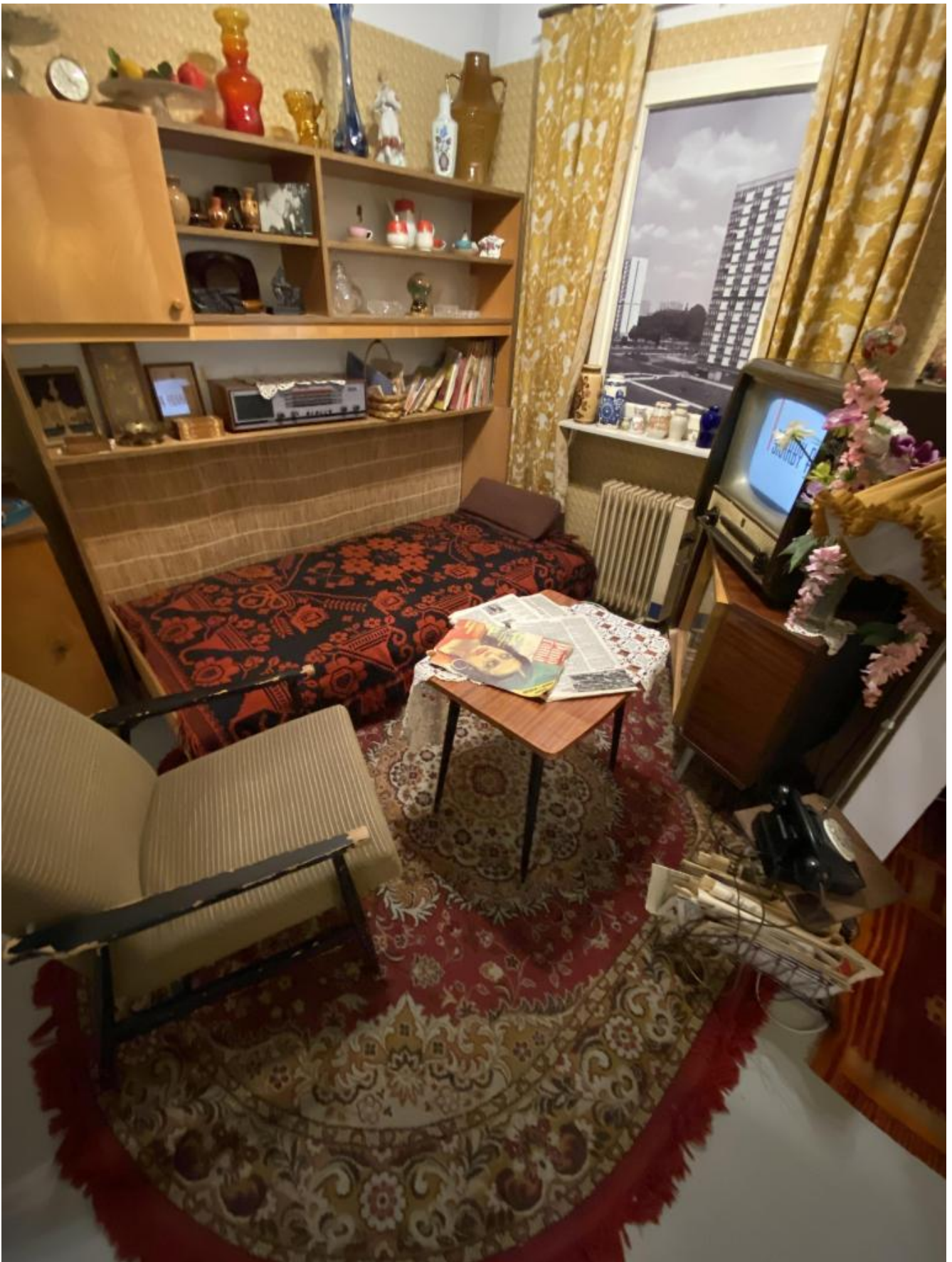
L'appartamento tipo nella Varsavia comunista.