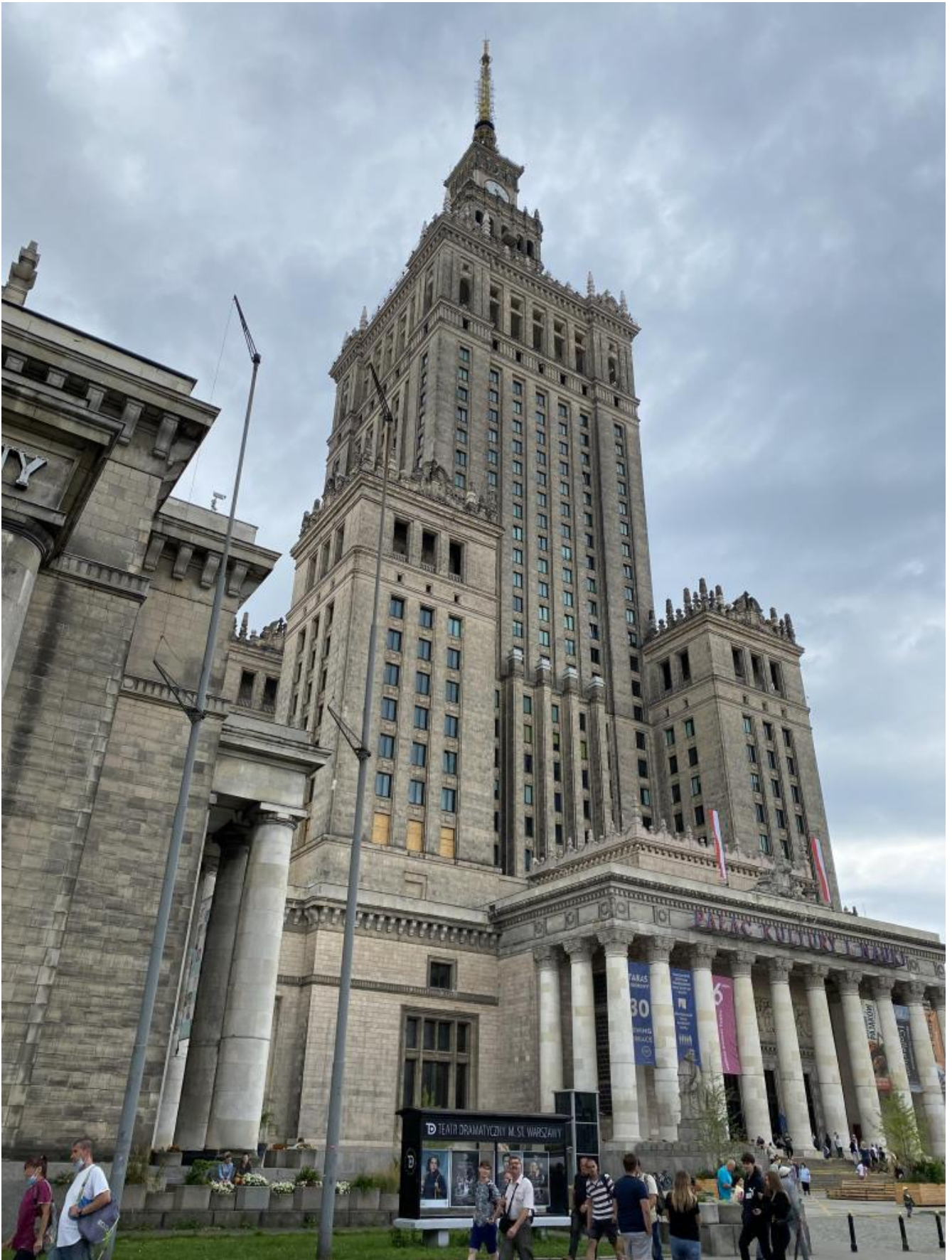
Il Palazzo della cultura e della scienza di Varsavia (1952-55).