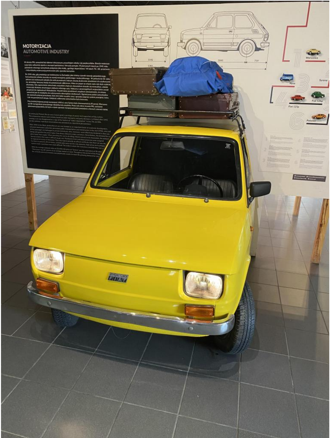
La 126p Polski Fiat.