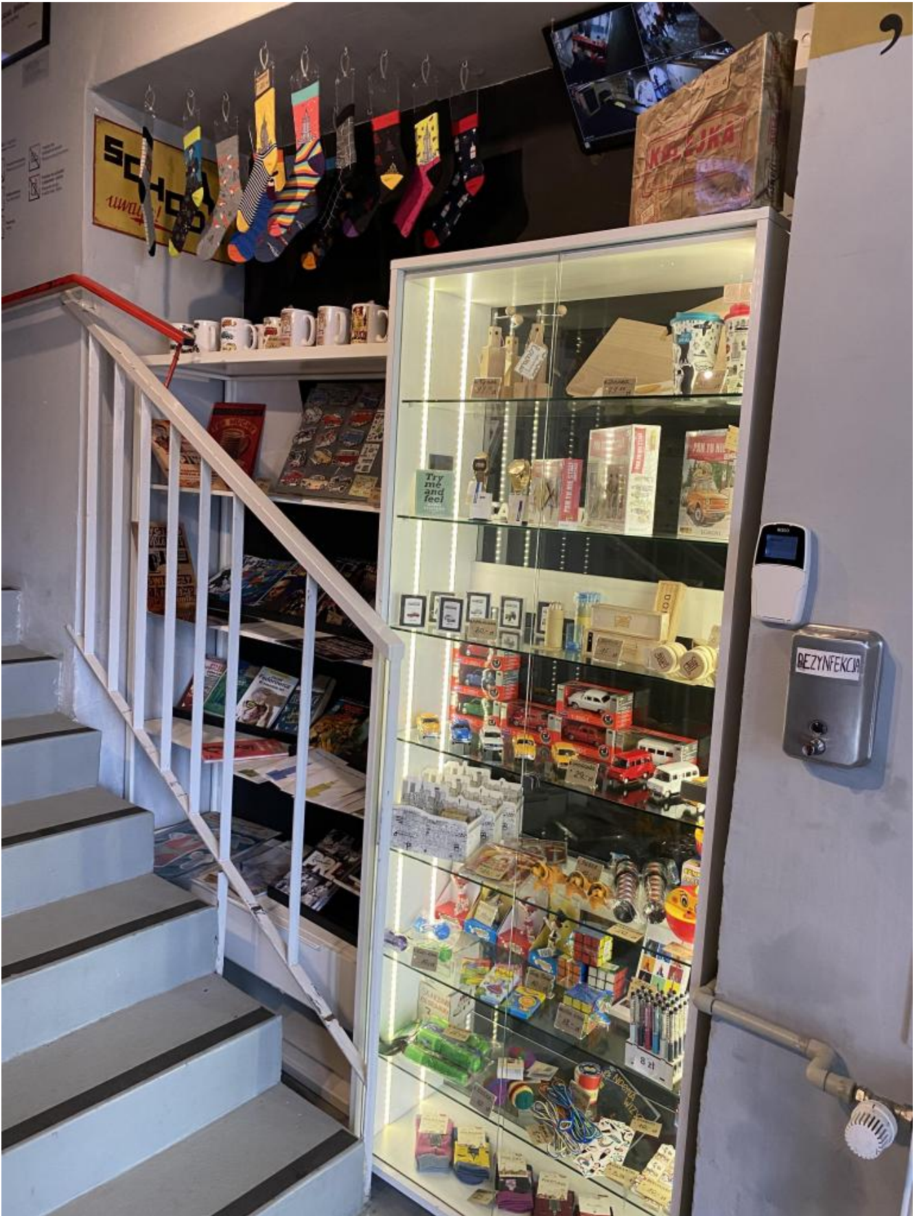
La vetrinetta dei souvenir.