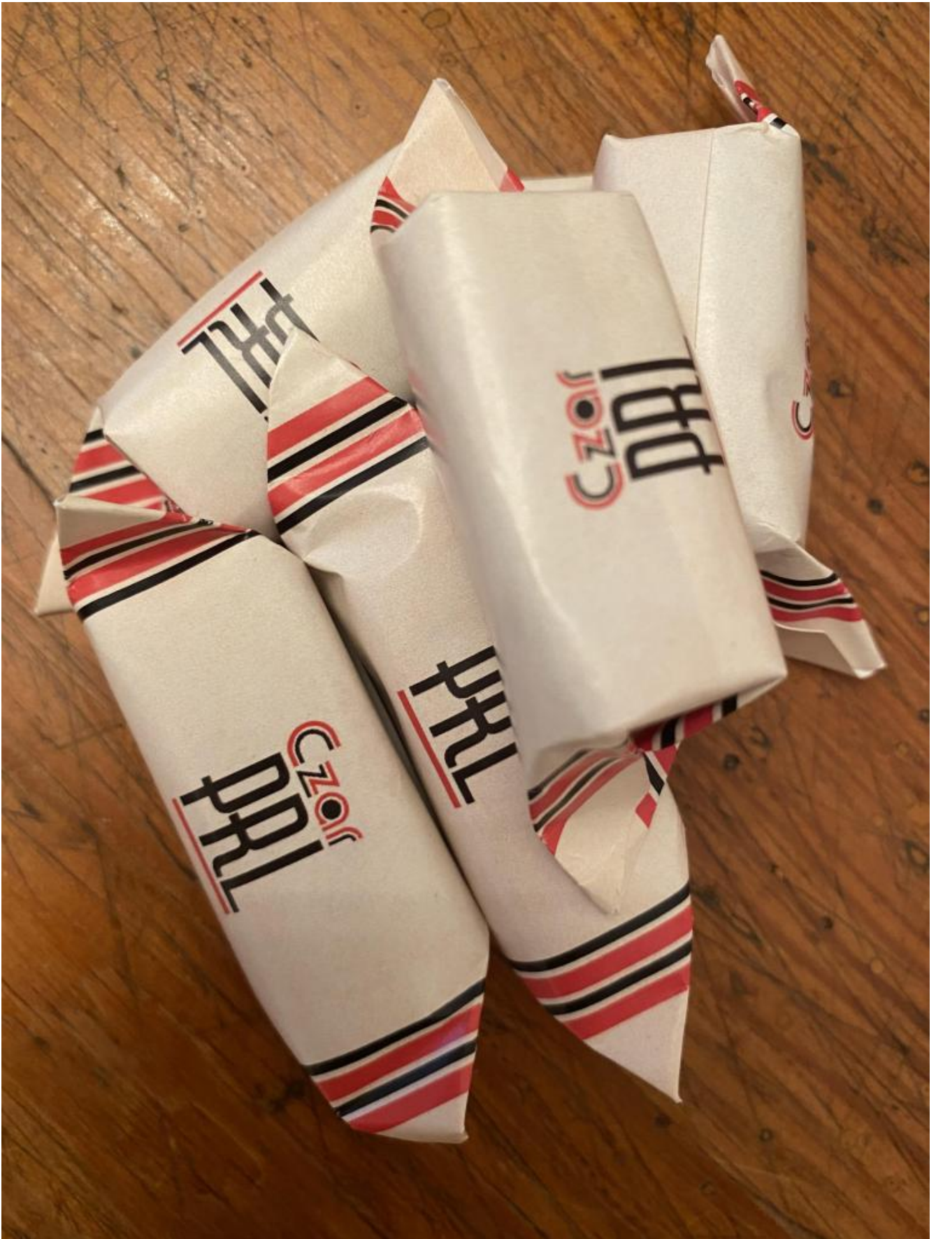
Le caramelle souvenir.