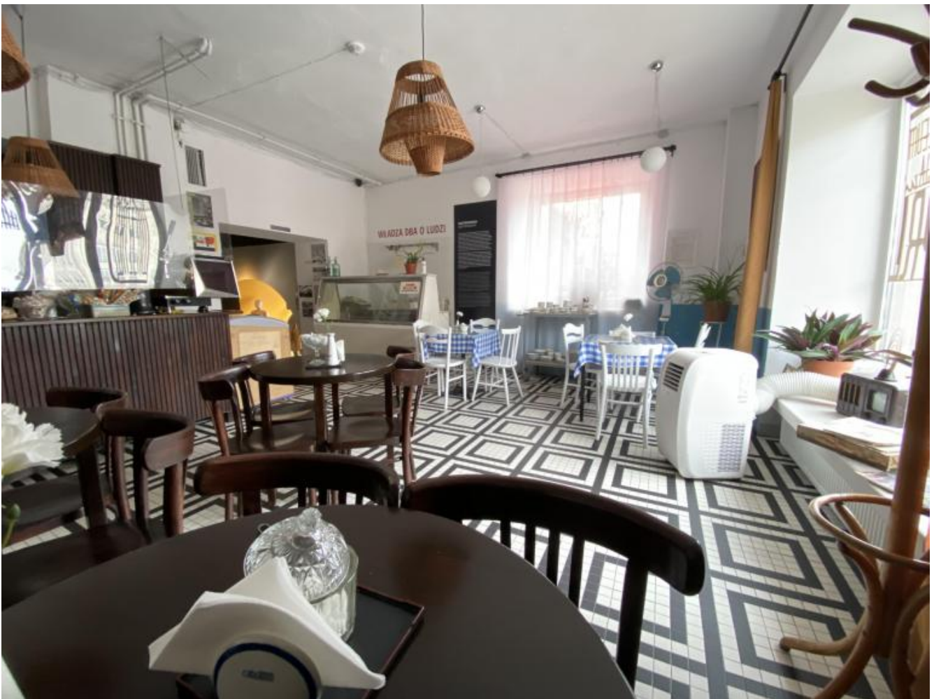
La caffetteria del museo.

Un'intera caffetteria, bar mleczny (letteralmente bar latteria, una realtà analcolica diffusa in quasi tutti i paesi del blocco comunista) è stata ricostruita: è operante e ci si possono assaggiare bibite e cibi d'epoca.