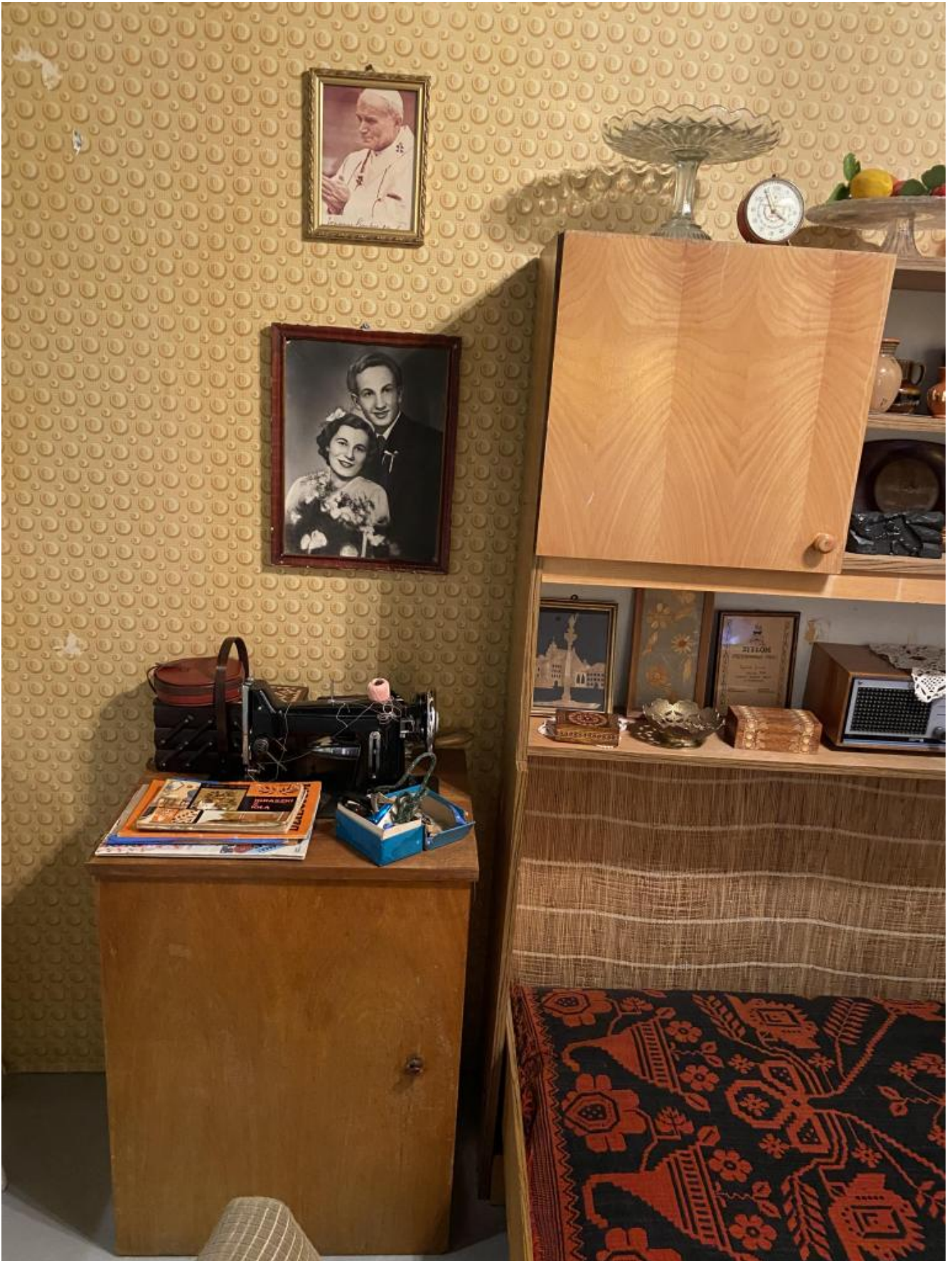
Un angolo dell'appartamento.