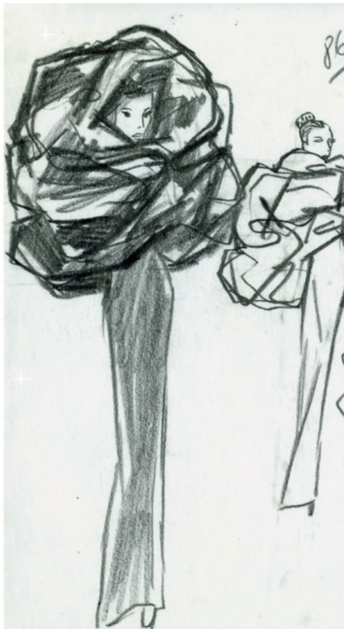
74. Cristóbal Balenciaga, bozzetti, inverno 1967.

La messa in discorso degli elementi distintivi di Balenciaga si intreccia con il tema del MET Gala “In America: A Lexicon of Fashion”, rappresentato da Gvasalia topicalizzando due pilastri della moda americana: la t-shirt e il divismo, magnificato dall’annullamento dei tratti caratterizzanti del volto, estremizzazione in pectore del mascheramento pandemico. Oltre a Kardashian, al MET Gala in Balenciaga c’era la cantante Rihanna che, invece, ha interpretato il corpo modello della maison grazie a una perfetta riscrittura di un capospalla del 1967, il cui bozzetto originale è riportato anche nel volume di Fabbri. I due corpi mediali dimostrano che si può portare avanti l’eredità stilistica riattualizzandola ? Rihanna ? oppure con una risemantizzazione estrema, che traccia una spaziatura e una differenza con il passato, che va nella direzione del cosa sarebbe accaduto se Balenciaga avesse vissuto nel presente .