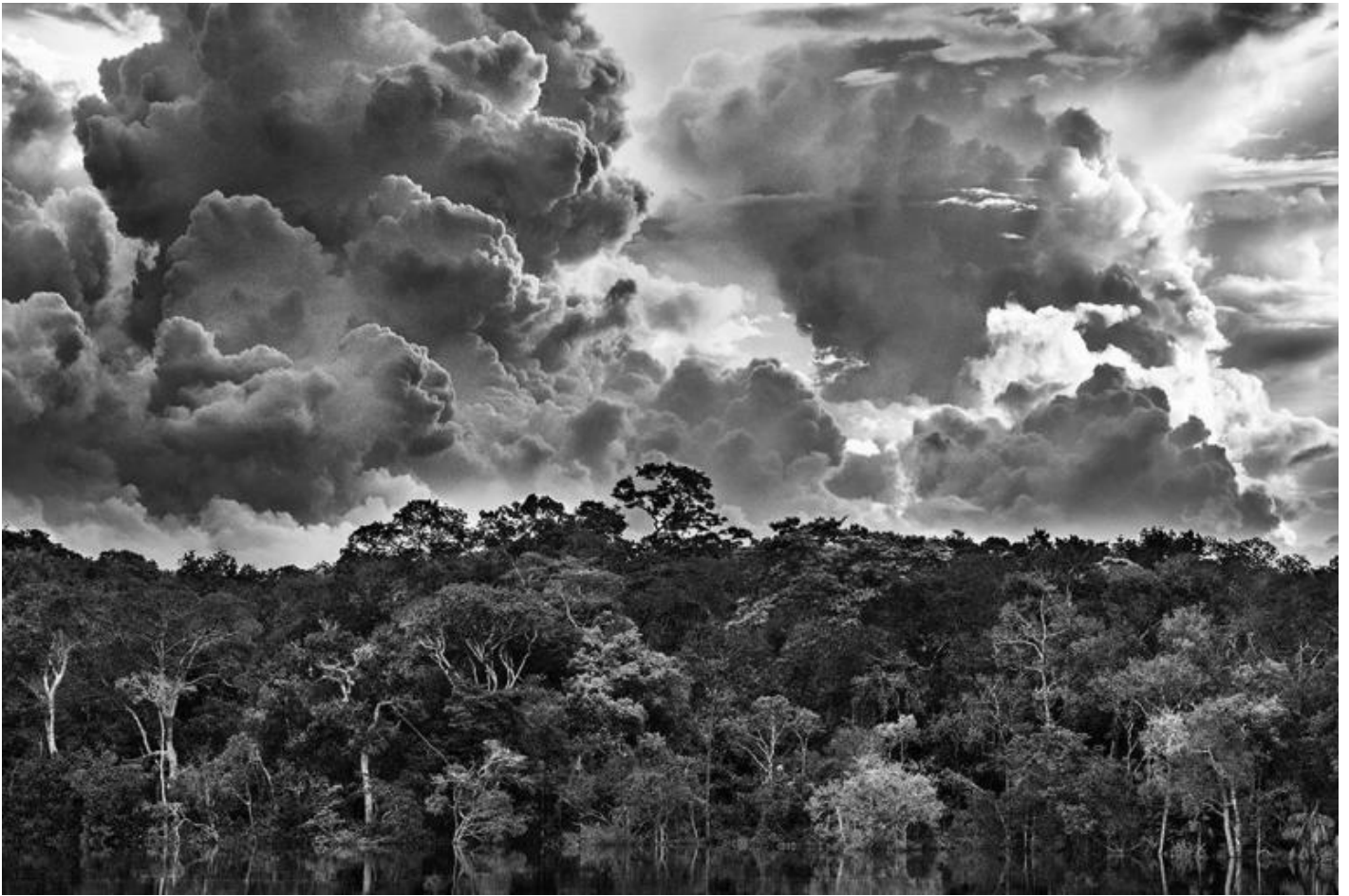
Arcipelago fluviale di Mariuá. Rio Negro. Stato di Amazonas, Brasile, 2019 - © Sebastião Salgado/Contrasto.

17 sezioni, 6 a raccontare l'Eden terreno, paesaggi che rendono di nuovo attuale il sublime romantico, che alla meraviglia unisce un profondo e reverenziale terrore per ciò che non si può totalmente comprendere per limiti imposti dalla propria stessa umanità; 11 per avvicinarsi a quelle umanità che l'Eden ancora lo vivono e che ne custodiscono i segreti più antichi.