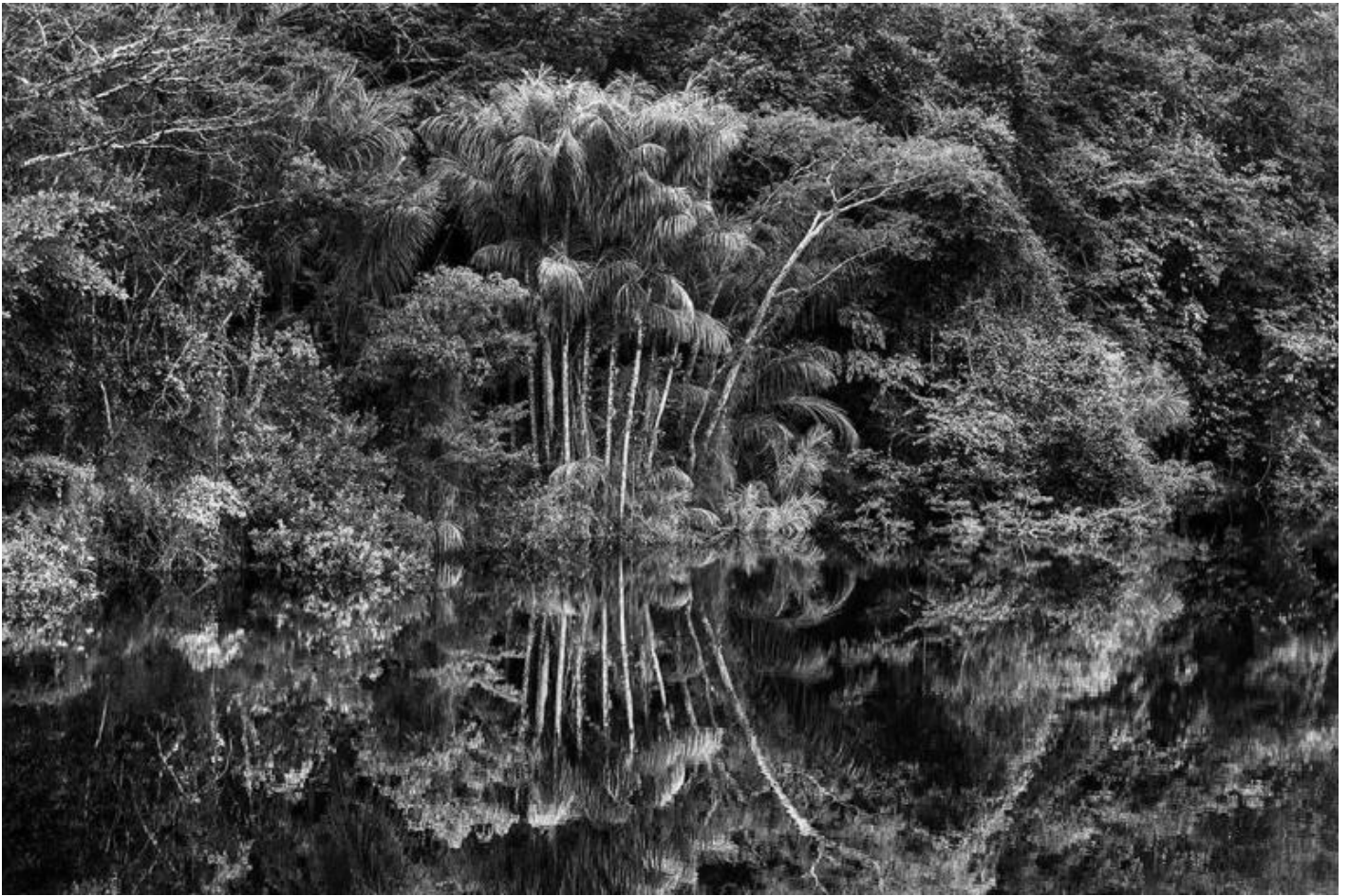
Rio Jaú. Stato di Amazonas, Brasile, 2019 - © Sebastião Salgado/Contrasto.

Guardando questi ultimi, si entra in contatto diretto con umanità intatte, ormai in forte pericolo a causa di deforestazioni, inquinamento, e ora anche del “virus del pipistrello, quello che hanno portato i bianchi” si sente dire da un capo tribù. Alcune delle popolazioni ritratte da Salgado contano solo più poche centinaia di individui, e fanno tornare alla mente uno dei personaggi più toccanti di Werner Herzog nel suo Dove sognano le formiche verdi (1984), che tratta più o meno gli stessi temi, ma contestualizzati nel mondo degli aborigeni australiani. Tra di loro esiste un uomo, unico portavoce rimasto della sua popolazione ormai spazzata via, considerato muto. Muto non perché non sia in grado di parlare, ma perché è l'ultimo uomo a conoscere la sua lingua, rendendolo isolato e comunicativamente inaccessibile. E ci si chiede se già esistano casi simili anche in Amazzonia, o quanto poco manchi effettivamente per arrivare a questo preludio della fine di intere culture.