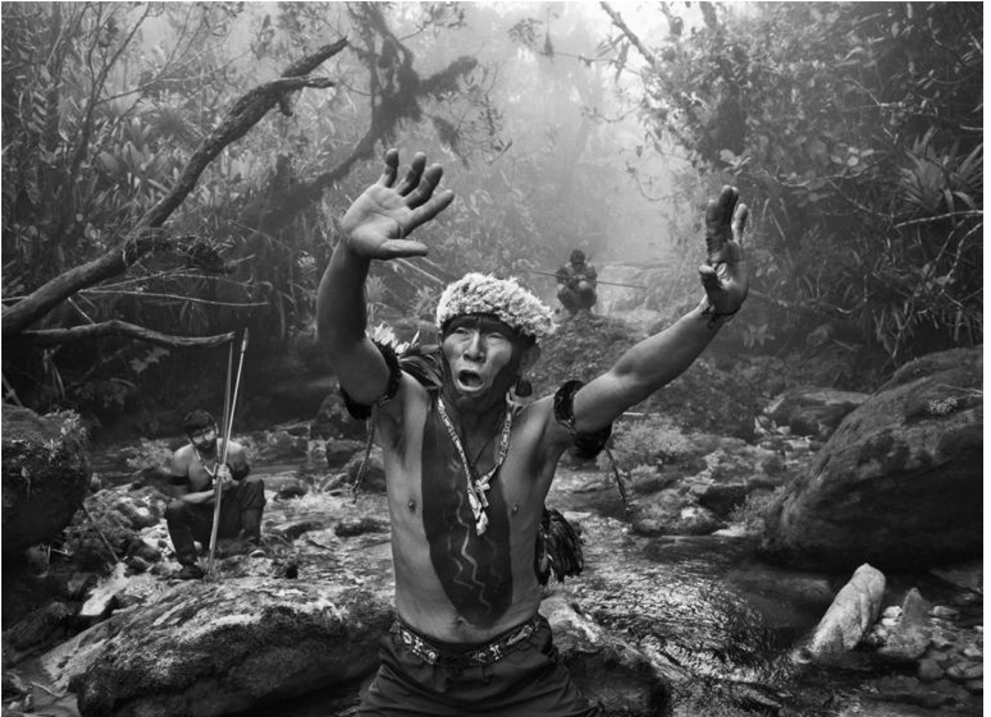
Sciamano Yanomami dialoga con gli spiriti prima della salita al monte Pico da Neblina. Stato di Amazonas, Brasile, 2014 - © Sebastião Salgado/Contrasto.

Si parla di paesaggio e di uomini, e se ne parla con un chiaro e potente invito ad agire e a prendere consapevolezza del rischio che l'ecosistema più importante al mondo, il "Paradiso verde" in grado di riversare nell'oceano il 20% dell'acqua dolce di tutta la Terra, sta correndo. E lo si fa proprio nei giorni di Pre-COP26 a Milano. Il tema è chiarissimo, i pannelli esplicativi e le mappe ai lati del percorso di visita riportano spiegazioni tecniche sul comportamento dell'ecosistema amazzonico, citando per esempio i "fiumi volanti", unicità del luogo, come sulle popolazioni indigene, ampiamente documentate anche con video interviste ai capi tribù.