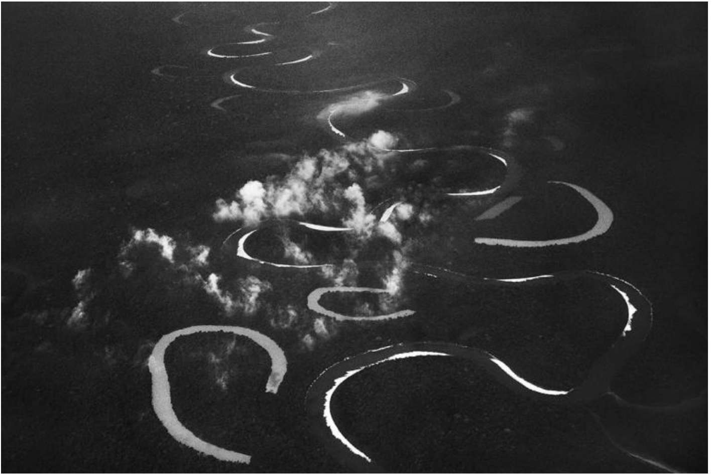
Rio Jutai. Stato of Amazonas, Brasile, 2017 - © Sebastião Salgado/Contrasto.

Nei ritratti, con lo sfondo scuro e una luce diffusa, o ambientati nei contesti familiari ai soggetti, lo sguardo è quasi sempre puntato sullo spettatore, richiede un confronto di petto, così come nelle immagini di reportage. In “Sciamano Yanomami dialoga con gli spiriti prima della salita al monte Pico da Neblina. Stato di Amazonas, Brasile, 2014” si vede un uomo in mezzo alla foresta e un corso d’acqua alle sue spalle. Ha le braccia alzate, il torso nudo dipinto e l’espressione colta nel coinvolgimento del rito che sta compiendo. Due uomini sono accovacciati in punti diversi dietro di lui. Qui, oltre a un bianco e nero che prevede una vasta e morbida scala di grigi, senza toccare mai bianchi e neri puri, si ha una perfetta triangolazione dei tre uomini, ben visibili e ripresi in modo tale, di nuovo, da guidare lo sguardo dal punto principale – l’uomo in primo piano e al centro – allo sfondo, là dove filtra più luce tra gli alberi e proprio dove si vede il terzo uomo, incorniciato dalle braccia alzate dello sciamano.