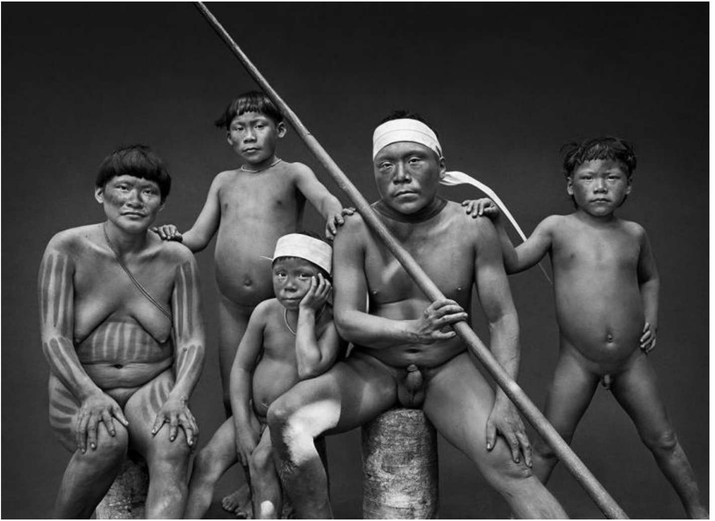
Famiglia Korubo. Stato di Amazonas, Brasile, 2017 - © Sebastião Salgado/Contrasto.

La fotografia di paesaggio e quella di reportage condividono il comune principio di mostrare una realtà predefinita, ovvero formata naturalmente, sia che si tratti di una catena montuosa, sia che si tratti di più uomini che svolgono delle azioni. Il fotografo che usa questi linguaggi afferma silenziosamente che la realtà può essere perfetta così com'è, così come si predispose autonomamente. Bisogna solo sapersi mettere nel punto giusto per guardarla. Salgado fa proprio questo, ci rende testimoni dell'armonia che vive indipendentemente da qualunque fattore, e che va preservata nella sua grandezza e libertà.