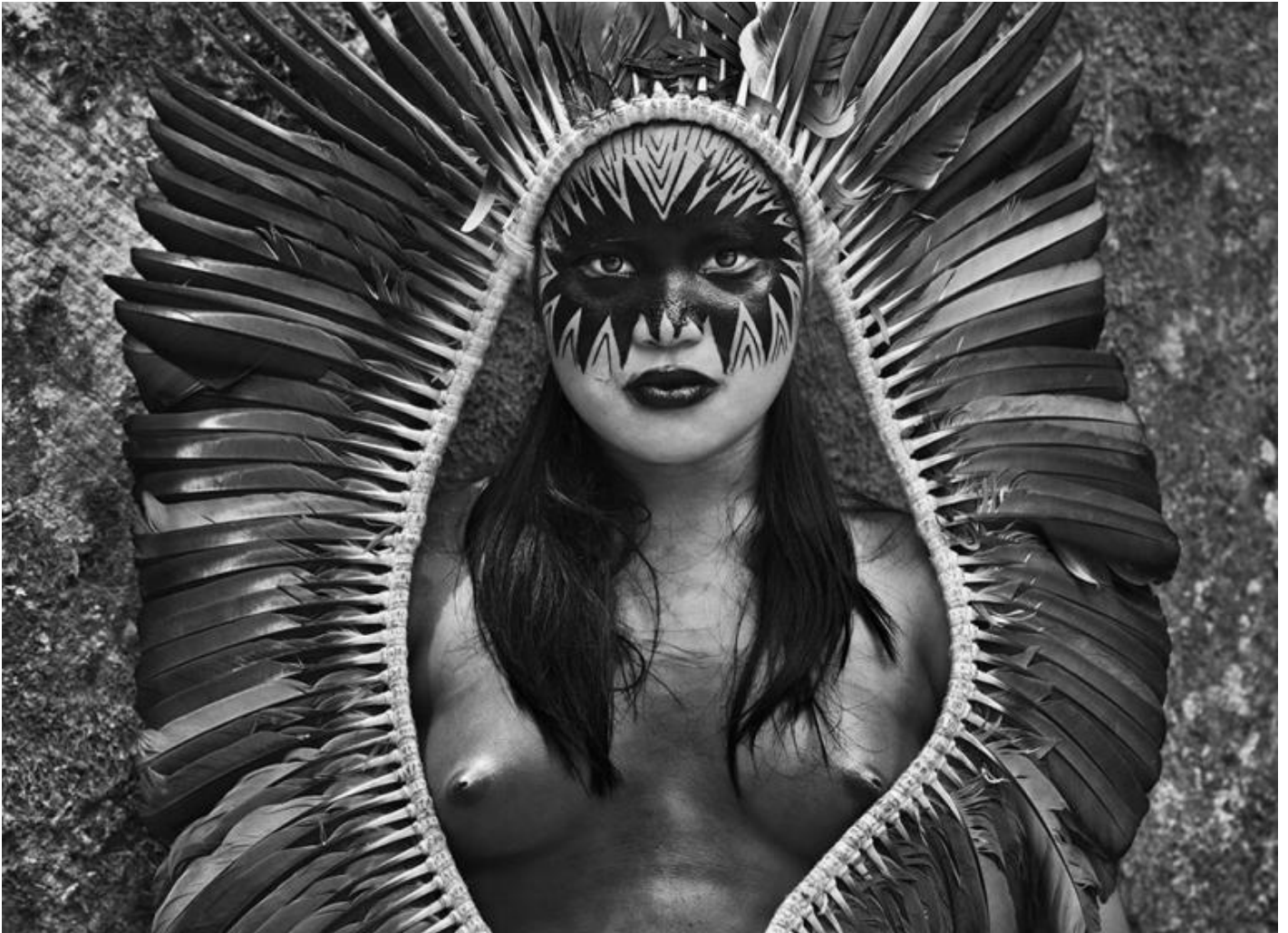
Indiana Yawanawá. Stato di Acre, Brasile, 2016 - © Sebastião Salgado/Contrasto.

Di solito a guidare l'occhio di chi guarda una fotografia sono proprio le zone chiare rispetto a quelle scure, e aiutano a capire l'orientamento di lettura. In questo caso, si ha un fluido movimento ascensionale verso l'orizzonte, prima, e la possanza delle nuvole, poi. Le fotografie di Salgado sono accomunabili da questo termine, "fluido", così come il suo stile di bianco e nero, mai troppo aggressivo.