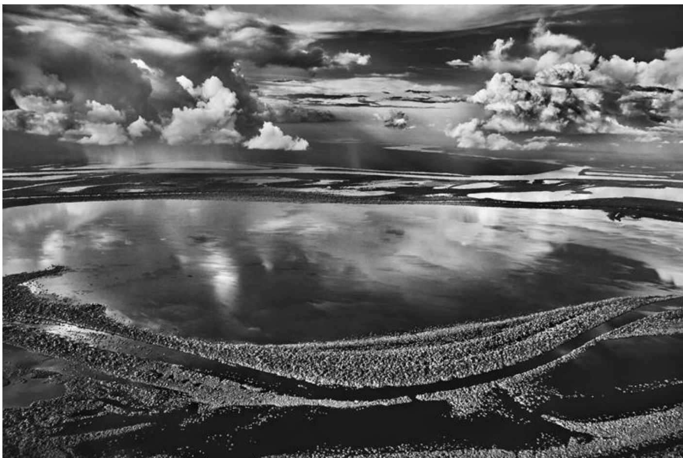
Anavilhanas, isole boscosi del Río Negro. Stato di Amazonas, Brasile, 2009 - © Sebastião Salgado/Contrasto.

Salgado è stato il primo a unire l’impegno sociale alla tecnica fotografica di paesaggio e reportage, dando soprattutto a quest’ultimo un valore estetico prima d’ora non ancora concessogli e mantenendo entrambi i generi in linea coi più grandi maestri del Novecento. Quella riportata sopra è una sua frase durante la conferenza stampa del 30 settembre al MAXXI di Roma, unica tappa italiana della mostra Amazônia , che conta più di 200 immagini raccolte in 48 spedizioni eseguite in quasi dieci anni.