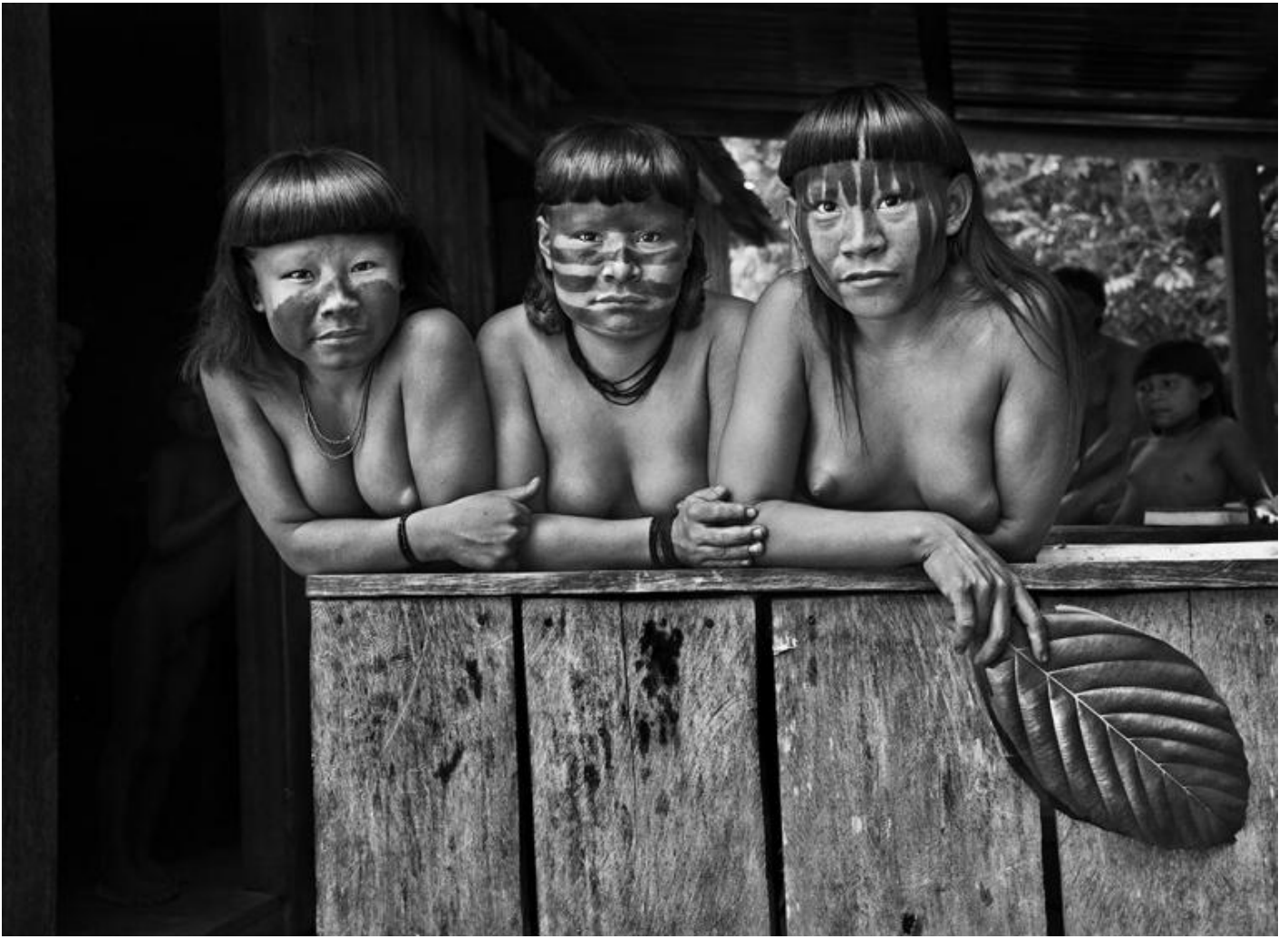
Giovani donne Suruwahá. Stato di Amazonas, Brasile, 2017 - © Sebastião Salgado/Contrasto.

Nelle fotografie di Salgado, per quanto sia preponderante il tema sociale e politico, non si può quindi prescindere da un discorso estetico, formale. Indubbiamente, guardando i suoi ritratti, così come i suoi paesaggi, sono ravvisabili i più grandi maestri, da Wynn Bullock a Irving Penn (i suoi ritratti a figura intera in studio a sfondo neutro per indagini etnografiche), da Minor White ad Ansel Adams (le sue rivoluzionarie immagini dello Yosemite), che hanno realizzato i capolavori cui ogni fotografo deve fare riferimento.