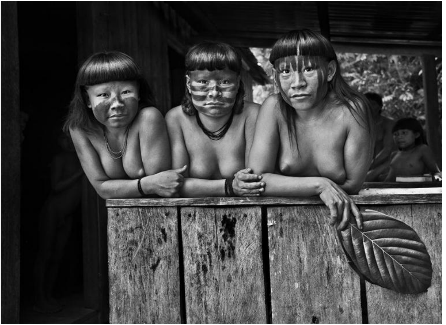
Giovani donne Suruwahá. Stato di Amazonas, Brasile, 2017

Nelle fotografie di Salgado, per quanto sia preponderante il tema sociale e politico, non si può quindi prescindere da un discorso estetico, formale. Indubbiamente, guardando i suoi ritratti, così come i suoi paesaggi, sono ravvisabili i più grandi maestri, da Wynn Bullock a Irving Penn (i suoi ritratti a figura intera in studio a sfondo neutro per indagini etnografiche), da Minor White ad Ansel Adams (le sue rivoluzionarie immagini dello Yosemite), che hanno realizzato i capolavori cui ogni fotografo deve fare riferimento.