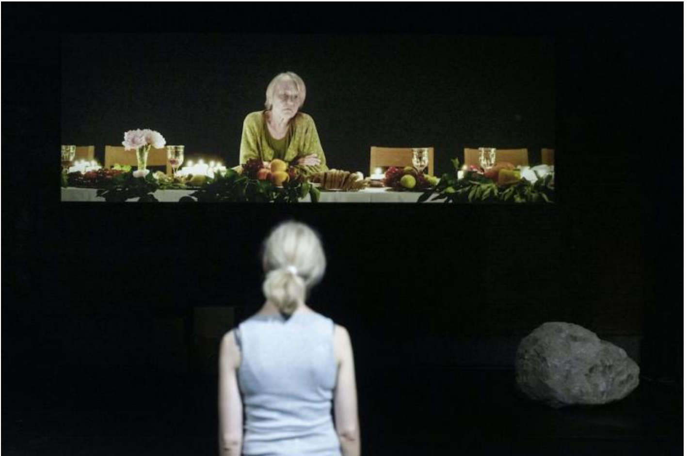
Milo Rau, EveryWoman, ph. Armin Smailovic.

Il codice comunicativo a cui è divenuto quasi necessario uniformarsi è schiettamente anti-teatrale: i materiali vengono letti o riprodotti senza interpretazione, quasi si desiderasse epurare il campo da ogni ombra di mediazione finzionale. La scelta dei costumi e degli oggetti di scena segue di conseguenza: immancabili le t-shirt, le felpe, i jeans, le scarpe da tennis, le bottiglie e i bicchieri d'acqua, i fogli, i faldoni, i tavoli di lavoro – qualsiasi cosa possa toglierci dalla testa l'impressione di avere davanti un travestimento o un apparato rappresentativo.