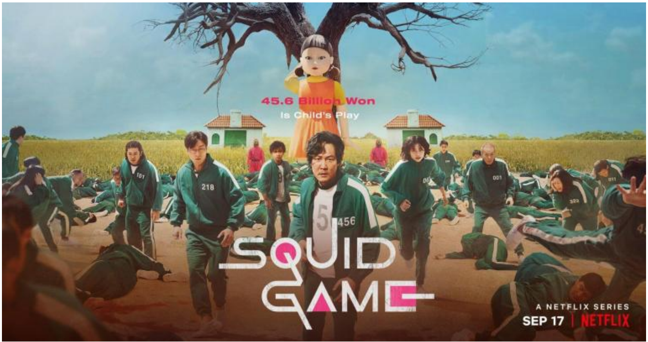
Immagine promozionale di Squid Game con il primo gioco "Un, due, tre, stella".