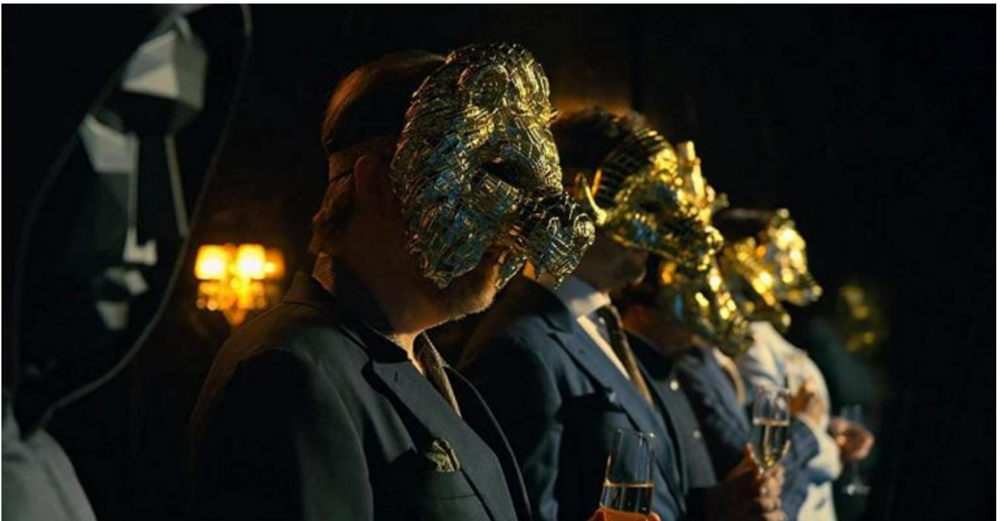
Da sinistra Frontman e VIP in Squid Game.

Chi assiste allo Squid Game? pubblico e VIP ricchi epuloni "occidentali", ovvero il nostro simulacro? non solo gioca a sua volta scommettendo sul vincitore, ma competono nel "gioco della facoltà di giudicare". La presenza di scene cruente alternate alla narrazione di delicate questioni di importanza socioculturale come il traffico di organi o il dover rifiutare le cure perché non ci si può permettere il conto dell'ospedale, rende "moralmente efficace" Squid Game perché coinvolge mente e cuore. Alla fine, ci si sente in dovere di giudicare le azioni dei giocatori per "disfarsi" dell'ansia che incombe, provocata dalla consapevolezza del lato oscuro della natura umana. Cosa saremmo disposti a fare per vincere 33 milioni di euro, cioè il montepremi di Squid Game? Che valore hanno la dignità e la vita umana?