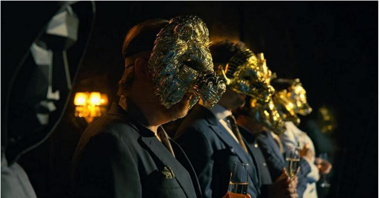
Da sinistra Frontman e VIP in Squid Game.

oscuro della natura umana. Cosa saremmo disposti a fare per vincere 33 milioni di euro, cioè il montepremi di Squid Game? Che valore hanno la dignità e la vita umana?