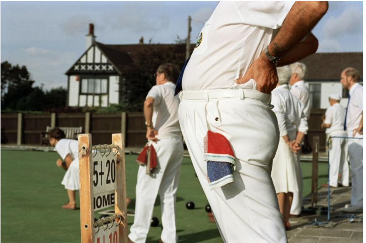
Martin Parr, Bristol England, 1995-99.

Cresciuto alla periferia del Surrey, da famiglia della classe media britannica, Parr è stato un collezionista fin dall'infanzia. Dagli 8 ai 12 anni aveva allestito un museo di storia naturale in cantina. Collezionava palline di uccelli rigurgitate dai rapaci. Oggi invece colleziona libri fotografici. Dopo che la sua collezione principale di libri fotografici è andata alla Tate, ha ricomprato tutti i titoli che aveva raccolto precedentemente. Secondo l'artista britannico anche la fotografia è un atto di collezionismo. Il retaggio collezionistico ha portato Parr a considerare anche le immagini come souvenir.