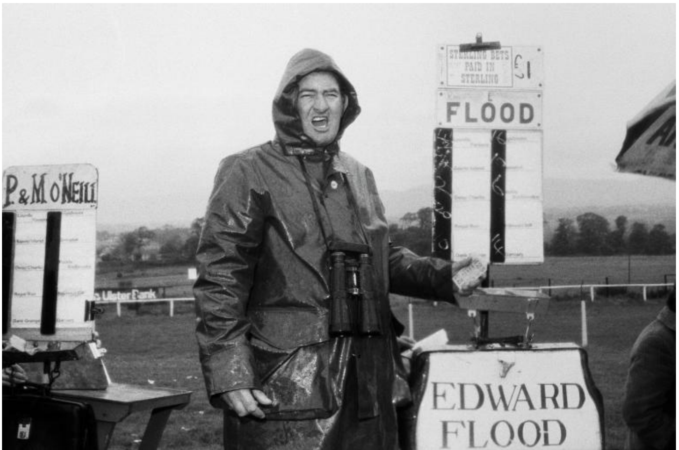
Martin Parr, Sligo races, Ireland, 1981.

Ho sempre sostenuto che definiamo chi siamo da ciò che facciamo nel nostro tempo libero. Il mio grande progetto di vita è il tempo libero del mondo occidentale, e il tennis e lo sport si aggiungono a questo.