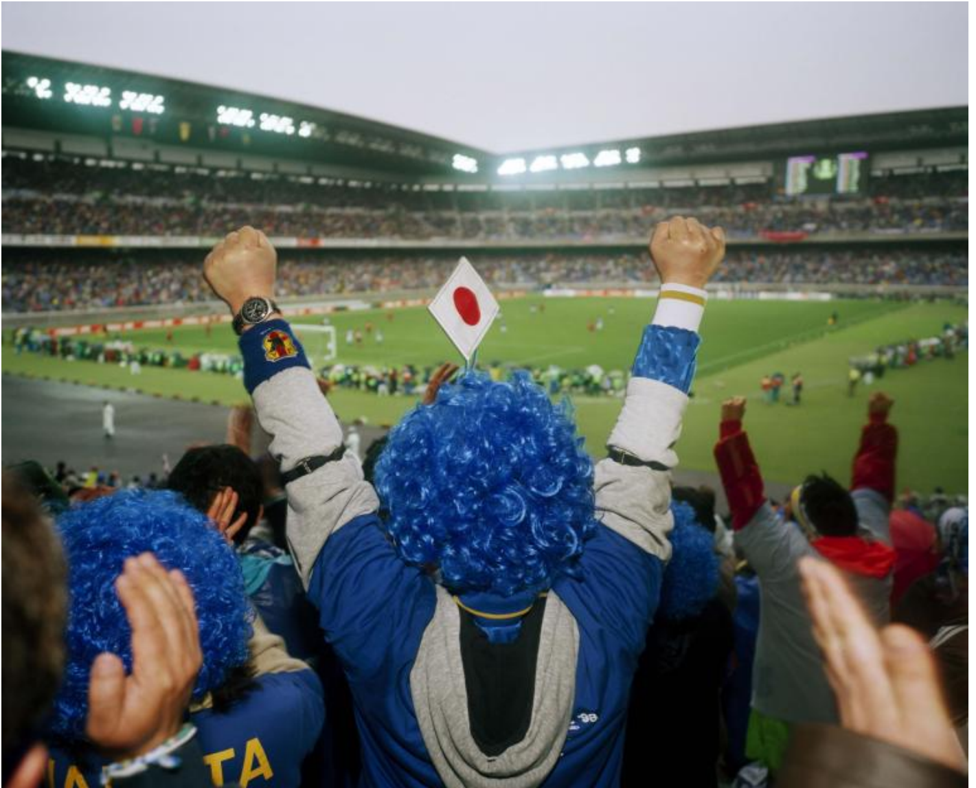
Martin Parr, Japan versus South Korea dynasty cup, Yokohama Stadium, Japan, 1998.

questioni universali. In occasione della mostra presso CAMERA –Centro Italiano per la Fotografia, abbiamo chiesto all'autore britannico di parlarci di alcuni temi e delle immagini che sono diventate icone del nostro tempo.