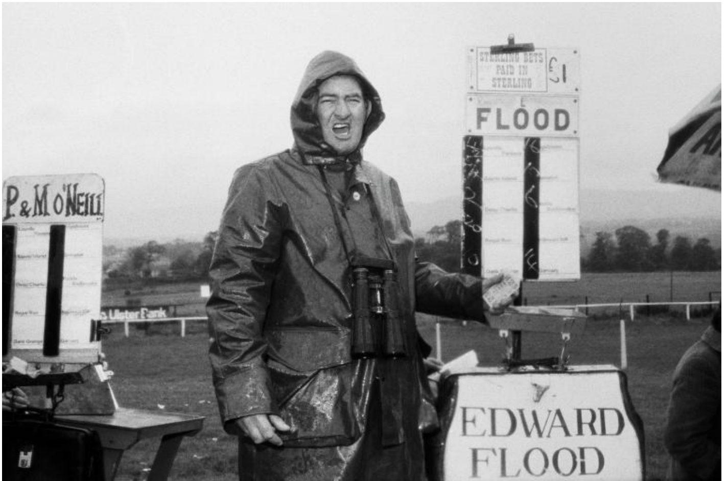
Martin Parr, Sligo races, Ireland, 1981.

Ho sempre sostenuto che definiamo chi siamo da ciò che facciamo nel nostro tempo libero. Il mio grande progetto di vita è il tempo libero del mondo occidentale, e il tennis e lo sport si aggiungono a questo.