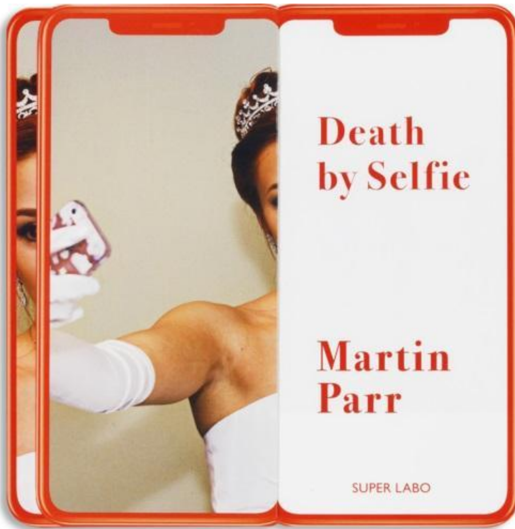
Martin Parr, Death by selfie super labo, 2019.

Eppure vuole comprendere la contraddizione che sta tra la mitizzazione di alcune porzioni del mondo e la realtà. Sente una responsabilità documentaria e combatte la propaganda, da cui siamo circondati, costantemente, su tutti i fronti, che si tratti di cibo, moda, viaggi, vita familiare o altro. L'idea delle riviste di viaggio è quella di vendere vacanze, quindi in esse tutto è bello e perfetto. Non mostreranno mai una scena in cui la gente viene assalita o dove un luogo pittoresco è preso d'assalto dalla massa, perché vogliono vendere sogni. Così pure fanno molte riviste e giornali asserviti ai poteri. Il suo lavoro è quello di mostrare il mondo come lo trova mentre gira per le strade, che ovviamente è molto diverso da quello della propaganda. Fa fotografie serie mascherate da intrattenimento.