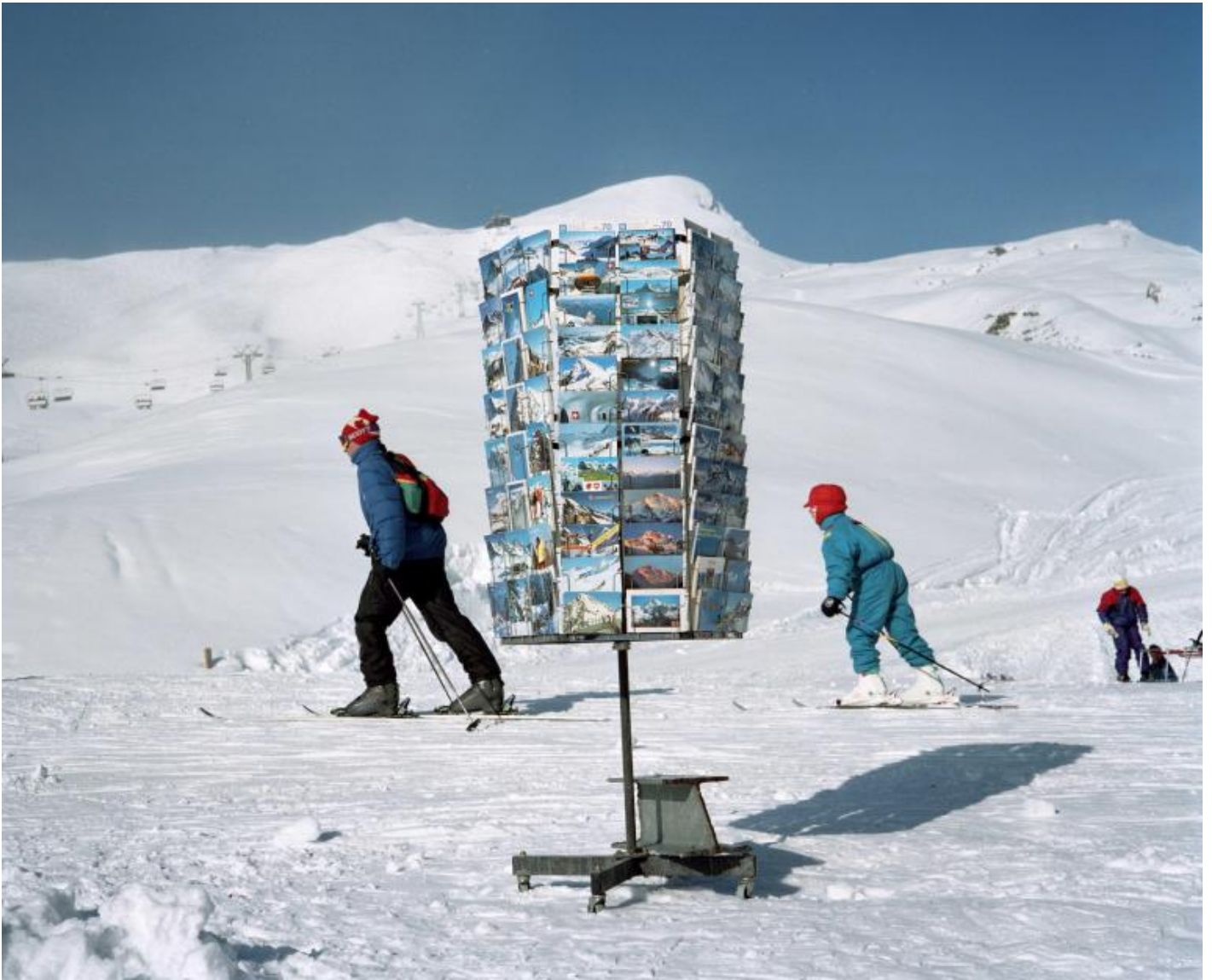
Martin Parr, Kleine Scheidegg, Switzerland, 1994.

Quanto è importante l'uso del flash anulare nel catturare un aspetto della tua ricerca?