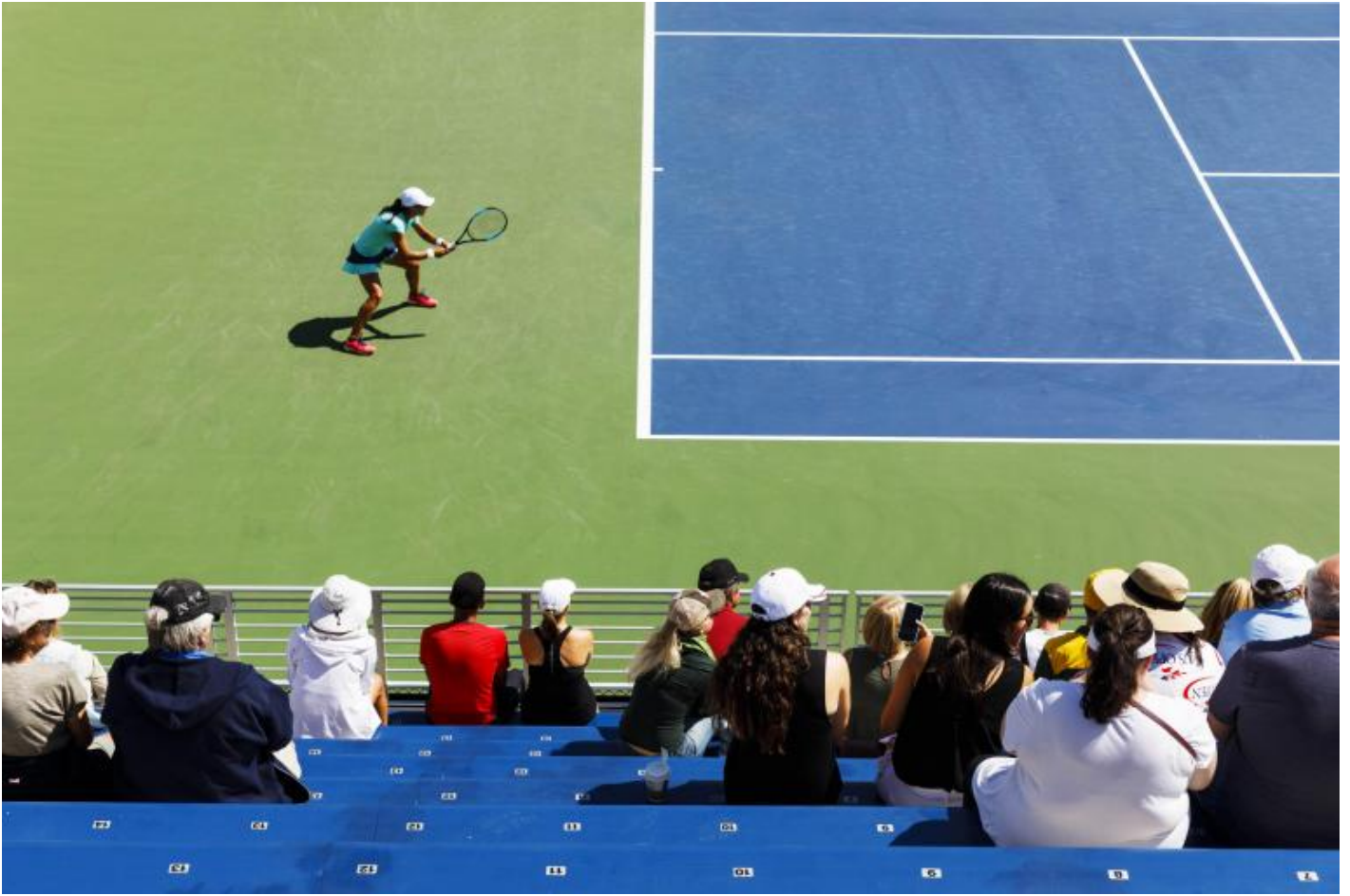
Martin Parr, Us open, New York, USA, 2017.

Stampo sempre la short list di circa 200 immagini su carta da 20/30 e poi la passo attentamente in rassegna e finisco con un'altra short list di poco più di 100 immagini. Da quel momento in poi, lavoro con l'editore, cercando di capire quali immagini vanno insieme e la loro sequenza, fino ad arrivare a circa 80 immagini.