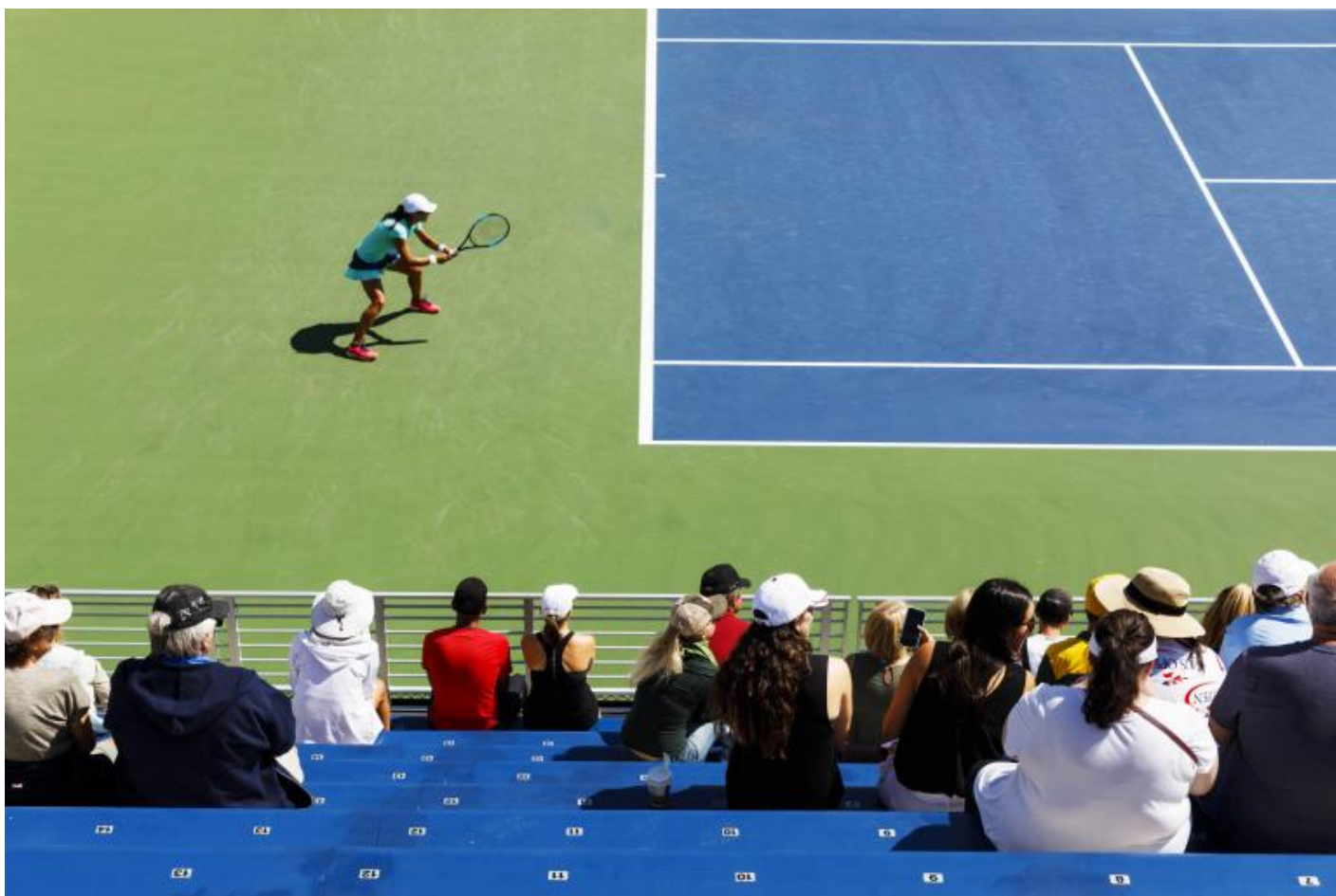
Martin Parr, Us open, New York, USA, 2017.

Stampo sempre la short list di circa 200 immagini su carta da 20/30 e poi la passo attentamente in rassegna e finisco con un'altra short list di poco più di 100 immagini. Da quel momento in poi, lavoro con l'editore, cercando di capire quali immagini vanno insieme e la loro sequenza, fino ad arrivare a circa 80 immagini.