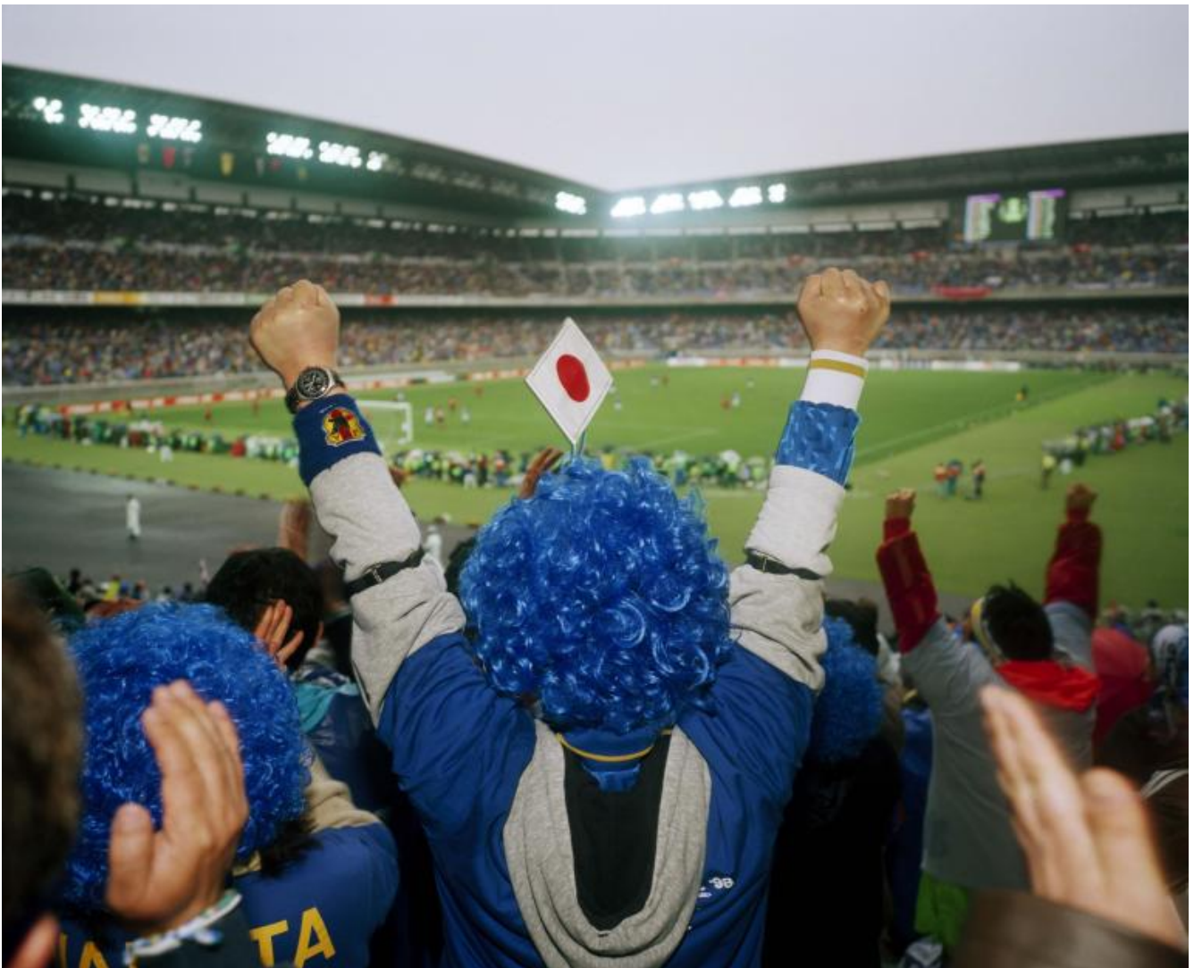
Martin Parr, Japan versus South Korea dynasty cup, Yokohama Stadium, Japan, 1998.

Le sue fotografie sono abbastanza stravaganti, con colori brillanti, che però stanno bene anche sulle pagine dei rotocalchi. Al contempo ci sono altre cose che accadono se si sceglie di guardare con occhi più attenti: dentro le fotografie apparentemente divertenti c'è un messaggio più serio, se si vuole scavare e trovarlo. Parr ci conduce dentro l'apparente superficialità banale del quotidiano, dentro una società sempre più consumista e globalizzata, là dove cerca di evidenziare con divertita ironia qualcosa che appartiene alla dimensione delle questioni universali. In occasione della mostra presso CAMERA -Centro Italiano per la Fotografia, abbiamo chiesto all'autore britannico di parlarci di alcuni temi e delle immagini che sono diventate icone del nostro tempo.