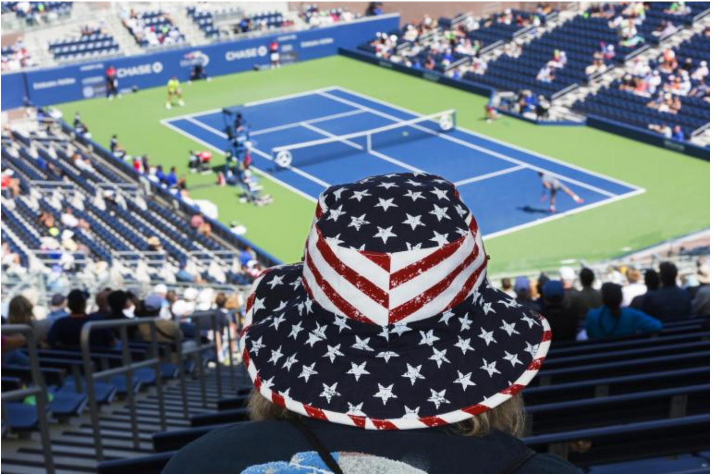
Martin Parr, Us open, New York, USA, 2017.

Come riesci a non lasciare che i tuoi critici ti chiudano in una categoria, in una definizione o in una ricerca unidirezionale? Come cerchi di uscire da ogni categorizzazione del tuo stile?