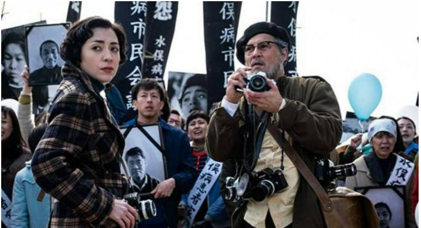
Johnny Depp nei panni di Eugene Smith in MINAMATA (2020).

A eccezione di MINAMATA di Andrew Levitas, incentrato sul clamoroso caso di minamata-byo , la terribile malattia causata dagli scarichi industriali contenenti mercurio sversati nel mare di fronte a Minamata, nel Kyushu, una vicenda portata alla luce nel 1971 dal fotoreporter americano Eugene Smith qui interpretato magnificamente da Johnny Depp, gli altri film raccontano vicende molto private e intime, frammenti di vita di cui né la politica né i media, né tantomeno gli storici si sarebbero mai occupati. Sono, per così dire, le "pagine mancanti della Storia", come ha scritto una volta un filosofo giapponese. Sono dei labirinti all'interno di un "libro difettoso", interstizi sfuggiti perfino alla vista degli storici. Ma questi buchi neri dimenticati sono i luoghi dove si verifica la genesi della Storia ancora in gestazione.