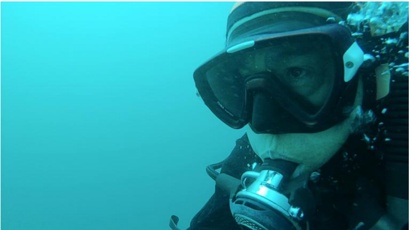
Una scena da KOI (2019).

Il primo racconta quanto le ferite della catastrofe continuano a dolere attraverso le esperienze di tre persone: un marito che impara l'immersione subacquea per stare vicino alla moglie inghiottita dallo tsunami e mai ritrovata; un moto rider tatuato e i suoi amici che ancora oggi partono da Tokyo per fare volontariato nelle zone colpite per restituire qualche indizio di memoria alla gente sopravvissuta; e un abitante della regione pesantemente colpita dallo tsunami che cerca di preservare la memoria della loro comunità.