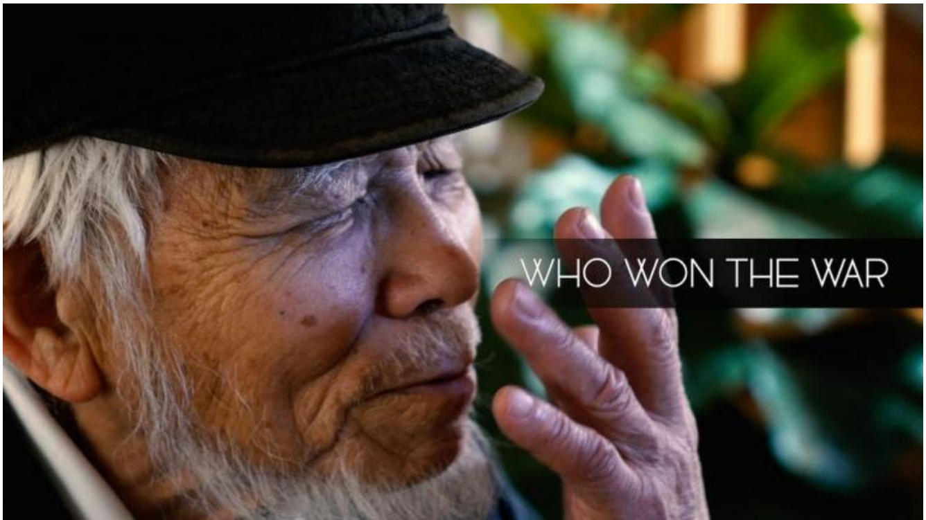
WHO WON THE WAR (2020).