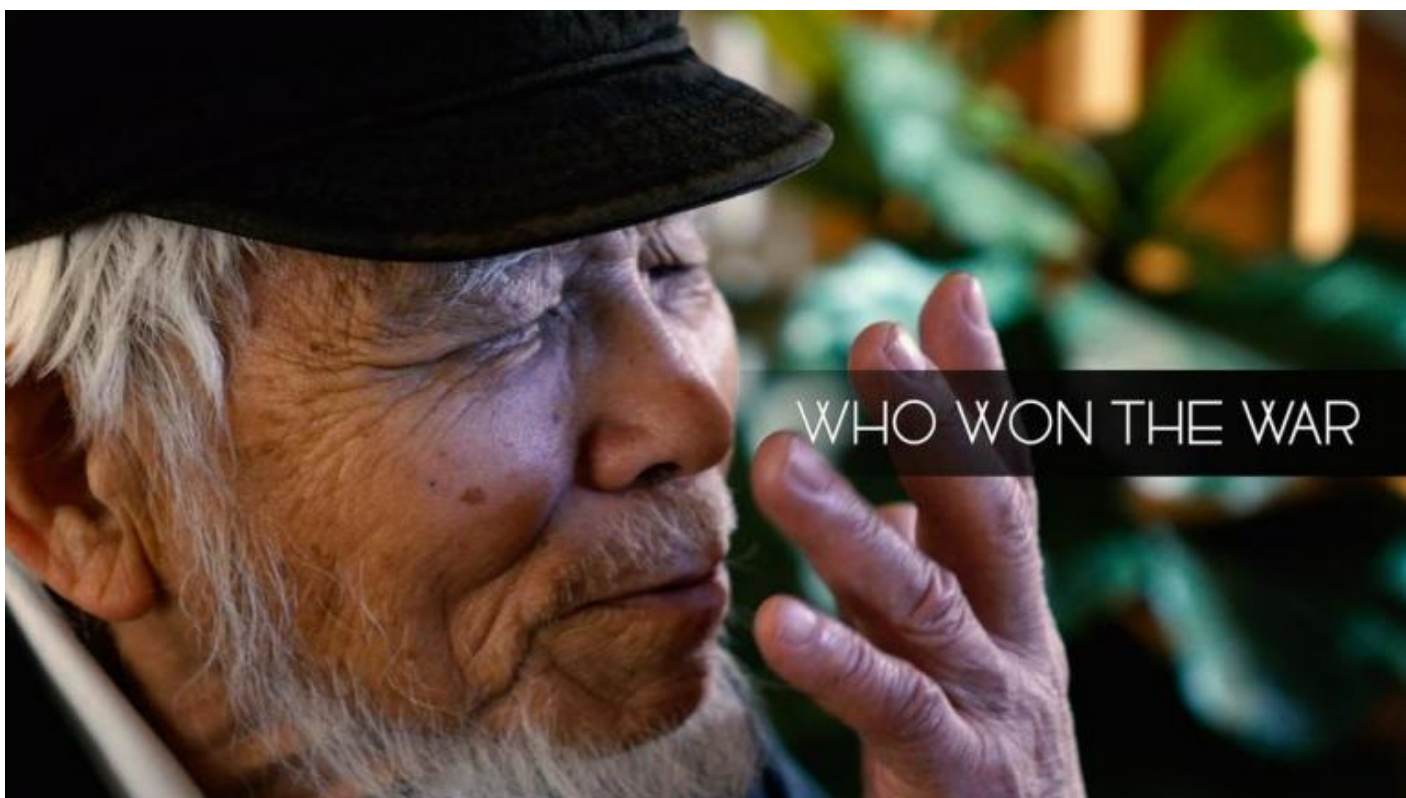
WHO WON THE WAR (2020).