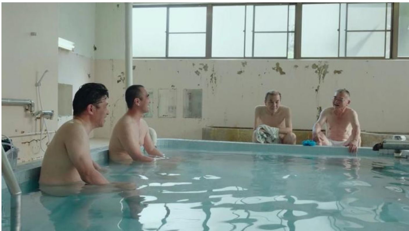
Una scena da DREAMING OF AN ISLAND (2021).

L'altro film raffigura invece Aogashima, una piccola isola di una bellezza mozzafiato con un vulcano quiescente, in mezzo all'Oceano Pacifico, a circa 400 km a sud di Tokyo. Ha una popolazione di 169 persone che vivono, però, con una visione e un modo di vivere molto diverso da quello degli abitanti di Ikeshima. Lontano dal consumismo, gli isolani conducono una vita molto slow , adattandosi con resilienza anche alla durezza della natura, e vivono con grande piacere la compagnia di altre persone. Il tutto con lo spirito di autosufficienza che deriva dalle risorse limitate dell'isola. Sarà improbabile che la maggior parte dei giapponesi adottati, almeno in un prossimo futuro, questo stile di vita, ma è sicuramente un modo felice e armonico di vivere nel mondo.