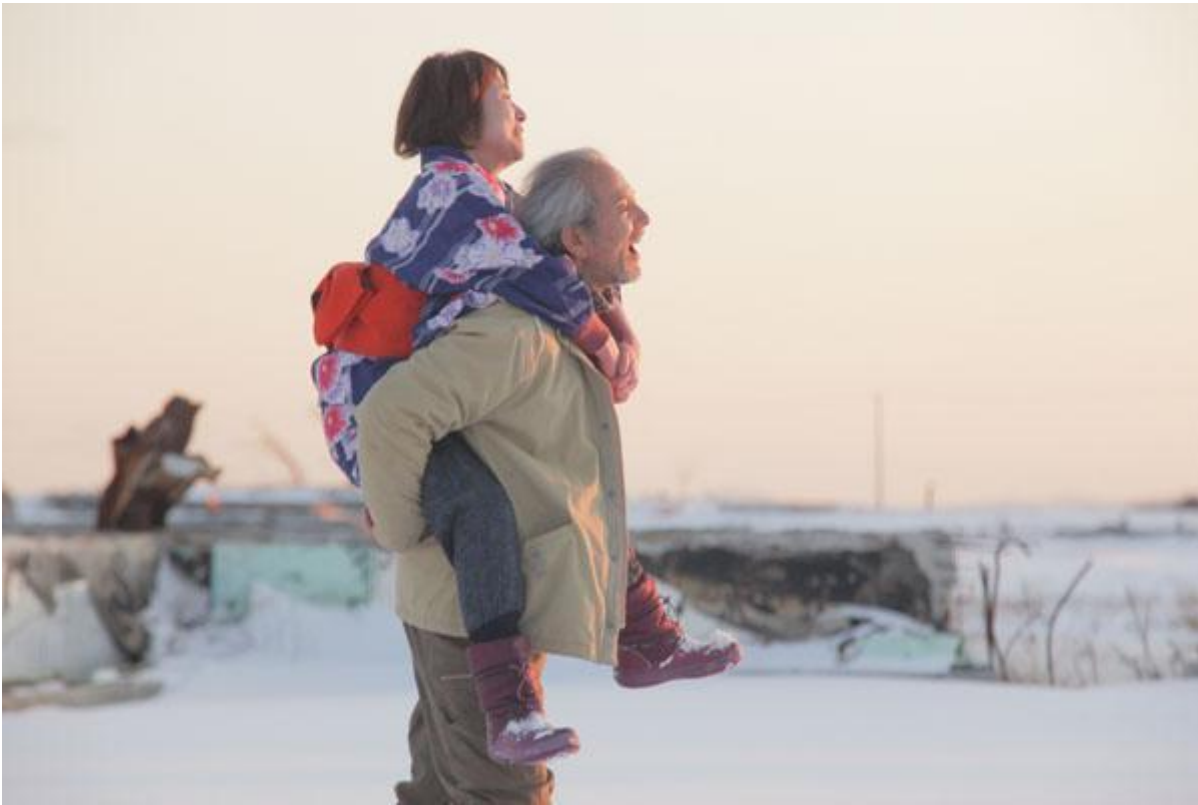
Una scena da THE LAND OF HOPE (2012).