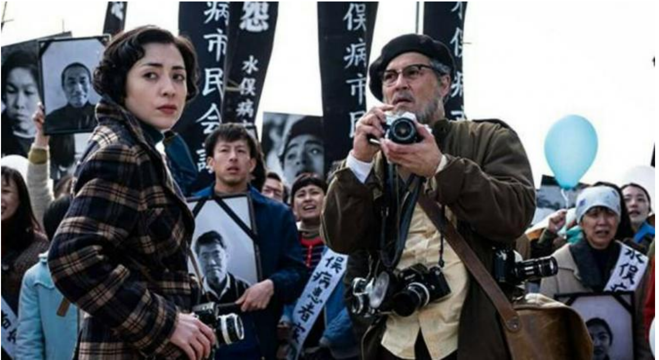
Johnny Depp nei panni di Eugene Smith in MINAMATA (2020).

Inoltre queste “pagine” non sono mancate per caso, spesso è lo Stato che le ha fatte “mancare” in un certo senso deliberatamente, relegando così le vittime sistematicamente all’oblio. Ognuno di questi film raccoglie una vita dimenticata, di qualche vittima o di qualche superstite, e la osserva da vicino, cerca di capire la vicenda con l’intento di onorarne la memoria con grande calore umano. È una specie di requiem visivo. Uno sguardo verso le memorie, verso la propria storia, che avevamo perso nella modernità per la fretta di andare sempre avanti, lo sguardo che oggi tutti i giapponesi dovrebbero recuperare. Questi film ci possono aiutare molto a riflettere e a scoprire gli strati invisibili che scorrono sotto la nostra Storia più recente.