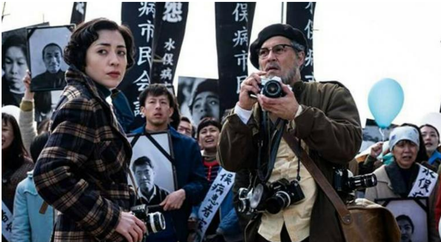
Johnny Depp nei panni di Eugene Smith in MINAMATA (2020).

A eccezione di MINAMATA di Andrew Levitas, incentrato sul clamoroso caso di minamata-byo , la terribile malattia causata dagli scarichi industriali contenenti mercurio sversati nel mare di fronte a Minamata, nel Kyushu, una vicenda portata alla luce nel 1971 dal fotoreporter americano Eugene Smith qui interpretato magnificamente da Johnny Depp, gli altri film raccontano vicende molto private e intime, frammenti di vita di cui né la politica né i media, né tantomeno gli storici si sarebbero mai occupati. Sono, per così dire, le "pagine mancanti della Storia", come ha scritto una volta un filosofo giapponese. Sono dei labirinti all'interno di un "libro difettoso", interstizi sfuggiti perfino alla vista degli storici. Ma questi buchi neri dimenticati sono i luoghi dove si verifica la genesi della Storia ancora in gestazione.