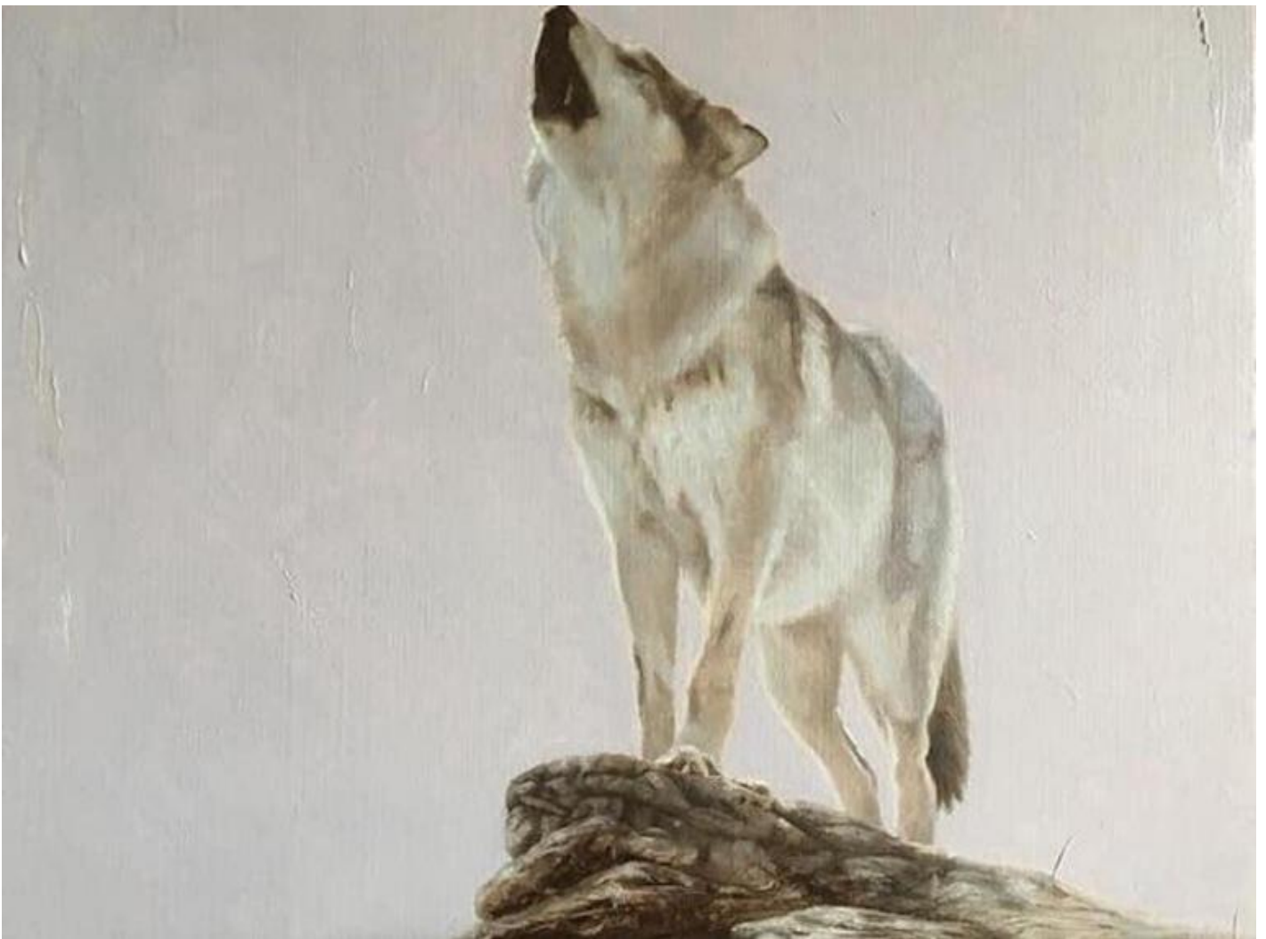
Marco Bettio, Ciò che non siamo ci identifica e ci svela, 2017, Olio su lino, 30x40cm.

L'elemento decisivo di questa teoria "è la ri-creazione del cane come figura dipendente: tramutato in servitore o parassita, il cane è una creatura maledetta perché ha perverso la propria natura". Teoria perlomeno riduttiva (anche se è servita spesso a giustificare molti abusi umani sui cani), poiché sottovaluta che "abitare un mondo plasmato dagli uomini richiede creatività, intelligenza e generosità anche da parte dei cani", per molti aspetti indubbiamente dipendenti dagli uomini per il nutrimento o come animali domestici o da lavoro. Senza dimenticare che "il vantaggio della convivenza è reciproco", data "l'estrema disponibilità dei cani" a mettersi al nostro servizio in mille modi, a partire dal ruolo storico di " agenti di contenimento o di conversione del cibo", chiamati a consumare quanto prodotto "in eccesso durante i mesi di abbondanza" e diventando "essi stessi cibo in quello di penuria" (i cani sono stati e sono mangiati da culture diffuse in ogni punto del pianeta anche se – o di conseguenza – la "cinofagia" è stata usata come strumento di discriminazione).