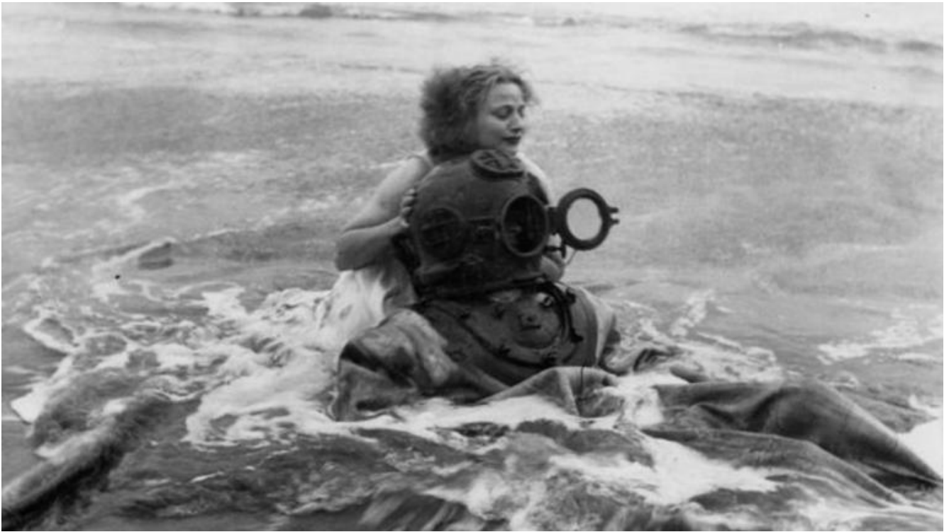
"The Lead Shoes" (1949) di Sidney Peterson.

Un tributo elettrizzante, che appassiona e sbalordisce al tempo stesso, lontanissimo da ogni retorica celebrativa o commemorativa. Al contrario, permette di rileggere l'eredità di Vogel alla luce del presente, rivendicando l'importanza della selezione e della programmazione per chiunque si accinga a organizzare un festival, una rassegna o anche un semplice cineclub.