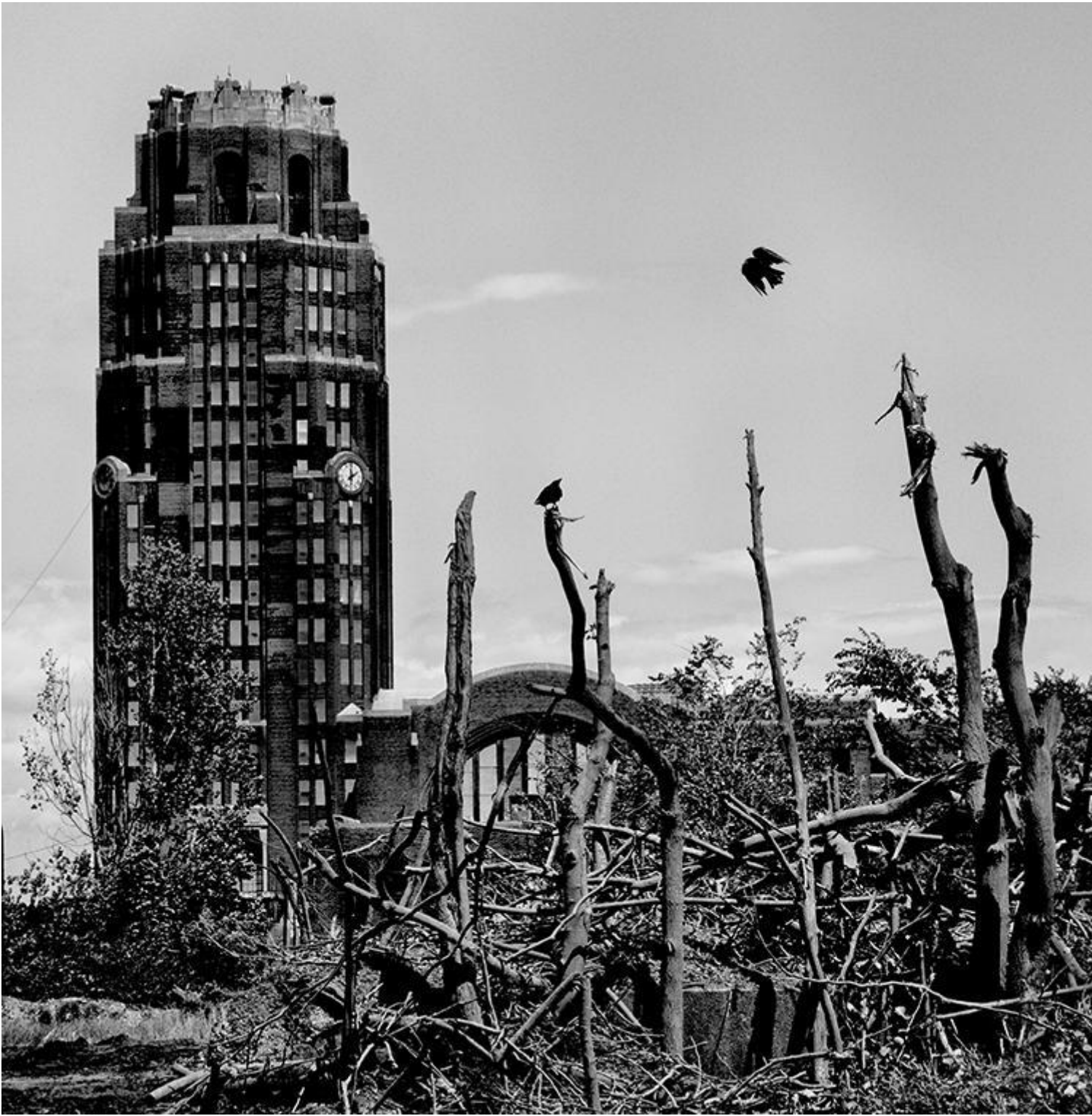
Buffalo, New York © 2021 Matt Black.

In una chiesa di Moorhead (Mississippi, settembre 2017) ascolta la predica di un pastore: “Vogliamo ricacciare tutti i clandestini. Ma Dio mio, siamo tutti clandestini. Siamo tutti incasinati, fuori di testa, non sappiamo nulla. L’America è troppo grande per essere distrutta dal di fuori, è dall’interno che verremo distrutti!” Un discorso davvero inquietante, ma in sintonia con i nostri telegiornali: dunque il mondo del nord, dall’Europa agli Stati Uniti, si sente invaso dai clandestini, che poi sarebbero quelli del sud. Ma il deserto è anche l’economia che insensibile alla voce delle borse qui nella periferia dell’impero sembra in caduta libera: un hotel visto un anno prima ora è chiuso, sbarrato con tavole da fallimento pesante. Il negozio