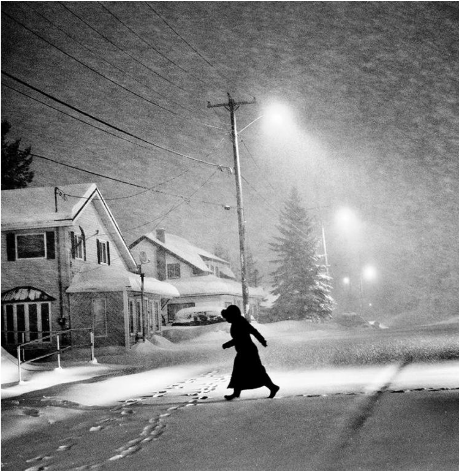
Madawaska, Maine © 2021 Matt Black.

La città ha assistito a 17 decessi per assideramento lo scorso anno, 130 volte la media nazionale, stando all'articolo." Ecco dove girovaga Matt Black, nelle periferie dell'Impero. Nel suo viaggio infinito, di anni, attraversa villaggi desolati dove capiti soltanto se smarrisci la strada. Usare il servizio pubblico dei pullman è terribile: gli autisti insultano i passeggeri. La stessa violenta ostilità nei miseri hotel incontrati nel viaggio: "non portare nessuno in camera altrimenti ti butto fuori."