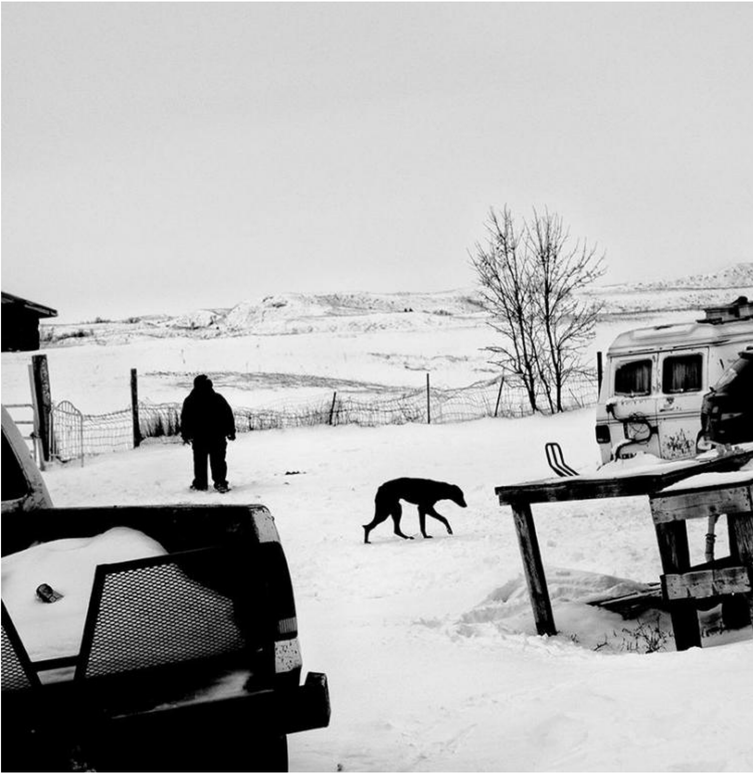
Eagle Butte, South Dakota

Hanno tenuto accesi i fornelli del cucinino tutta la notte, così dentro si sta caldi, ma non c'è acqua, perché i tubi sono congelati. Samantha è incinta, ha dovuto combattere con diverse infezioni allo stomaco. Le hanno prescritto antibiotici ma non può permetterseli. Non mangia da quattro giorni, non ha l'assicurazione sanitaria, (...) e ha speso i suoi ultimi nove dollari per farsi riaccompagnare a casa dall'ospedale." Ho citato per intero una pagina del diario di Black (Lovely, Kentucky, novembre 2019) per dare un saggio della parte scritta di questo libro. Pagine di diario, non didascalie.