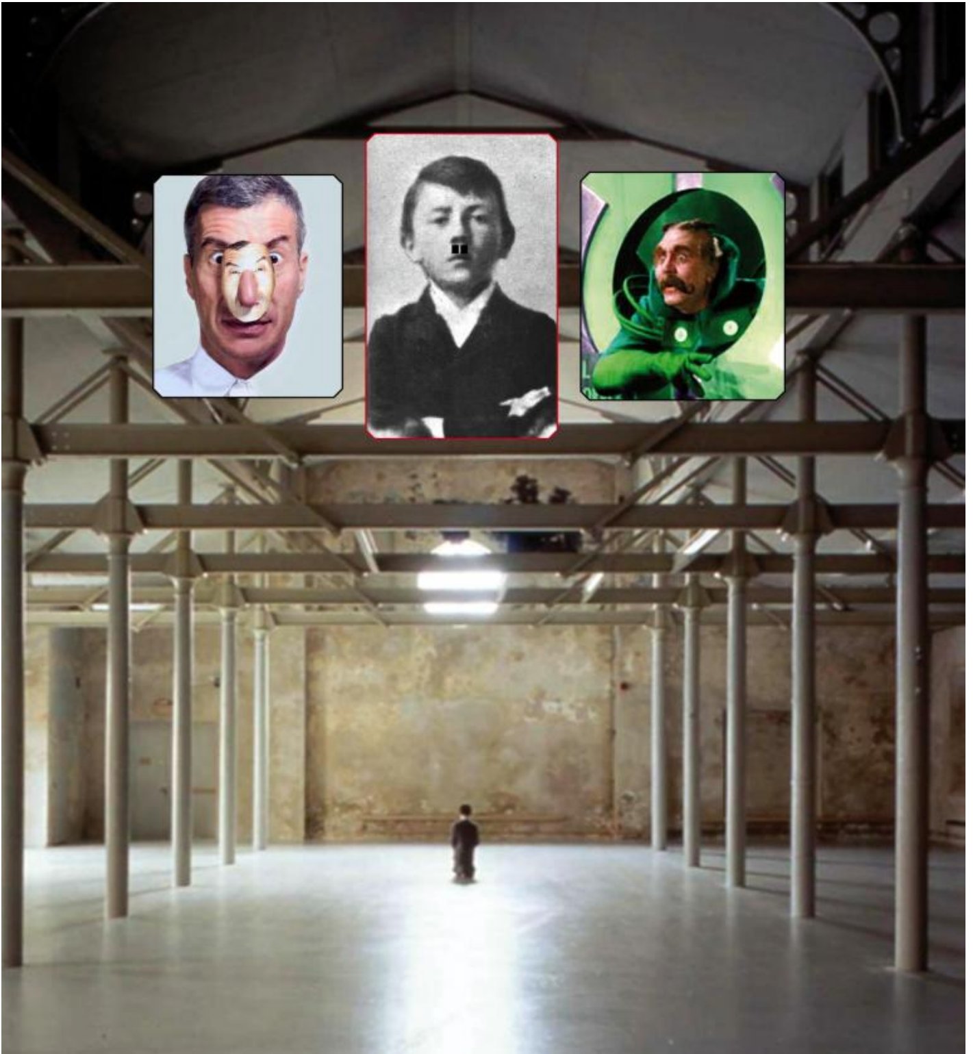
Him, Tavola dell'Atlante di Oz.