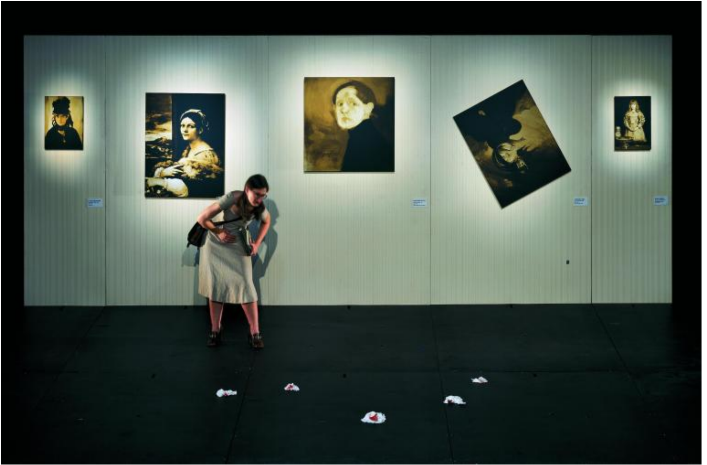
Kansas, ph Enrico Fedrigoli.

in questo modo, certo volerei via. ( Pausa )».