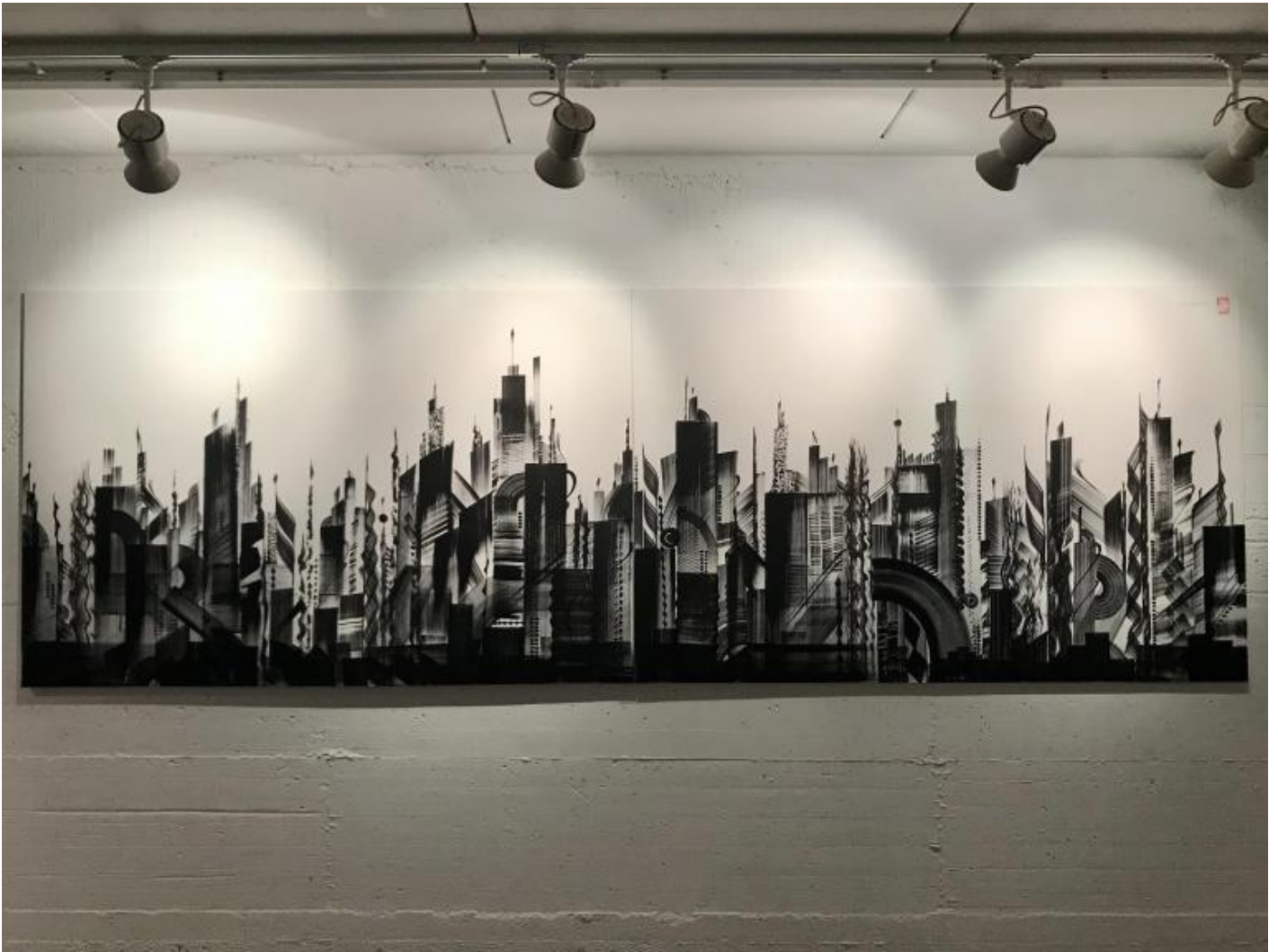
Luca Barcellona, Skyline , 2021.

Non ci sarebbe scrittura, in altre parole, senza la disciplina che organizza, riga per riga, le gocce di inchiostro in parole, e senza l'attività creatrice della mano – ed è forse in questa descrizione della scrittura come atto di produzione prima ancora che come risultato che risiede il fascino dell'indovinello veronese. Quel farsi della scrittura, il ductus , che “non è una forma, bensì un movimento e un ordine, insomma una temporalità”, dice in modo esatto Roland Barthes nelle sue Variazioni sulla scrittura . Quel farsi della scrittura che non è altro, appunto, se non il “momento di una manifattura”.