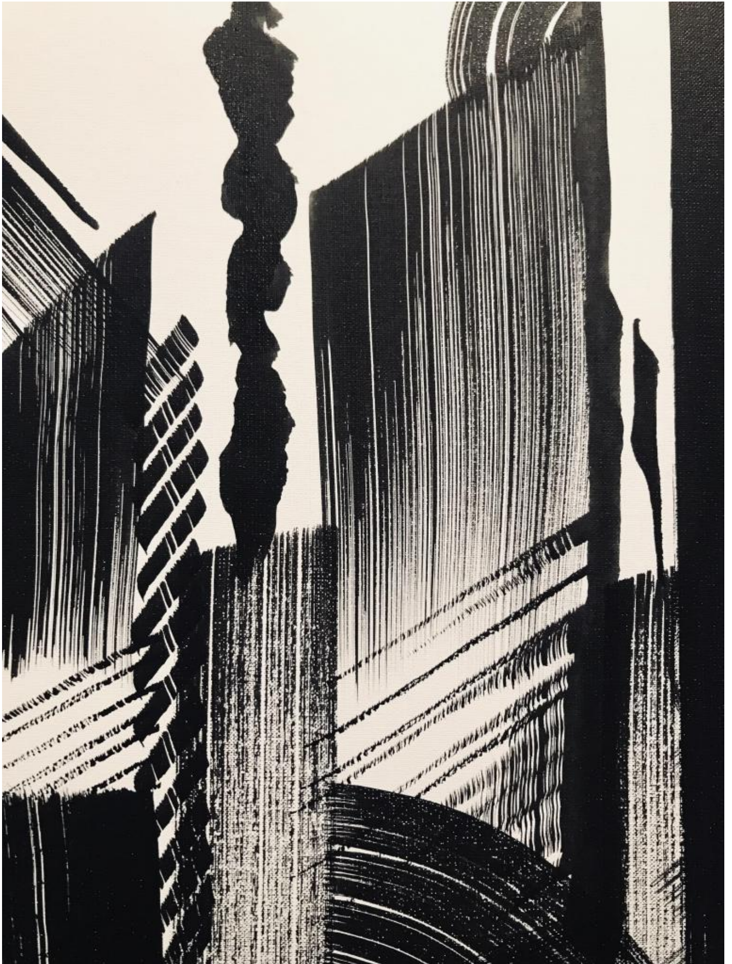
Luca Barcellona, Skyline, 2021, dettaglio.