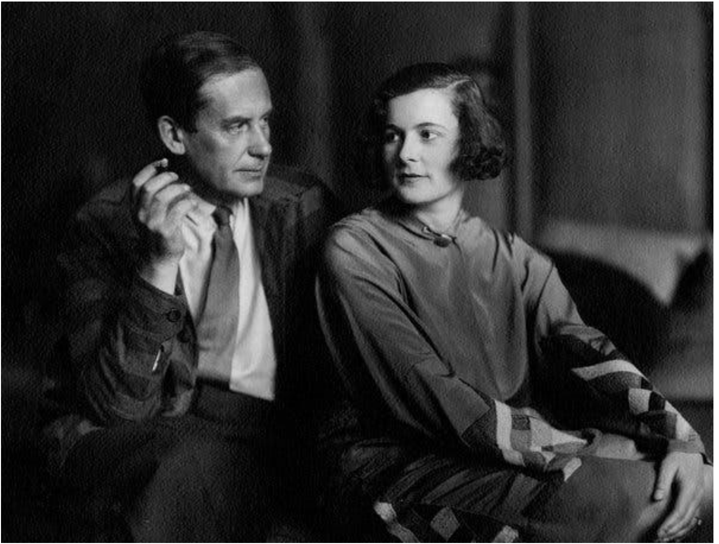
Walter e Ise Gropius il 16 ottobre 1923, poco dopo il loro matrimonio.

Il volume è anche denso di notizie e di aneddoti sulle loves tra docenti maschi e allieve (nessuna tra docenti femmine e allievi!) e di liaison , più o meno ufficiali, dei Maestri con le loro compagne.