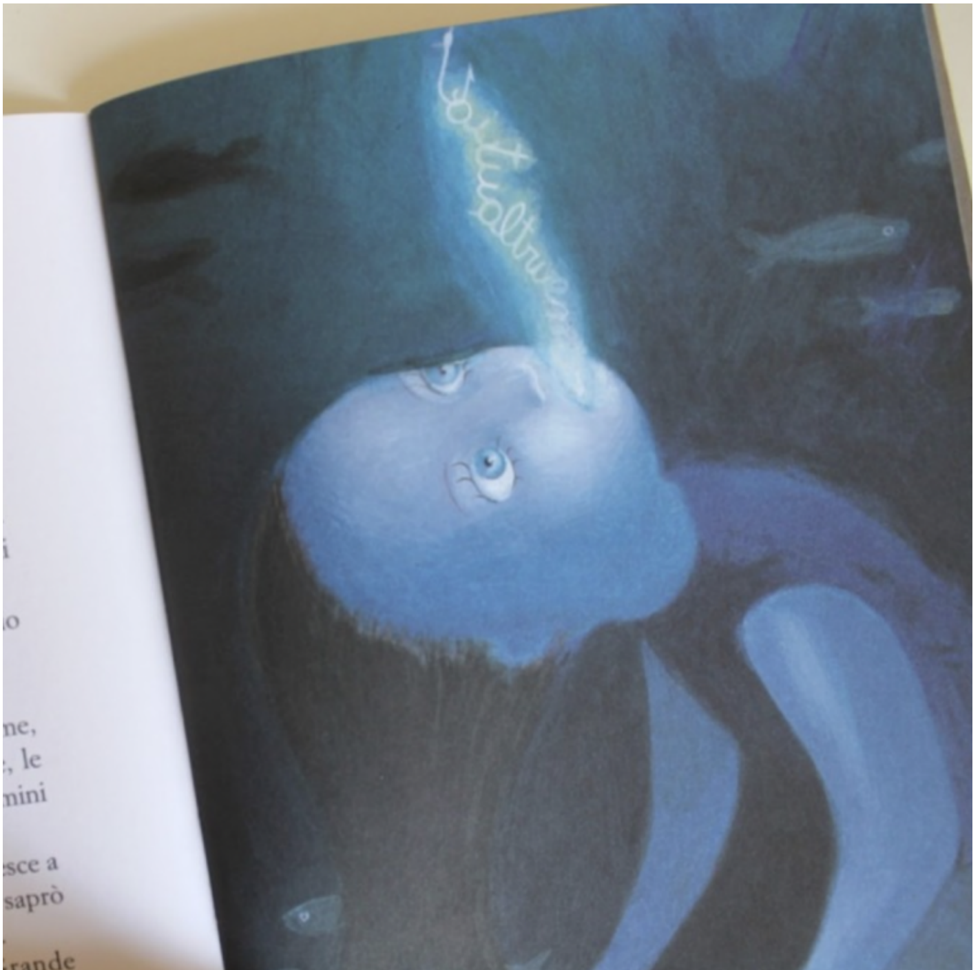
Disegno di Mara Cerri.