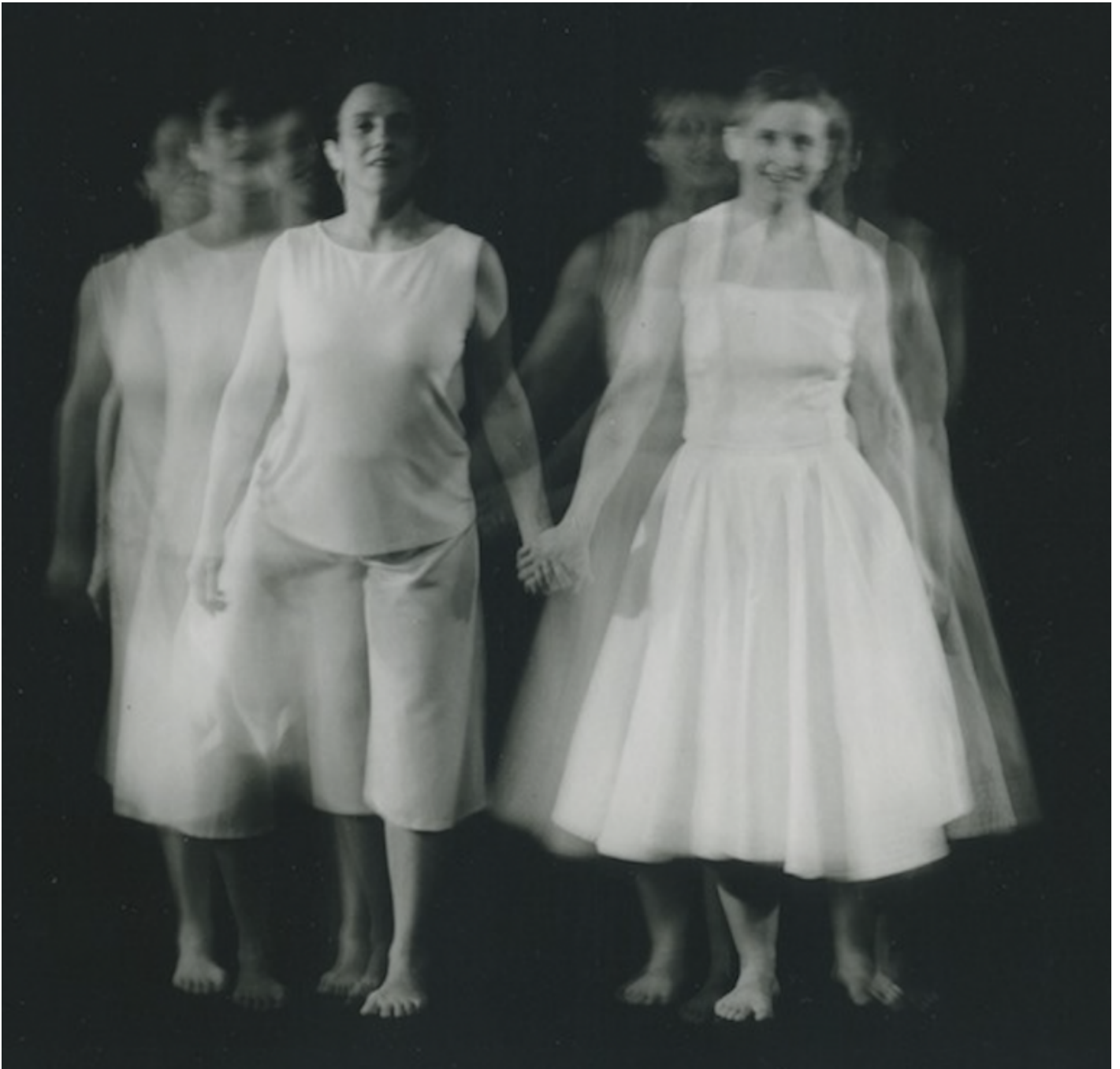
Storia di un'amicizia.