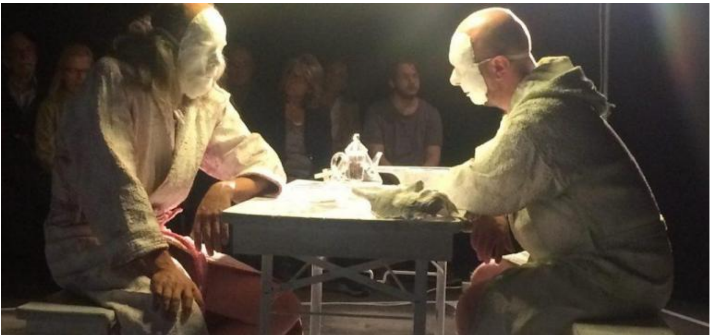
Un'immagine da Arkadia, regia di Werner Waas, ph. di P. Kees.

Ecco, ora è il 13 gennaio 2022 e ho appena letto sul giornale che sei morto pochi giorni fa. Ho ritirato fuori quel vecchio testo scritto in occasione della pubblicazione del tuo romanzo in Italia senza modificarlo granché. Voglio solo aggiungere che dopo quel 2011 ci sono state ancora molte altre lettere, e incontri, e anche un ultimo spettacolo da un tuo testo. La prima assoluta di Arkadia , l'ultimo tuo testo, nero, nerissimo, ma sempre intriso di quel tuo invincibile umorismo. L'ho realizzato in Germania in occasione del tuo ottantesimo compleanno. Ma tu eri già costretto a letto, non uscivi più di casa, accudito da tua figlia mentre guardavi alla TV i documentari sugli animali. La tua è stata un'uscita di scena lenta e silenziosa. Ma non sarò certo l'unico a ricordarti, per sempre.