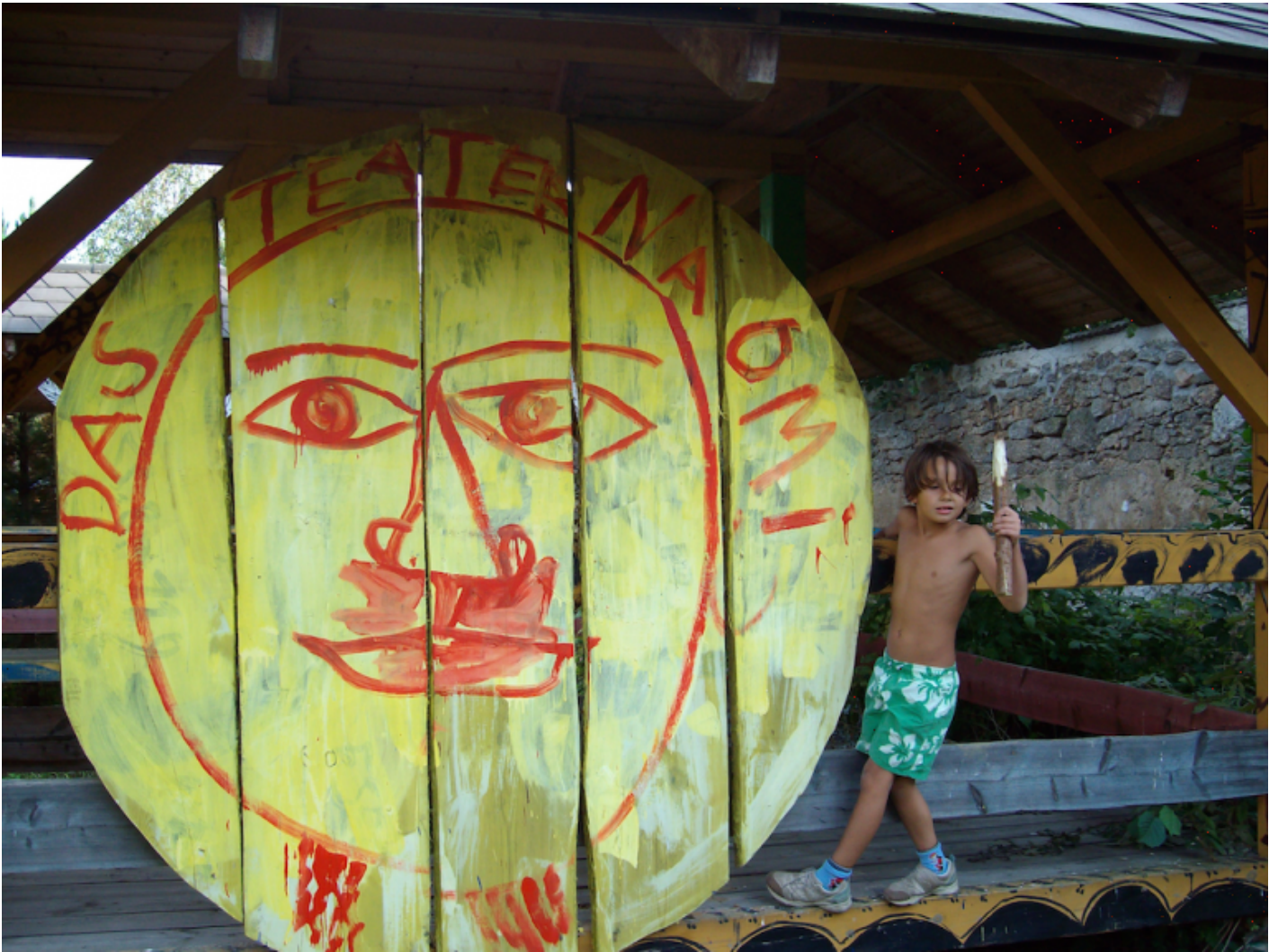
Il teatro della Casa Azzurra di Achternbusch nel Waldviertel in Austria.