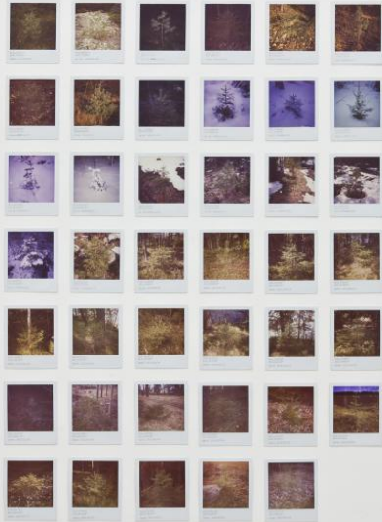
Meric Aljun Ringborg. Untitled (tree top project), 2009-ongoing. Polaroid photography.