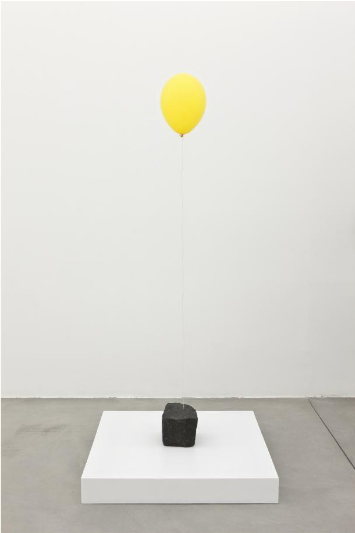
Christian Burnoski. Balloons: One Every Five Days, 2010. Helium, balloons, stone, twine, 90 x 90 x 185 cm.