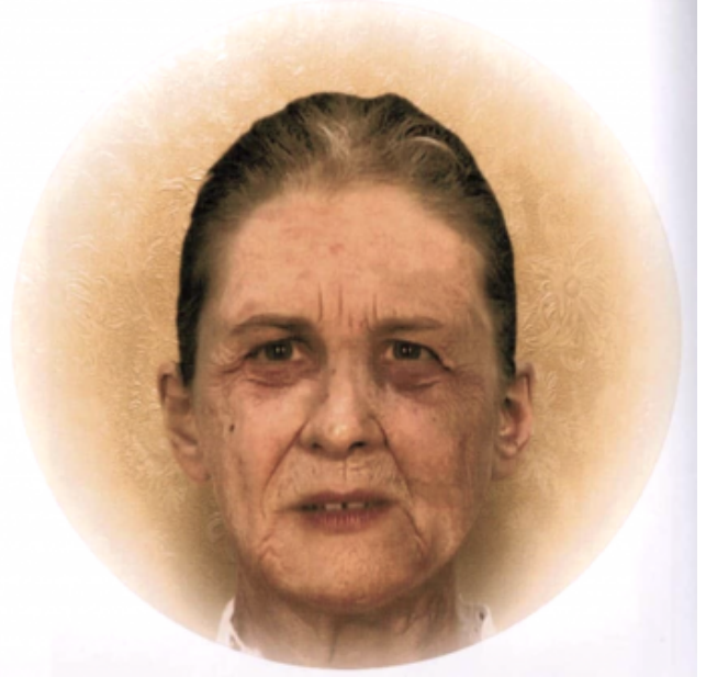
Van e Ada vecchi.

Alla fine della storia Ada e Van sono vecchissimi. Sta per finire la loro vita.