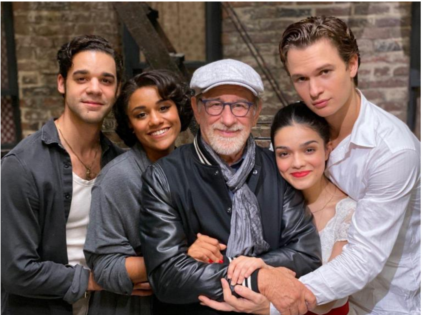
Da sinistra: David Alvarez, Ariana DeBose, Steven Spielberg, Rachel Zegler, Ansel Elgort.

Amatissimo da pubblico e critica, il film del 1961 appare come un prodotto moderno e attuale ancora oggi (la modernità non invecchia). Merito soprattutto di Robbins, mentre la regia di Wise cede qua e là invece agli impressionismi kitsch (l'incontro al ballo dalle tinte fané), stridenti con il carattere generale di un'opera che unisce approccio stilistico grafico e sguardo realista (le inquadrature di New York dall'alto, le riprese in esterno). La prova del tempo è meno clemente invece con il cast: Natalie Wood finta portoricana con accento russo e Richard Beymer finto polacco sfidano ogni sospensione dell'incredulità. Ne esce vincitrice solo Rita Moreno (premiata agli Oscar), rediviva anche nella versione di Spielberg: il regista le cuce addosso un ruolo che sembra una vera e propria dichiarazione d'amore artistica. Quella di Spielberg, insomma, è una sfida non da poco.