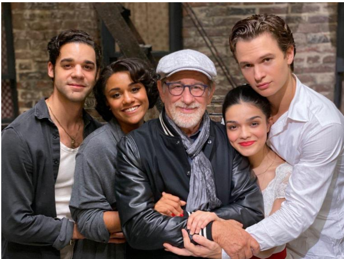
Da sinistra: David Alvarez, Ariana DeBose, Steven Spielberg, Rachel Zegler, Ansel Elgort.

Amatissimo da pubblico e critica, il film del 1961 appare come un prodotto moderno e attuale ancora oggi (la modernità non invecchia). Merito soprattutto di Robbins, mentre la regia di Wise cede qua e là invece agli impressionismi kitsch (l'incontro al ballo dalle tinte fané), stridenti con il carattere generale di un'opera che unisce approccio stilistico grafico e sguardo realista (le inquadrature di New York dall'alto, le riprese in esterno). La prova del tempo è meno clemente invece con il cast: Natalie Wood finta portoricana con accento russo e Richard Beymer finto polacco sfidano ogni sospensione dell'incredulità. Ne esce vincitrice solo Rita Moreno (premiata agli Oscar), rediviva anche nella versione di Spielberg: il regista le cuce addosso un ruolo che sembra una vera e propria dichiarazione d'amore artistica. Quella di Spielberg, insomma, è una sfida non da poco.